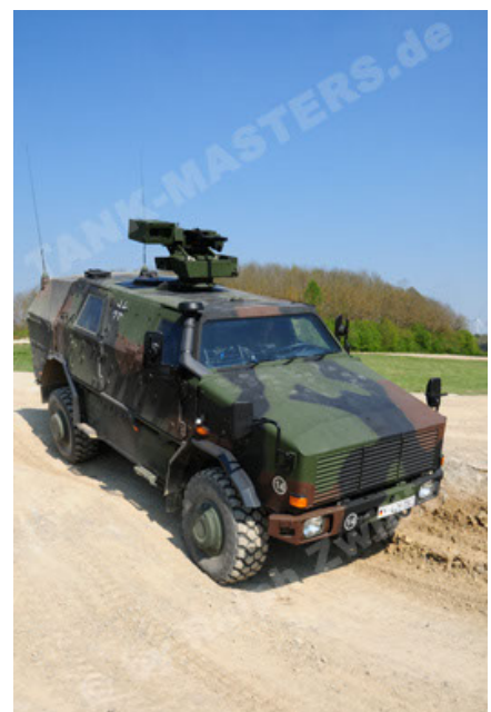
Dingo 2 GE A2.3 KWS (54).JPG