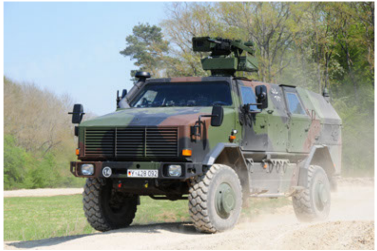
Dingo 2 GE A2.3 KWS (10).JPG