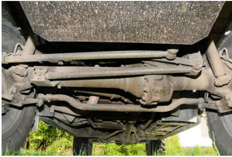
Dingo 2 GE A2.3 KWS (43).JPG