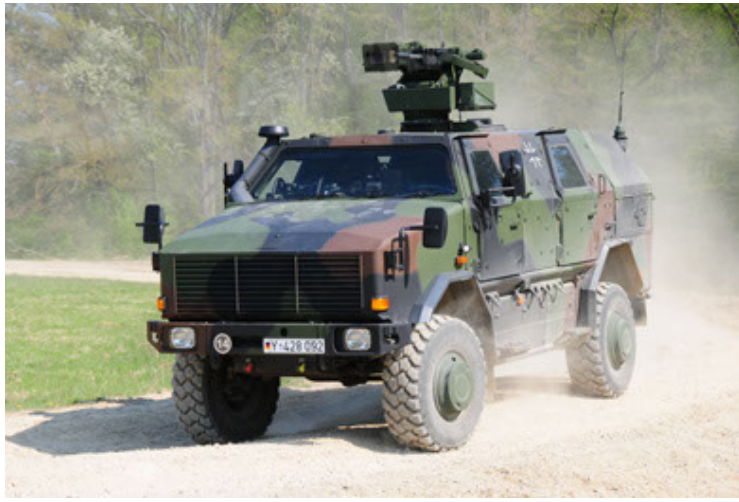
Dingo 2 GE A2.3 KWS (7).JPG