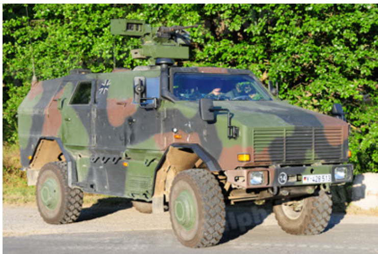
Dingo 2 GE A2.3 KWS (5).JPG