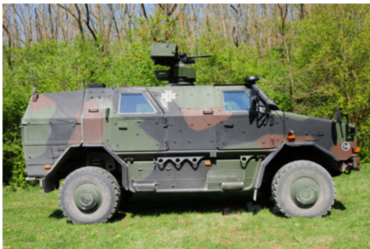
Dingo 2 GE A2.3 KWS (23).JPG