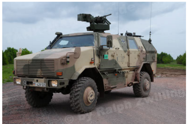
Dingo 2 GE A2.3 KWS (36).JPG