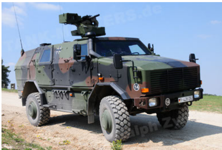
Dingo 2 GE A2.3 KWS (17).JPG