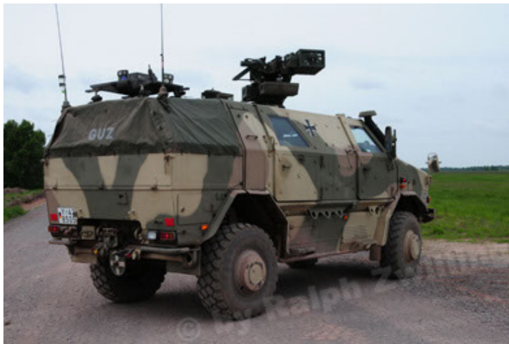
Dingo 2 GE A2.3 KWS (15).JPG