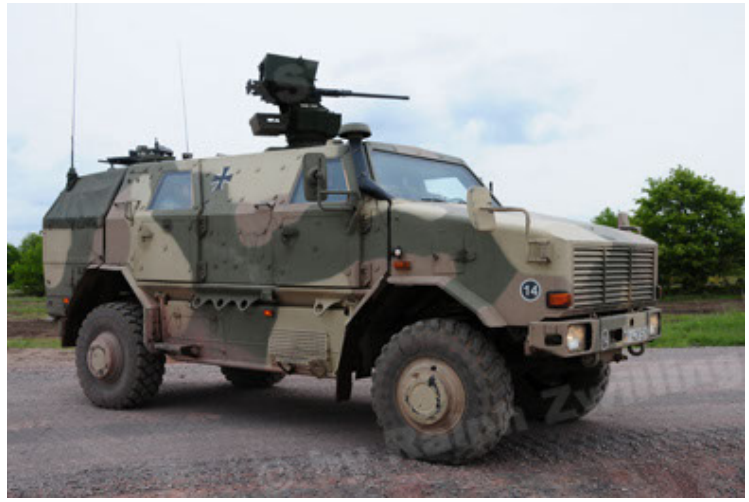
Dingo 2 GE A2.3 KWS (2).JPG