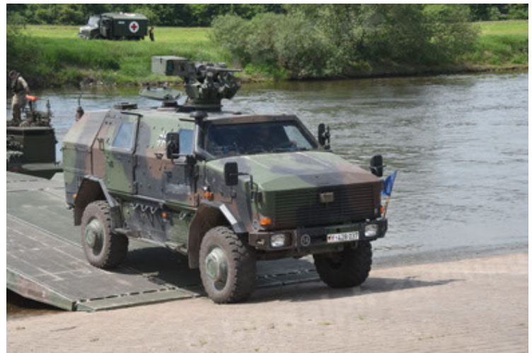
Dingo 2 GE A2.3 KWS (58).JPG