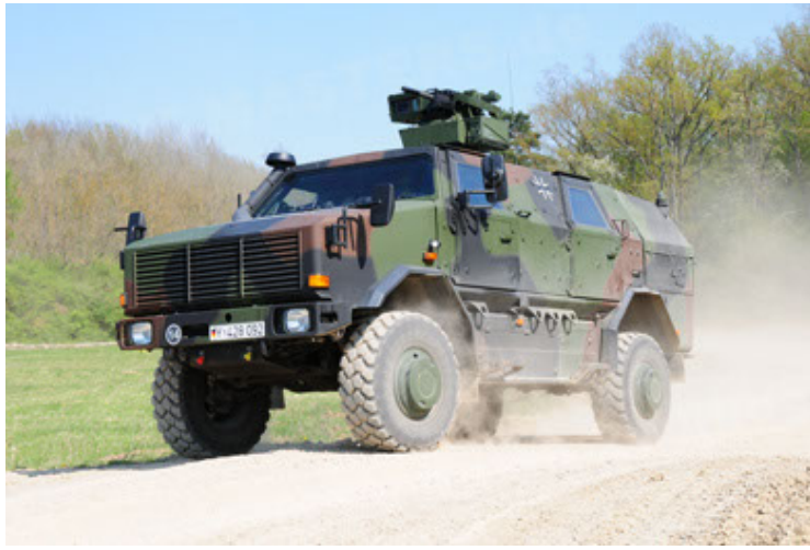
Dingo 2 GE A2.3 KWS (19).JPG