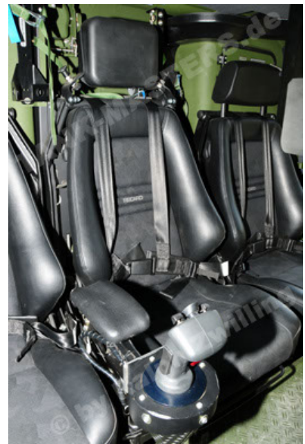
Dingo 2 GE A2.3 KWS (50).JPG