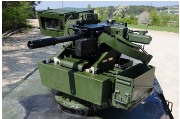
Dingo 2 GE A2.3 KWS (40).JPG