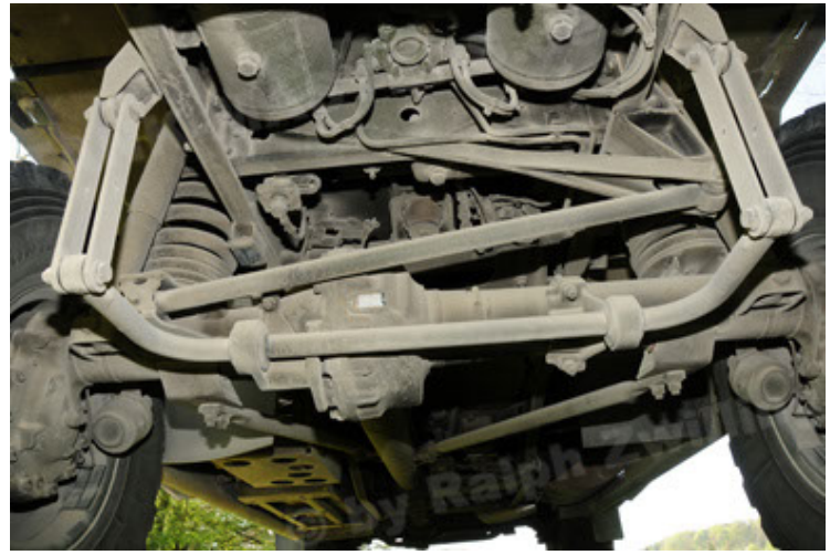
Dingo 2 GE A2.3 KWS (44).JPG