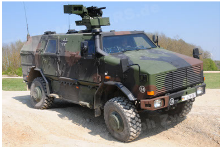
Dingo 2 GE A2.3 KWS (4).JPG