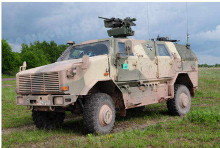
Dingo 2 GE A2.3 KWS (11).JPG