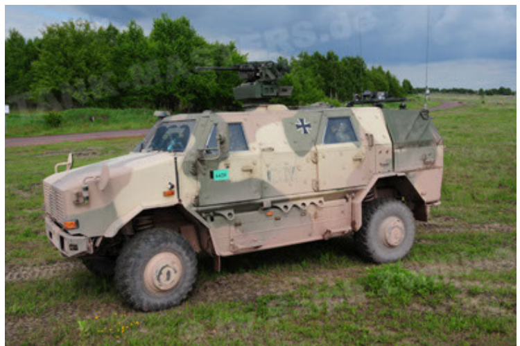
Dingo 2 GE A2.3 KWS (12).JPG