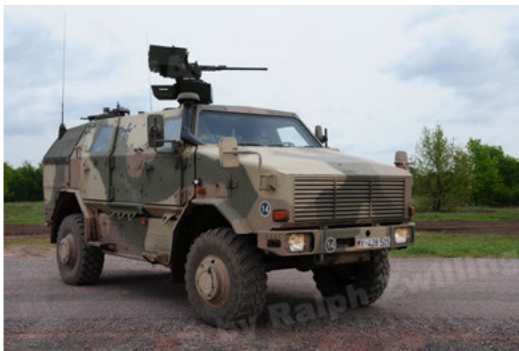
Dingo 2 GE A2.3 KWS (35).JPG