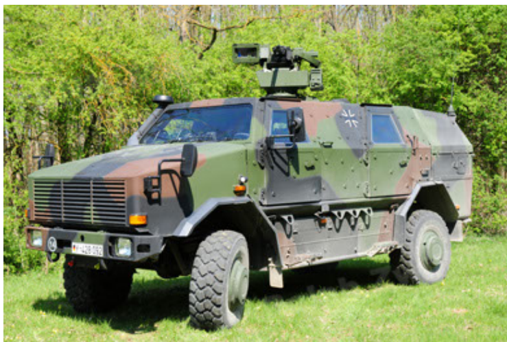
Dingo 2 GE A2.3 KWS (29).JPG