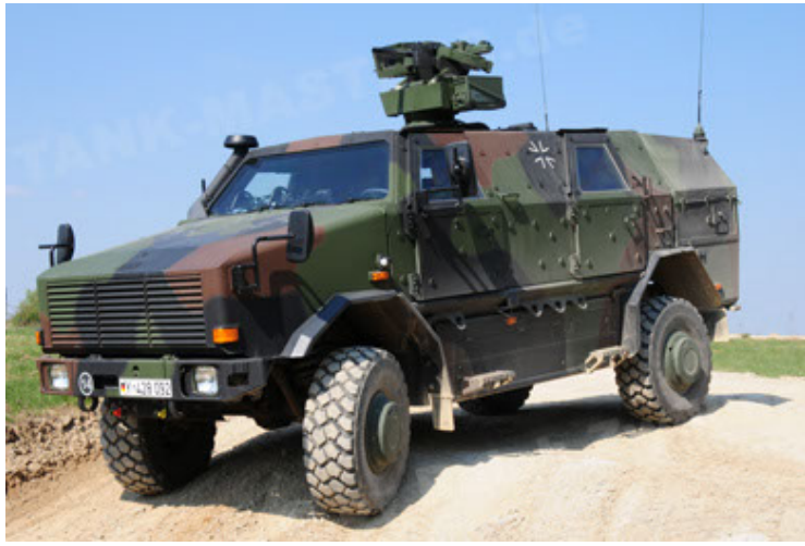
Dingo 2 GE A2.3 KWS (13).JPG