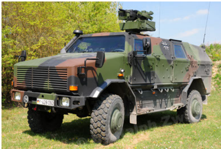
Dingo 2 GE A2.3 KWS (21).JPG