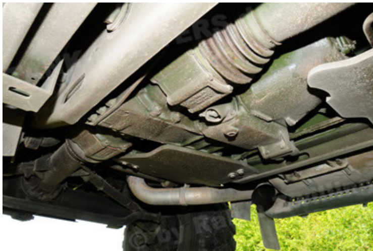
Dingo 2 GE A2.3 KWS (45).JPG