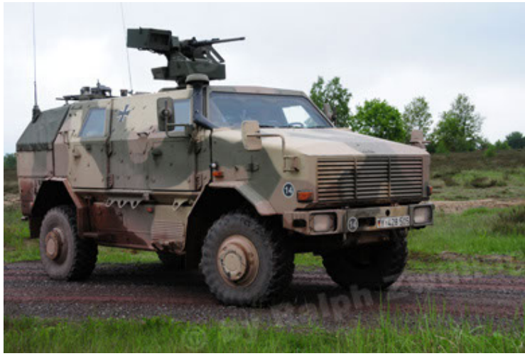
Dingo 2 GE A2.3 KWS (25).JPG