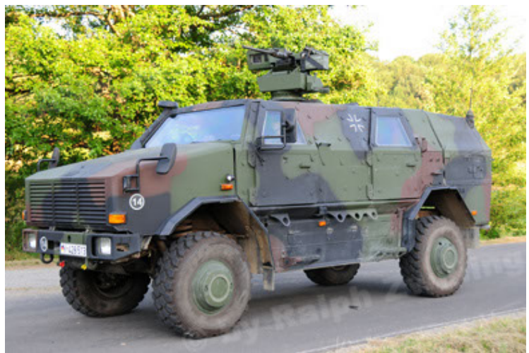
Dingo 2 GE A2.3 KWS (6).JPG