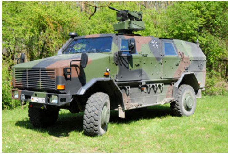
Dingo 2 GE A2.3 KWS (1).JPG