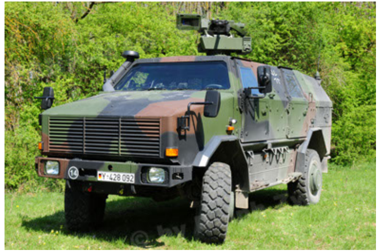
Dingo 2 GE A2.3 KWS (32).JPG