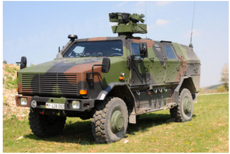
Dingo 2 GE A2.3 KWS (20).JPG