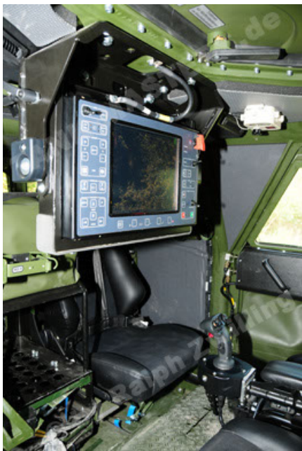
Dingo 2 GE A2.3 KWS (49).JPG