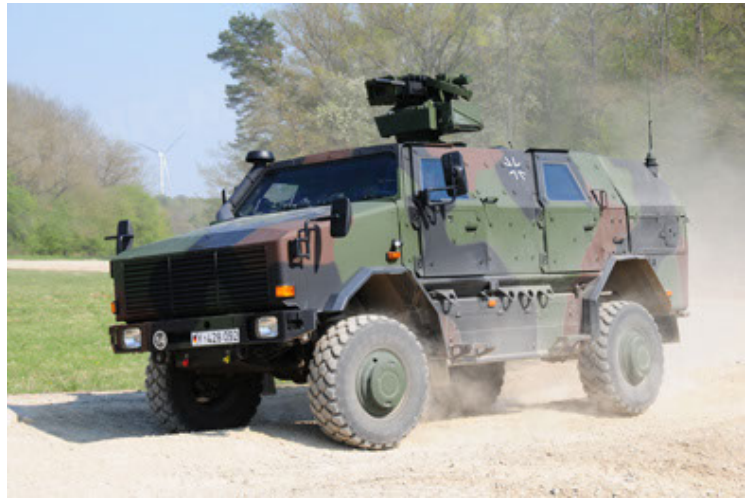
Dingo 2 GE A2.3 KWS (8).JPG