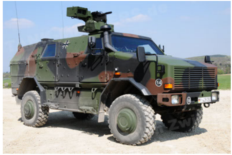
Dingo 2 GE A2.3 KWS (14).JPG