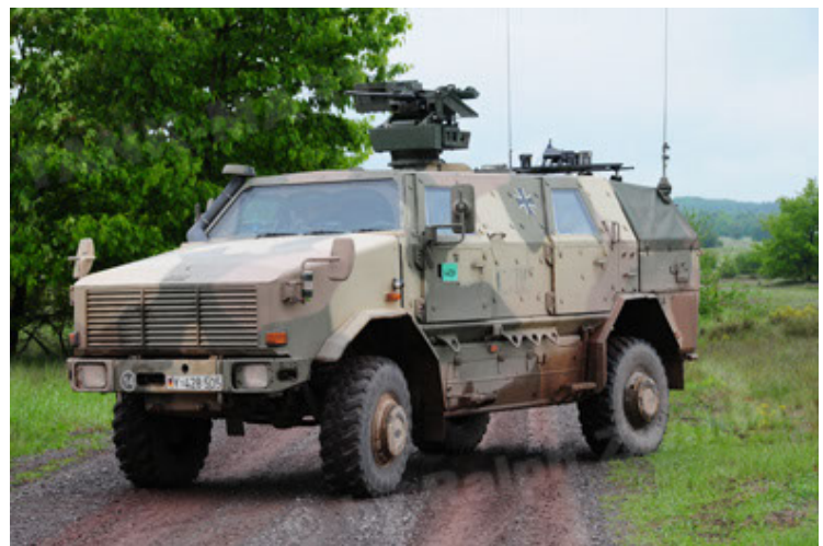
Dingo 2 GE A2.3 KWS (24).JPG