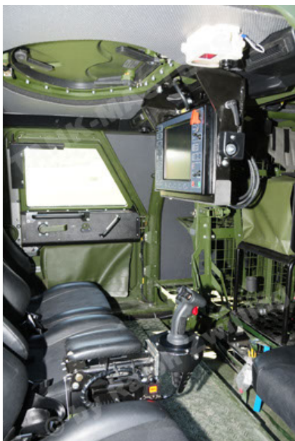
Dingo 2 GE A2.3 KWS (47).JPG