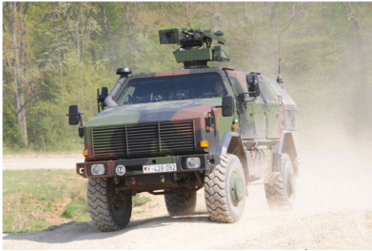
Dingo 2 GE A2.3 KWS (9).JPG