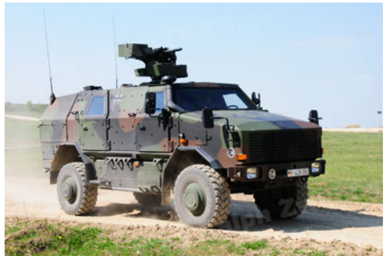
Dingo 2 GE A2.3 KWS (16).JPG