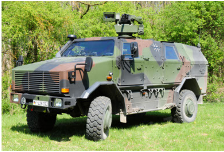
Dingo 2 GE A2.3 KWS (31).JPG