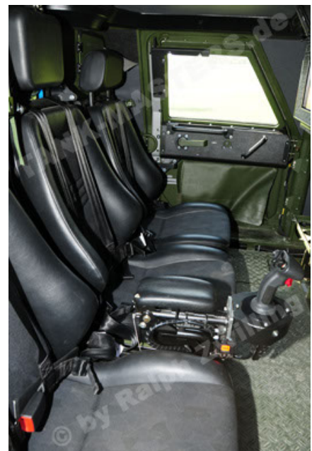
Dingo 2 GE A2.3 KWS (48).JPG