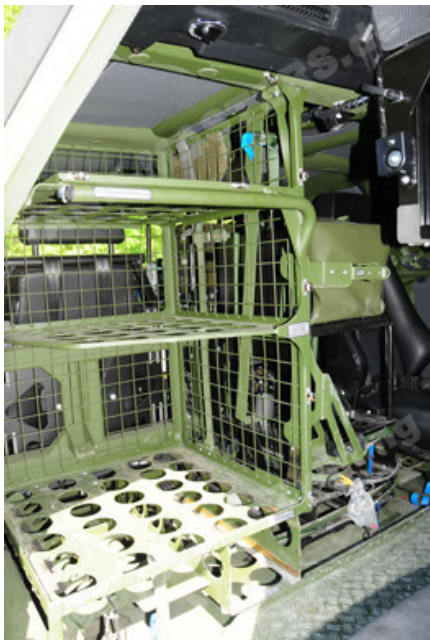
Dingo 2 GE A2.3 KWS (51).JPG