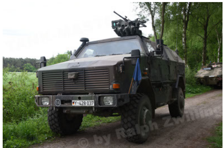
Dingo 2 GE A2.3 KWS (60).JPG