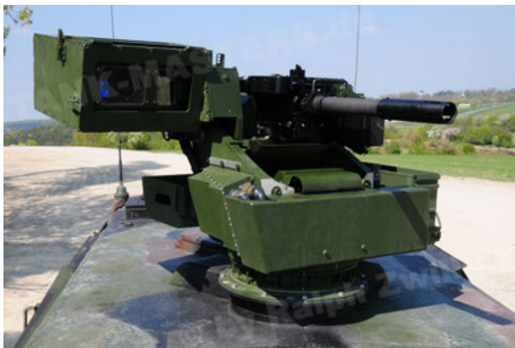
Dingo 2 GE A2.3 KWS (41).JPG