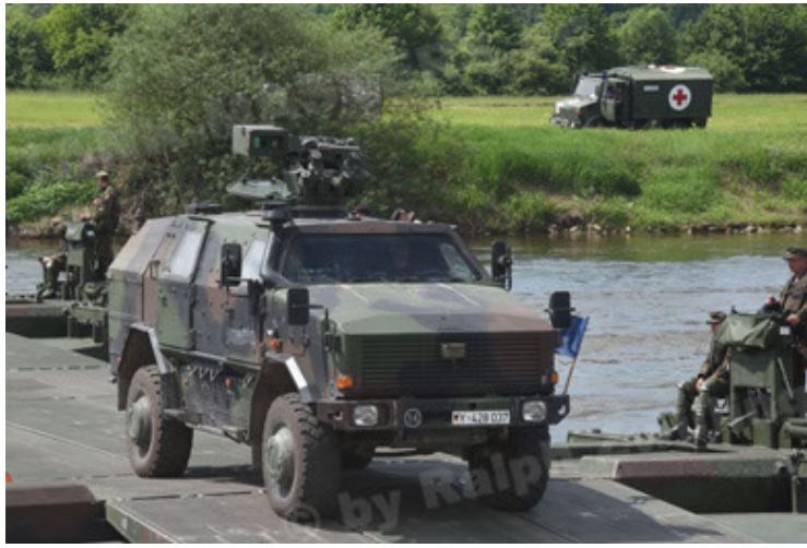
Dingo 2 GE A2.3 KWS (55).JPG