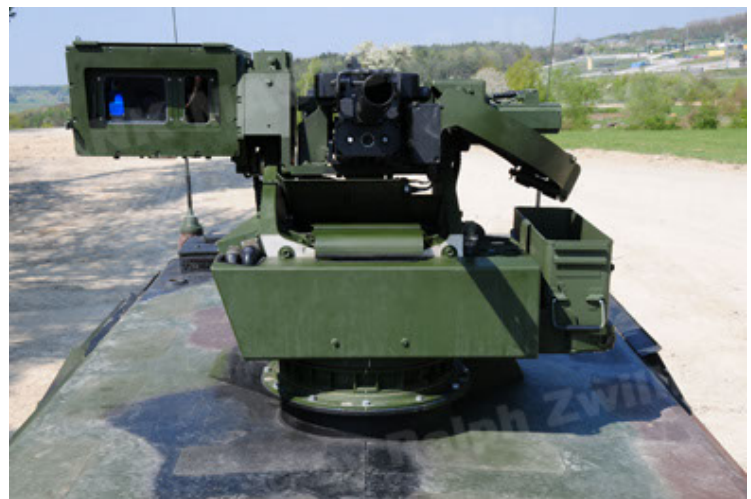
Dingo 2 GE A2.3 KWS (42).JPG