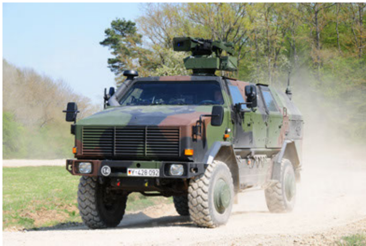
Dingo 2 GE A2.3 KWS (3).JPG