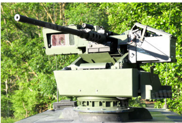
Dingo 2 GE A2.3 KWS (53).JPG