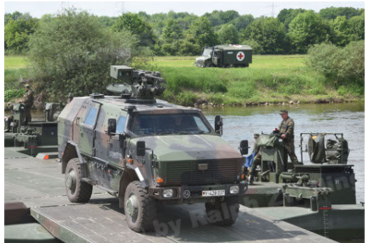
Dingo 2 GE A2.3 KWS (56).JPG