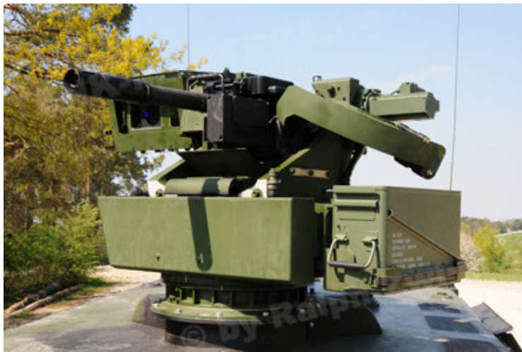
Dingo 2 GE A2.3 KWS (39).JPG