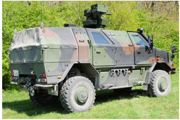
Dingo 2 GE A2.3 KWS (26).JPG