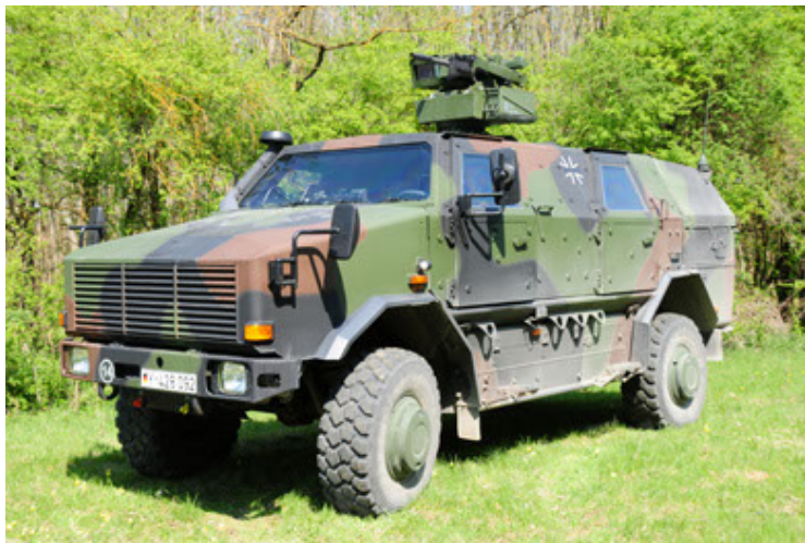
Dingo 2 GE A2.3 KWS (27).JPG