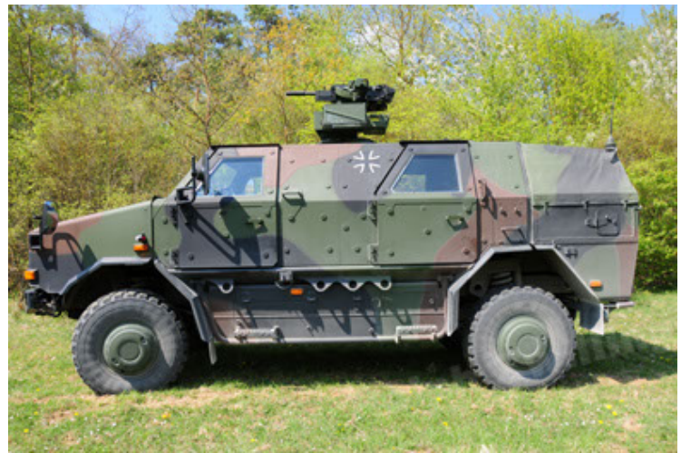
Dingo 2 GE A2.3 KWS (22).JPG