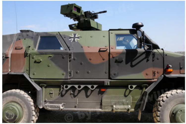
Dingo 2 GE A2.3 KWS (38).JPG