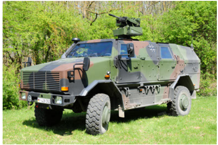
Dingo 2 GE A2.3 KWS (34).JPG