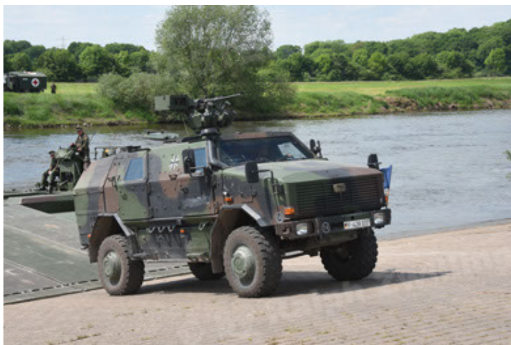
Dingo 2 GE A2.3 KWS (59).JPG