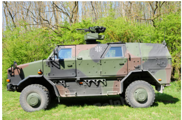
Dingo 2 GE A2.3 KWS (28).JPG