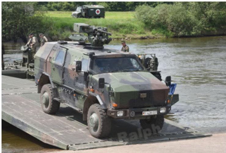
Dingo 2 GE A2.3 KWS (57).JPG