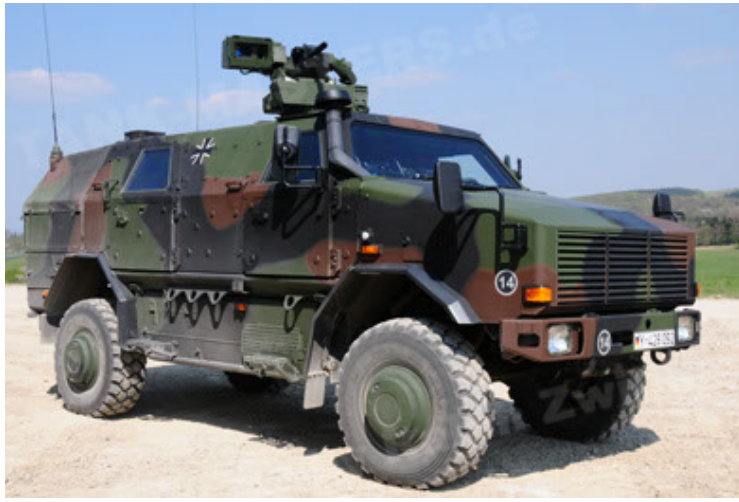
Dingo 2 GE A2.3 KWS (37).JPG