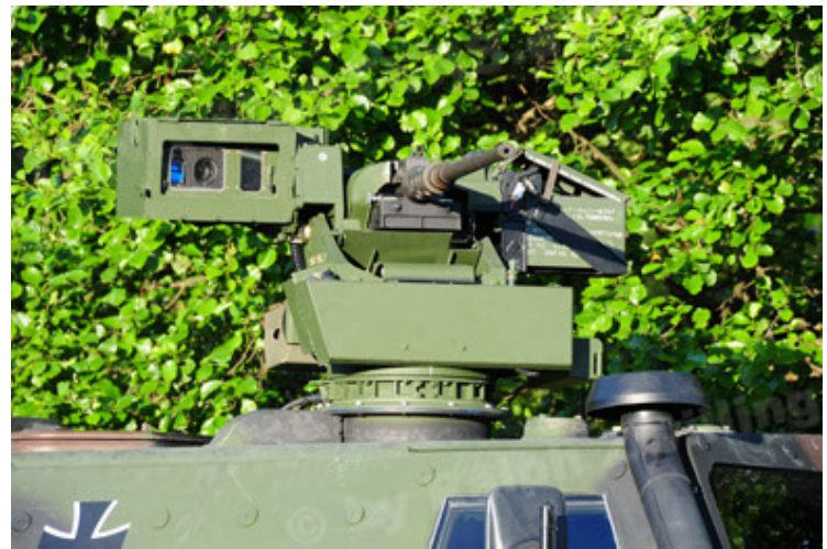
Dingo 2 GE A2.3 KWS (52).JPG