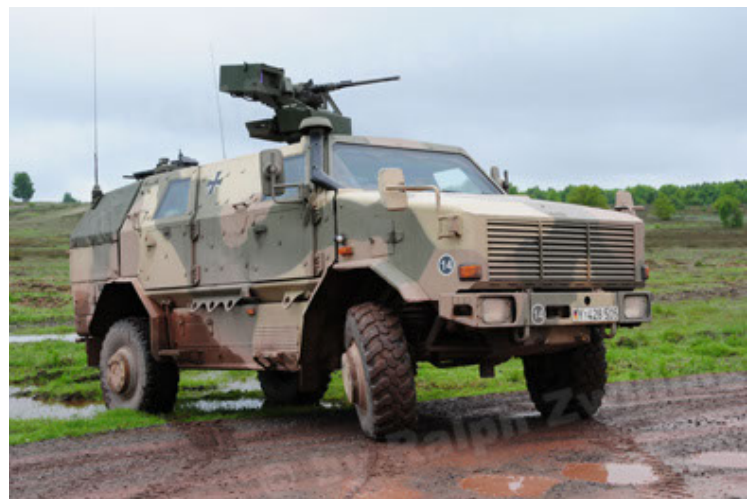
Dingo 2 GE A2.3 KWS (30).JPG