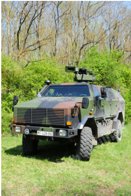
Dingo 2 GE A2.3 KWS (33).JPG