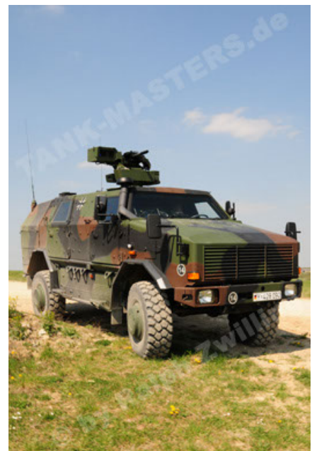
Dingo 2 GE A2.3 KWS (18).JPG