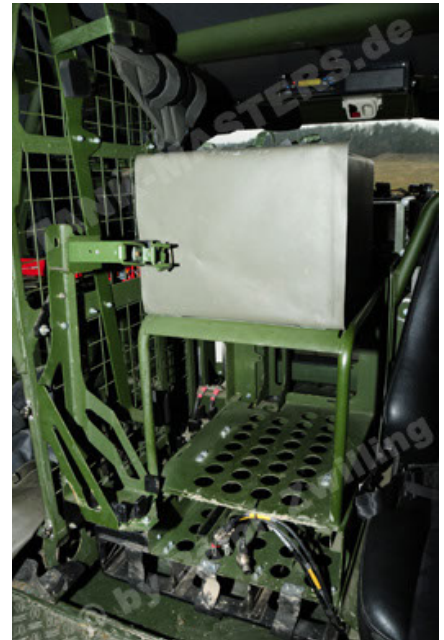
Dingo 2 GE A2 PatSich (100).JPG