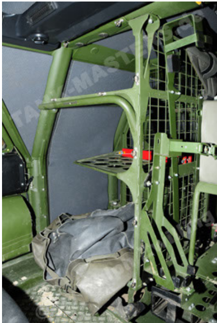
Dingo 2 GE A2 PatSich (69).JPG