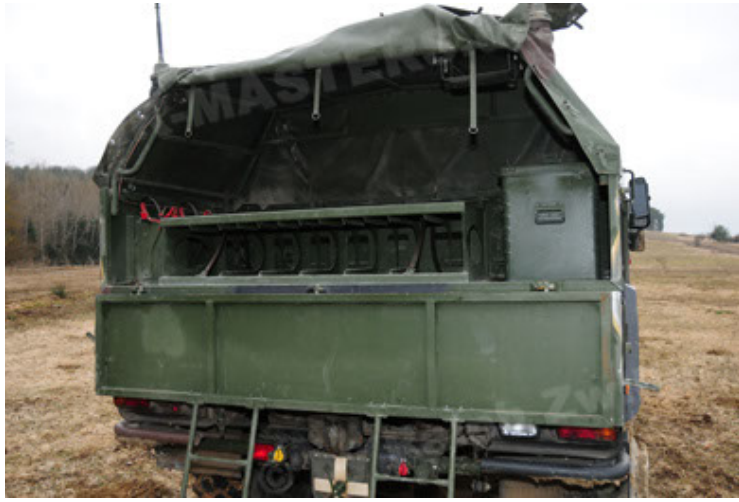
Dingo 2 GE A2 PatSich (55).JPG