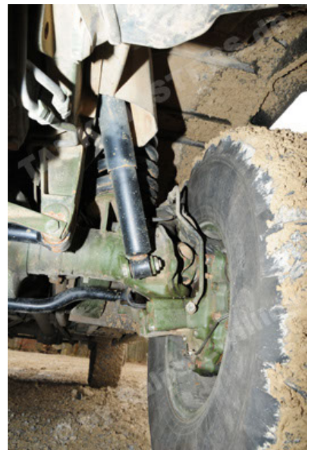
Dingo 2 GE A2 PatSich (80).JPG