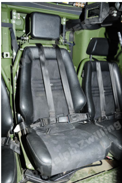
Dingo 2 GE A2 PatSich (65).JPG