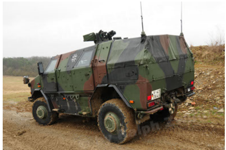
Dingo 2 GE A2 PatSich (40).JPG