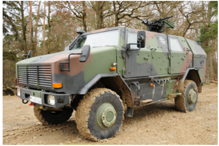
Dingo 2 GE A2 PatSich (38).JPG