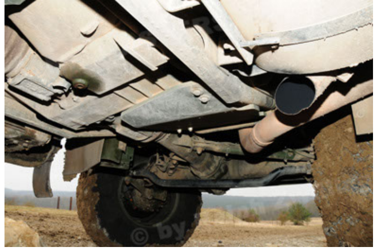
Dingo 2 GE A2 PatSich (86).JPG