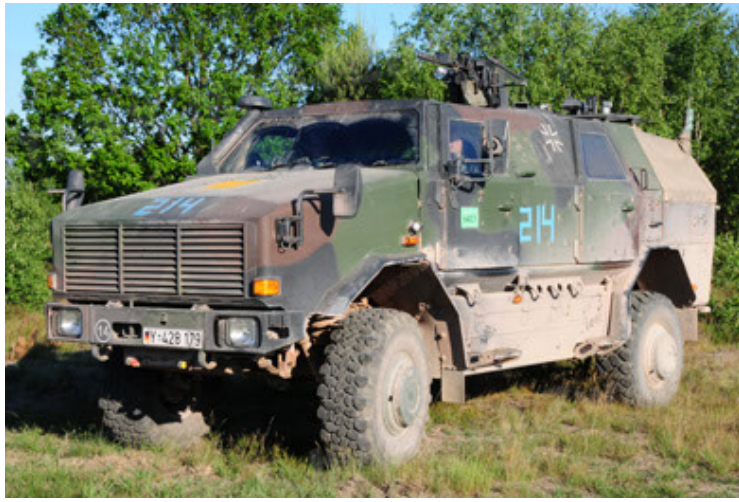
Dingo 2 GE A2 PatSich (1).JPG