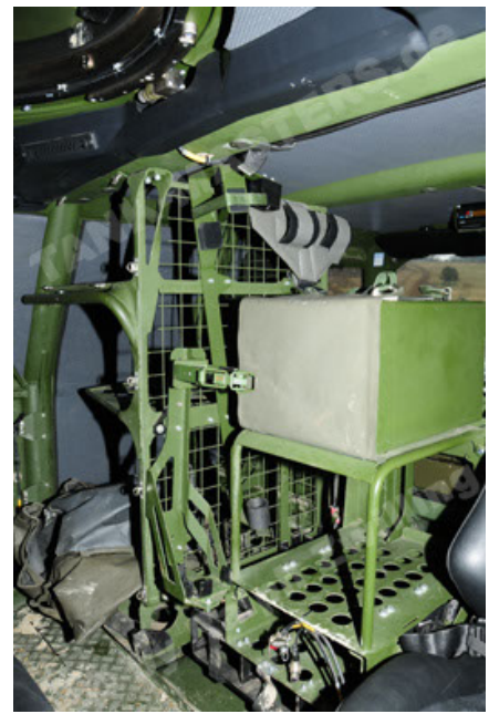
Dingo 2 GE A2 PatSich (68).JPG