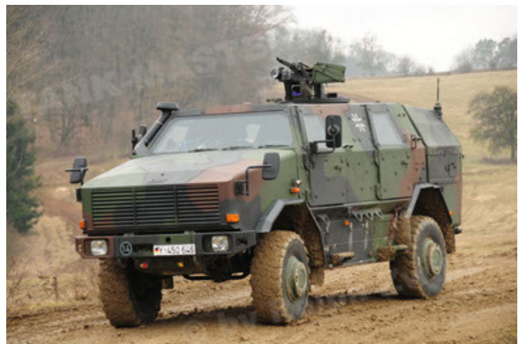
Dingo 2 GE A2 PatSich (24).JPG