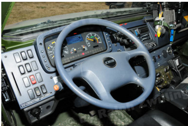
Dingo 2 GE A2 PatSich (71).JPG