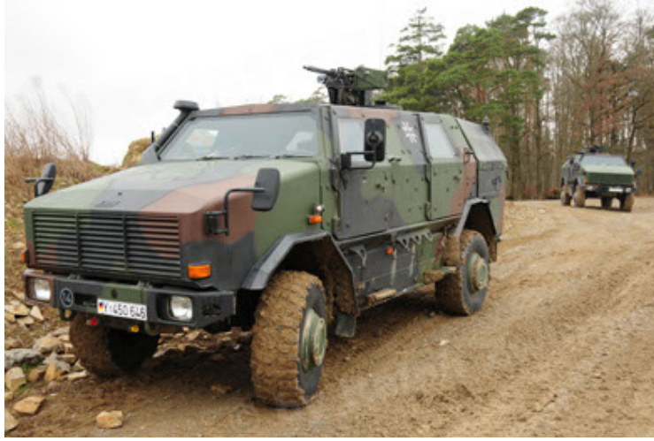
Dingo 2 GE A2 PatSich (25).JPG