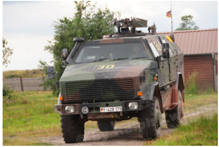
Dingo 2 GE A2 PatSich (20).JPG