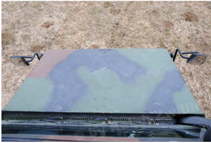
Dingo 2 GE A2 PatSich (109).JPG