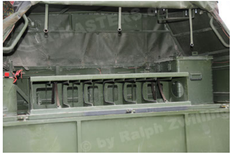
Dingo 2 GE A2 PatSich (56).JPG