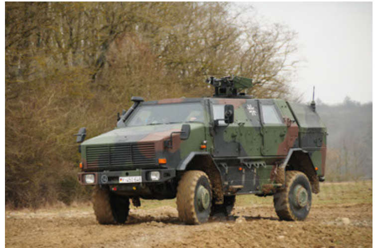
Dingo 2 GE A2 PatSich (46).JPG