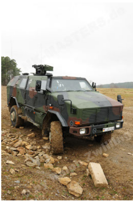
Dingo 2 GE A2 PatSich (43).JPG