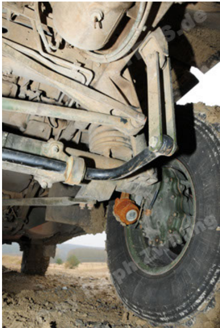
Dingo 2 GE A2 PatSich (81).JPG