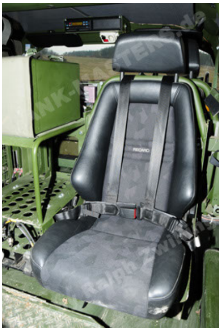
Dingo 2 GE A2 PatSich (67).JPG