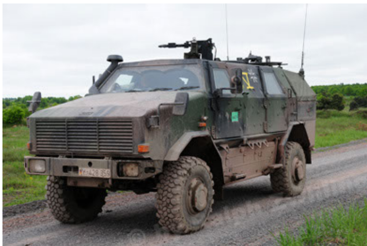
Dingo 2 GE A2 PatSich (11).JPG