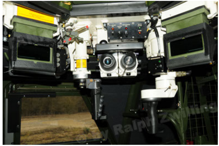
Dingo 2 GE A2 PatSich (98).JPG