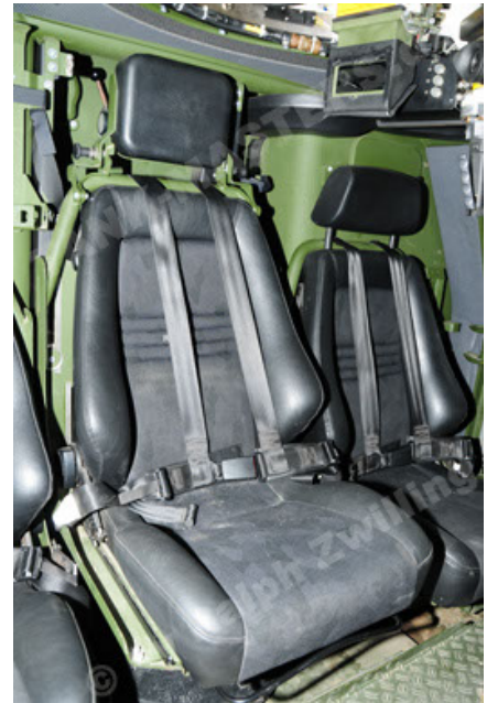
Dingo 2 GE A2 PatSich (64).JPG