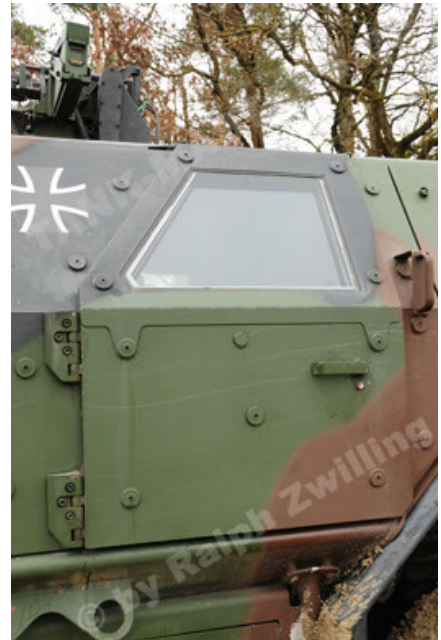
Dingo 2 GE A2 PatSich (94).JPG