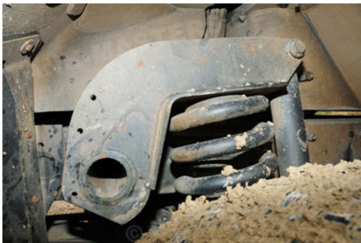
Dingo 2 GE A2 PatSich (83).JPG