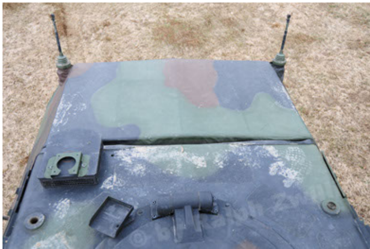
Dingo 2 GE A2 PatSich (75).JPG