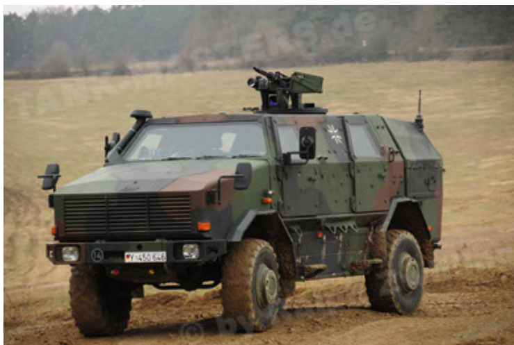
Dingo 2 GE A2 PatSich (53).JPG