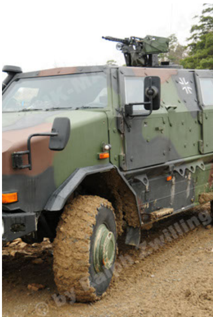
Dingo 2 GE A2 PatSich (77).JPG