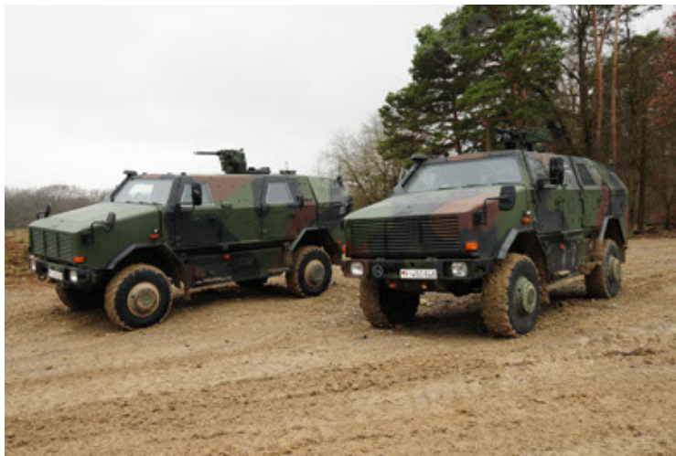
Dingo 2 GE A2 PatSich (39).JPG