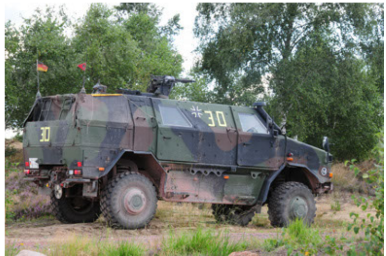
Dingo 2 GE A2 PatSich (10).JPG