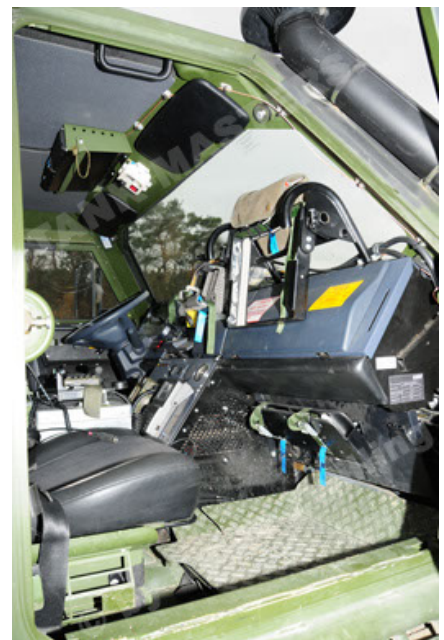
Dingo 2 GE A2 PatSich (102).JPG