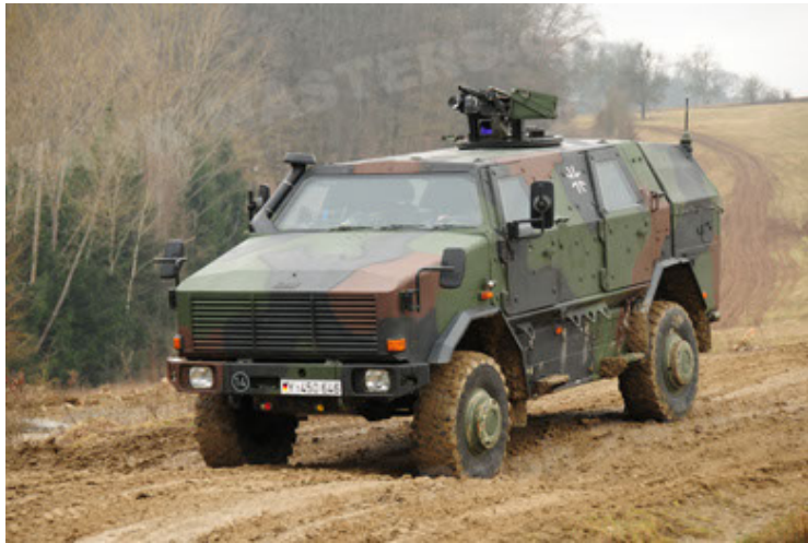
Dingo 2 GE A2 PatSich (51).JPG