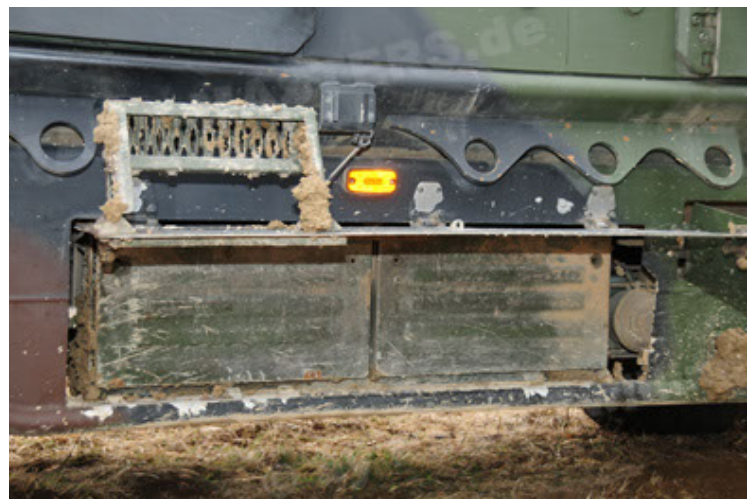
Dingo 2 GE A2 PatSich (114).JPG