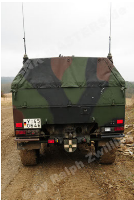
Dingo 2 GE A2 PatSich (41).JPG