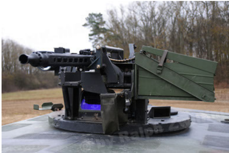
Dingo 2 GE A2 PatSich (105).JPG