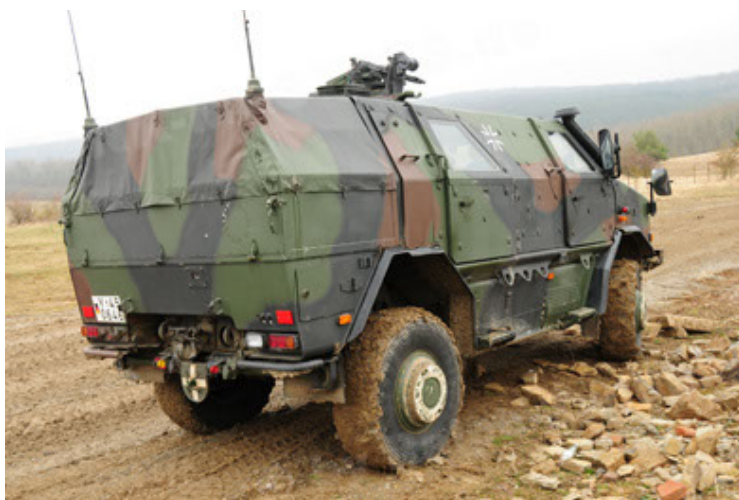
Dingo 2 GE A2 PatSich (5).JPG