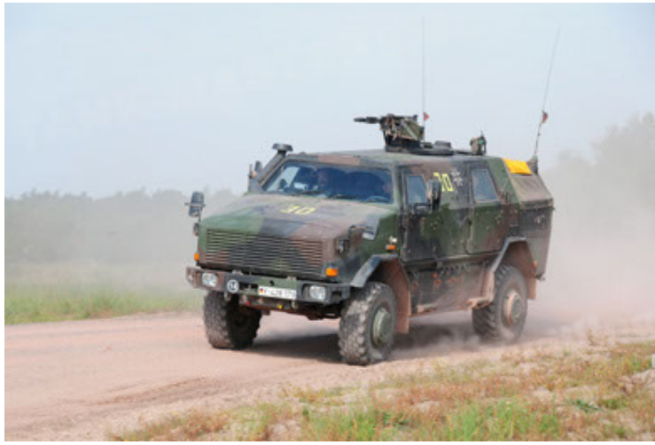
Dingo 2 GE A2 PatSich (13).JPG