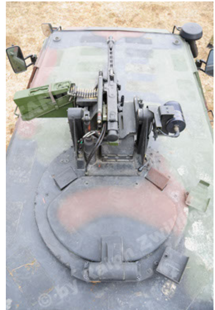
Dingo 2 GE A2 PatSich (106).JPG