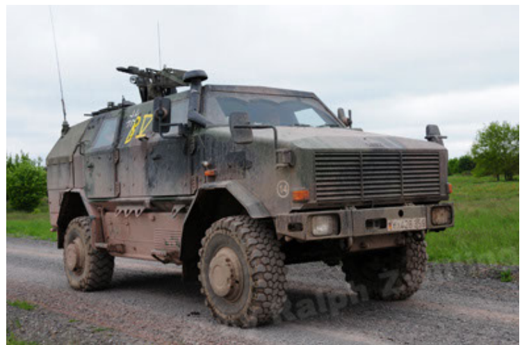
Dingo 2 GE A2 PatSich (12).JPG