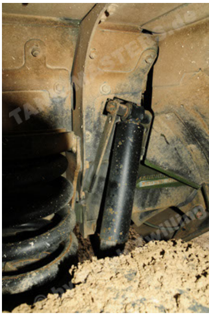
Dingo 2 GE A2 PatSich (91).JPG