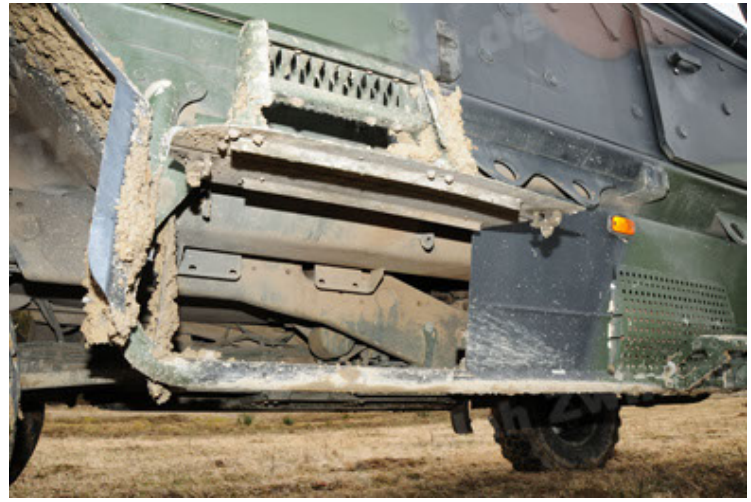
Dingo 2 GE A2 PatSich (110).JPG