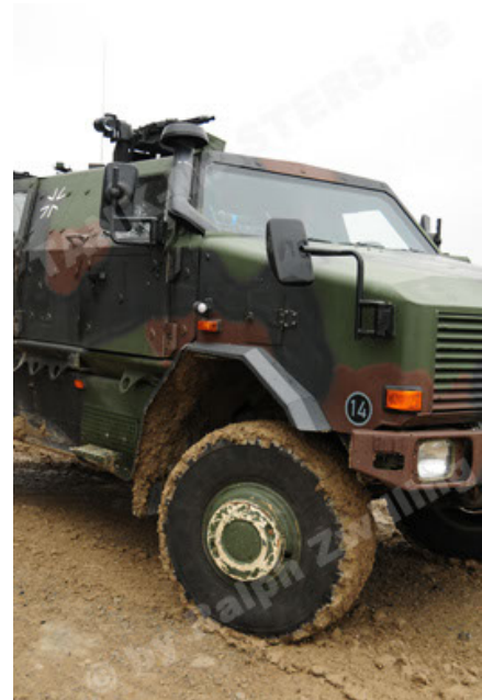
Dingo 2 GE A2 PatSich (76).JPG