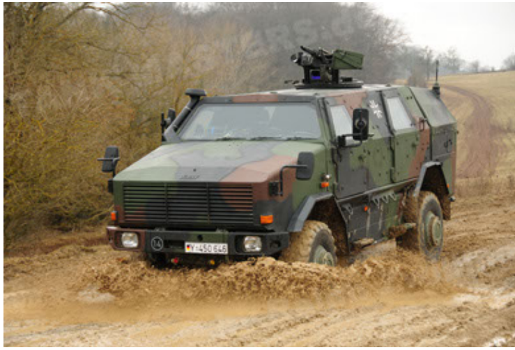
Dingo 2 GE A2 PatSich (49).JPG