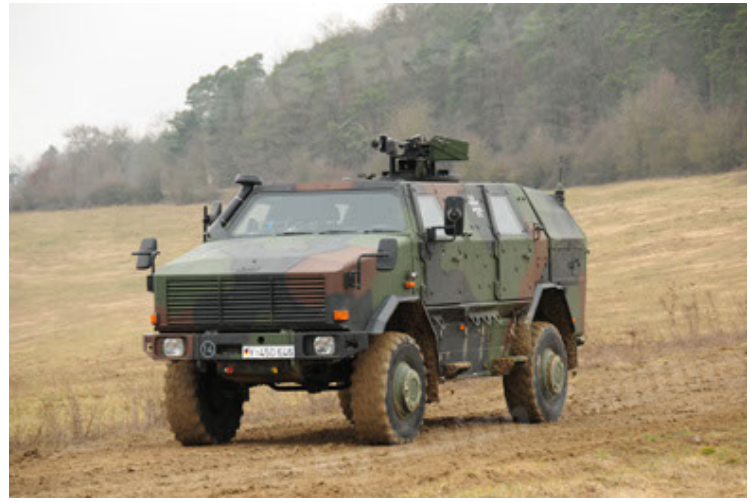
Dingo 2 GE A2 PatSich (50).JPG