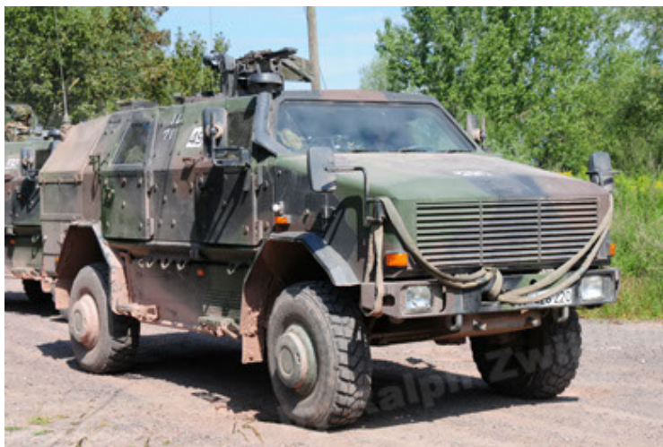
Dingo 2 GE A2 PatSich (17).JPG