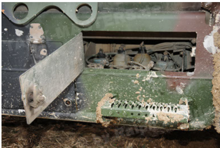
Dingo 2 GE A2 PatSich (113).JPG