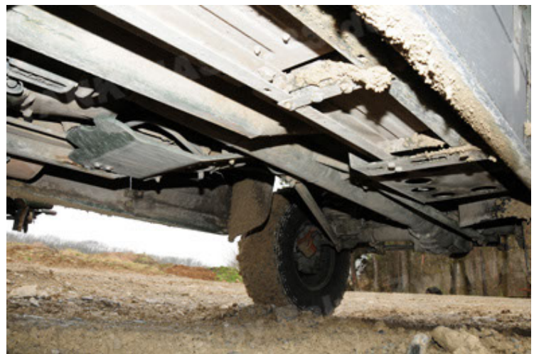
Dingo 2 GE A2 PatSich (84).JPG