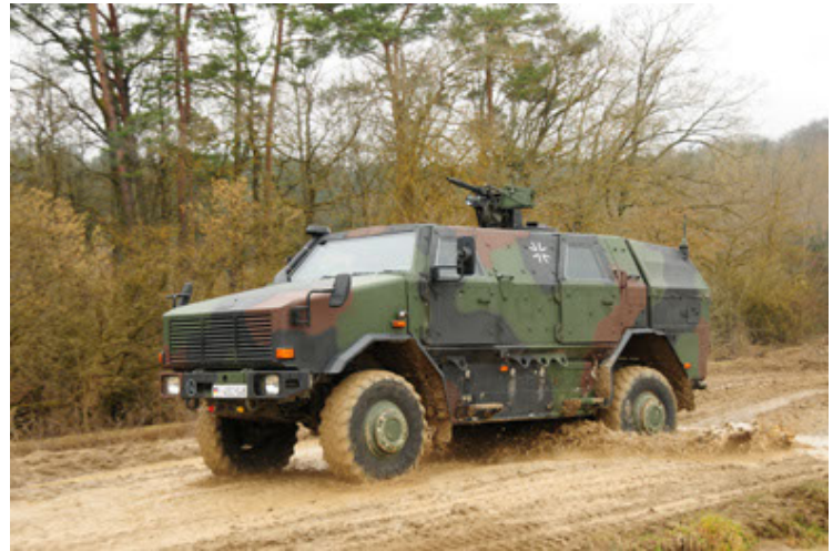
Dingo 2 GE A2 PatSich (52).JPG