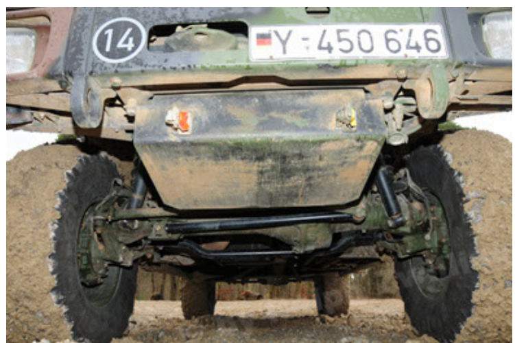
Dingo 2 GE A2 PatSich (60).JPG