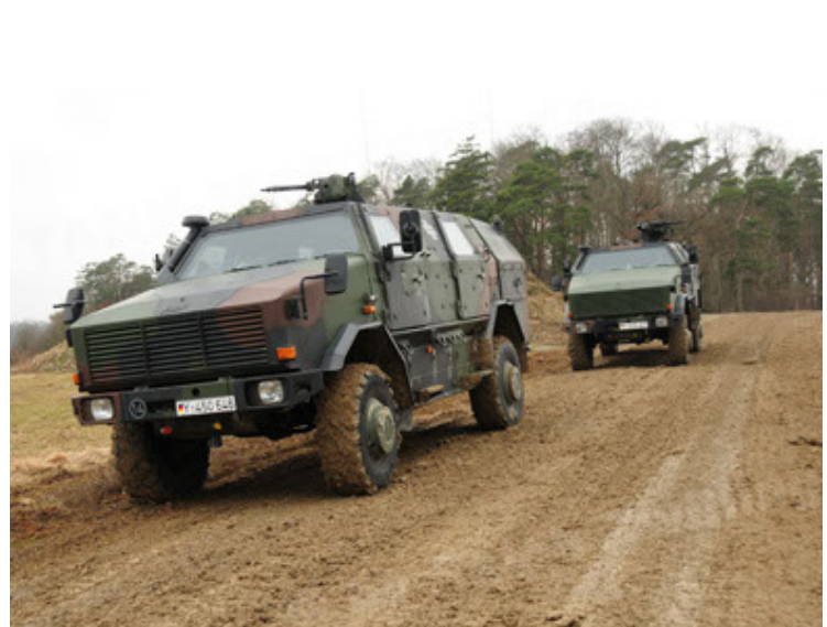
Dingo 2 GE A2 PatSich (42).JPG