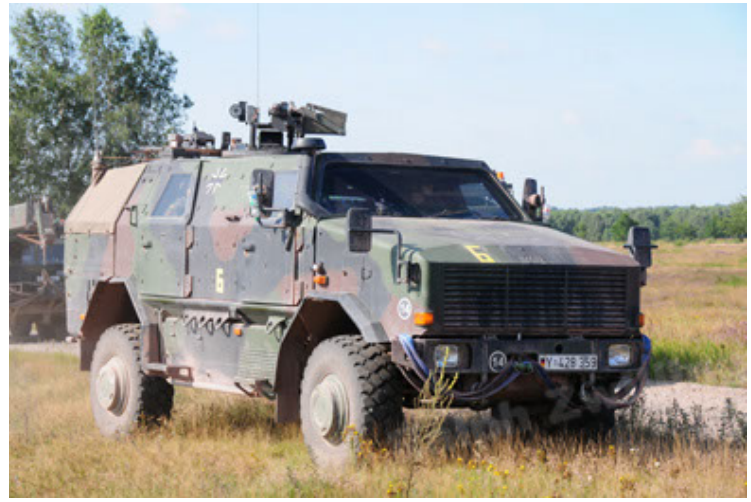
Dingo 2 GE A2 PatSich (8).JPG