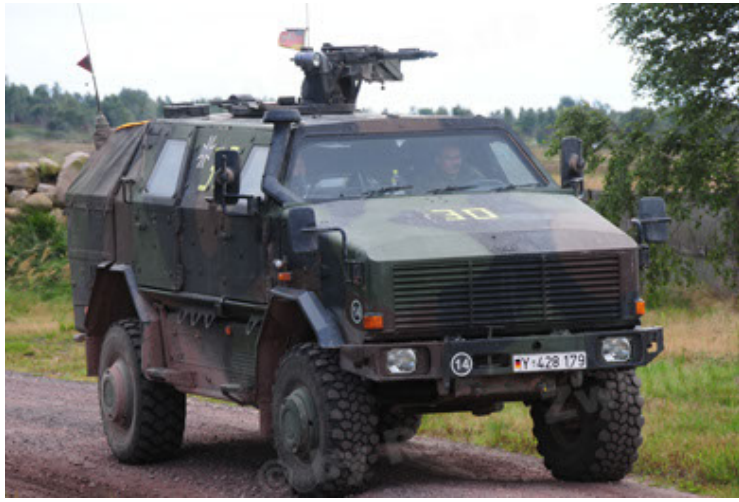
Dingo 2 GE A2 PatSich (7).JPG