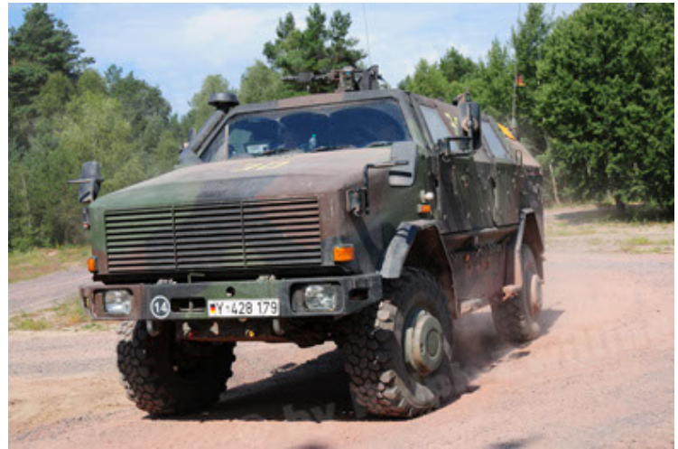
Dingo 2 GE A2 PatSich (22).JPG