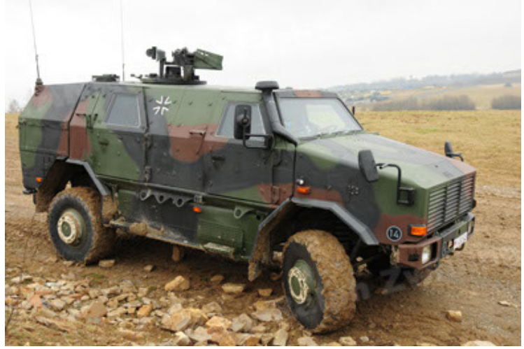
Dingo 2 GE A2 PatSich (26).JPG