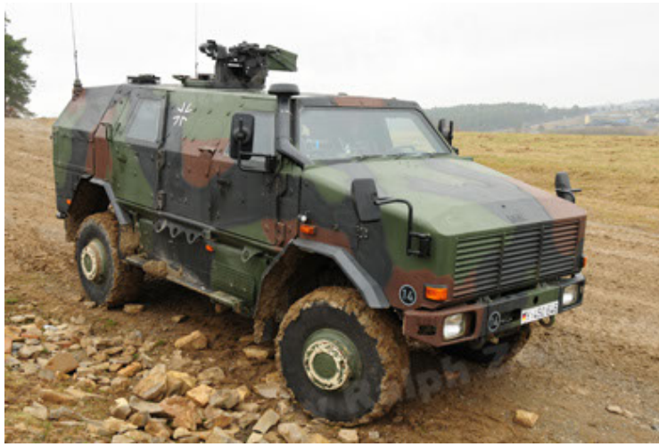
Dingo 2 GE A2 PatSich (37).JPG