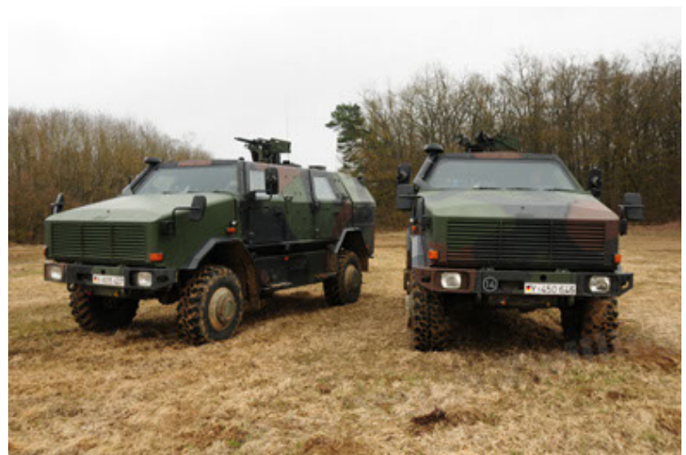
Dingo 2 GE A2 PatSich (96).JPG