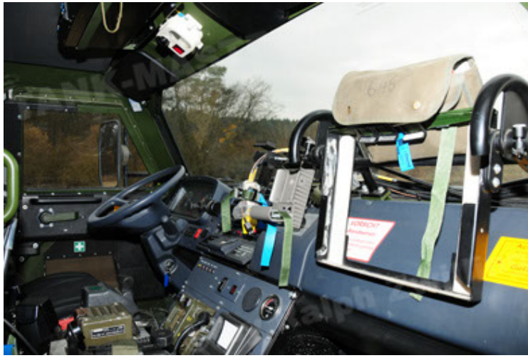
Dingo 2 GE A2 PatSich (103).JPG