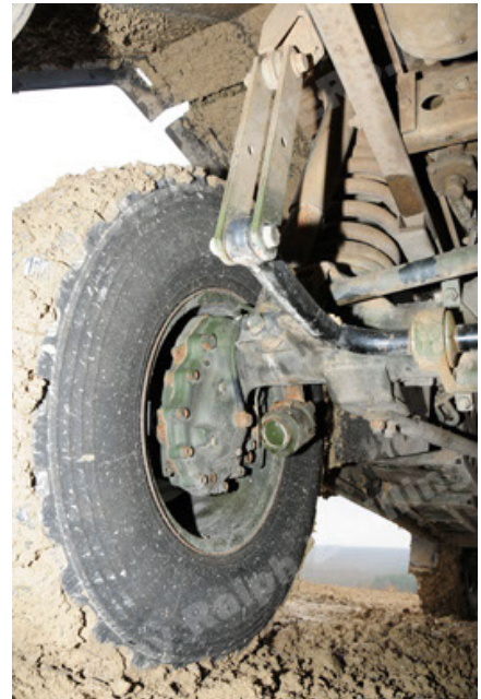
Dingo 2 GE A2 PatSich (82).JPG