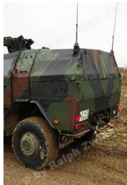
Dingo 2 GE A2 PatSich (78).JPG