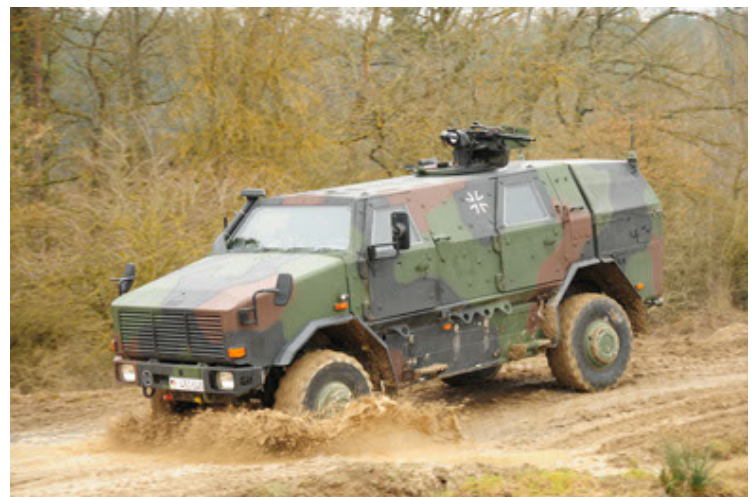
Dingo 2 GE A2 PatSich (48).JPG