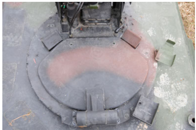
Dingo 2 GE A2 PatSich (108).JPG