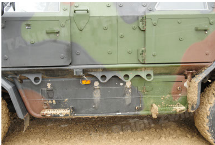
Dingo 2 GE A2 PatSich (95).JPG