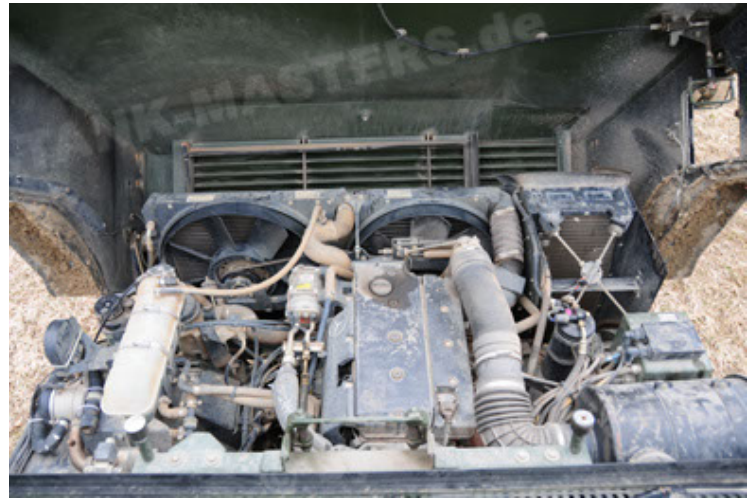
Dingo 2 GE A2 PatSich (74).JPG