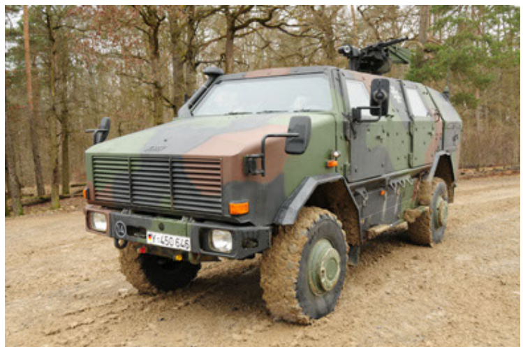
Dingo 2 GE A2 PatSich (36).JPG