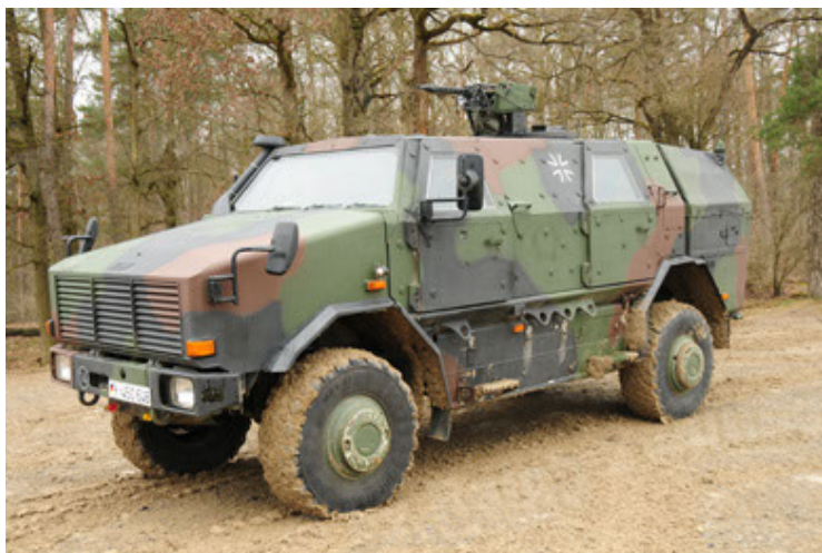
Dingo 2 GE A2 PatSich (23).JPG