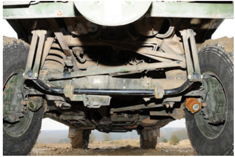
Dingo 2 GE A2 PatSich (62).JPG