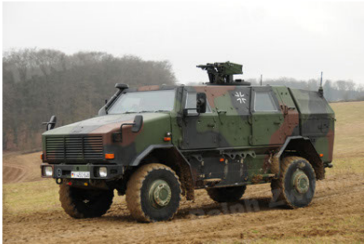
Dingo 2 GE A2 PatSich (45).JPG