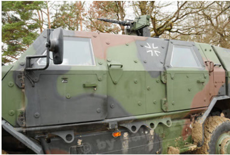
Dingo 2 GE A2 PatSich (93).JPG