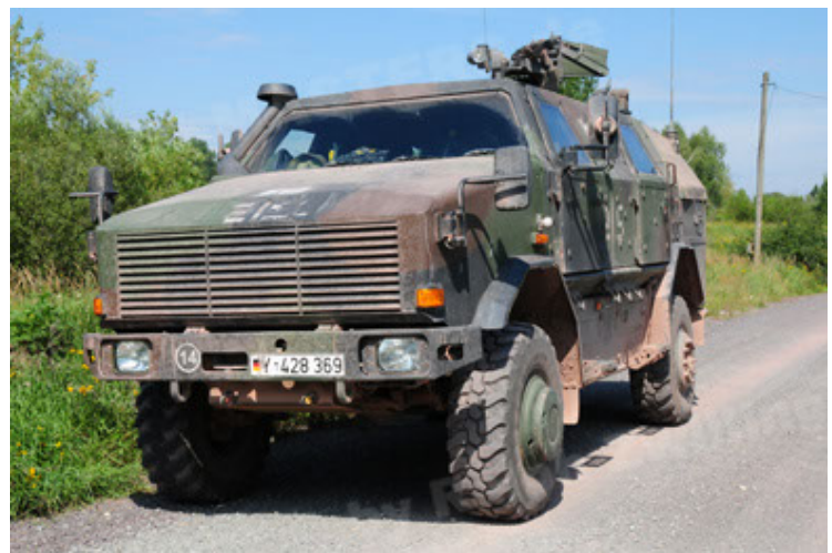
Dingo 2 GE A2 PatSich (18).JPG