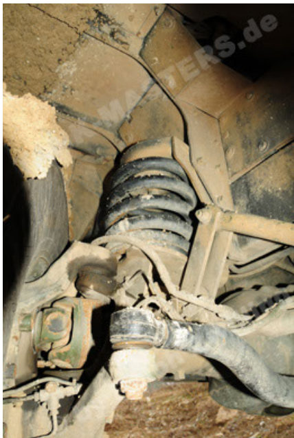
Dingo 2 GE A2 PatSich (89).JPG