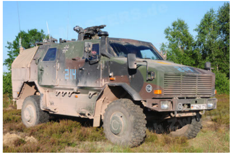
Dingo 2 GE A2 PatSich (14).JPG