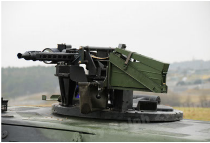
Dingo 2 GE A2 PatSich (73).JPG