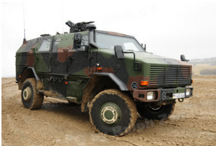
Dingo 2 GE A2 PatSich (29).JPG