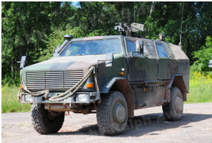
Dingo 2 GE A2 PatSich (15).JPG