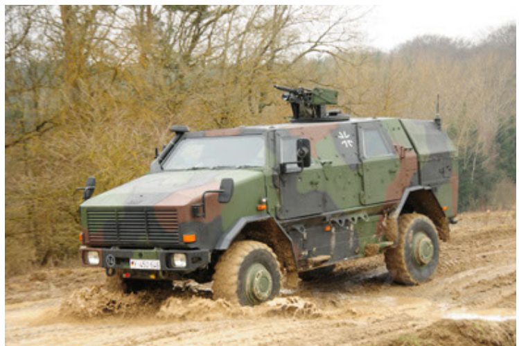
Dingo 2 GE A2 PatSich (30).JPG