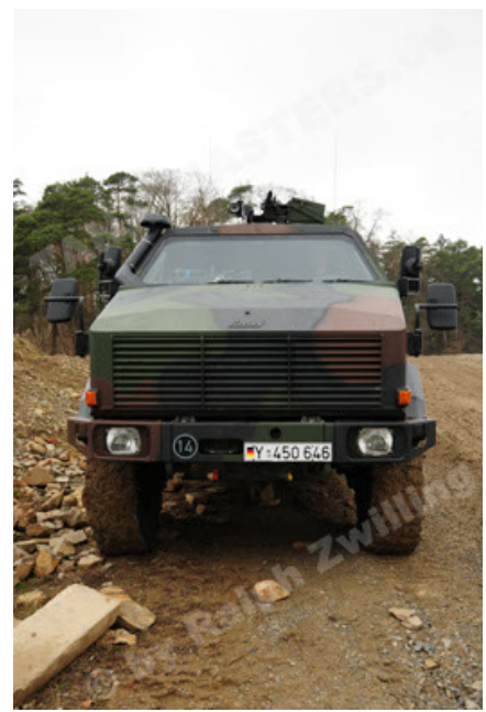
Dingo 2 GE A2 PatSich (44).JPG