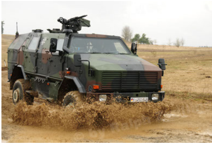
Dingo 2 GE A2 PatSich (31).JPG