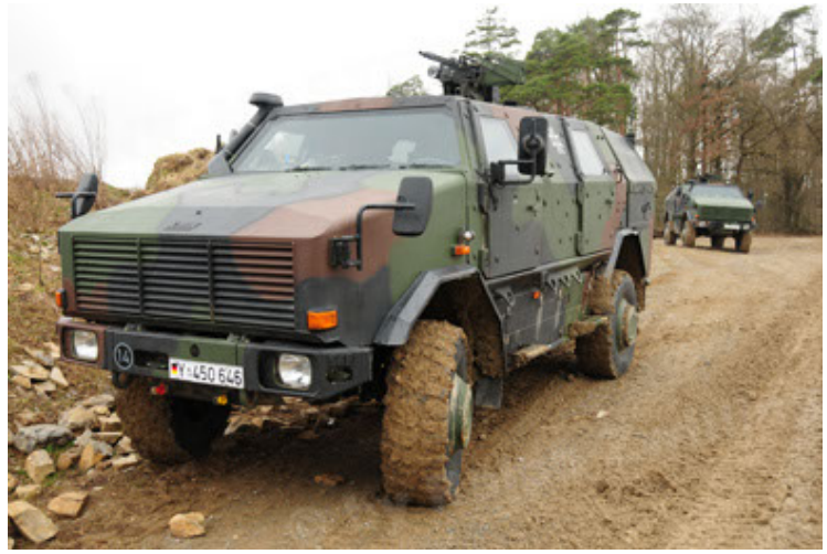
Dingo 2 GE A2 PatSich (2).JPG