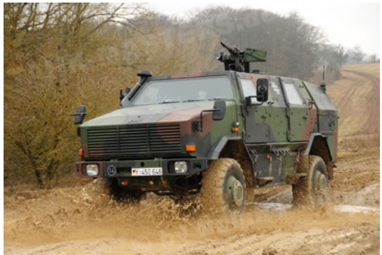
Dingo 2 GE A2 PatSich (4).JPG