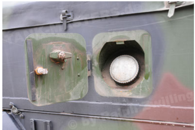
Dingo 2 GE A2 PatSich (112).JPG