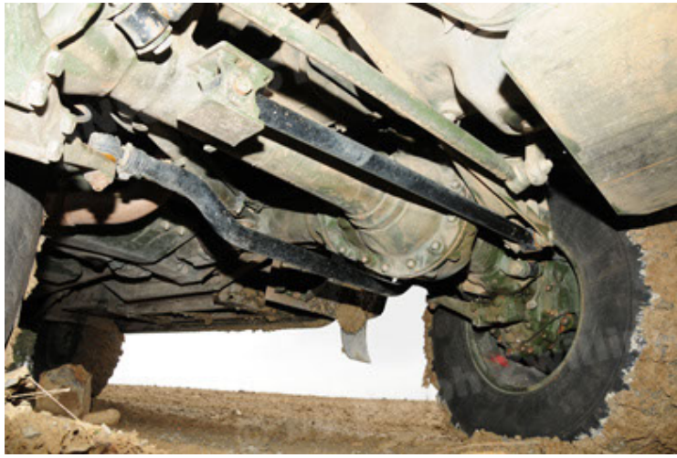
Dingo 2 GE A2 PatSich (79).JPG