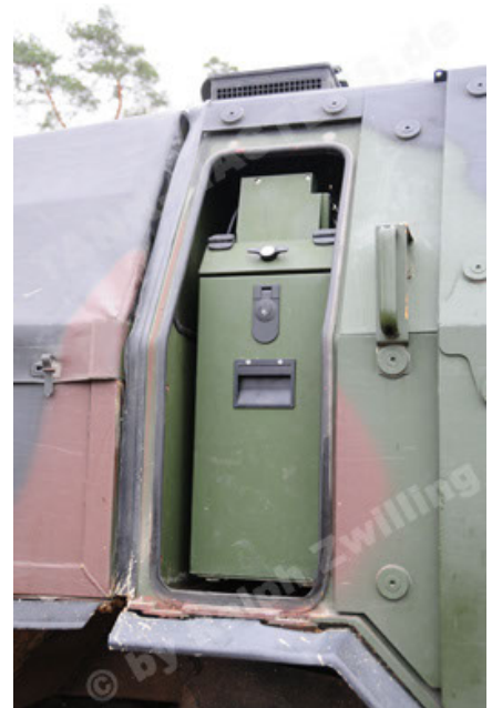
Dingo 2 GE A2 PatSich (58).JPG