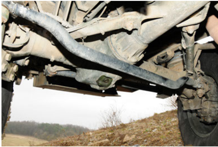
Dingo 2 GE A2 PatSich (87).JPG