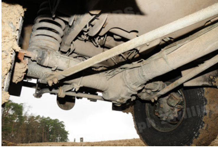
Dingo 2 GE A2 PatSich (85).JPG