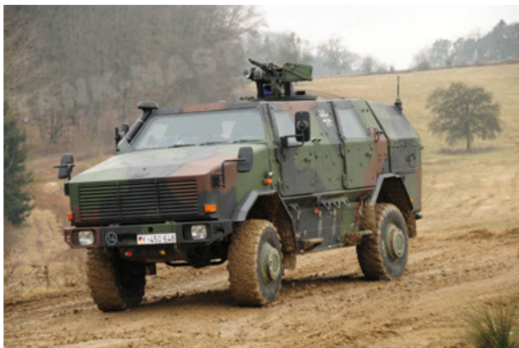
Dingo 2 GE A2 PatSich (35).JPG