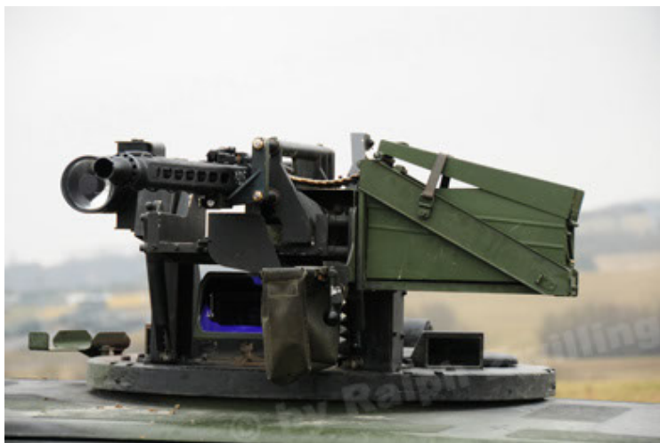
Dingo 2 GE A2 PatSich (107).JPG