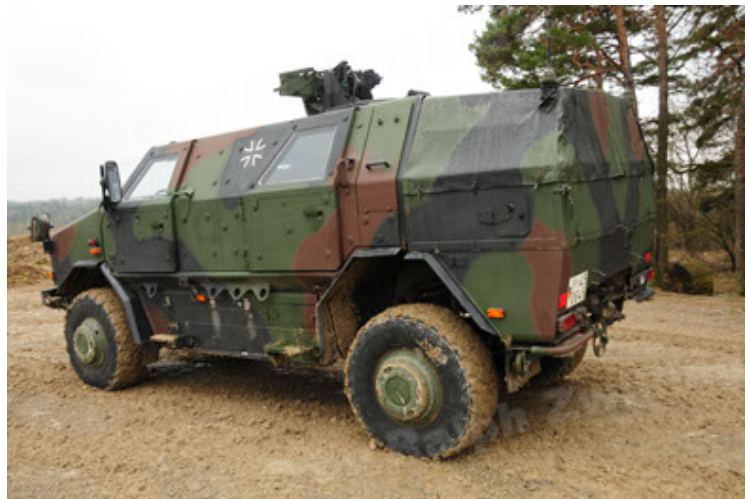
Dingo 2 GE A2 PatSich (28).JPG