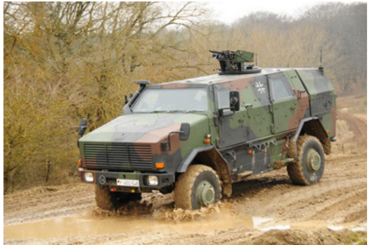
Dingo 2 GE A2 PatSich (34).JPG