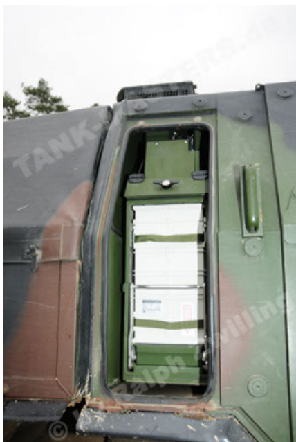
Dingo 2 GE A2 PatSich (59).JPG