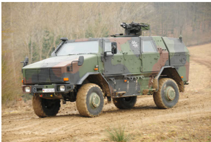
Dingo 2 GE A2 PatSich (47).JPG