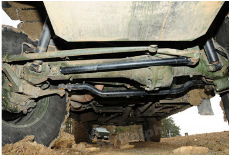
Dingo 2 GE A2 PatSich (61).JPG