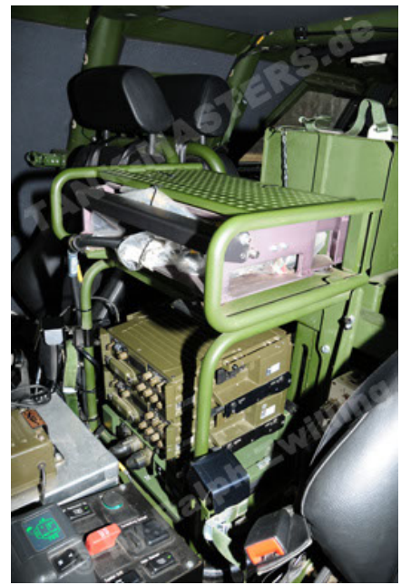
Dingo 2 GE A2 PatSich (104).JPG