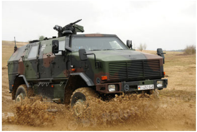
Dingo 2 GE A2 PatSich (32).JPG