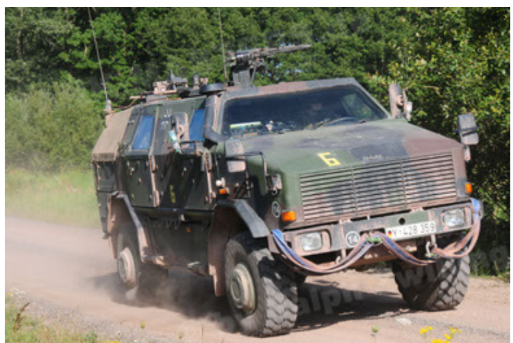
Dingo 2 GE A2 PatSich (6).JPG