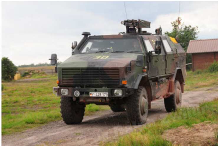
Dingo 2 GE A2 PatSich (21).JPG