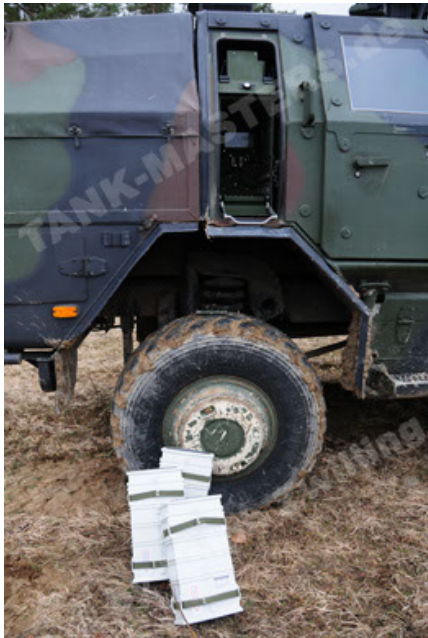
Dingo 2 GE A2 PatSich (57).JPG