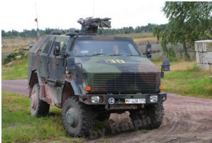
Dingo 2 GE A2 PatSich (9).JPG