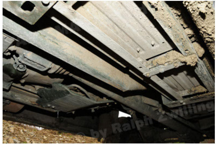
Dingo 2 GE A2 PatSich (88).JPG