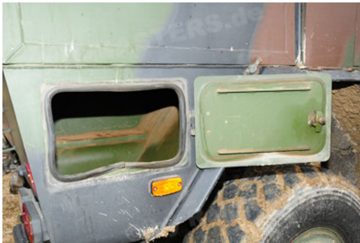
Dingo 2 GE A2 PatSich (111).JPG