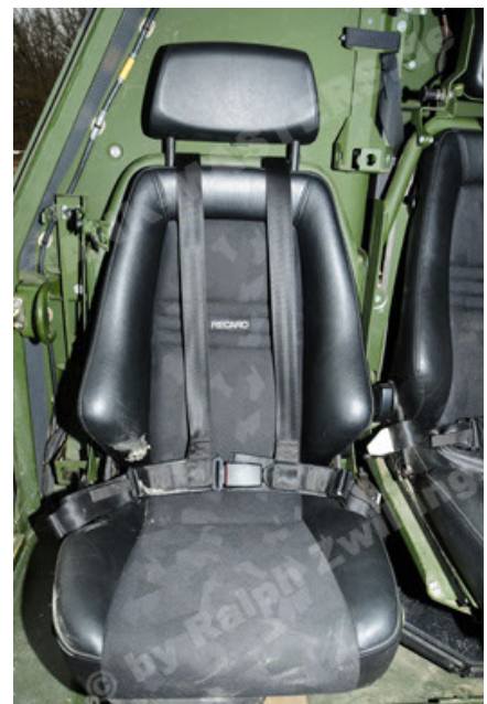
Dingo 2 GE A2 PatSich (66).JPG