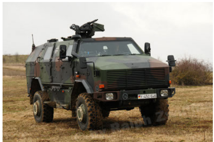
Dingo 2 GE A2 PatSich (54).JPG