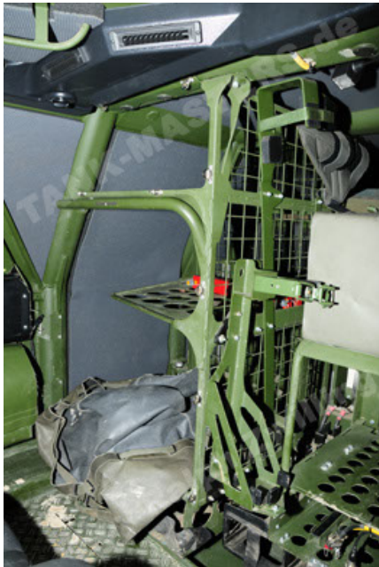
Dingo 2 GE A2 PatSich (99).JPG