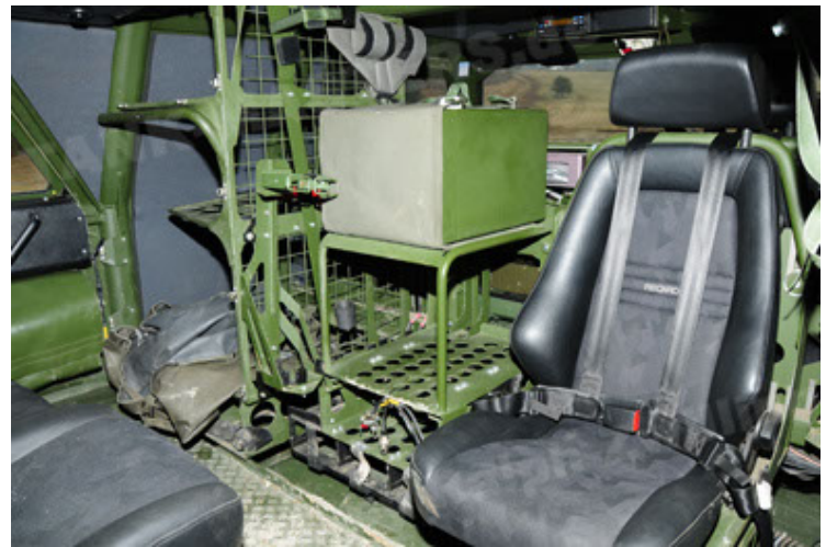
Dingo 2 GE A2 PatSich (70).JPG