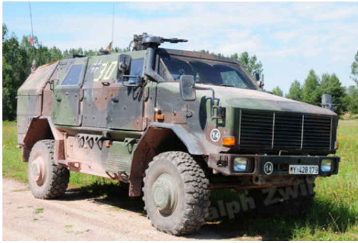
Dingo 2 GE A2 PatSich (19).JPG