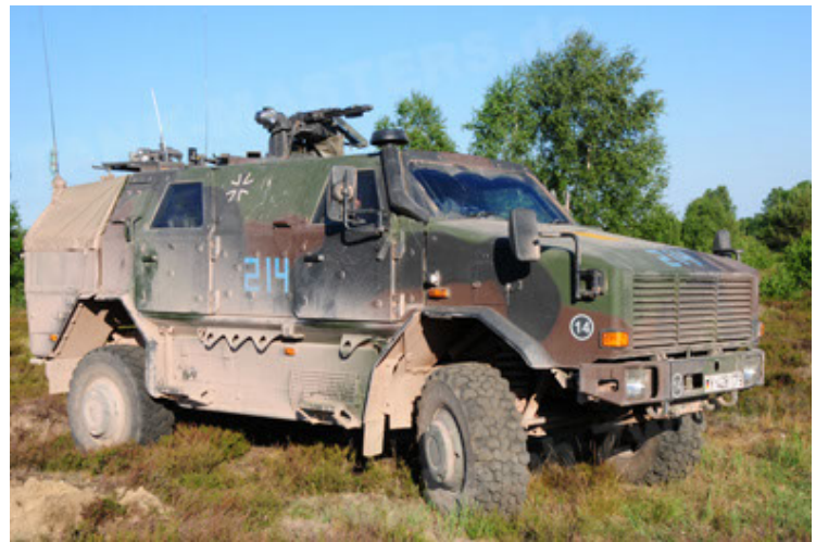
Dingo 2 GE A2 PatSich (16).JPG