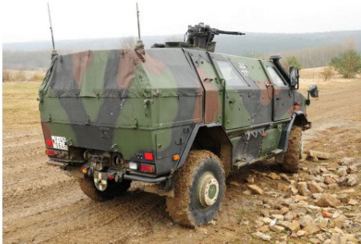
Dingo 2 GE A2 PatSich (27).JPG