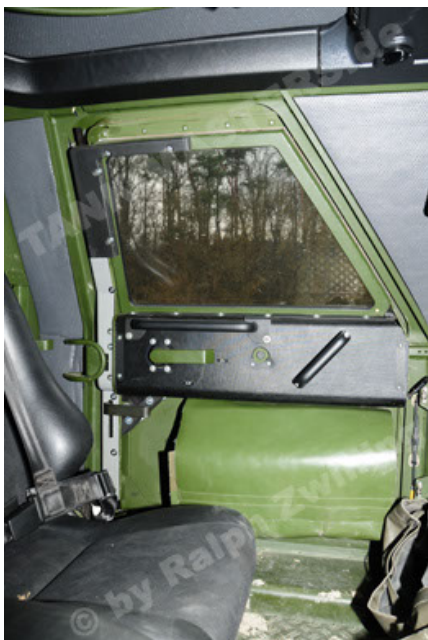
Dingo 2 GE A2 PatSich (101).JPG