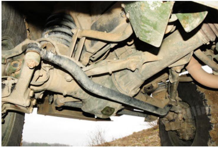
Dingo 2 GE A2 PatSich (63).JPG