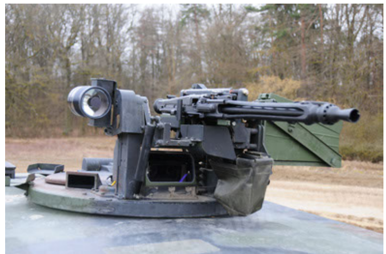
Dingo 2 GE A2 PatSich (72).JPG