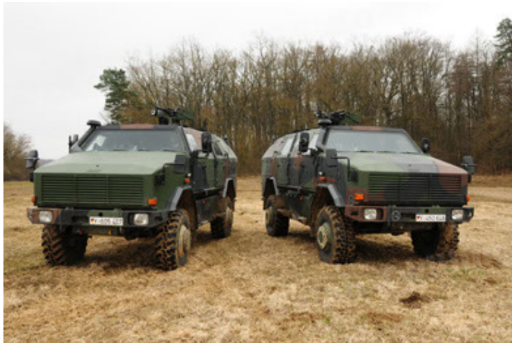
Dingo 2 GE A2 PatSich (33).JPG