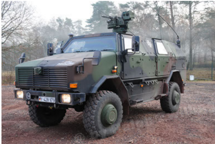
Dingo 2 GE A3.2 PersMatTrsp (3).JPG