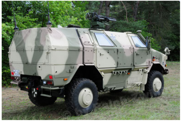
Dingo 2 GE A3.2 PersMatTrsp (8).JPG