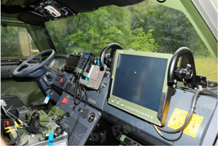
Dingo 2 GE A3.2 PersMatTrsp (38).JPG