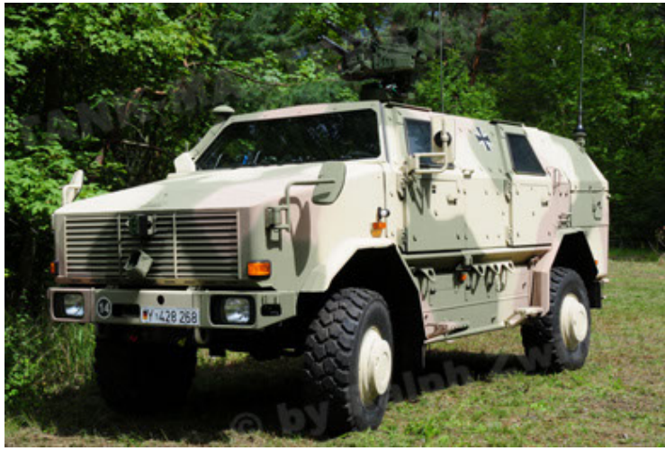
Dingo 2 GE A3.2 PersMatTrsp (1).JPG