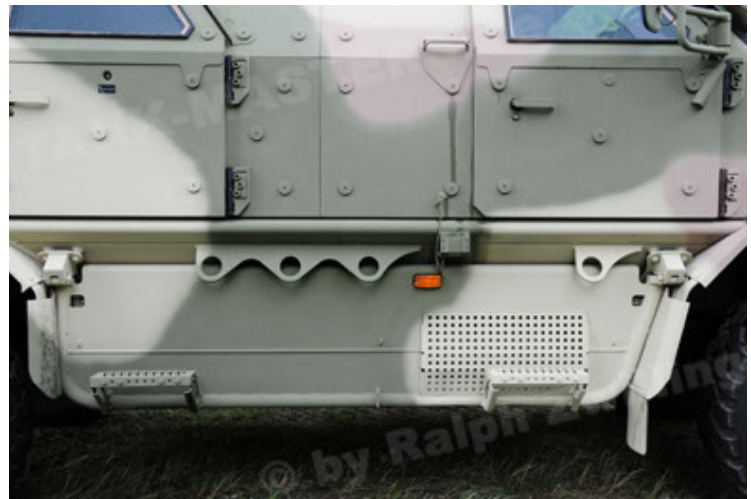
Dingo 2 GE A3.2 PersMatTrsp (22).JPG