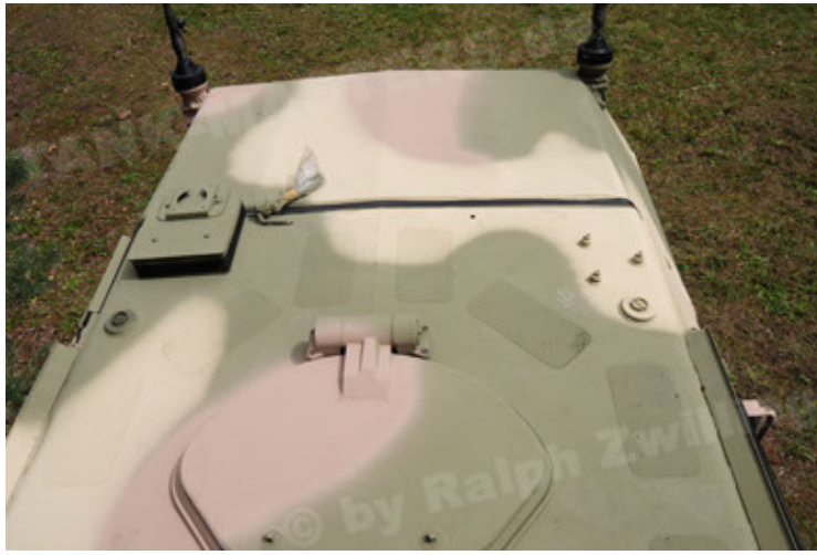
Dingo 2 GE A3.2 PersMatTrsp (25).JPG