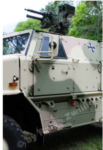
Dingo 2 GE A3.2 PersMatTrsp (28).JPG