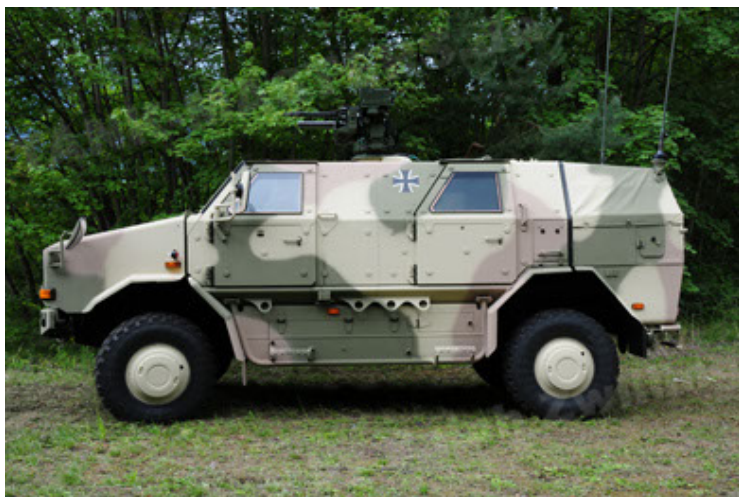
Dingo 2 GE A3.2 PersMatTrsp (5).JPG