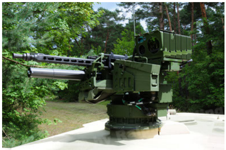
Dingo 2 GE A3.2 PersMatTrsp (18).JPG