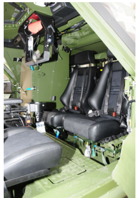
Dingo 2 GE A3.2 PersMatTrsp (36).JPG