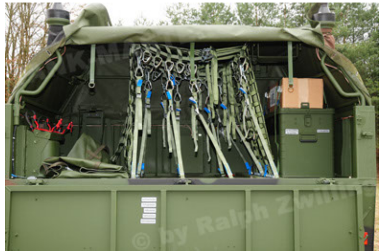
Dingo 2 GE A3.2 PersMatTrsp (34).JPG