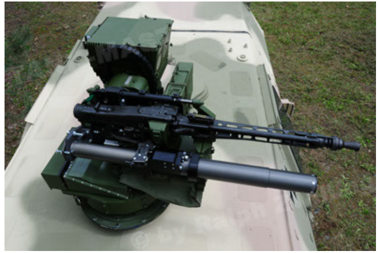
Dingo 2 GE A3.2 PersMatTrsp (20).JPG