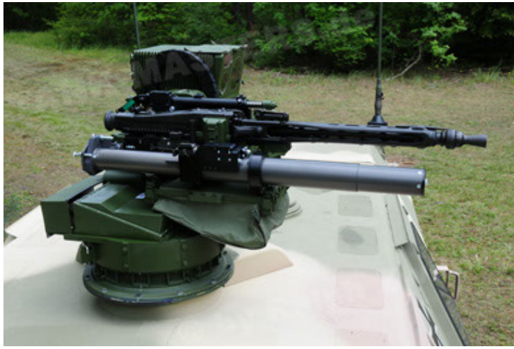
Dingo 2 GE A3.2 PersMatTrsp (19).JPG