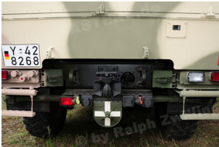
Dingo 2 GE A3.2 PersMatTrsp (33).JPG