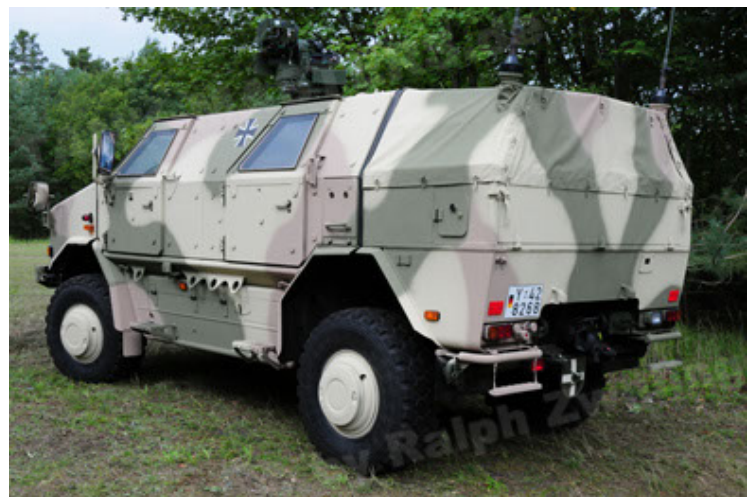
Dingo 2 GE A3.2 PersMatTrsp (6).JPG