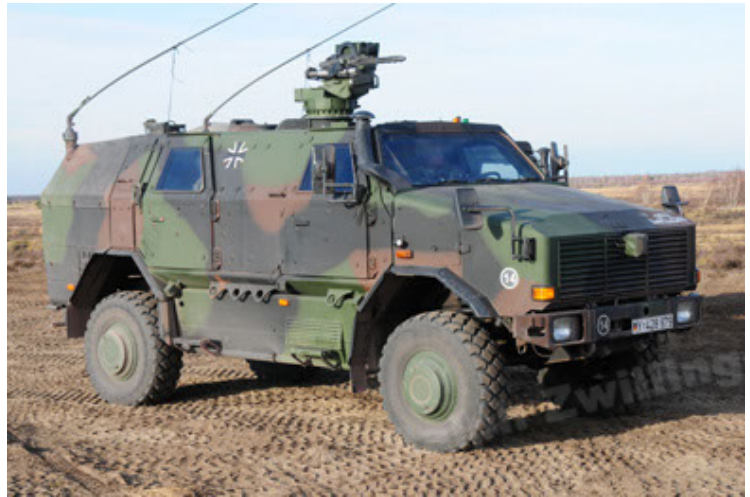
Dingo 2 GE A3.2 PersMatTrsp (16).JPG