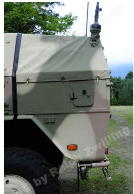
Dingo 2 GE A3.2 PersMatTrsp (30).JPG