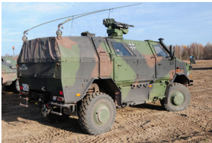
Dingo 2 GE A3.2 PersMatTrsp (11).JPG