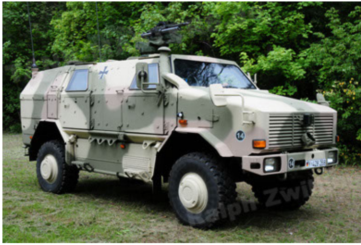
Dingo 2 GE A3.2 PersMatTrsp (7).JPG