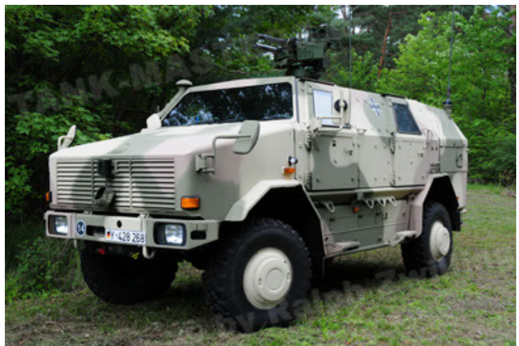
Dingo 2 GE A3.2 PersMatTrsp (12).JPG