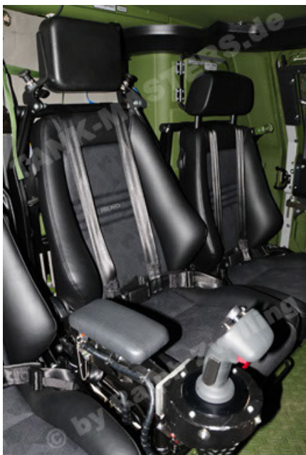
Dingo 2 GE A3.2 PersMatTrsp (35).JPG