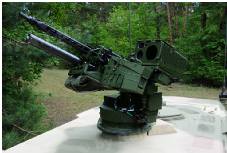
Dingo 2 GE A3.2 PersMatTrsp (17).JPG