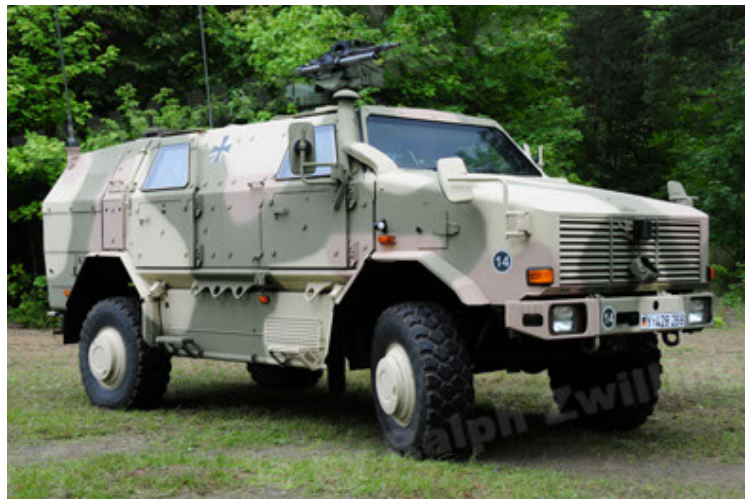
Dingo 2 GE A3.2 PersMatTrsp (10).JPG