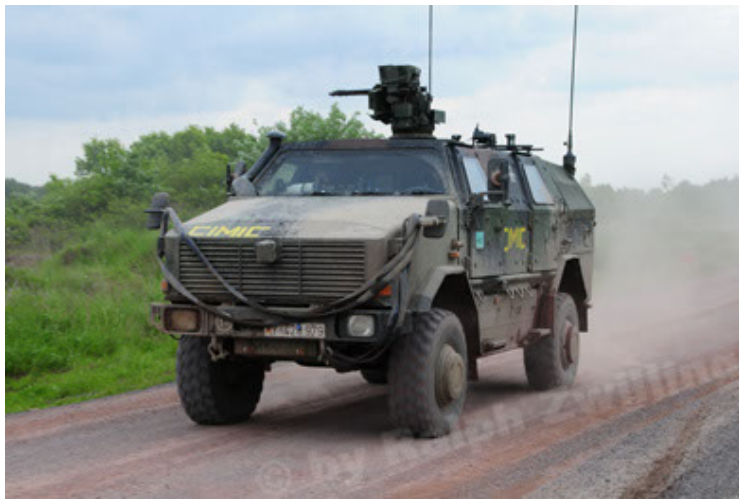
Dingo 2 GE A3.2 PersMatTrsp (9).JPG