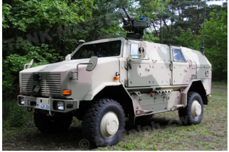
Dingo 2 GE A3.2 PersMatTrsp (14).JPG