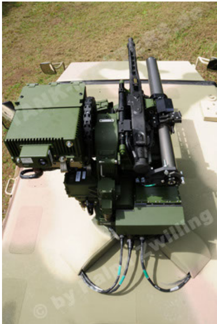
Dingo 2 GE A3.2 PersMatTrsp (27).JPG