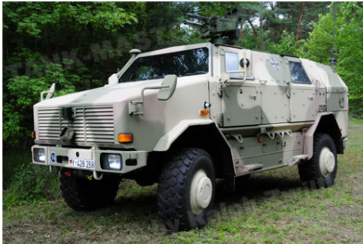
Dingo 2 GE A3.2 PersMatTrsp (15).JPG