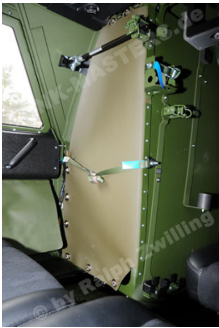
Dingo 2 GE A3.2 PersMatTrsp (37).JPG