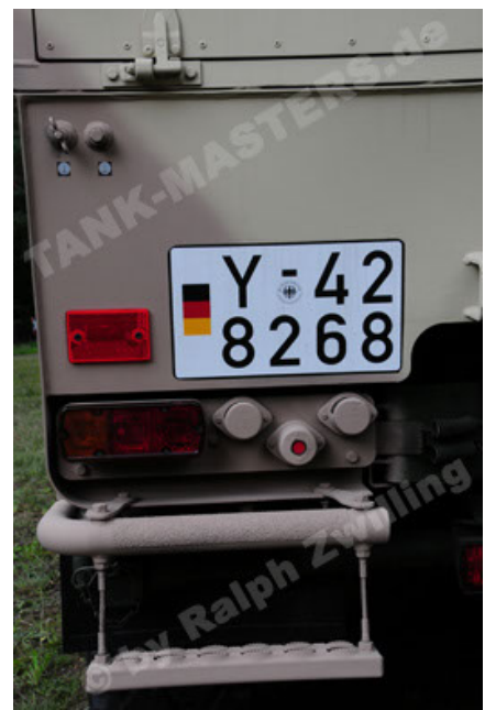
Dingo 2 GE A3.2 PersMatTrsp (32).JPG