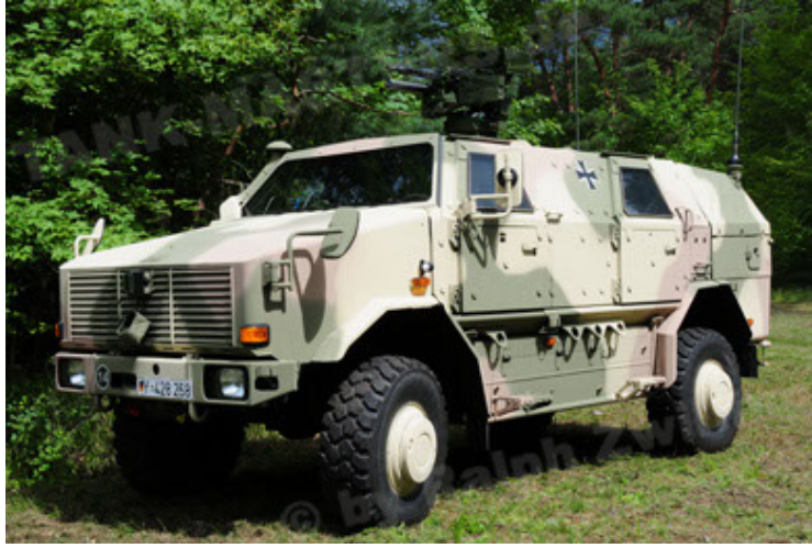
Dingo 2 GE A3.2 PersMatTrsp (13).JPG