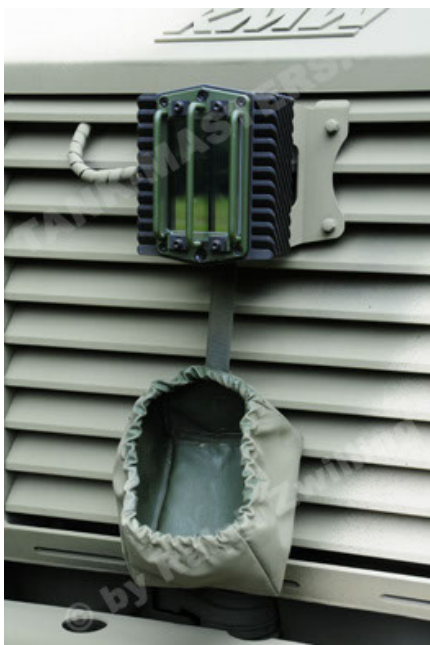
Dingo 2 GE A3.2 PersMatTrsp (31).JPG