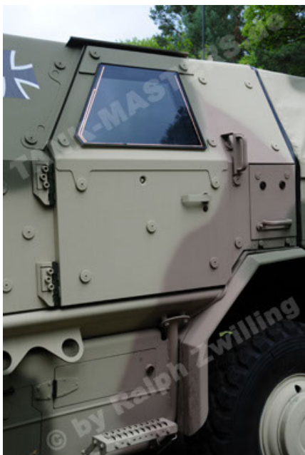
Dingo 2 GE A3.2 PersMatTrsp (29).JPG