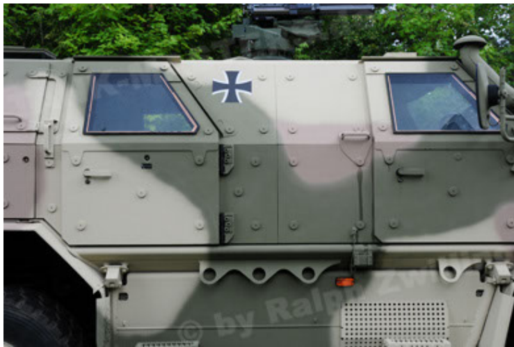
Dingo 2 GE A3.2 PersMatTrsp (21).JPG