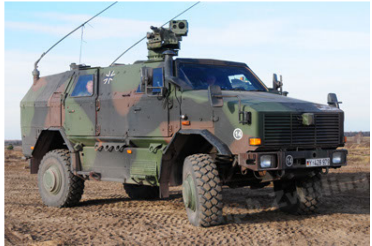
Dingo 2 GE A3.2 PersMatTrsp (4).JPG