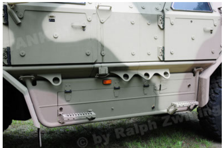
Dingo 2 GE A3.2 PersMatTrsp (24).JPG