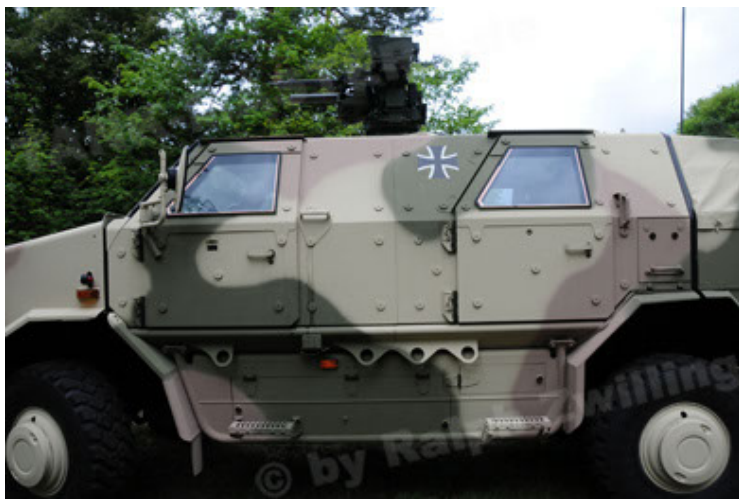
Dingo 2 GE A3.2 PersMatTrsp (23).JPG