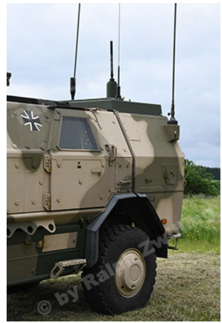
Dingo 2 GE A3.4 CG-13 (62).JPG