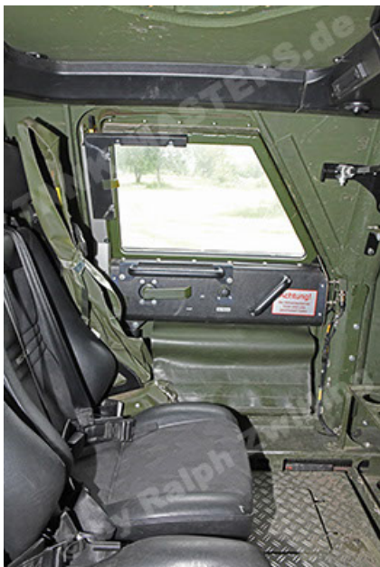
Dingo 2 GE A3.4 CG-13 (173).JPG