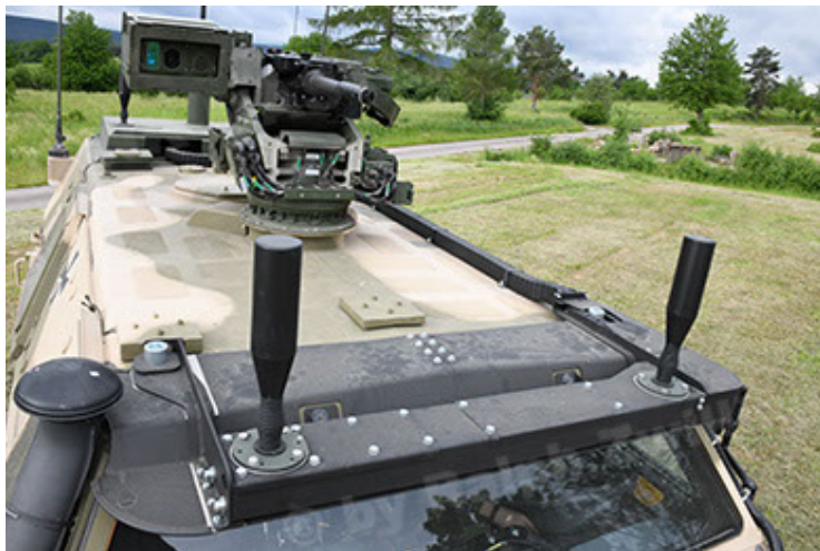
Dingo 2 GE A3.4 CG-13 (71).JPG