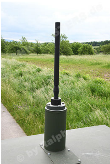
Dingo 2 GE A3.4 CG-13 (113).JPG