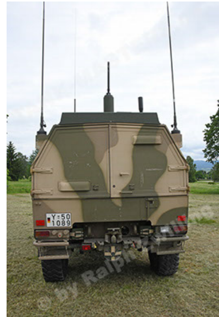
Dingo 2 GE A3.4 CG-13 (46).JPG