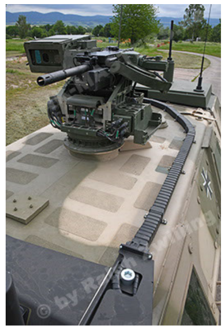
Dingo 2 GE A3.4 CG-13 (92).JPG