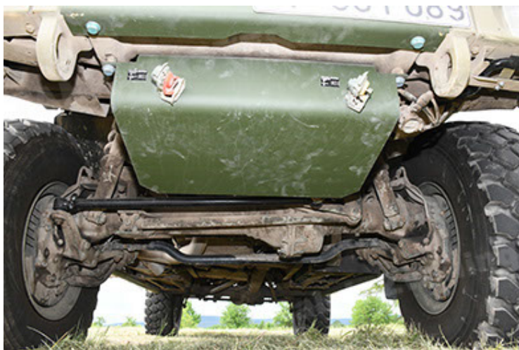
Dingo 2 GE A3.4 CG-13 (125).JPG