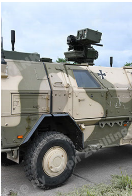
Dingo 2 GE A3.4 CG-13 (59).JPG