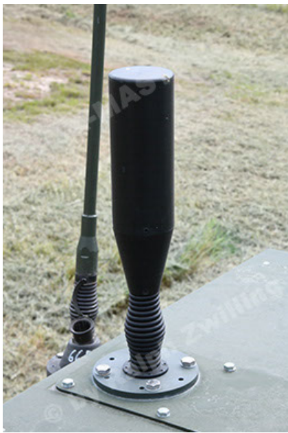
Dingo 2 GE A3.4 CG-13 (109).JPG