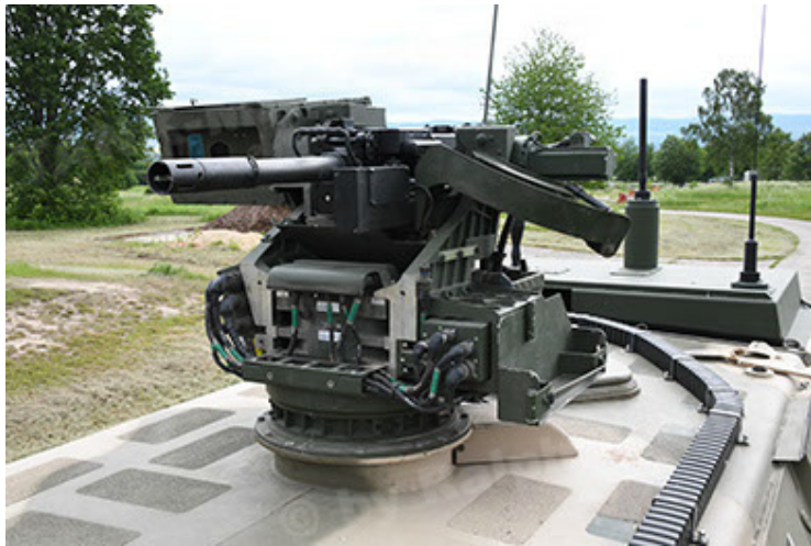
Dingo 2 GE A3.4 CG-13 (87).JPG