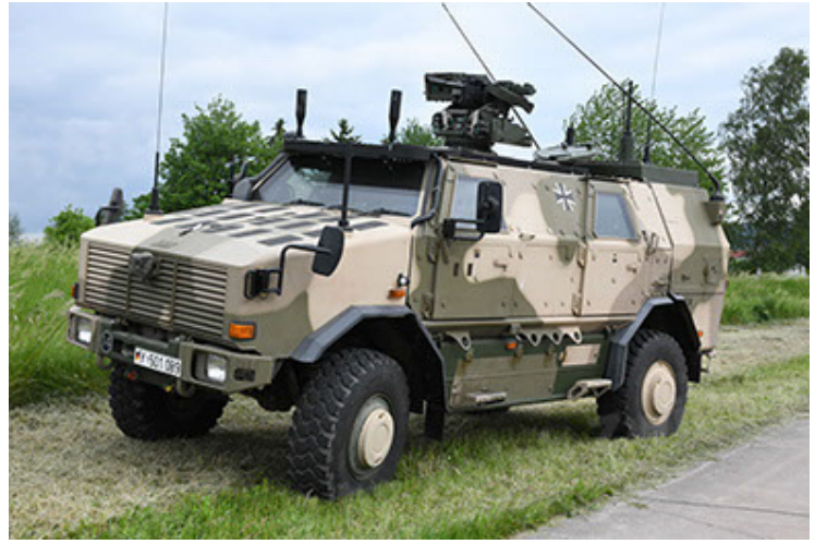
Dingo 2 GE A3.4 CG-13 (8).JPG