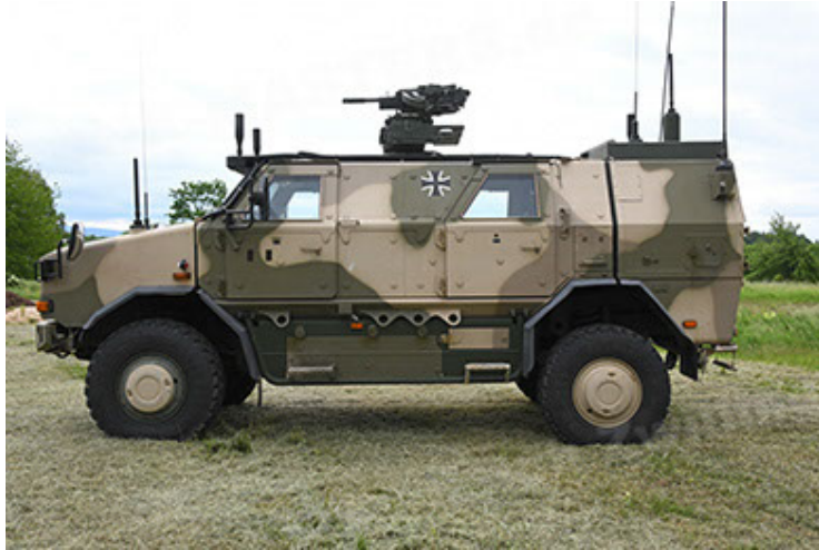
Dingo 2 GE A3.4 CG-13 (39).JPG