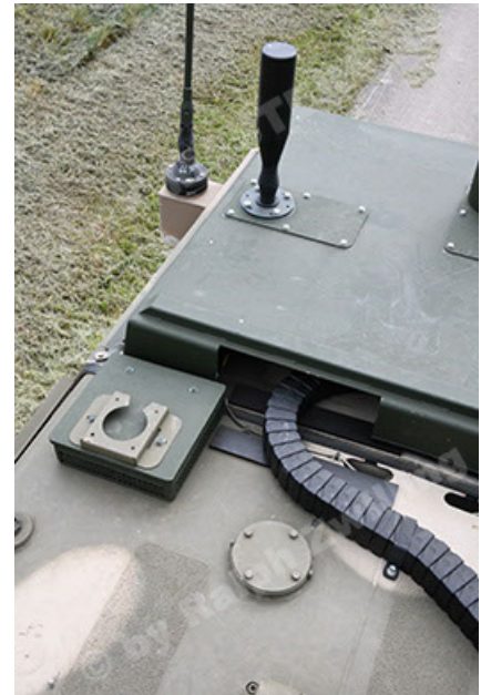
Dingo 2 GE A3.4 CG-13 (106).JPG