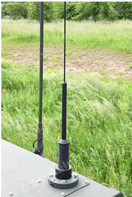
Dingo 2 GE A3.4 CG-13 (111).JPG