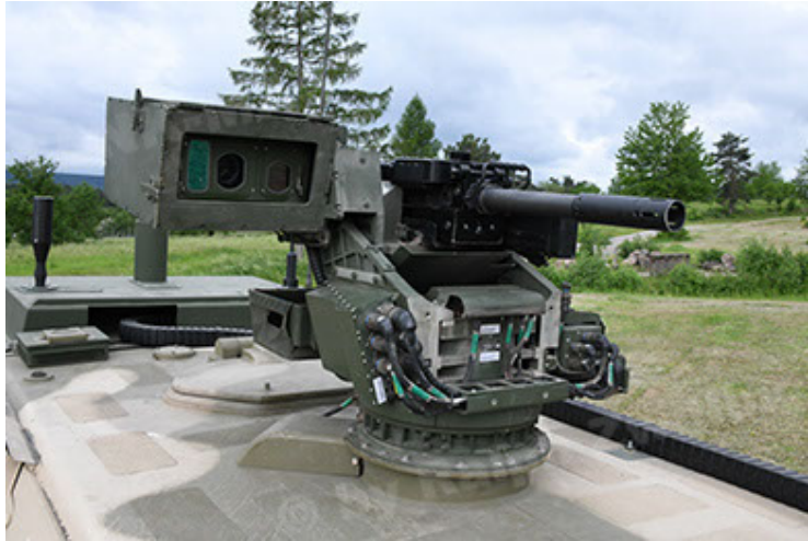
Dingo 2 GE A3.4 CG-13 (75).JPG