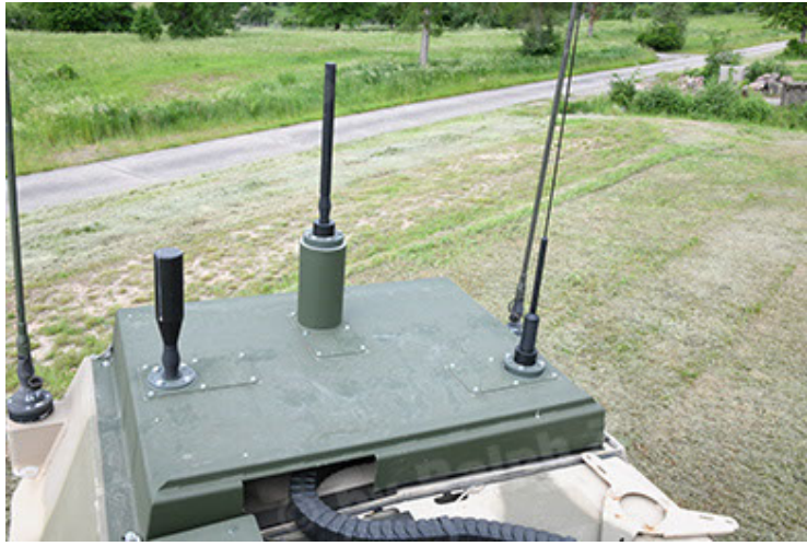
Dingo 2 GE A3.4 CG-13 (97).JPG