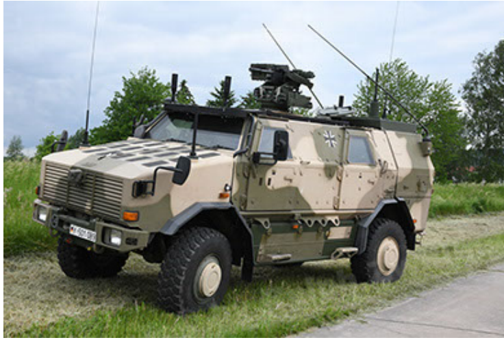
Dingo 2 GE A3.4 CG-13 (15).JPG