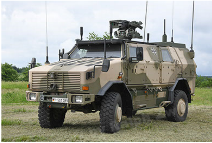
Dingo 2 GE A3.4 C-13 (1).JPG