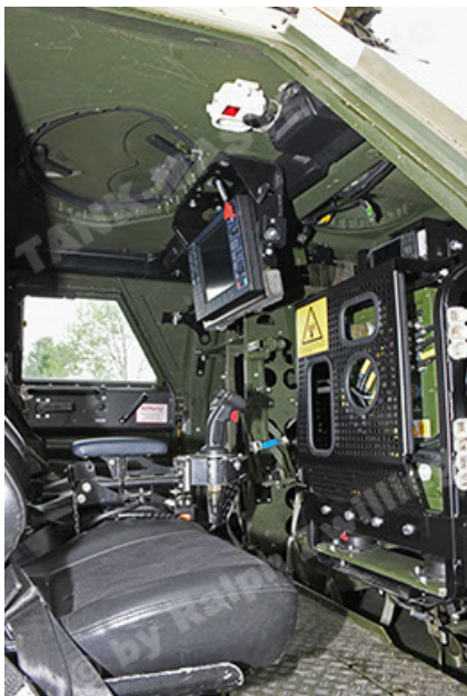
Dingo 2 GE A3.4 CG-13 (137).JPG