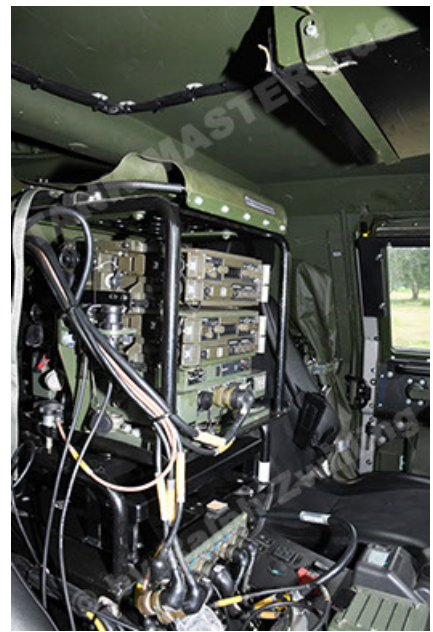
Dingo 2 GE A3.4 CG-13 (146).JPG