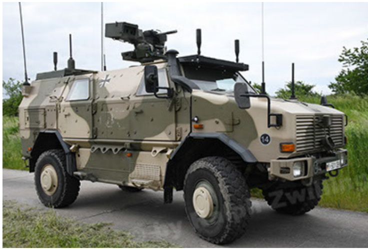
Dingo 2 GE A3.4 CG-13 (31).JPG