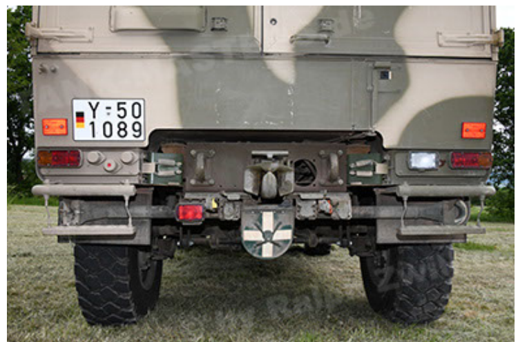
Dingo 2 GE A3.4 CG-13 (66).JPG