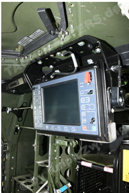
Dingo 2 GE A3.4 CG-13 (143).JPG