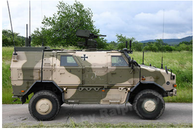
Dingo 2 GE A3.4 CG-13 (38).JPG