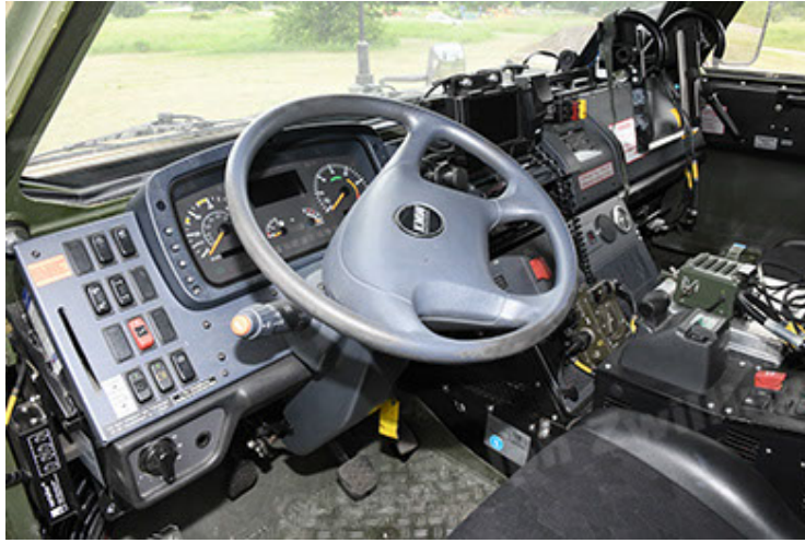
Dingo 2 GE A3.4 CG-13 (165).JPG