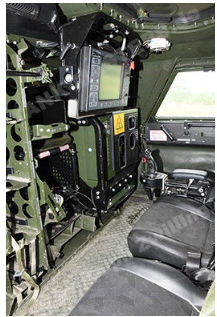
Dingo 2 GE A3.4 CG-13 (158).JPG