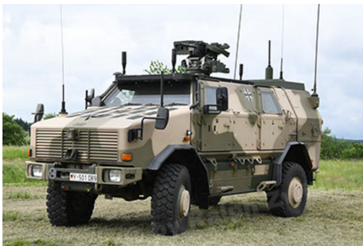
Dingo 2 GE A3.4 CG-13 (11).JPG