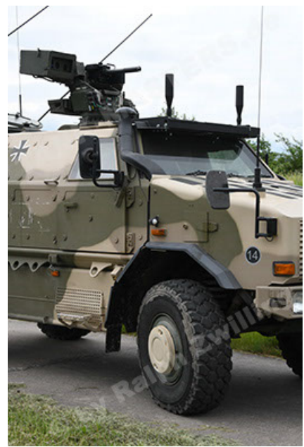
Dingo 2 GE A3.4 CG-13 (50).JPG