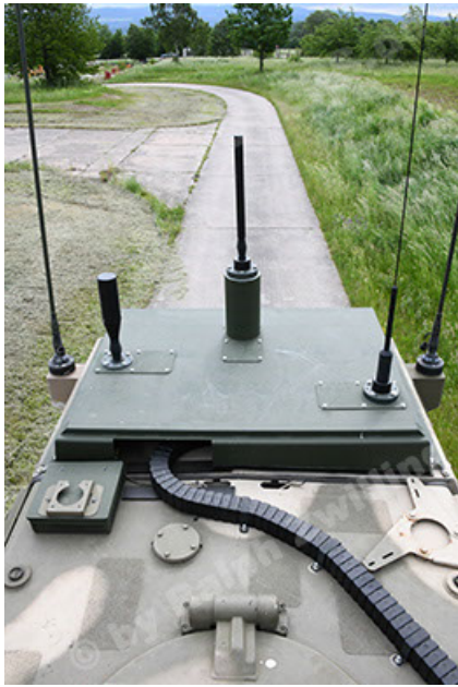
Dingo 2 GE A3.4 CG-13 (99).JPG