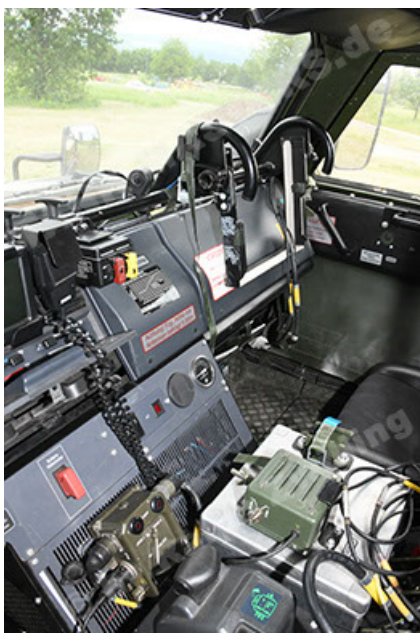
Dingo 2 GE A3.4 CG-13 (169).JPG