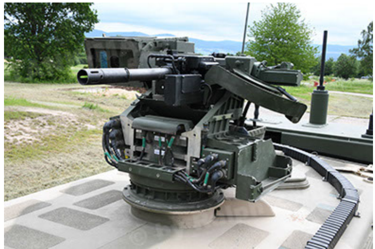
Dingo 2 GE A3.4 CG-13 (84).JPG