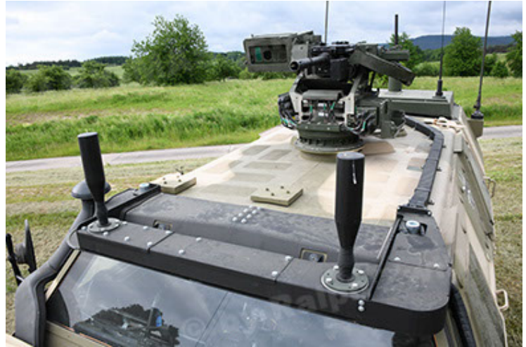
Dingo 2 GE A3.4 CG-13 (70).JPG