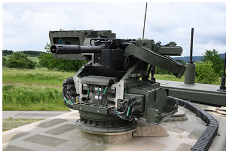
Dingo 2 GE A3.4 CG-13 (78).JPG