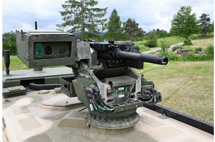
Dingo 2 GE A3.4 CG-13 (76).JPG