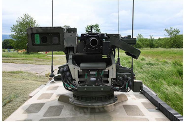
Dingo 2 GE A3.4 CG-13 (82).JPG