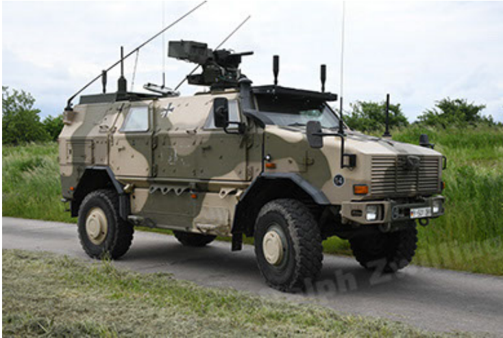
Dingo 2 GE A3.4 CG-13 (27).JPG