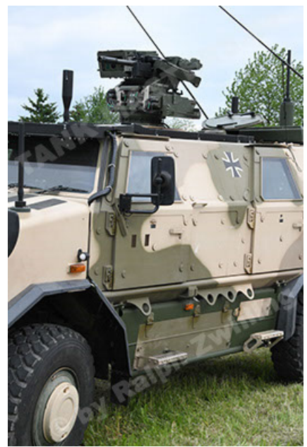
Dingo 2 GE A3.4 CG-13 (56).JPG