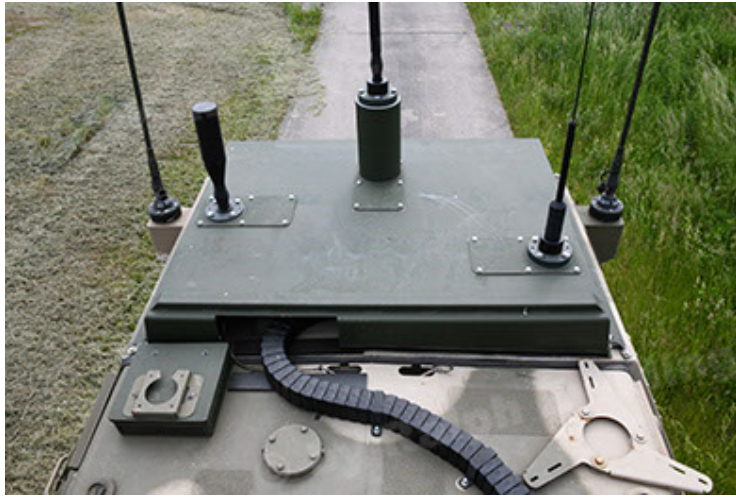
Dingo 2 GE A3.4 CG-13 (103).JPG