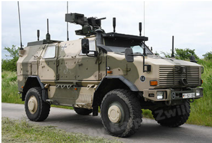
Dingo 2 GE A3.4 CG-13 (33).JPG