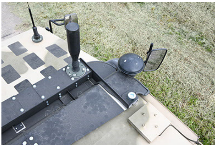
Dingo 2 GE A3.4 CG-13 (119).JPG