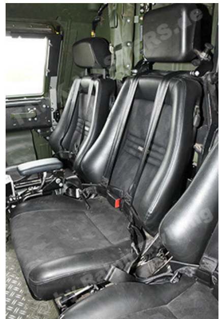
Dingo 2 GE A3.4 CG-13 (162).JPG