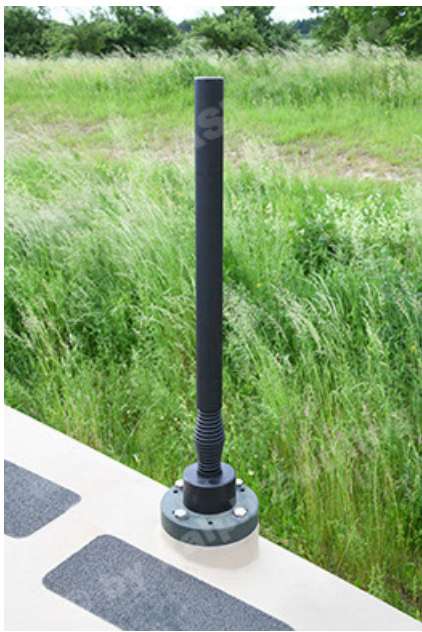
Dingo 2 GE A3.4 CG-13 (115).JPG