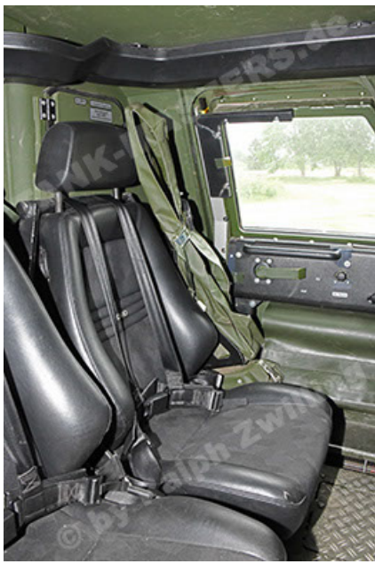
Dingo 2 GE A3.4 CG-13 (175).JPG