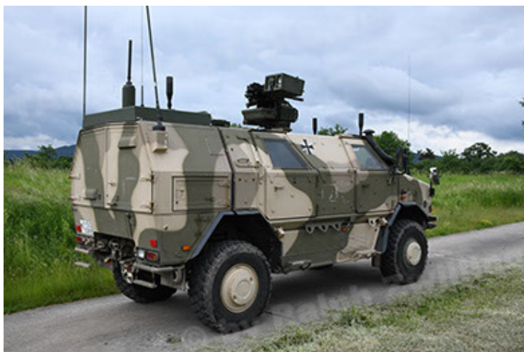
Dingo 2 GE A3.4 CG-13 (41).JPG