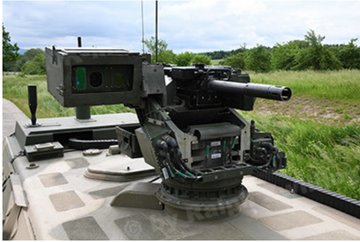
Dingo 2 GE A3.4 CG-13 (81).JPG