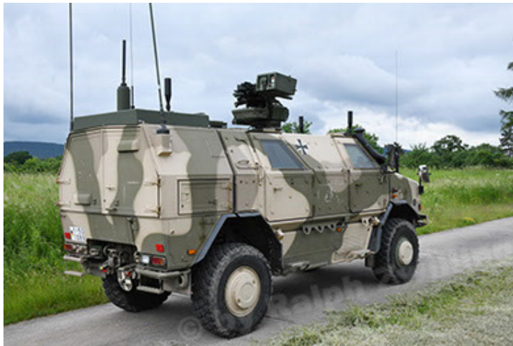
Dingo 2 GE A3.4 C-13 (3).JPG