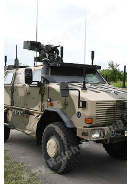
Dingo 2 GE A3.4 CG-13 (48).JPG