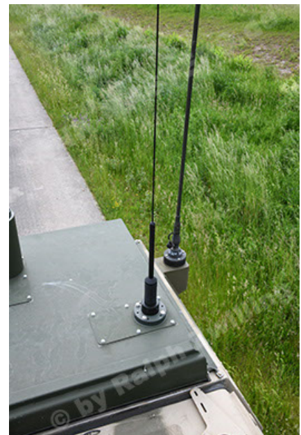
Dingo 2 GE A3.4 CG-13 (108).JPG