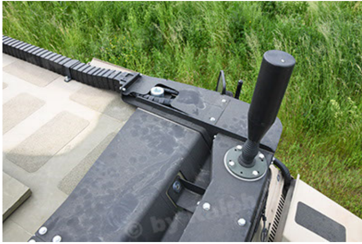
Dingo 2 GE A3.4 CG-13 (121).JPG