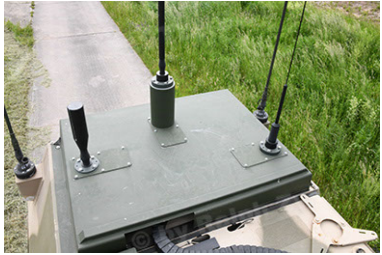
Dingo 2 GE A3.4 CG-13 (104).JPG