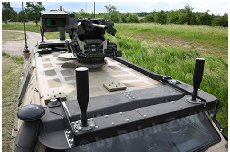
Dingo 2 GE A3.4 CG-13 (72).JPG