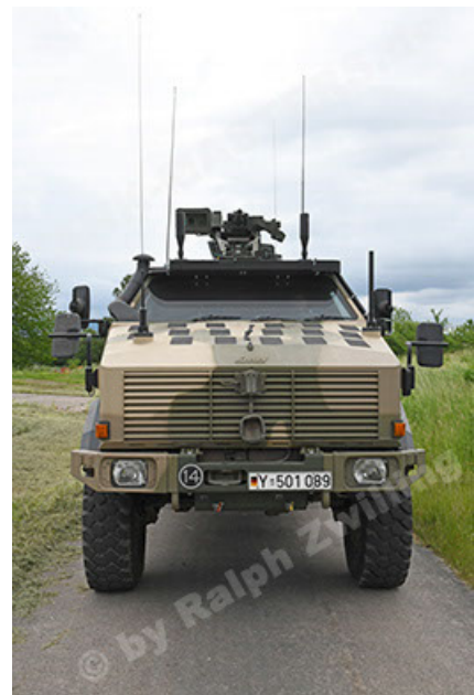
Dingo 2 GE A3.4 CG-13 (44).JPG