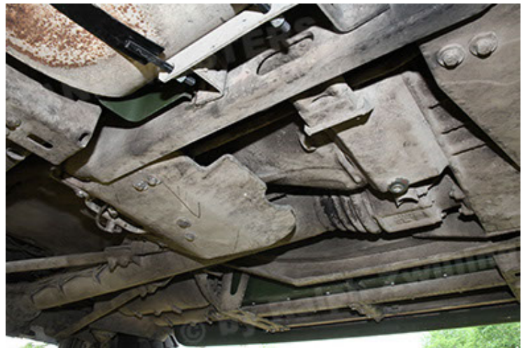
Dingo 2 GE A3.4 CG-13 (132).JPG