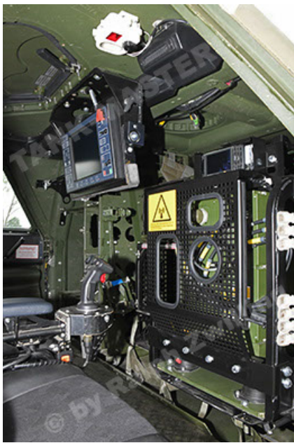
Dingo 2 GE A3.4 CG-13 (139).JPG