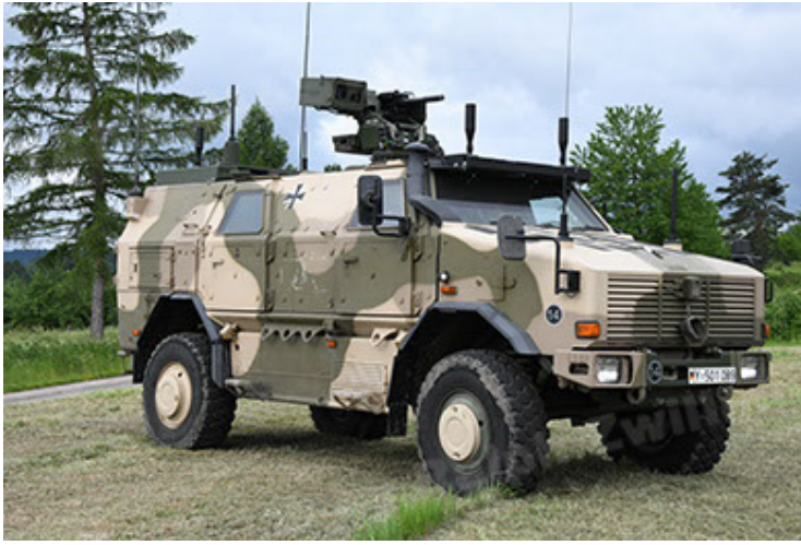
Dingo 2 GE A3.4 CG-13 (25).JPG