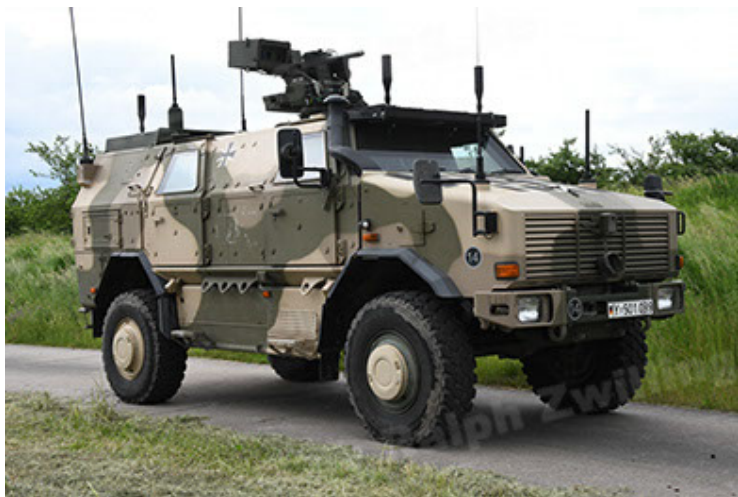
Dingo 2 GE A3.4 CG-13 (19).JPG