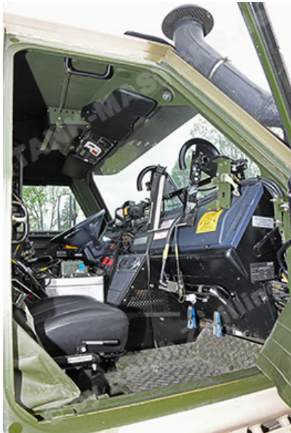
Dingo 2 GE A3.4 CG-13 (153).JPG