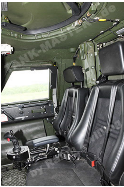
Dingo 2 GE A3.4 CG-13 (163).JPG