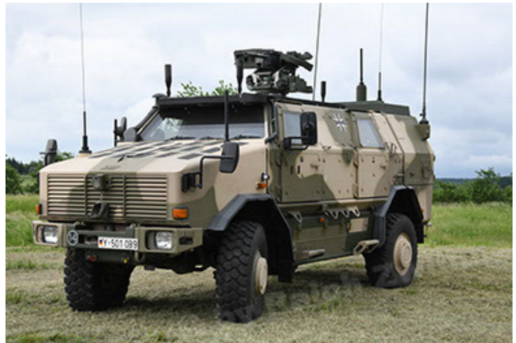
Dingo 2 GE A3.4 CG-13 (10).JPG