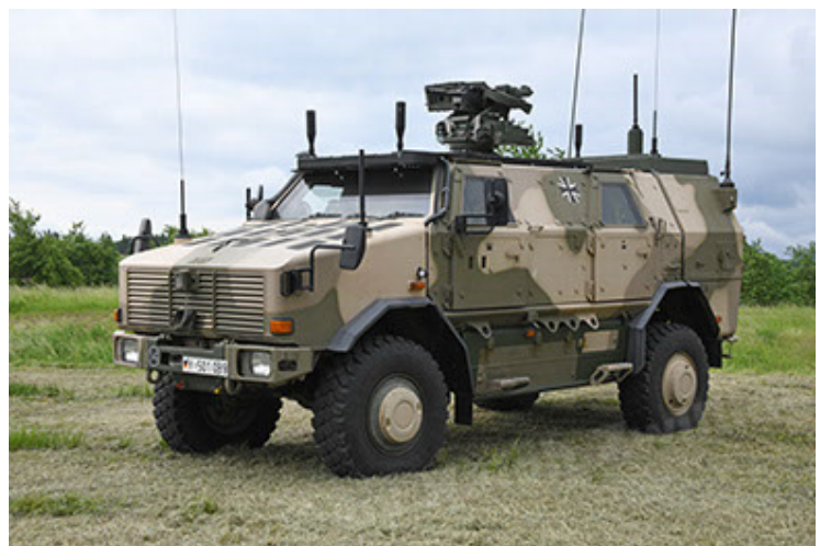
Dingo 2 GE A3.4 CG-13 (6).JPG