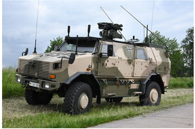
Dingo 2 GE A3.4 CG-13 (16).JPG