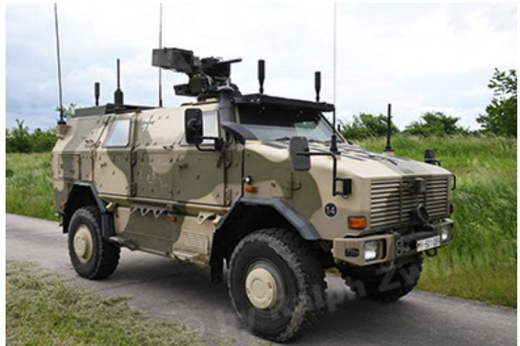
Dingo 2 GE A3.4 CG-13 (34).JPG