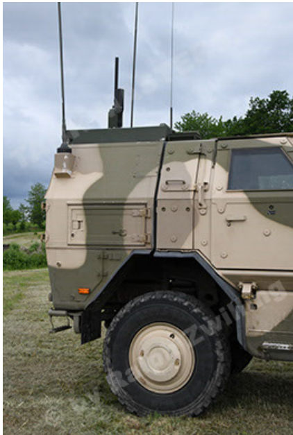
Dingo 2 GE A3.4 CG-13 (57).JPG