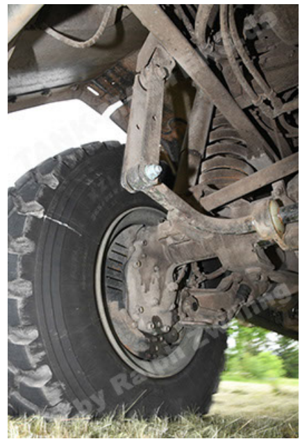
Dingo 2 GE A3.4 CG-13 (128).JPG