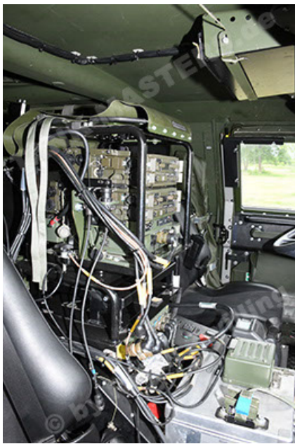
Dingo 2 GE A3.4 CG-13 (145).JPG