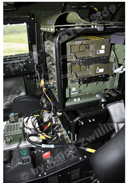
Dingo 2 GE A3.4 CG-13 (168).JPG