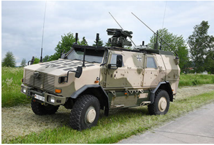
Dingo 2 GE A3.4 CG-13 (13).JPG