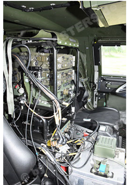
Dingo 2 GE A3.4 CG-13 (148).JPG