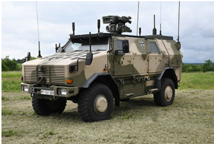
Dingo 2 GE A3.4 CG-13 (9).JPG