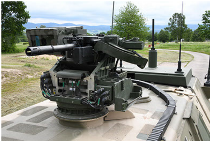
Dingo 2 GE A3.4 CG-13 (83).JPG