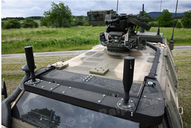
Dingo 2 GE A3.4 CG-13 (69).JPG