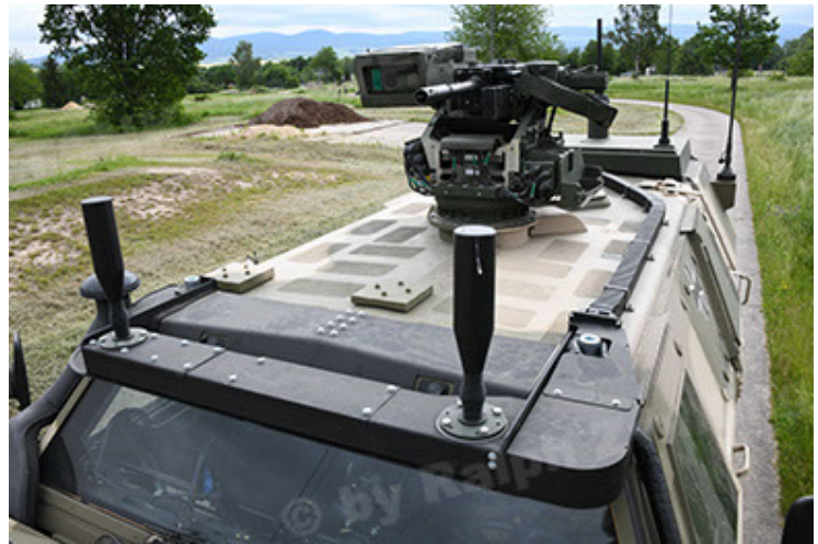
Dingo 2 GE A3.4 CG-13 (88).JPG