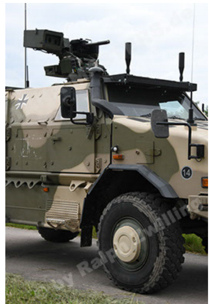
Dingo 2 GE A3.4 CG-13 (54).JPG