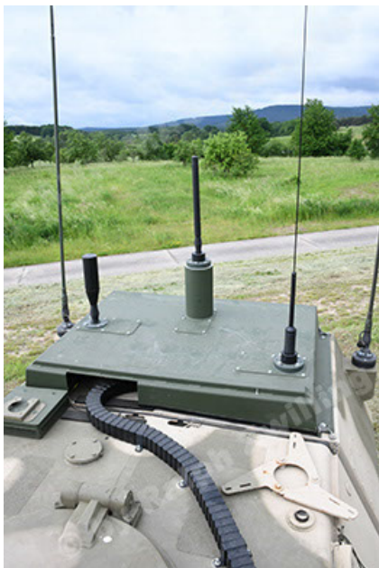
Dingo 2 GE A3.4 CG-13 (101).JPG