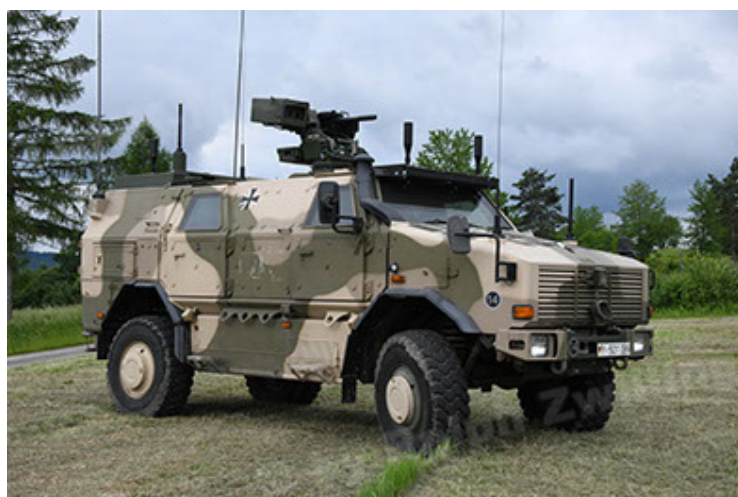
Dingo 2 GE A3.4 CG-13 (24).JPG