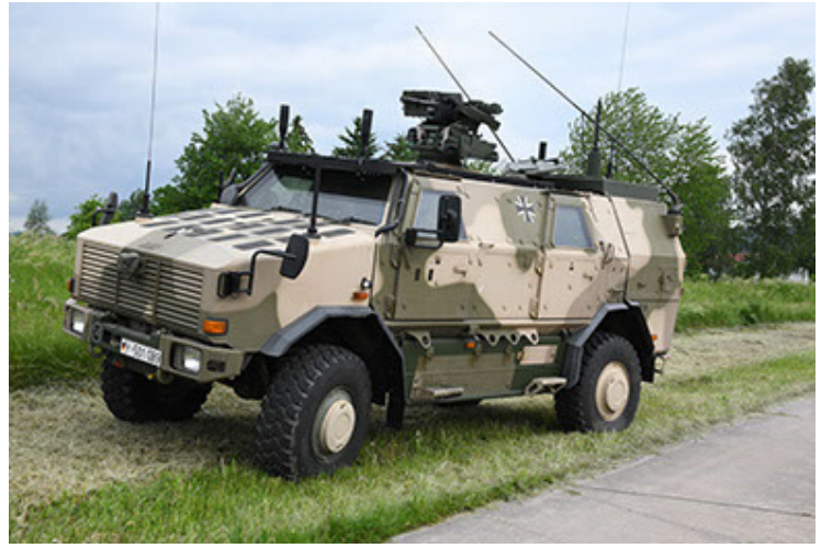
Dingo 2 GE A3.4 CG-13 (14).JPG