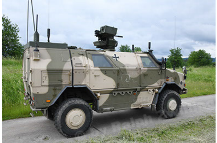
Dingo 2 GE A3.4 CG-13 (40).JPG