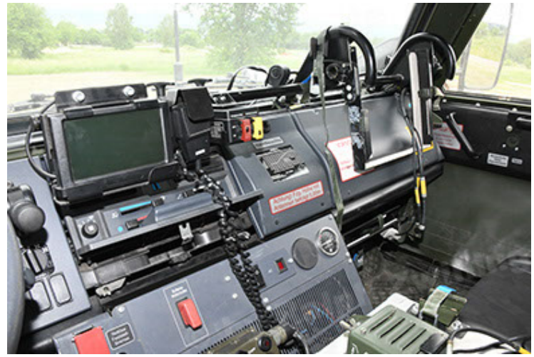
Dingo 2 GE A3.4 CG-13 (170).JPG