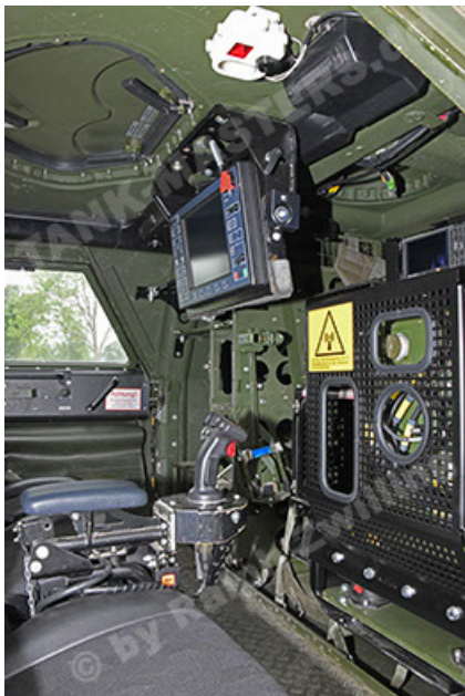
Dingo 2 GE A3.4 CG-13 (141).JPG