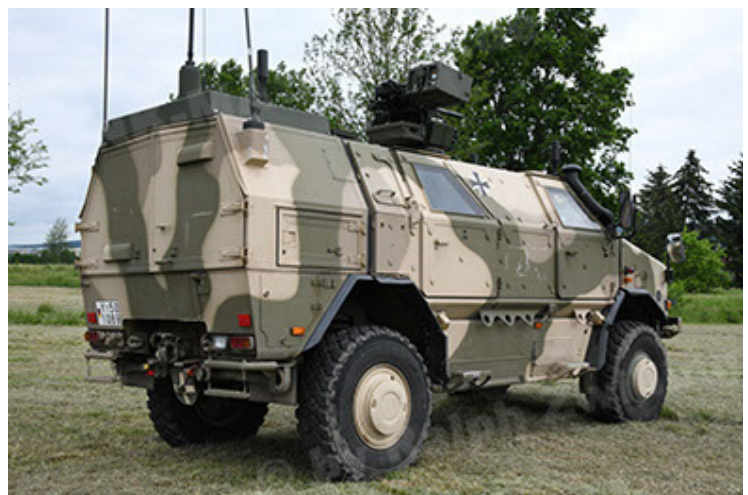
Dingo 2 GE A3.4 CG-13 (42).JPG