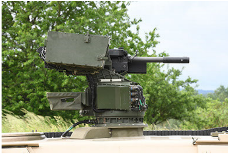
Dingo 2 GE A3.4 CG-13 (91).JPG