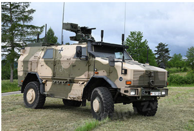
Dingo 2 GE A3.4 CG-13 (21).JPG