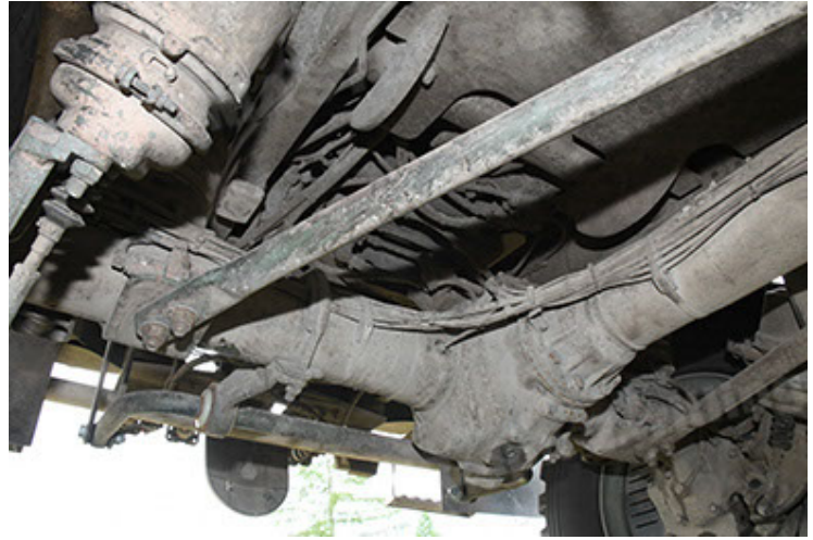
Dingo 2 GE A3.4 CG-13 (130).JPG