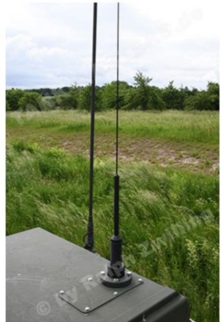
Dingo 2 GE A3.4 CG-13 (112).JPG