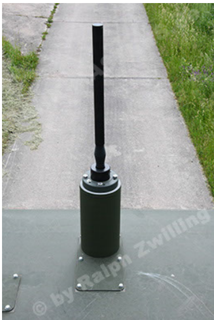
Dingo 2 GE A3.4 CG-13 (107).JPG