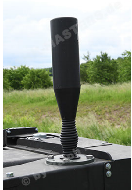
Dingo 2 GE A3.4 CG-13 (122).JPG