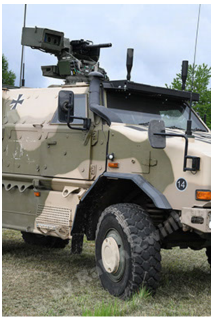
Dingo 2 GE A3.4 CG-13 (49).JPG