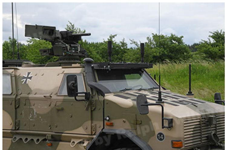
Dingo 2 GE A3.4 CG-13 (90).JPG