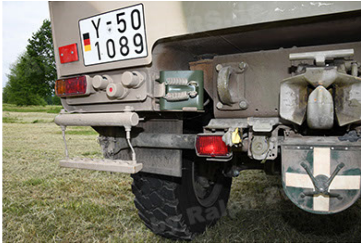
Dingo 2 GE A3.4 CG-13 (67).JPG