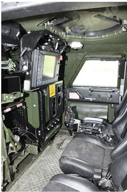
Dingo 2 GE A3.4 CG-13 (157).JPG