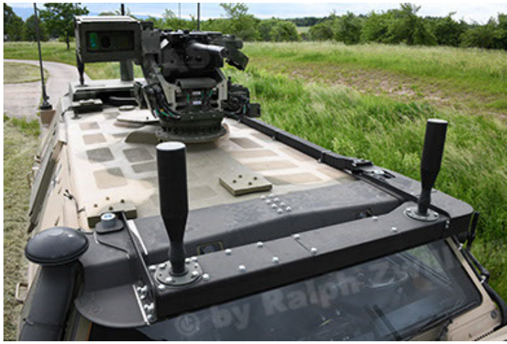
Dingo 2 GE A3.4 CG-13 (73).JPG