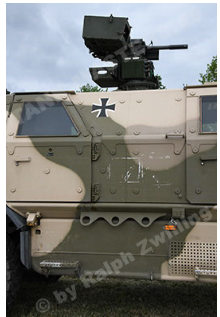
Dingo 2 GE A3.4 CG-13 (60).JPG