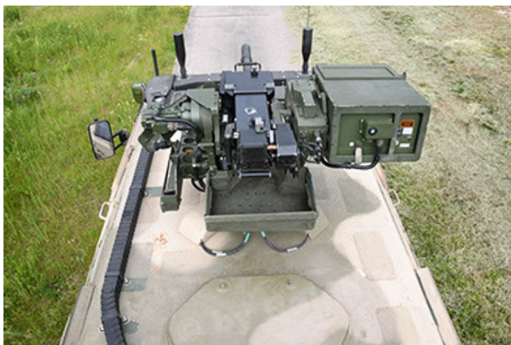
Dingo 2 GE A3.4 CG-13 (95).JPG