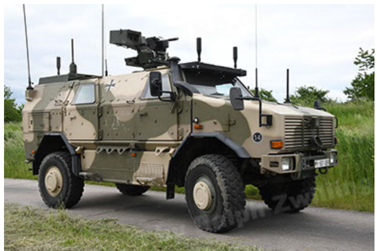
Dingo 2 GE A3.4 CG-13 (30).JPG