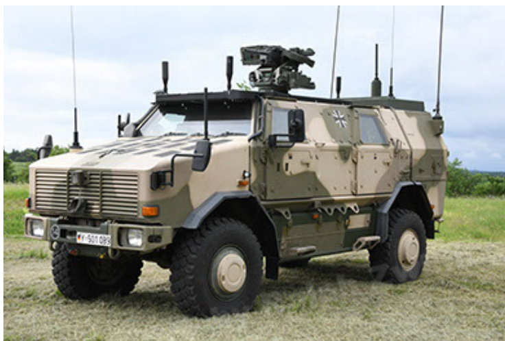
Dingo 2 GE A3.4 CG-13 (5).JPG