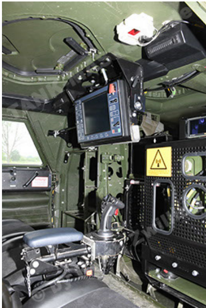
Dingo 2 GE A3.4 CG-13 (135).JPG