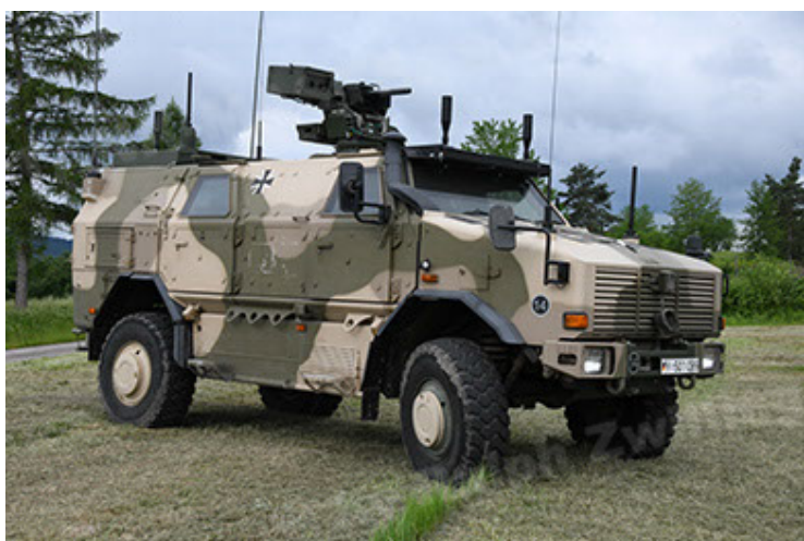
Dingo 2 GE A3.4 CG-13 (23).JPG