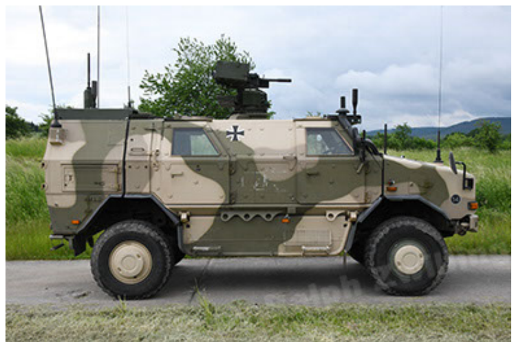
Dingo 2 GE A3.4 CG-13 (36).JPG