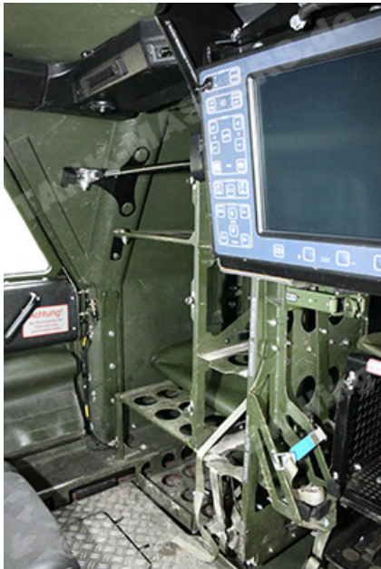
Dingo 2 GE A3.4 CG-13 (171).JPG