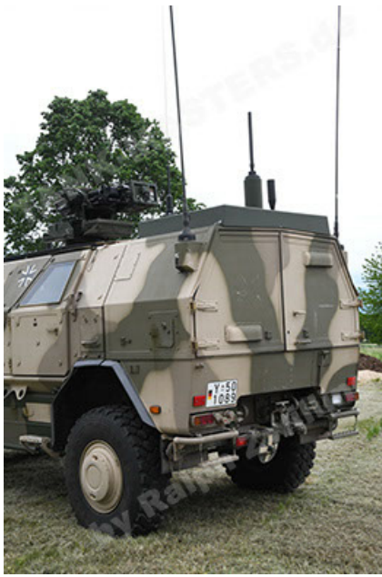
Dingo 2 GE A3.4 CG-13 (61).JPG