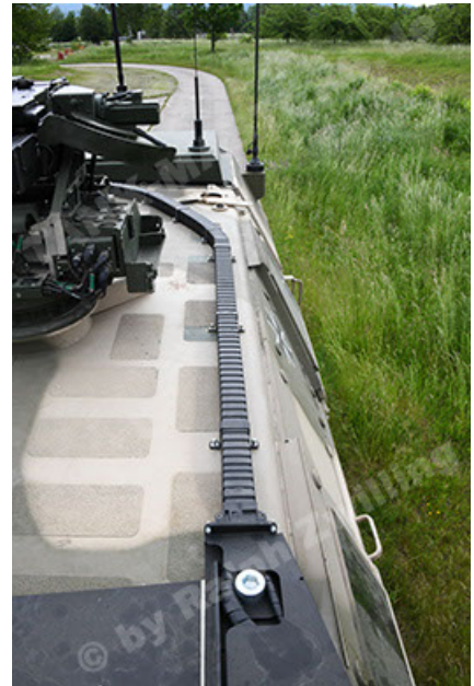
Dingo 2 GE A3.4 CG-13 (124).JPG