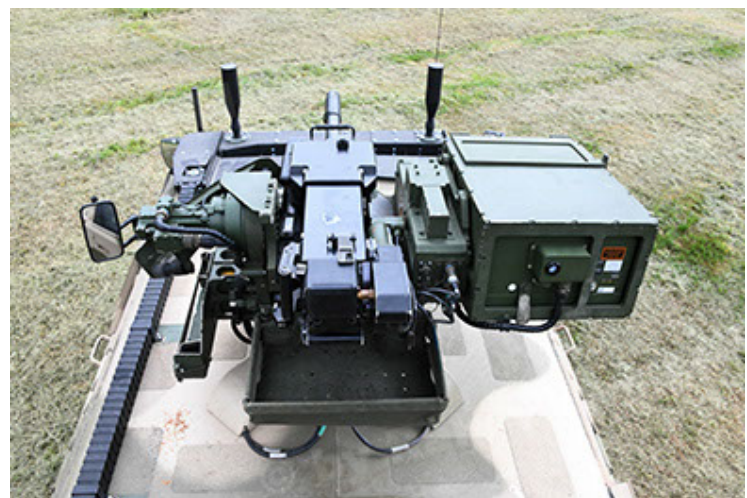
Dingo 2 GE A3.4 CG-13 (96).JPG