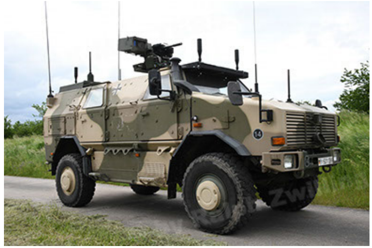
Dingo 2 GE A3.4 CG-13 (26).JPG