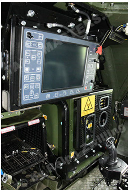
Dingo 2 GE A3.4 CG-13 (161).JPG