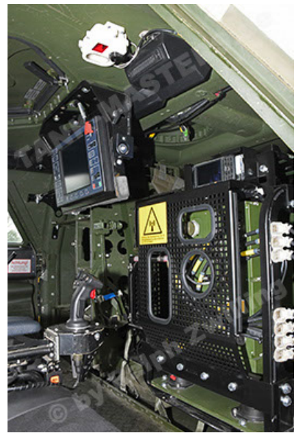
Dingo 2 GE A3.4 CG-13 (140).JPG