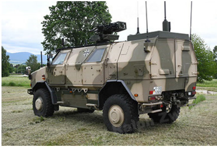
Dingo 2 GE A3.4 CG-13 (43).JPG