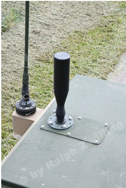
Dingo 2 GE A3.4 CG-13 (105).JPG