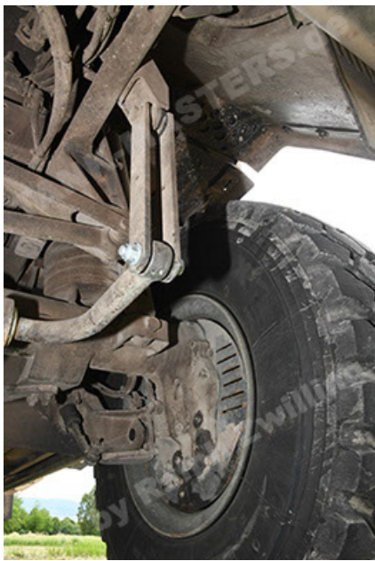
Dingo 2 GE A3.4 CG-13 (127).JPG