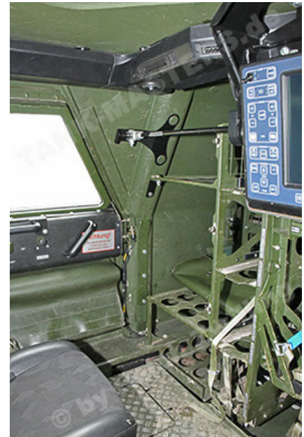
Dingo 2 GE A3.4 CG-13 (172).JPG