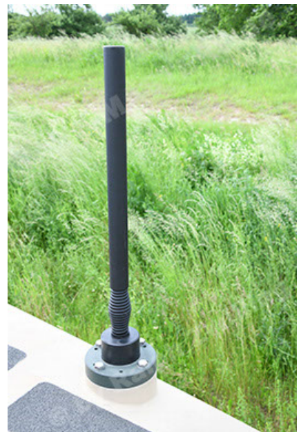
Dingo 2 GE A3.4 CG-13 (114).JPG