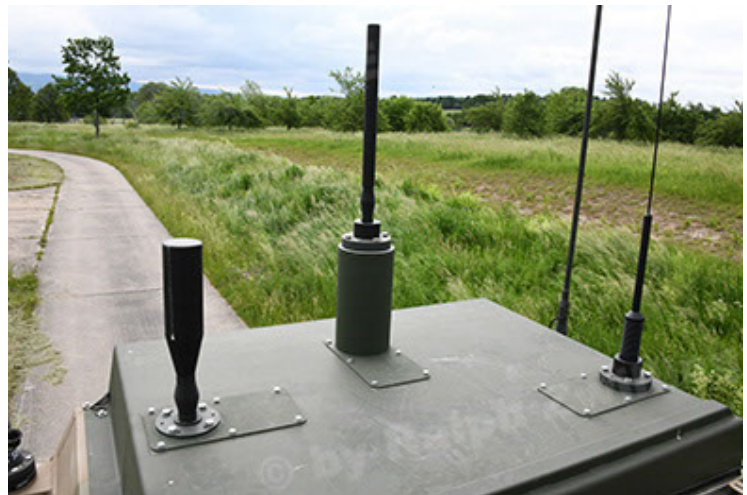
Dingo 2 GE A3.4 CG-13 (102).JPG