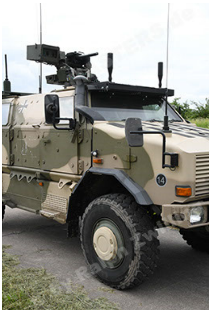
Dingo 2 GE A3.4 CG-13 (53).JPG