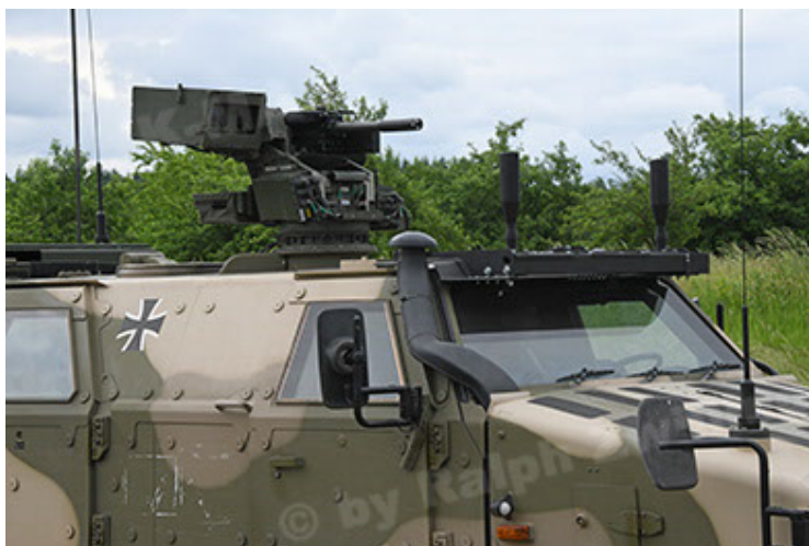
Dingo 2 GE A3.4 CG-13 (89).JPG