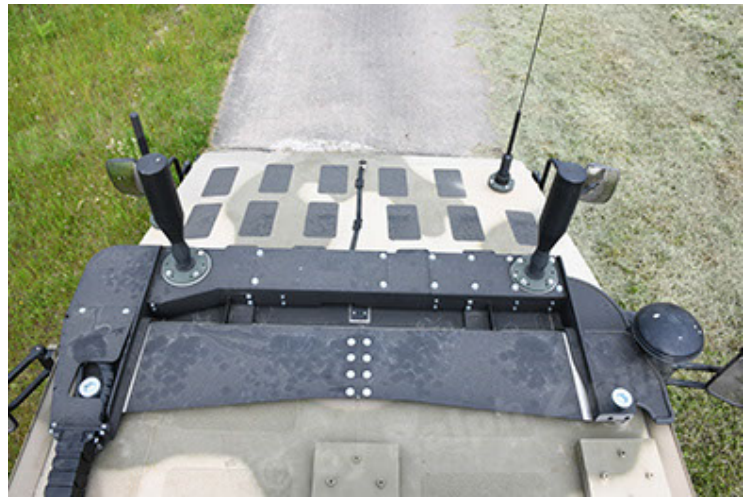
Dingo 2 GE A3.4 CG-13 (118).JPG