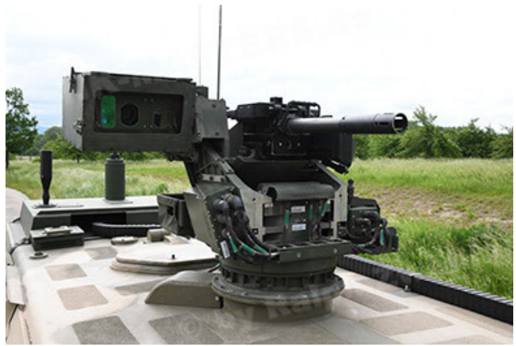
Dingo 2 GE A3.4 CG-13 (86).JPG