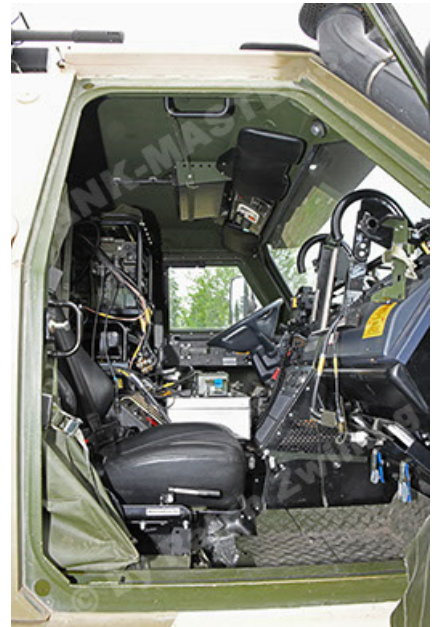
Dingo 2 GE A3.4 CG-13 (154).JPG