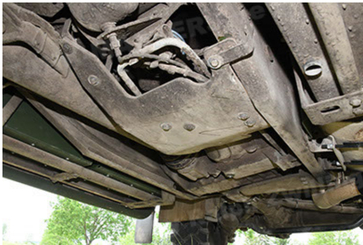
Dingo 2 GE A3.4 CG-13 (131).JPG