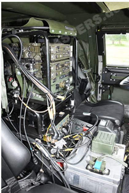
Dingo 2 GE A3.4 CG-13 (149).JPG