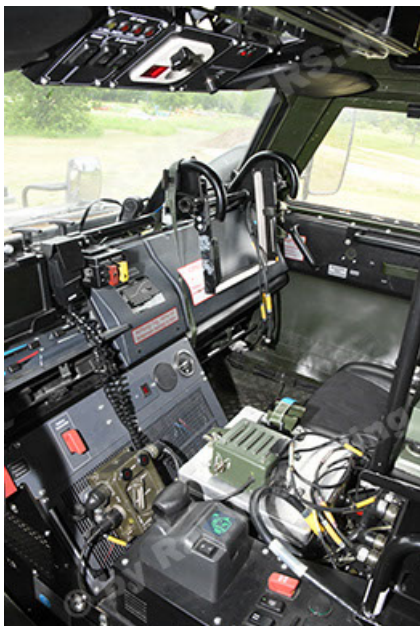
Dingo 2 GE A3.4 CG-13 (167).JPG