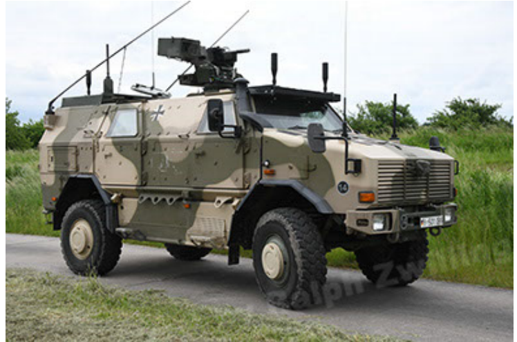
Dingo 2 GE A3.4 CG-13 (28).JPG