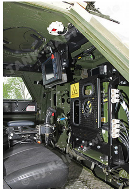
Dingo 2 GE A3.4 CG-13 (142).JPG