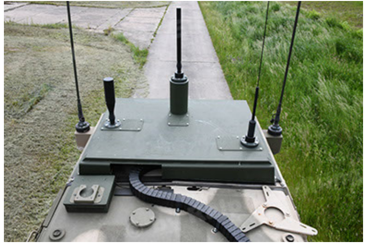
Dingo 2 GE A3.4 CG-13 (98).JPG