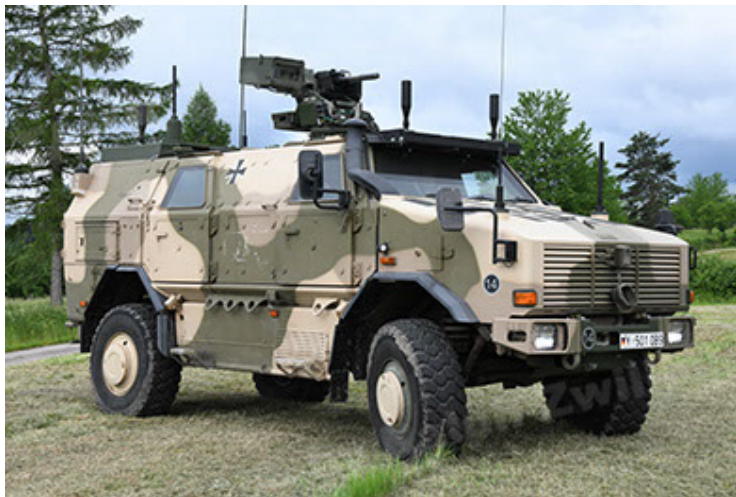
Dingo 2 GE A3.4 CG-13 (17).JPG