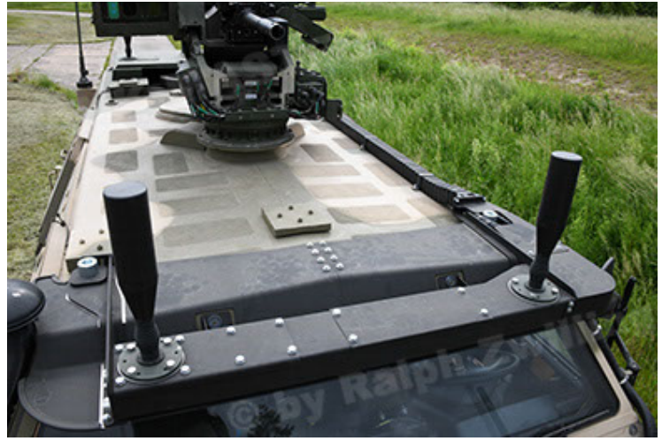
Dingo 2 GE A3.4 CG-13 (116).JPG