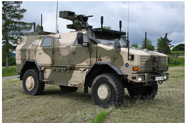
Dingo 2 GE A3.4 CG-13 (18).JPG