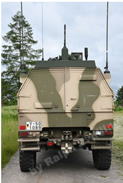
Dingo 2 GE A3.4 CG-13 (47).JPG