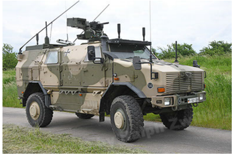
Dingo 2 GE A3.4 C-13 (2).JPG