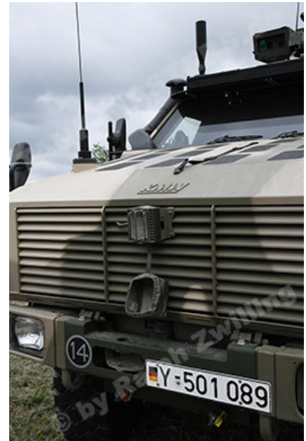
Dingo 2 GE A3.4 CG-13 (64).JPG