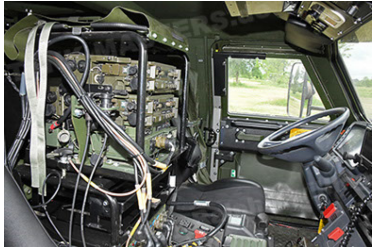
Dingo 2 GE A3.4 CG-13 (152).JPG