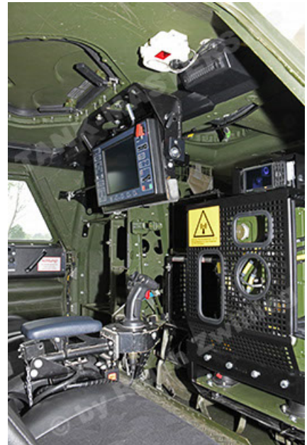
Dingo 2 GE A3.4 CG-13 (136).JPG