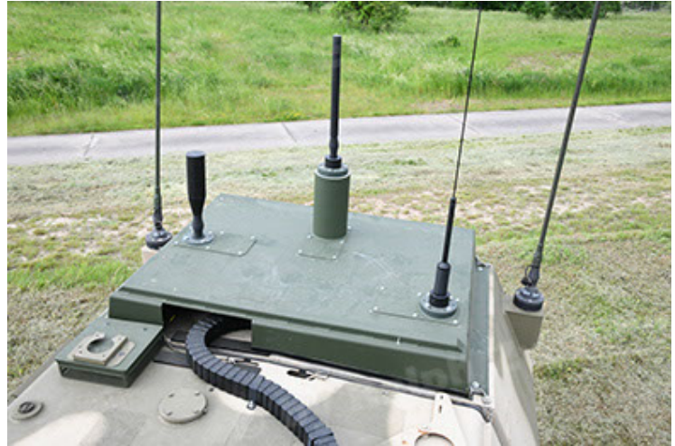
Dingo 2 GE A3.4 CG-13 (100).JPG