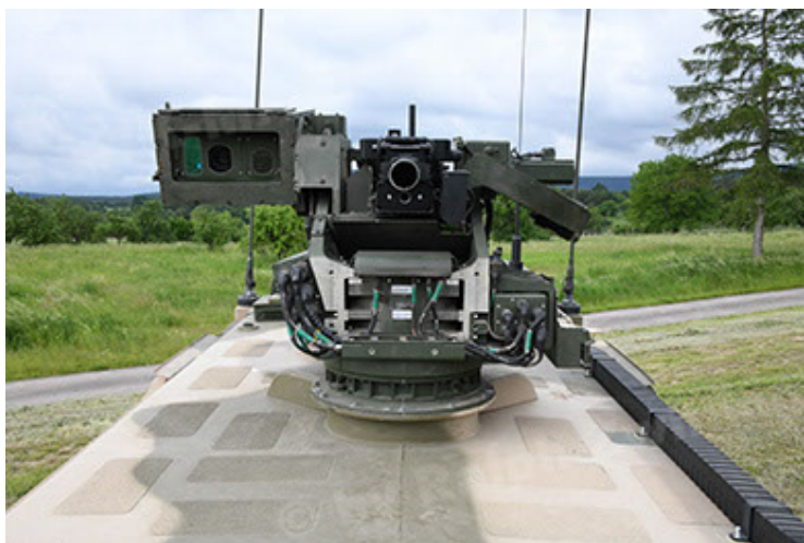
Dingo 2 GE A3.4 CG-13 (77).JPG