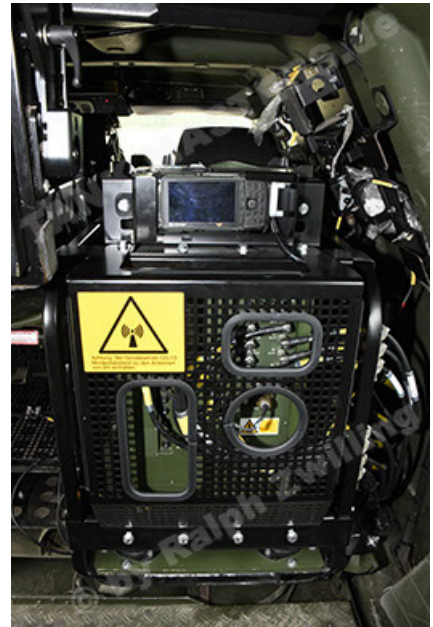
Dingo 2 GE A3.4 CG-13 (160).JPG