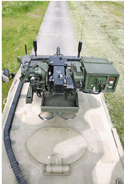
Dingo 2 GE A3.4 CG-13 (93).JPG