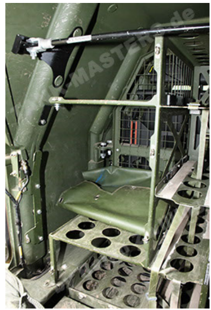
Dingo 2 GE A3.4 CG-13 (164).JPG