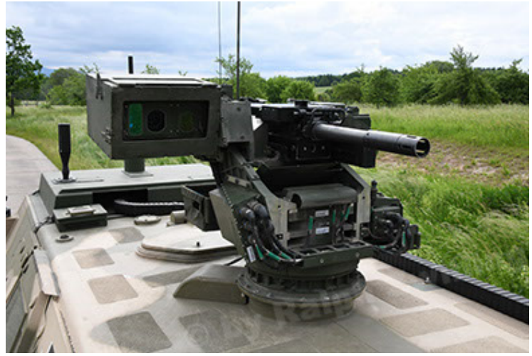
Dingo 2 GE A3.4 CG-13 (80).JPG