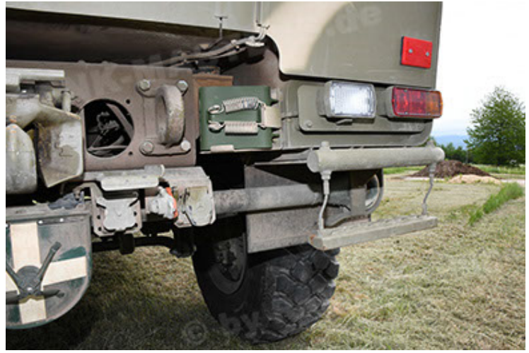
Dingo 2 GE A3.4 CG-13 (68).JPG