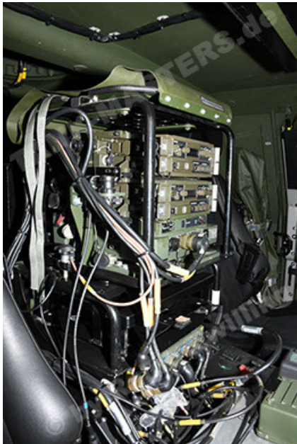
Dingo 2 GE A3.4 CG-13 (147).JPG