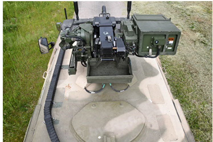
Dingo 2 GE A3.4 CG-13 (94).JPG