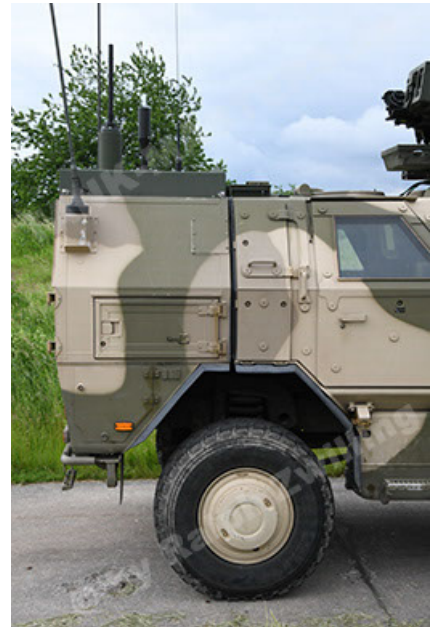
Dingo 2 GE A3.4 CG-13 (58).JPG