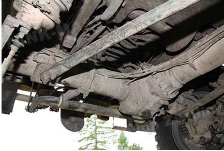
Dingo 2 GE A3.4 CG-13 (129).JPG