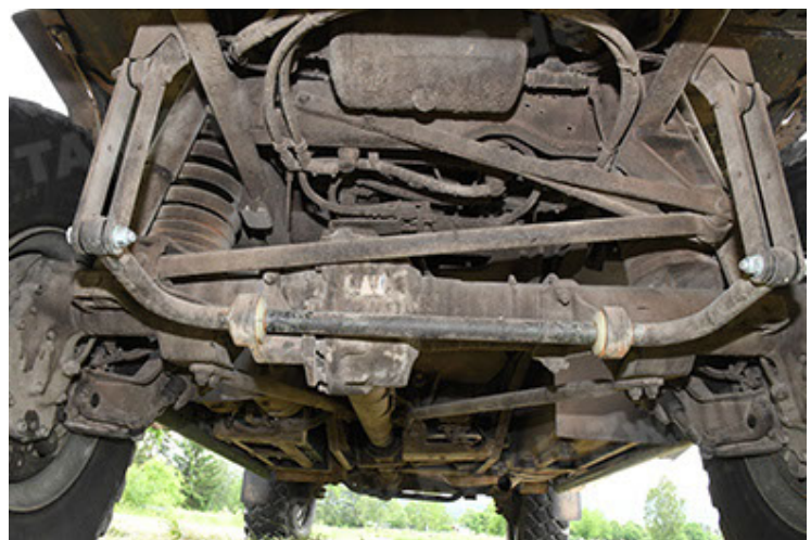
Dingo 2 GE A3.4 CG-13 (126).JPG