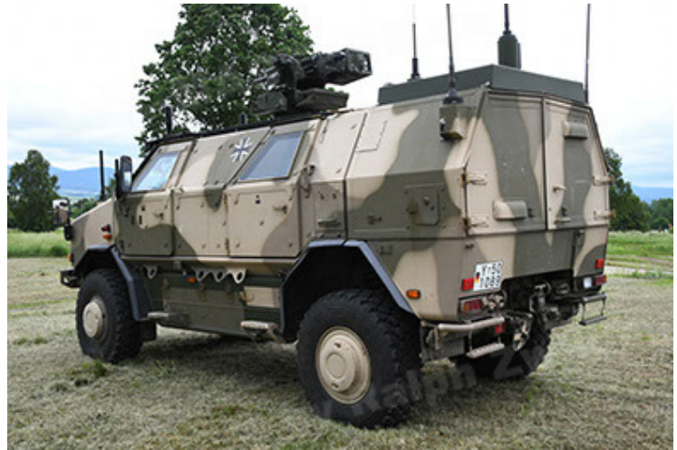
Dingo 2 GE A3.4 C-13 (4).JPG