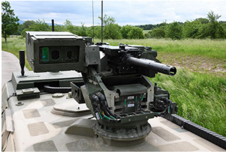
Dingo 2 GE A3.4 CG-13 (79).JPG