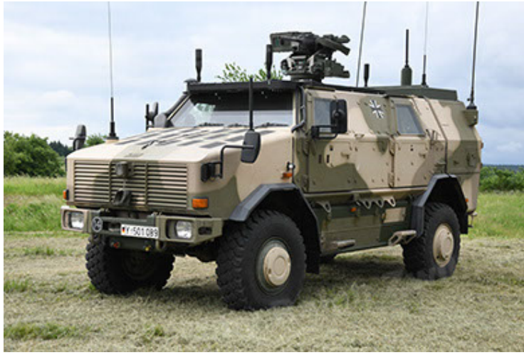
Dingo 2 GE A3.4 CG-13 (7).JPG