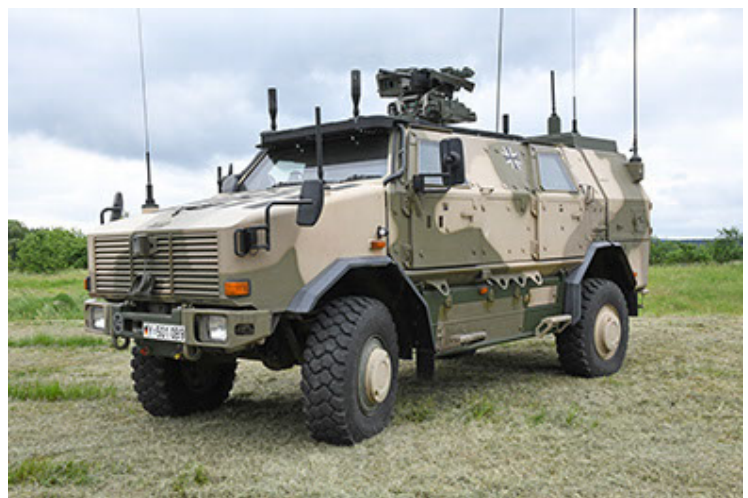
Dingo 2 GE A3.4 CG-13 (12).JPG