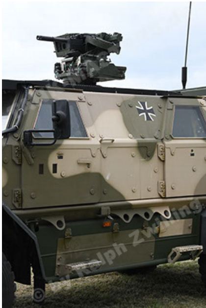
Dingo 2 GE A3.4 CG-13 (63).JPG