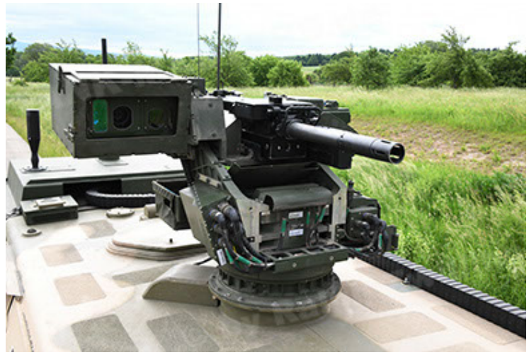
Dingo 2 GE A3.4 CG-13 (74).JPG