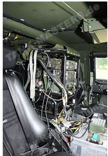
Dingo 2 GE A3.4 CG-13 (144).JPG