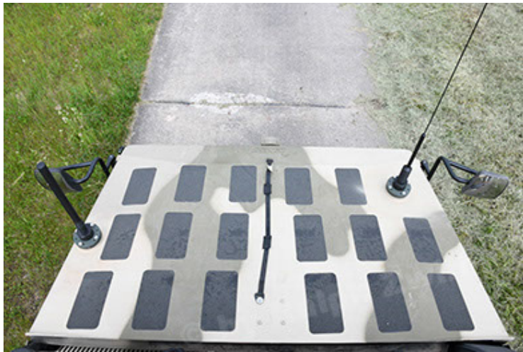
Dingo 2 GE A3.4 CG-13 (123).JPG