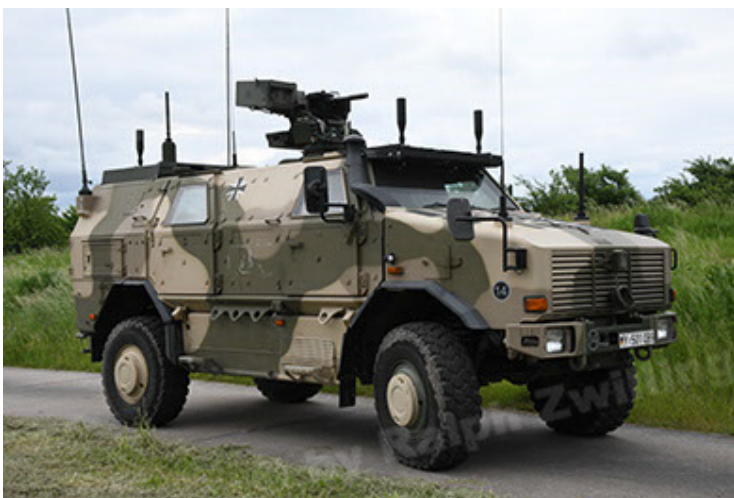
Dingo 2 GE A3.4 CG-13 (29).JPG