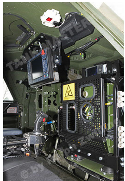
Dingo 2 GE A3.4 CG-13 (138).JPG