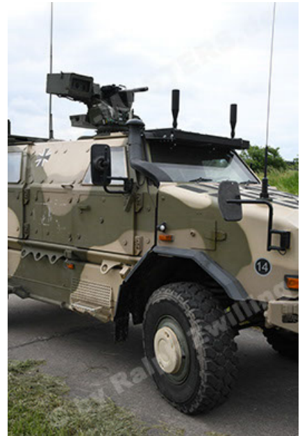
Dingo 2 GE A3.4 CG-13 (52).JPG