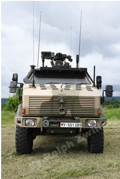
Dingo 2 GE A3.4 CG-13 (45).JPG