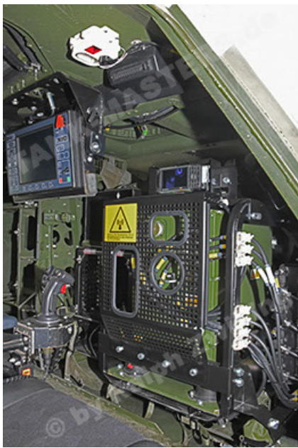
Dingo 2 GE A3.4 CG-13 (133).JPG