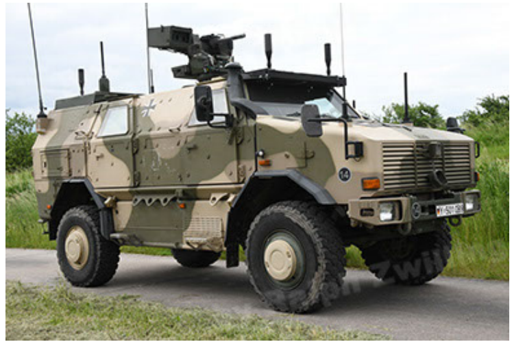
Dingo 2 GE A3.4 CG-13 (32).JPG