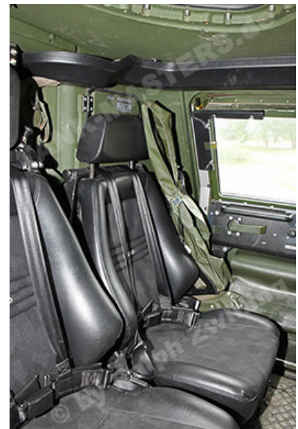
Dingo 2 GE A3.4 CG-13 (174).JPG