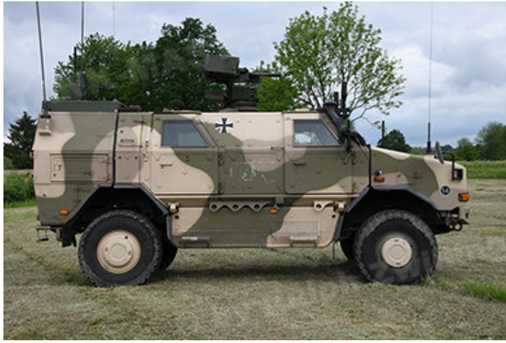
Dingo 2 GE A3.4 CG-13 (37).JPG