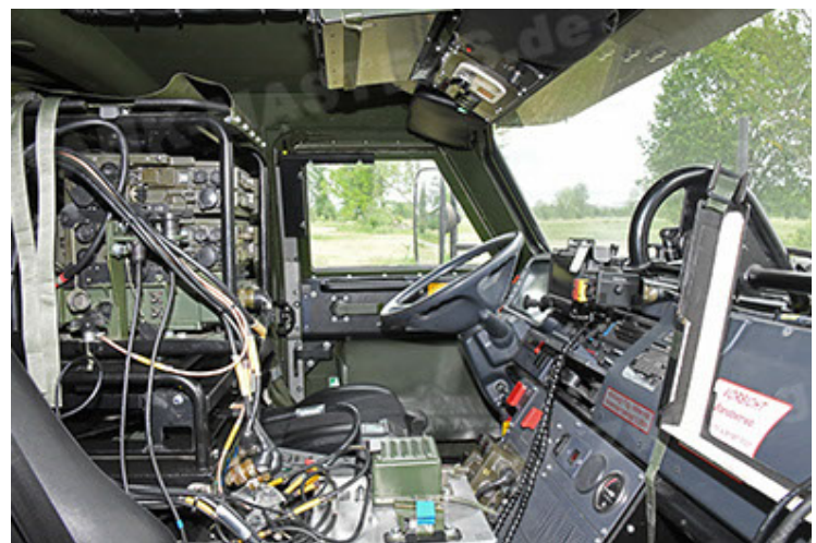
Dingo 2 GE A3.4 CG-13 (150).JPG