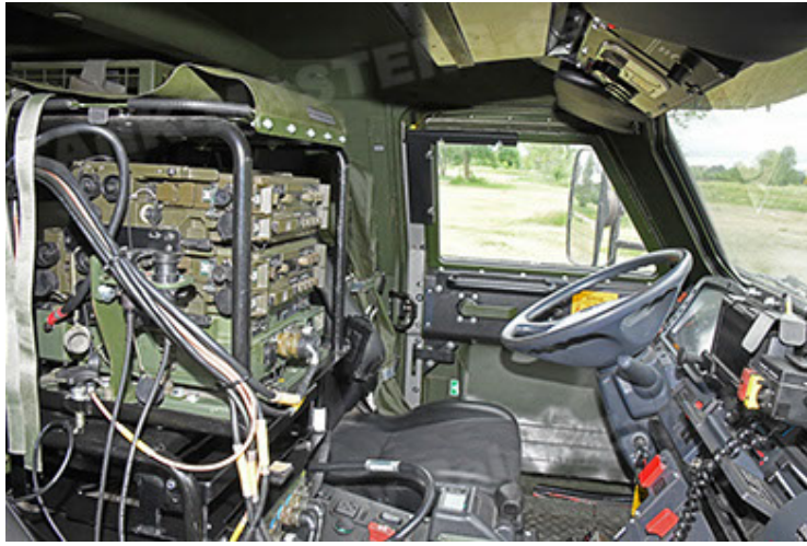
Dingo 2 GE A3.4 CG-13 (151).JPG