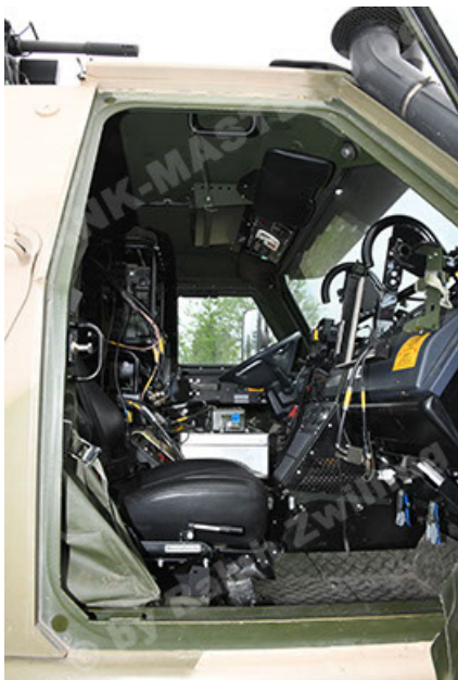
Dingo 2 GE A3.4 CG-13 (155).JPG