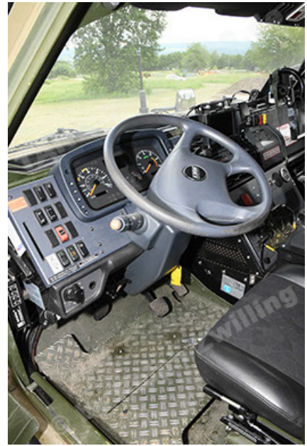
Dingo 2 GE A3.4 CG-13 (166).JPG