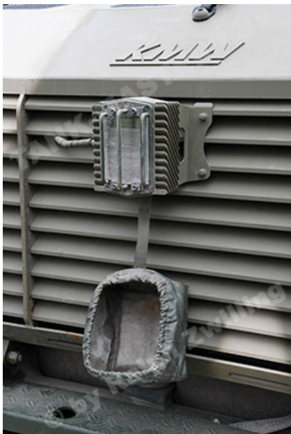
Dingo 2 GE A3.4 CG-13 (65).JPG