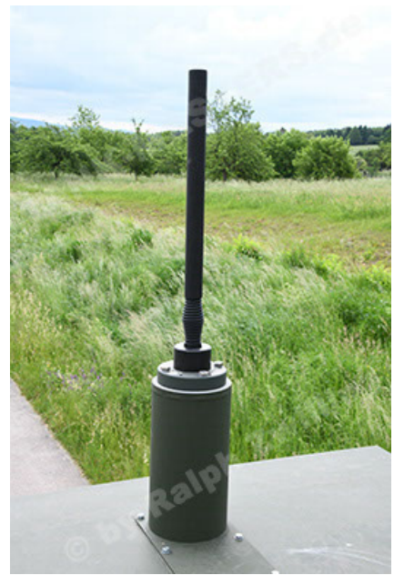
Dingo 2 GE A3.4 CG-13 (110).JPG