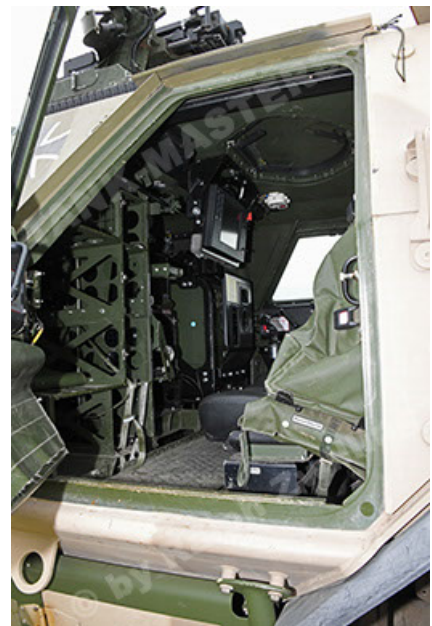
Dingo 2 GE A3.4 CG-13 (156).JPG