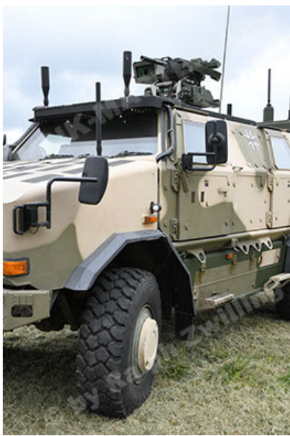
Dingo 2 GE A3.4 CG-13 (55).JPG