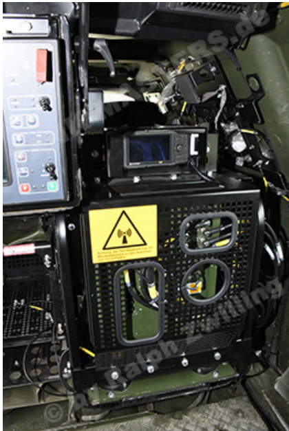
Dingo 2 GE A3.4 CG-13 (159).JPG