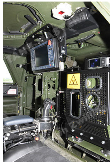
Dingo 2 GE A3.4 CG-13 (134).JPG