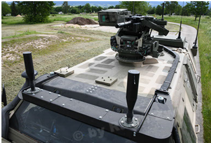
Dingo 2 GE A3.4 CG-13 (117).JPG