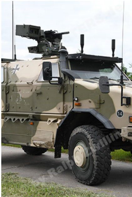
Dingo 2 GE A3.4 CG-13 (51).JPG