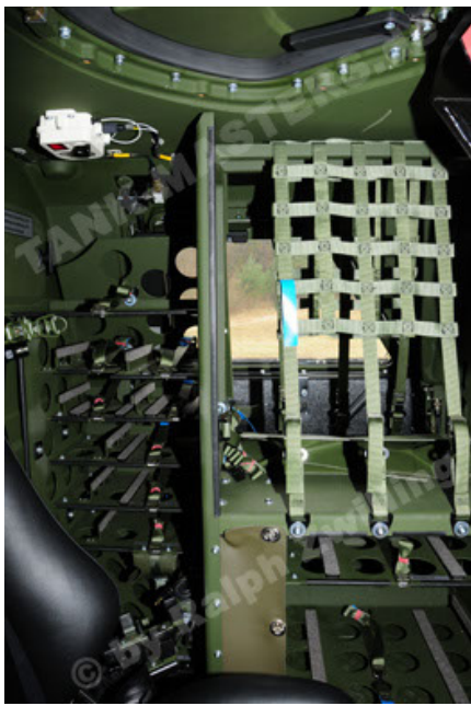
Dingo 2 GE A3 SysInstFw (31).JPG