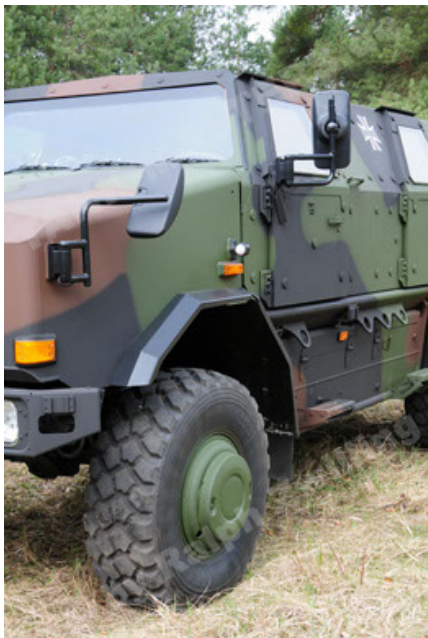
Dingo 2 GE A3 SysInstFw (23).JPG