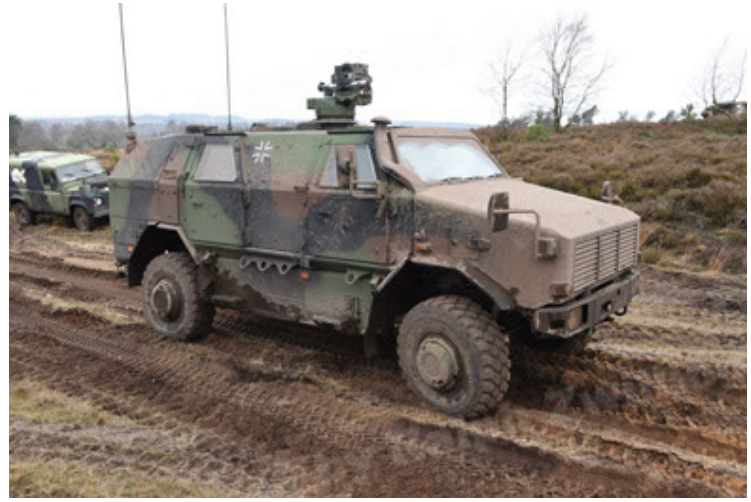
Dingo 2 GE A3 SysInstFw (20).JPG