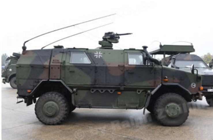
Dingo 2 GE A3 SysInstFw (21).JPG