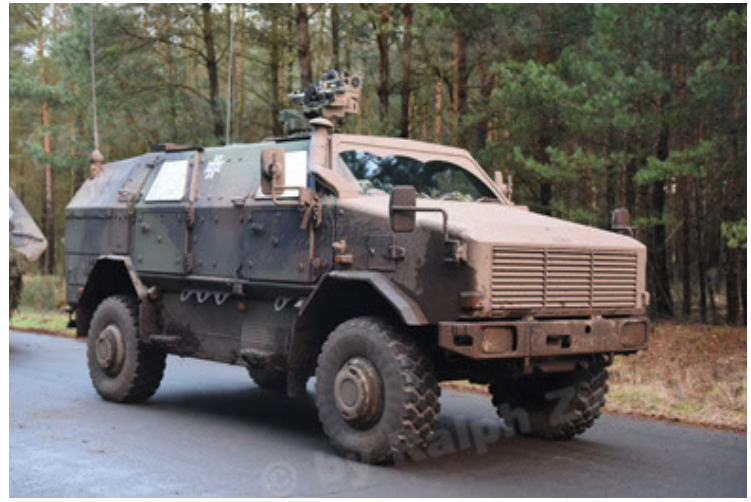
Dingo 2 GE A3 SysInstFw (14).JPG