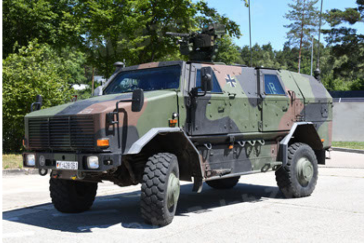
Dingo 2 GE A3 SysInstFw (37).JPG