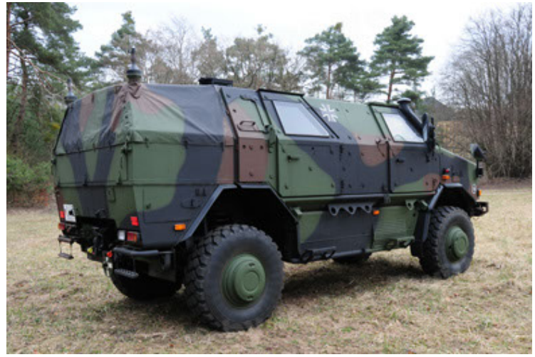
Dingo 2 GE A3 SysInstFw (8).JPG