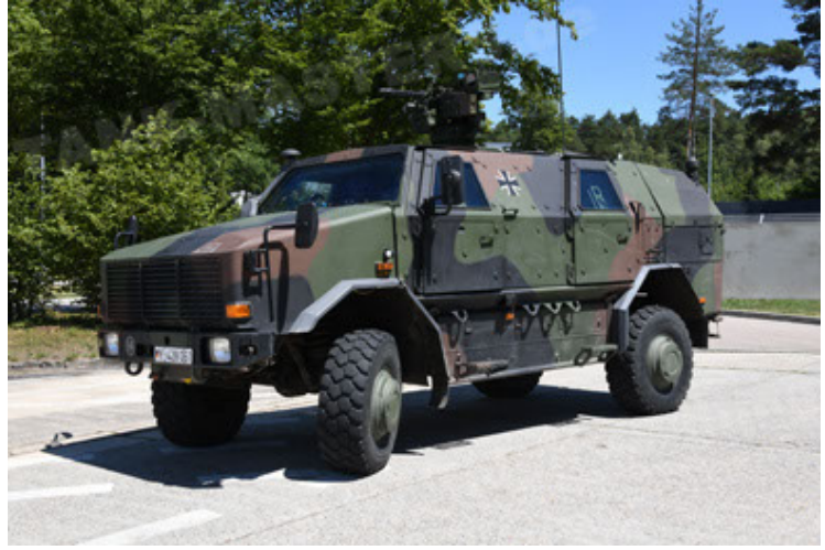
Dingo 2 GE A3 SysInstFw (38).JPG