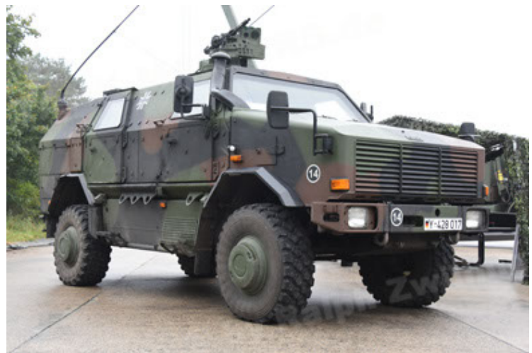
Dingo 2 GE A3 SysInstFw (12).JPG