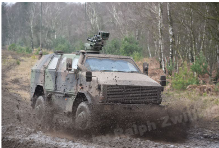
Dingo 2 GE A3 SysInstFw (17).JPG