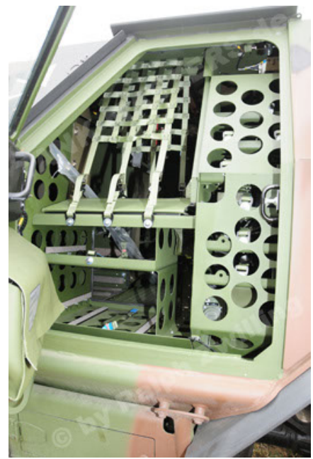
Dingo 2 GE A3 SysInstFw (26).JPG