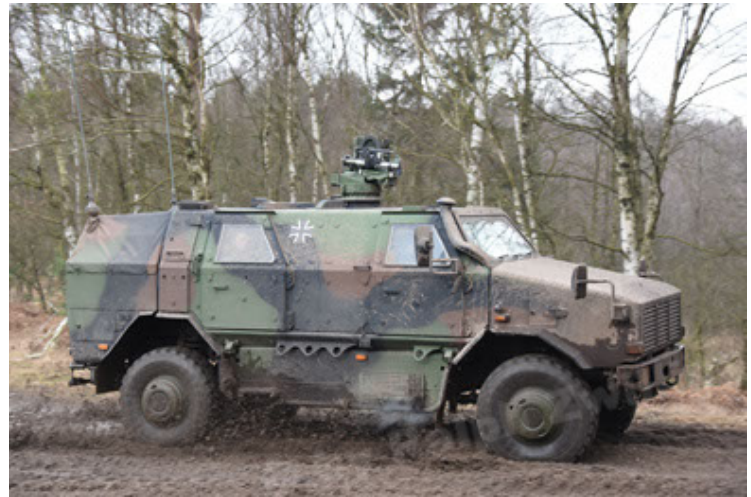
Dingo 2 GE A3 SysInstFw (4).JPG