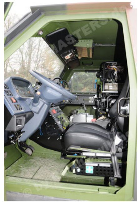
Dingo 2 GE A3 SysInstFw (32).JPG