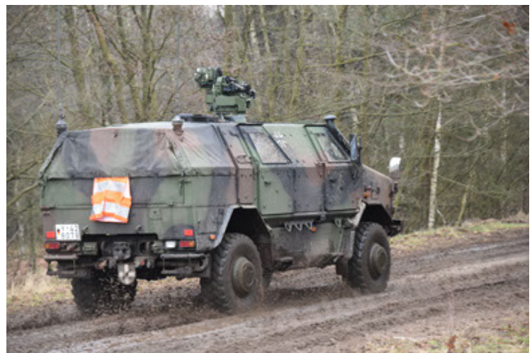
Dingo 2 GE A3 SysInstFw (18).JPG