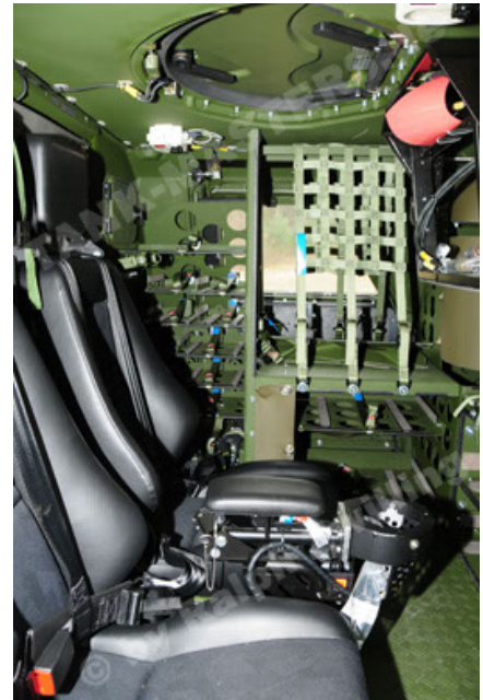
Dingo 2 GE A3 SysInstFw (28).JPG