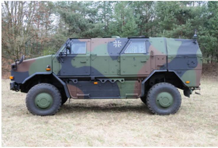
Dingo 2 GE A3 SysInstFw (7).JPG