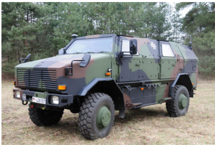
Dingo 2 GE A3 SysInstFw (5).JPG