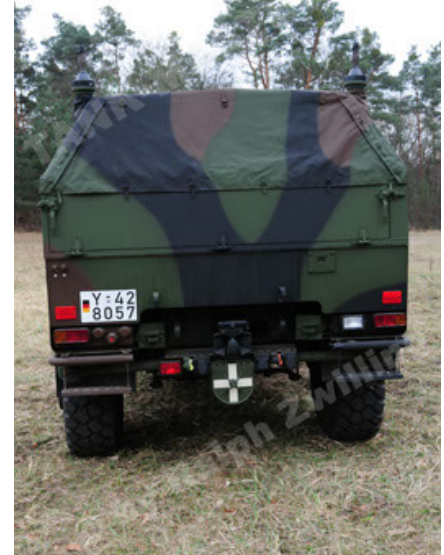
Dingo 2 GE A3 SysInstFw (22).JPG