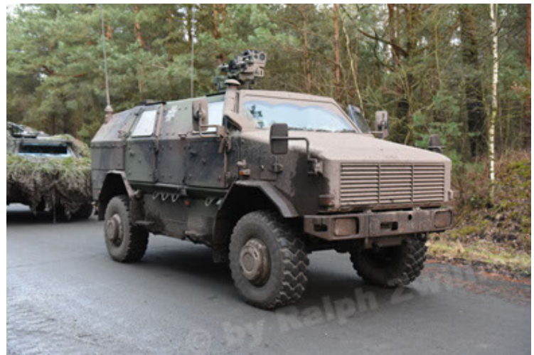
Dingo 2 GE A3 SysInstFw (16).JPG