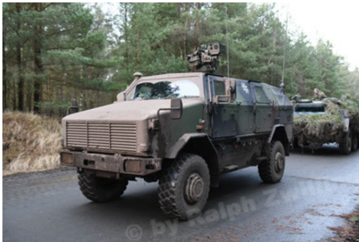
Dingo 2 GE A3 SysInstFw (15).JPG