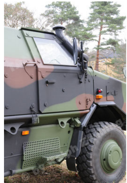
Dingo 2 GE A3 SysInstFw (24).JPG