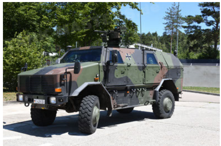
Dingo 2 GE A3 SysInstFw (36).JPG