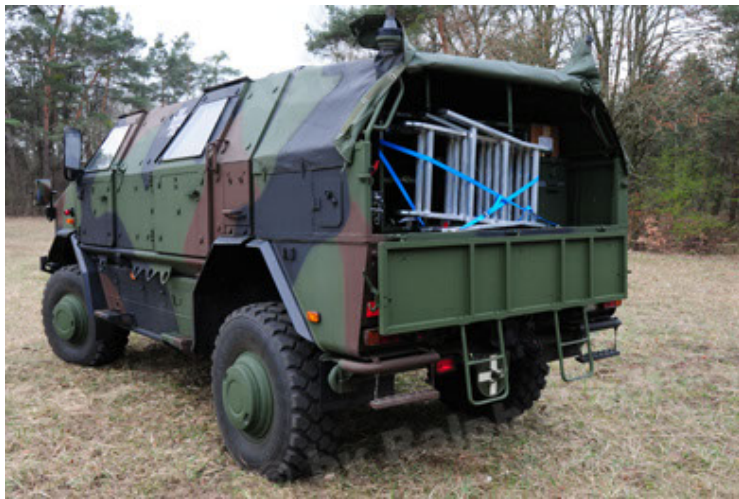
Dingo 2 GE A3 SysInstFw (9).JPG