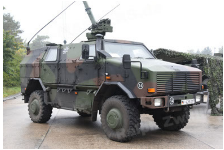
Dingo 2 GE A3 SysInstFw (2).JPG