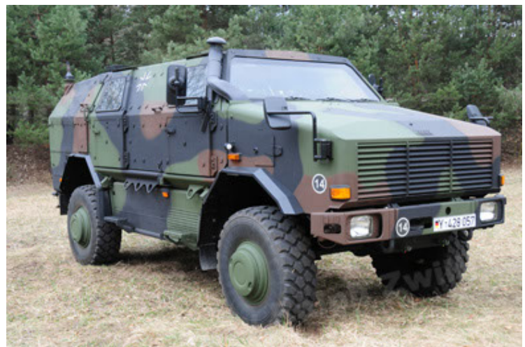
Dingo 2 GE A3 SysInstFw (6).JPG