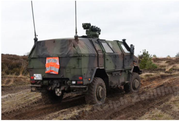
Dingo 2 GE A3 SysInstFw (19).JPG