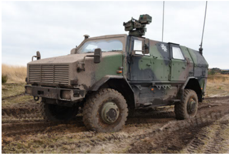
Dingo 2 GE A3 SysInstFw (1).JPG