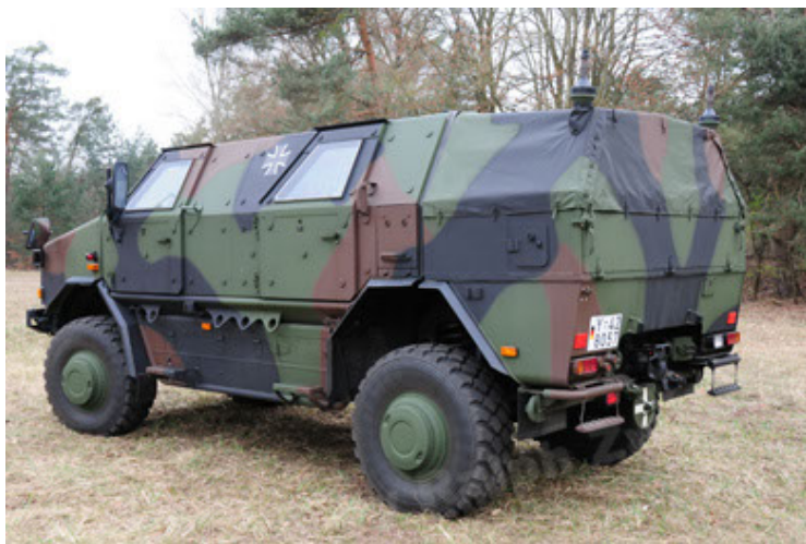
Dingo 2 GE A3 SysInstFw (11).JPG