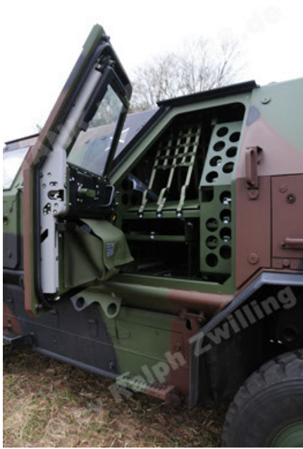
Dingo 2 GE A3 SysInstFw (25).JPG