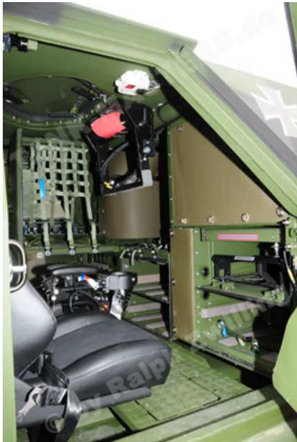
Dingo 2 GE A3 SysInstFw (27).JPG