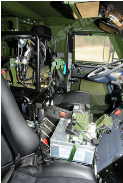
Dingo 2 GE A3 SysInstFw (33).JPG