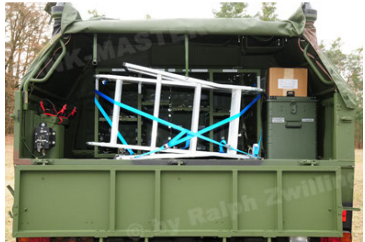
Dingo 2 GE A3 SysInstFw (34).JPG