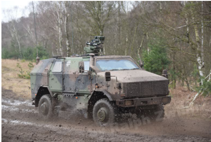
Dingo 2 GE A3 SysInstFw (3).JPG