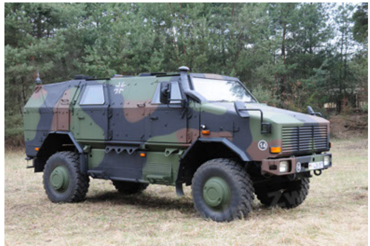
Dingo 2 GE A3 SysInstFw (10).JPG