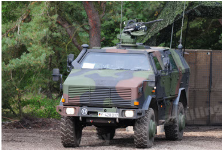
Dingo 2 GE A3 SysInstFw (13).JPG