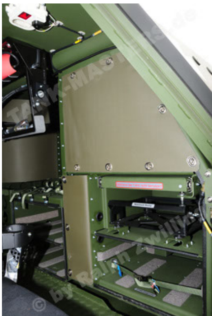
Dingo 2 GE A3 SysInstFw (29).JPG