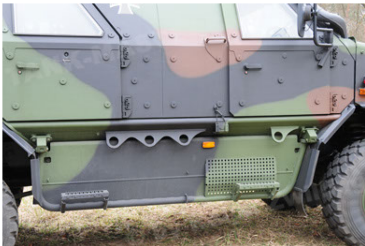
Dingo 2 GE A3 SysInstFw (35).JPG