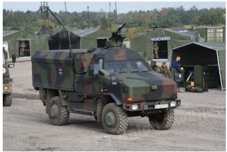
Dingo 2 GE C1 GSI (128).JPG