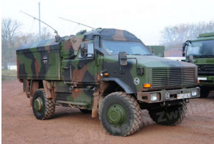
Dingo 2 GE C1 GSI (51).JPG