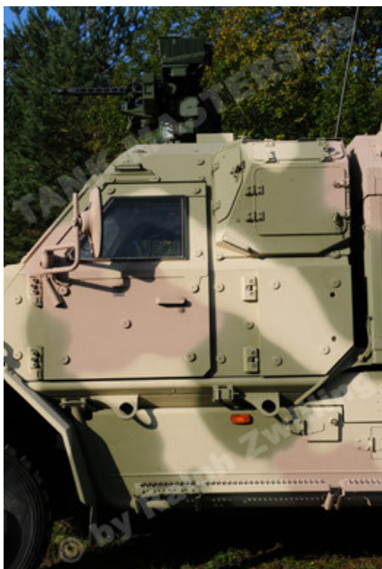
Dingo 2 GE C1 GSI (83).JPG