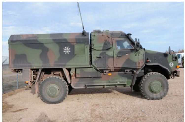
Dingo 2 GE C1 GSI (54).JPG