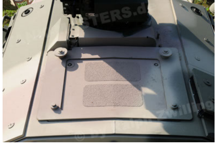
Dingo 2 GE C1 GSI (74).JPG