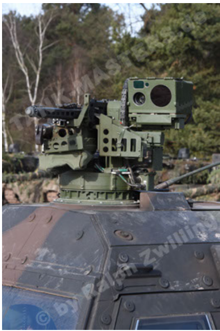
Dingo 2 GE C1 GSI (152).JPG