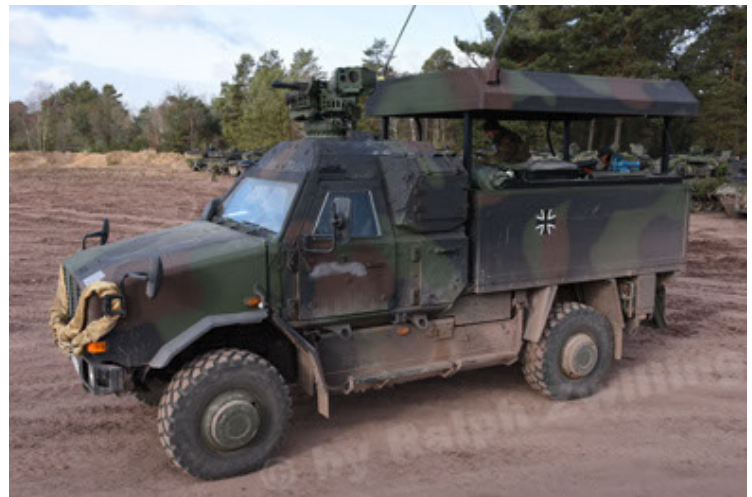
Dingo 2 GE C1 GSI (157).JPG