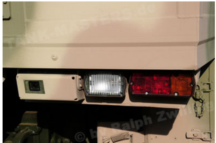
Dingo 2 GE C1 GSI (82).JPG