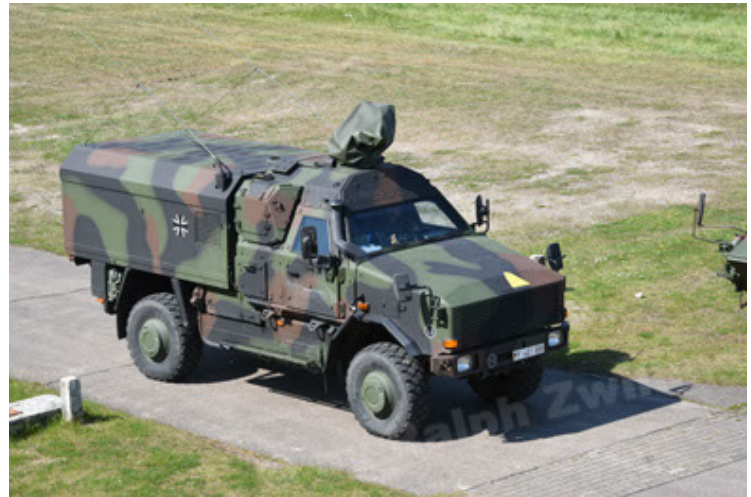
Dingo 2 GE C1 GSI (106).JPG