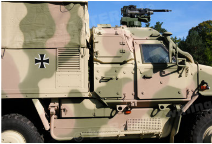
Dingo 2 GE C1 GSI (85).JPG