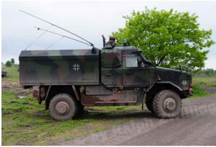
Dingo 2 GE C1 GSI (67).JPG