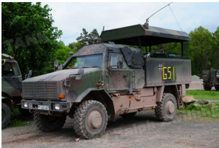
Dingo 2 GE C1 GSI (59).JPG