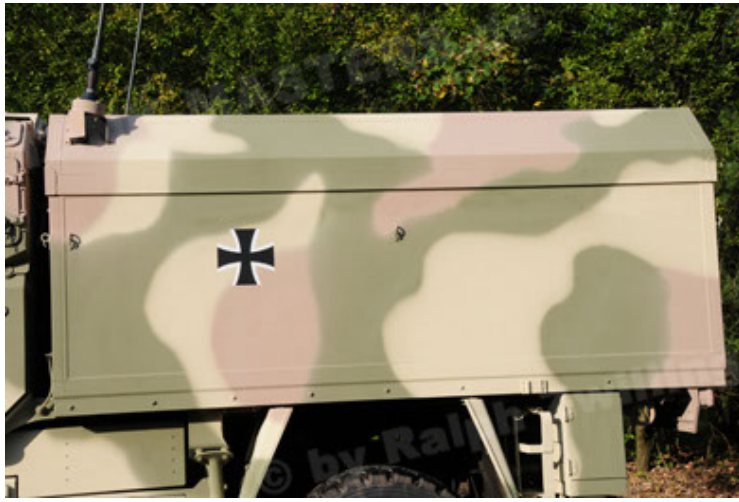
Dingo 2 GE C1 GSI (79).JPG