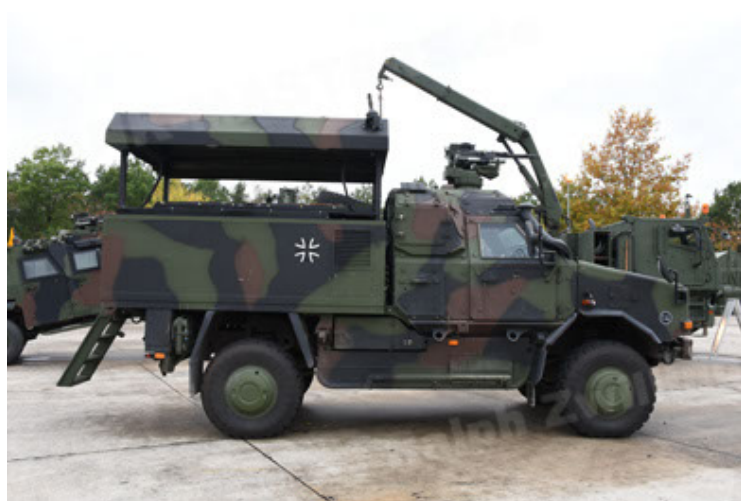
Dingo 2 GE C1 GSI (124).JPG