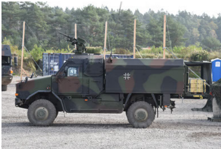
Dingo 2 GE C1 GSI (135).JPG