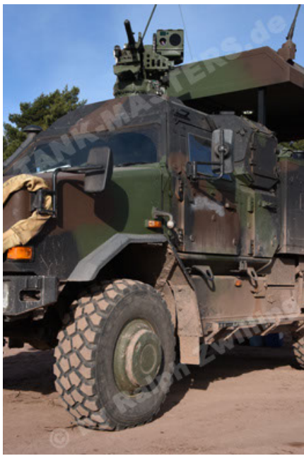
Dingo 2 GE C1 GSI (164).JPG