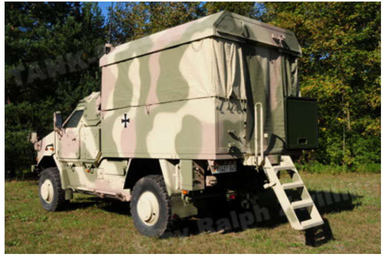
Dingo 2 GE C1 GSI (14).JPG