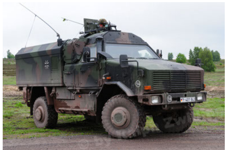
Dingo 2 GE C1 GSI (66).JPG