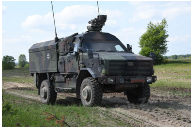
Dingo 2 GE C1 GSI (177).JPG