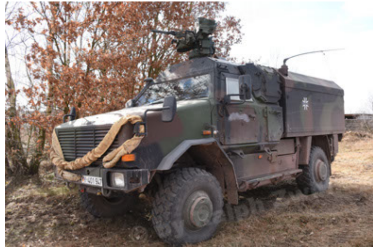
Dingo 2 GE C1 GSI (173).JPG