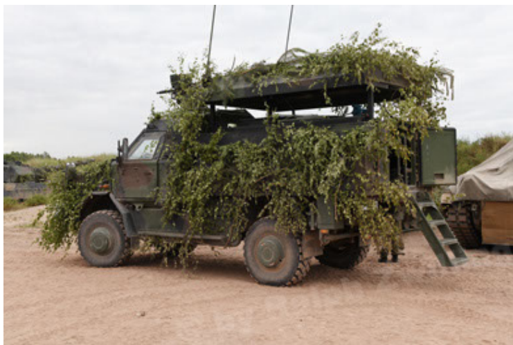
Dingo 2 GE C1 GSI (186).JPG