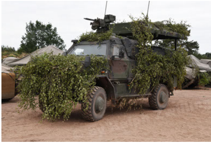
Dingo 2 GE C1 GSI (188).JPG