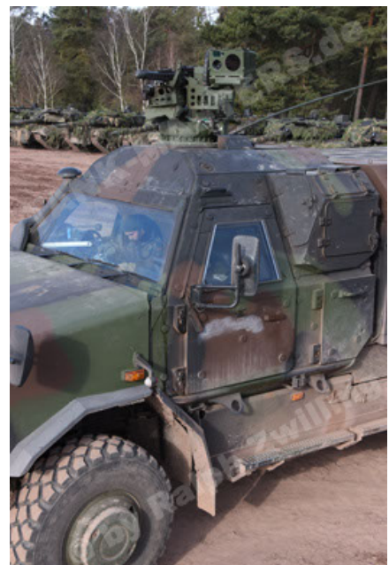
Dingo 2 GE C1 GSI (151).JPG