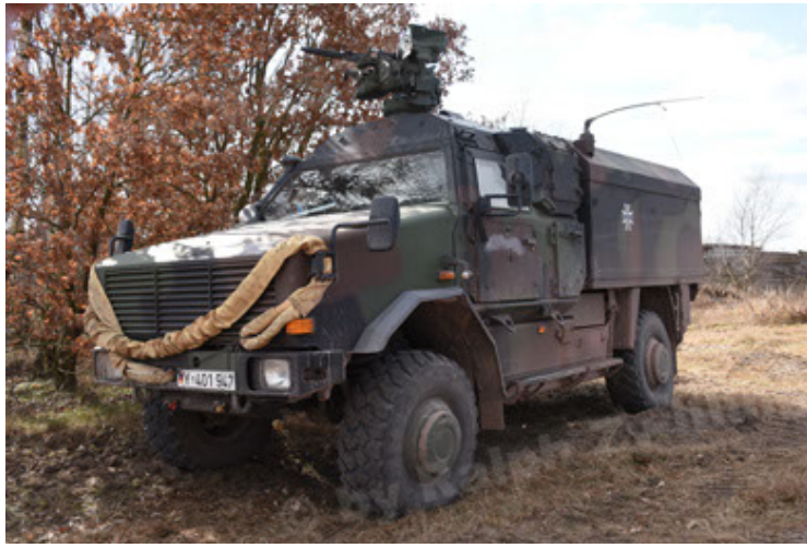
Dingo 2 GE C1 GSI (170).JPG