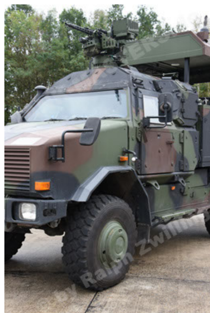
Dingo 2 GE C1 GSI (120).JPG