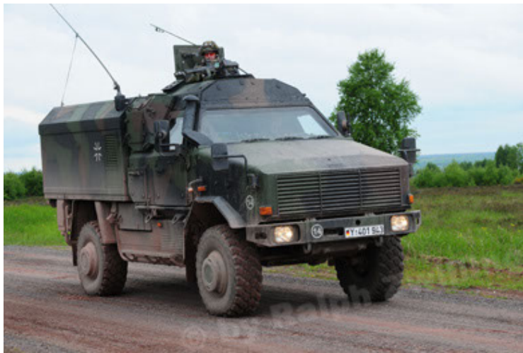
Dingo 2 GE C1 GSI (57).JPG