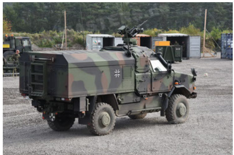
Dingo 2 GE C1 GSI (132).JPG