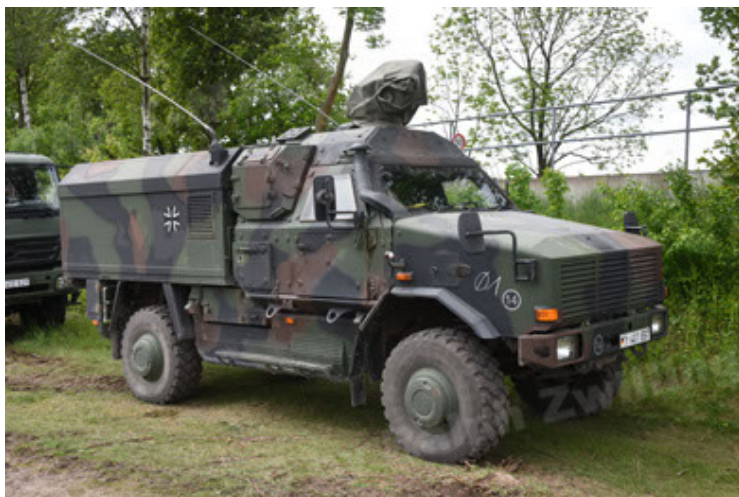
Dingo 2 GE C1 GSI (113).JPG