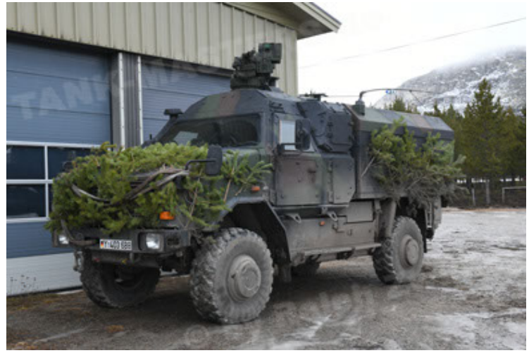
Dingo 2 GE C1 GSI (207).JPG