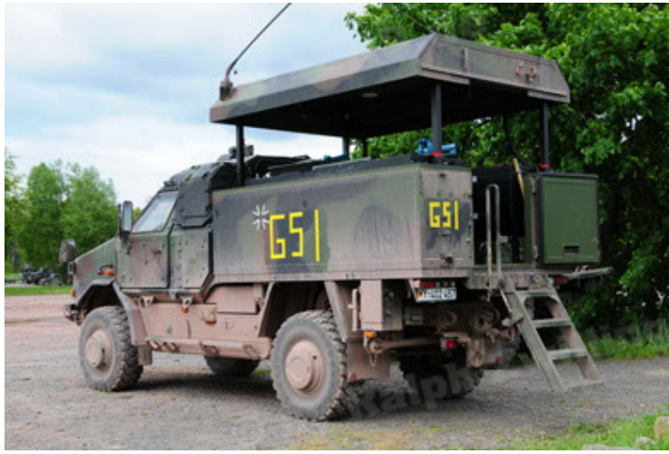
Dingo 2 GE C1 GSI (61).JPG