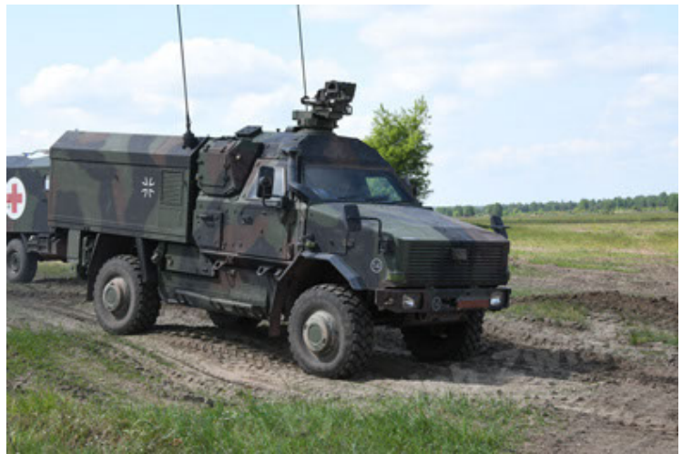
Dingo 2 GE C1 GSI (179).JPG