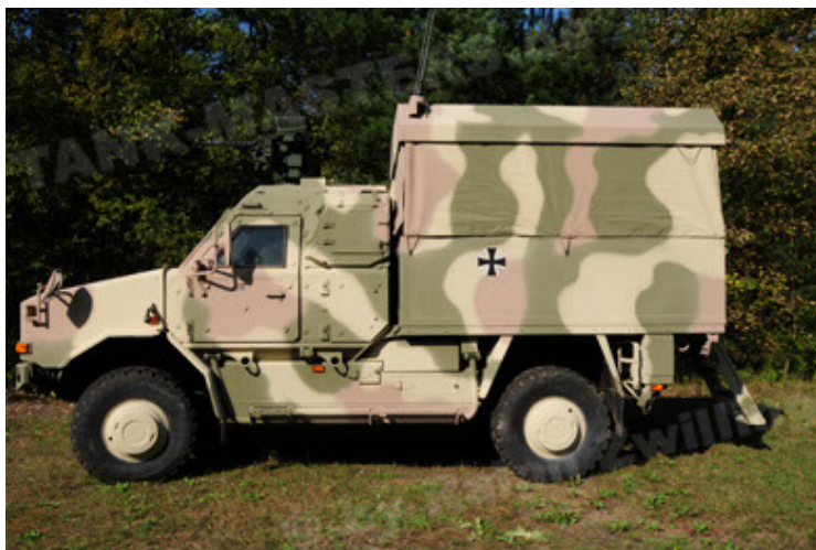
Dingo 2 GE C1 GSI (11).JPG