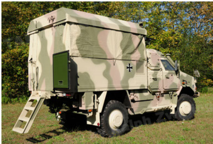
Dingo 2 GE C1 GSI (15).JPG