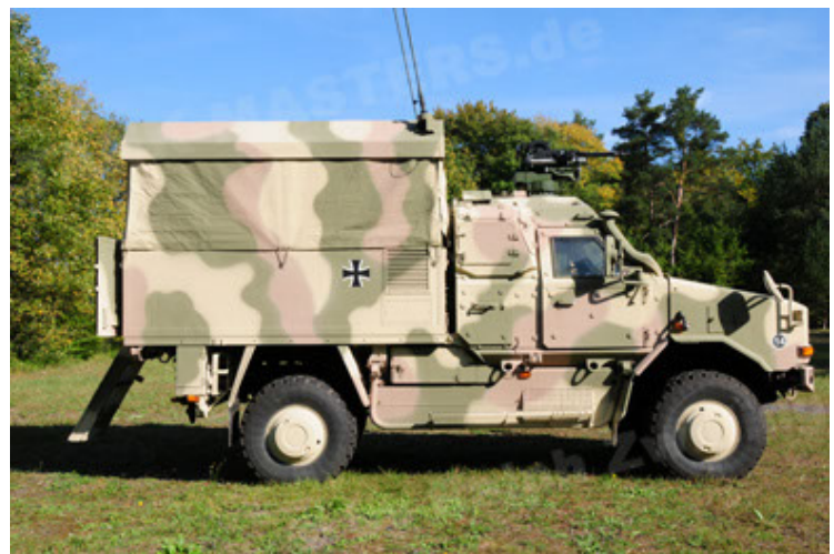
Dingo 2 GE C1 GSI (12).JPG