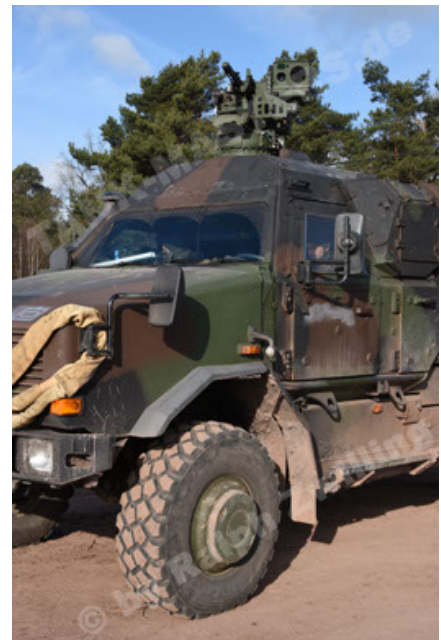
Dingo 2 GE C1 GSI (143).JPG