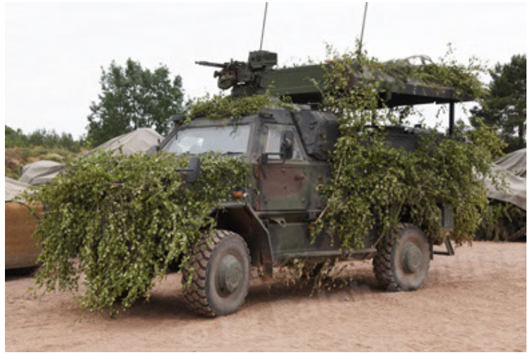
Dingo 2 GE C1 GSI (189).JPG