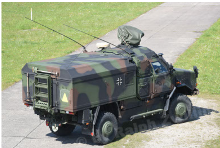
Dingo 2 GE C1 GSI (107).JPG