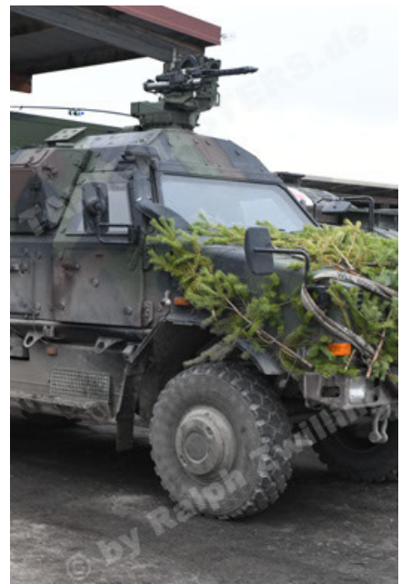
Dingo 2 GE C1 GSI (213).JPG