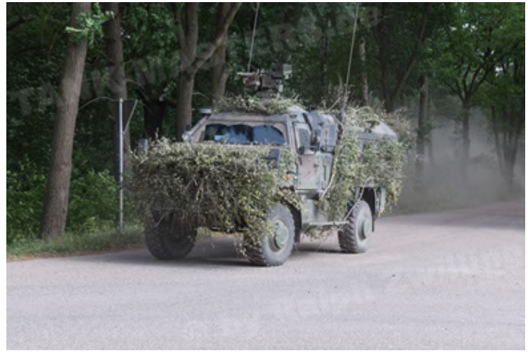
Dingo 2 GE C1 GSI (201).JPG