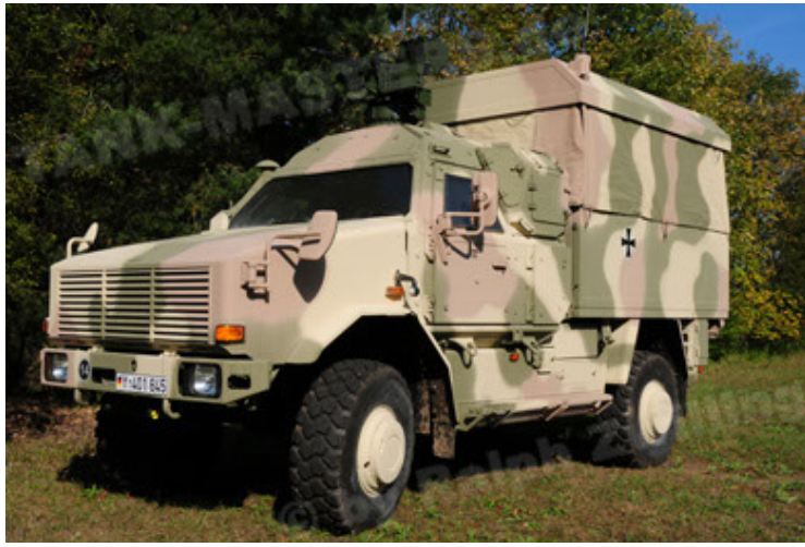
Dingo 2 GE C1 GSI (1).JPG