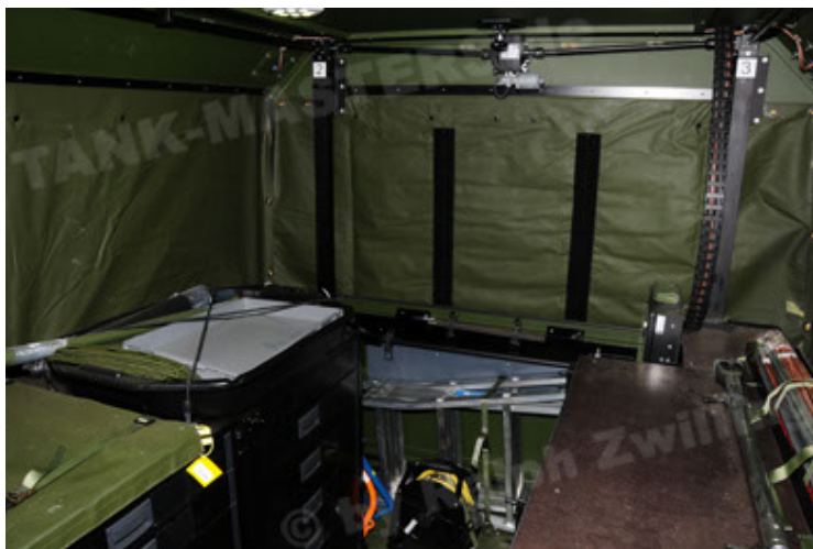
Dingo 2 GE C1 GSI (89).JPG