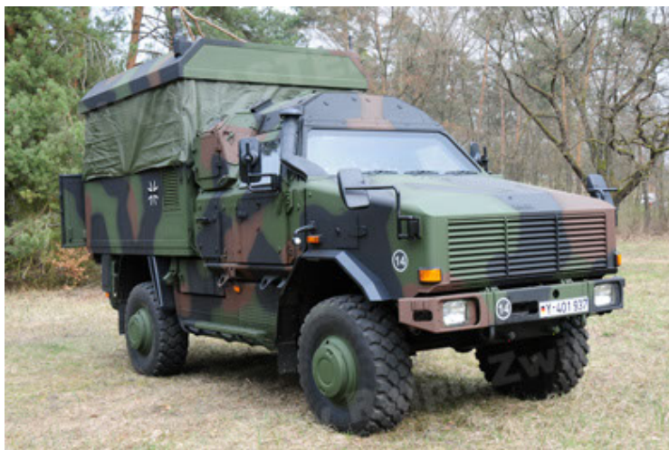
Dingo 2 GE C1 GSI (29).JPG