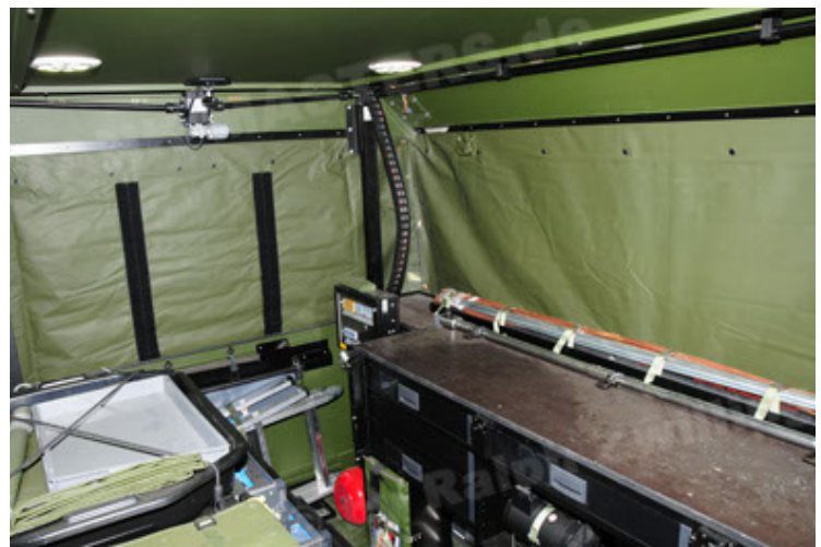
Dingo 2 GE C1 GSI (96).JPG