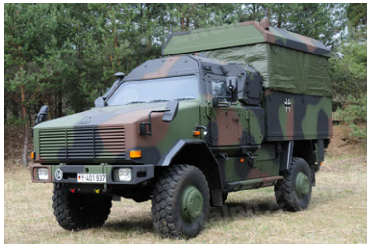
Dingo 2 GE C1 GSI (36).JPG