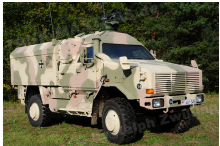
Dingo 2 GE C1 GSI (18).JPG