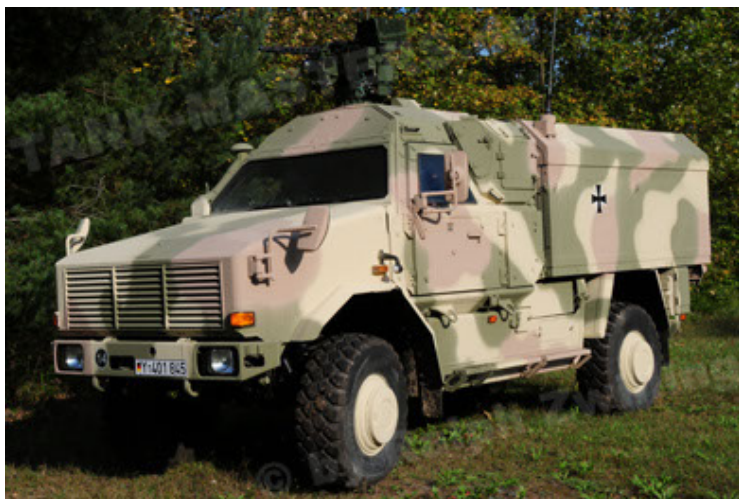
Dingo 2 GE C1 GSI (17).JPG