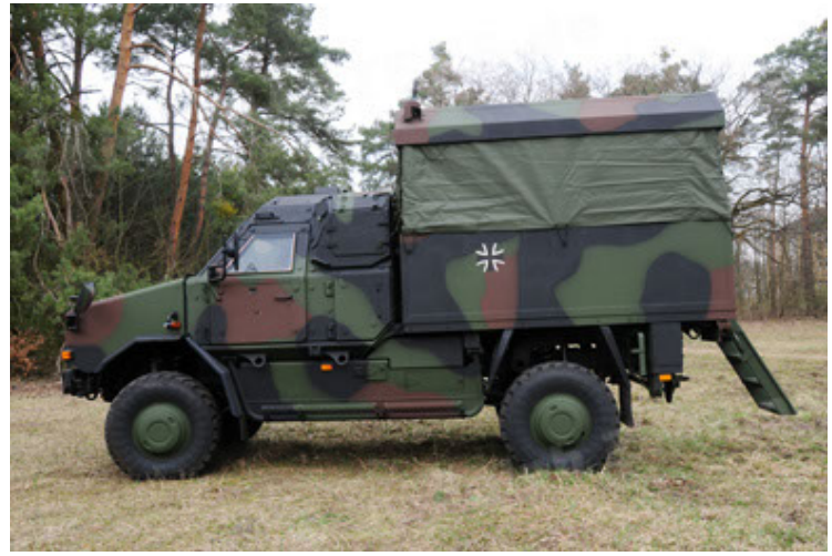
Dingo 2 GE C1 GSI (44).JPG