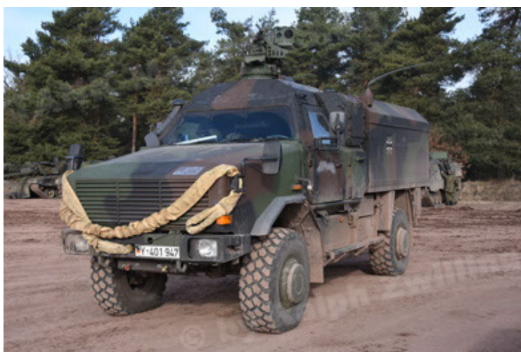
Dingo 2 GE C1 GSI (144).JPG