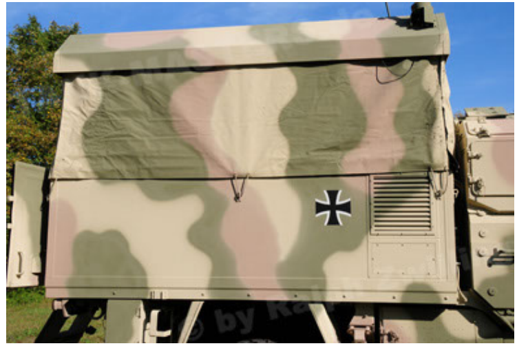
Dingo 2 GE C1 GSI (86).JPG