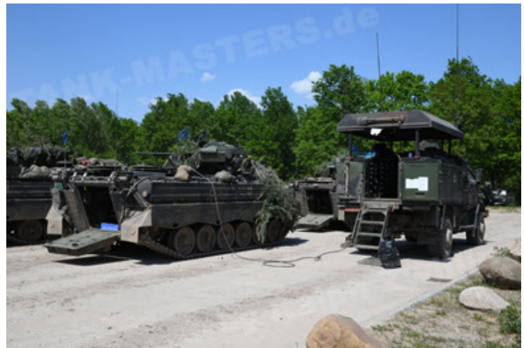
Dingo 2 GE C1 GSI (197).JPG