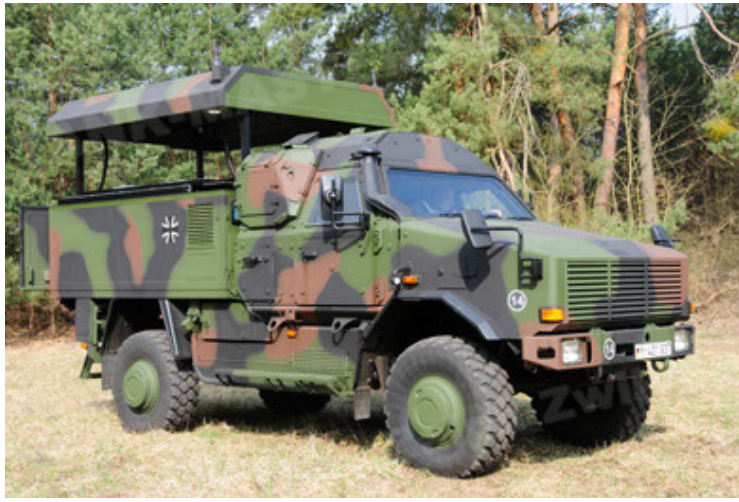
Dingo 2 GE C1 GSI (49).JPG