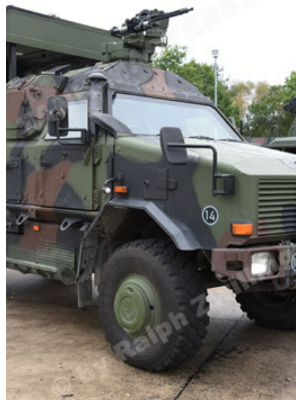
Dingo 2 GE C1 GSI (116).JPG