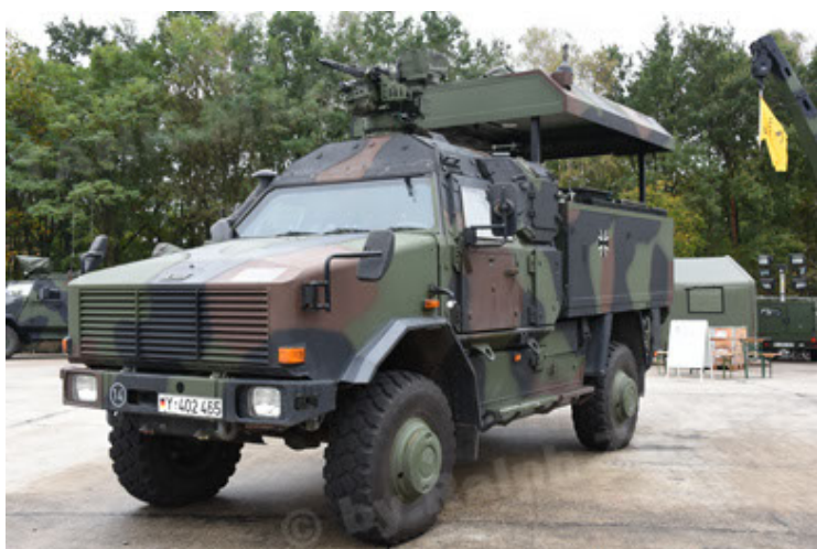
Dingo 2 GE C1 GSI (119).JPG