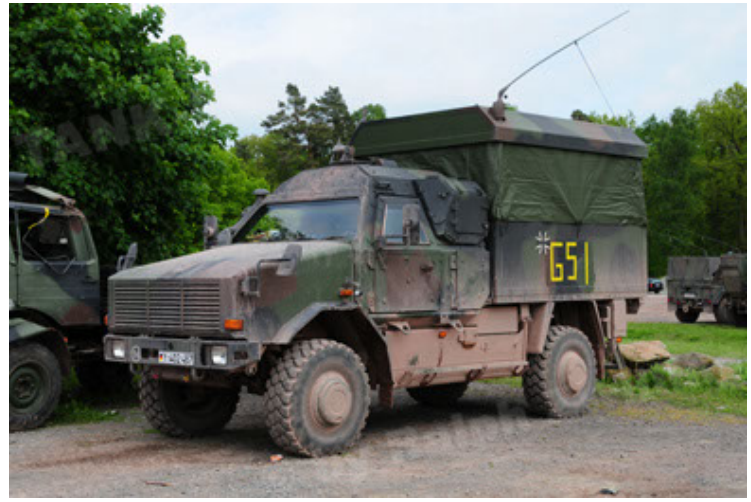
Dingo 2 GE C1 GSI (62).JPG