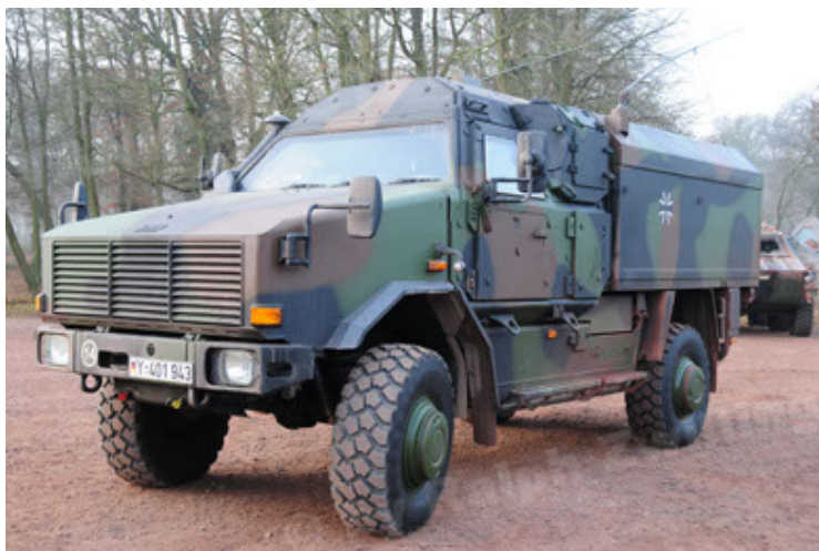
Dingo 2 GE C1 GSI (53).JPG