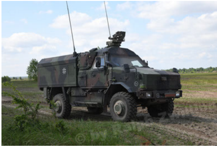
Dingo 2 GE C1 GSI (176).JPG