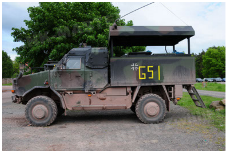
Dingo 2 GE C1 GSI (60).JPG