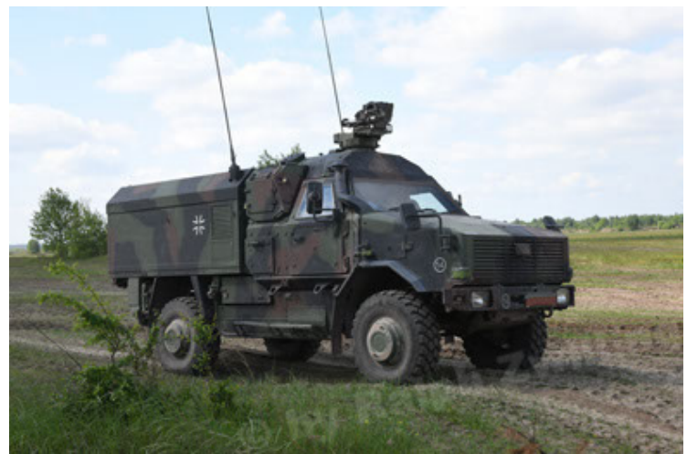
Dingo 2 GE C1 GSI (175).JPG