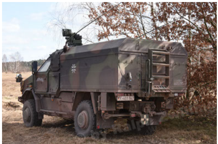
Dingo 2 GE C1 GSI (169).JPG