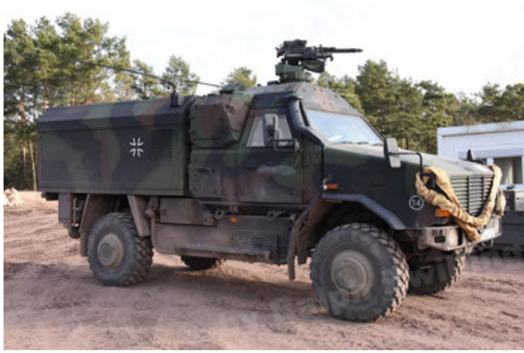
Dingo 2 GE C1 GSI (146).JPG