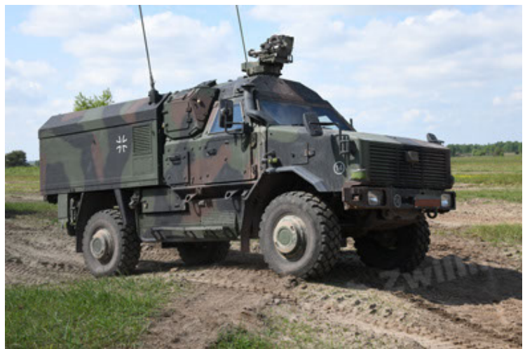
Dingo 2 GE C1 GSI (181).JPG