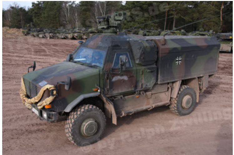
Dingo 2 GE C1 GSI (149).JPG