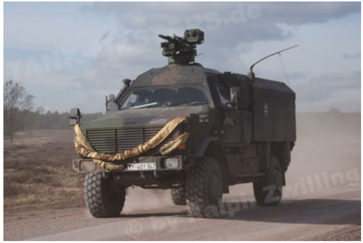
Dingo 2 GE C1 GSI (165).JPG