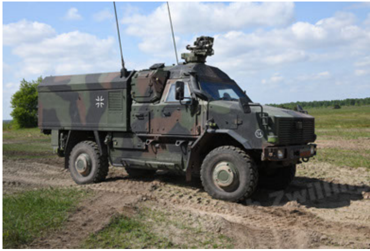
Dingo 2 GE C1 GSI (182).JPG