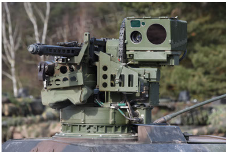
Dingo 2 GE C1 GSI (150).JPG