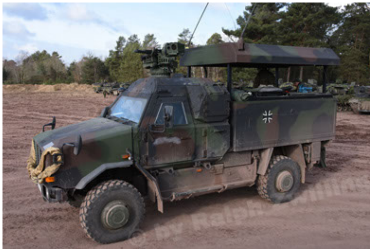
Dingo 2 GE C1 GSI (156).JPG