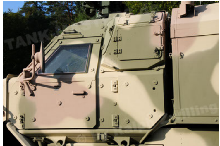
Dingo 2 GE C1 GSI (78).JPG