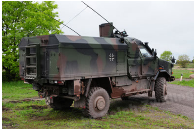
Dingo 2 GE C1 GSI (68).JPG