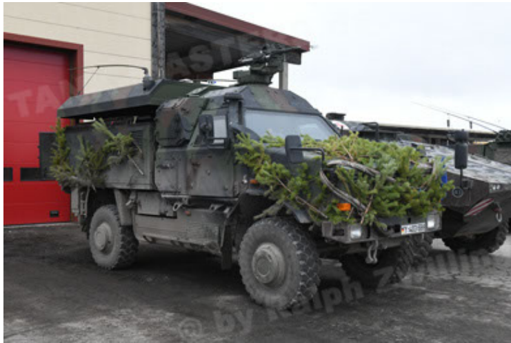
Dingo 2 GE C1 GSI (214).JPG