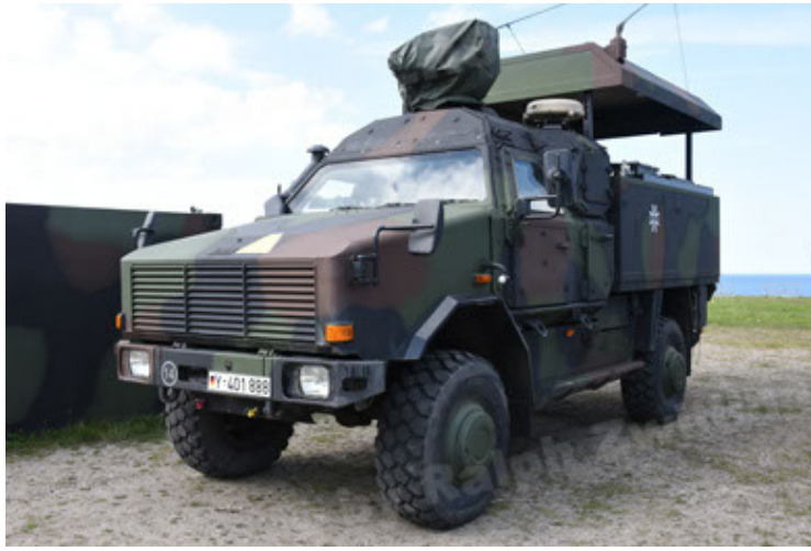
Dingo 2 GE C1 GSI (109).JPG