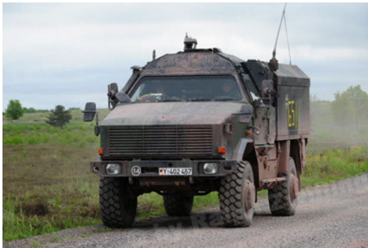
Dingo 2 GE C1 GSI (69).JPG