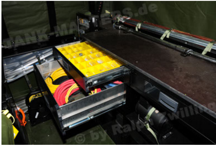
Dingo 2 GE C1 GSI (91).JPG