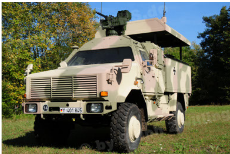
Dingo 2 GE C1 GSI (5).JPG