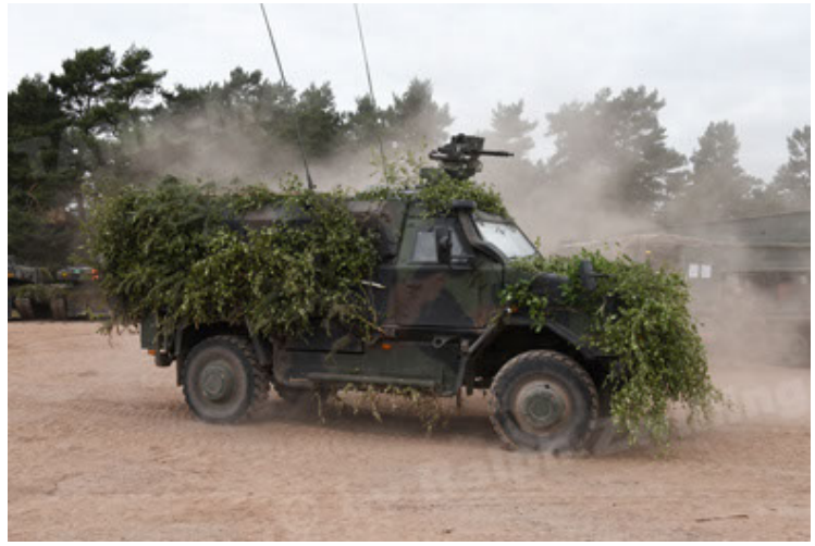
Dingo 2 GE C1 GSI (183).JPG