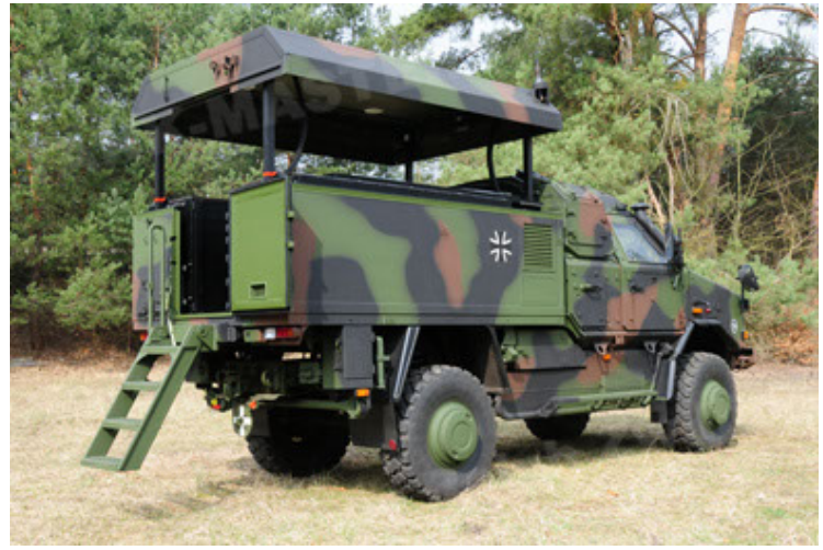
Dingo 2 GE C1 GSI (50).JPG