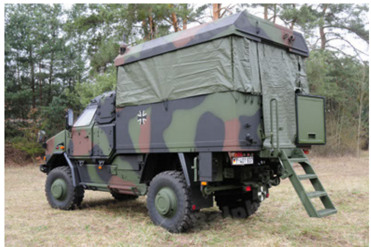
Dingo 2 GE C1 GSI (42).JPG