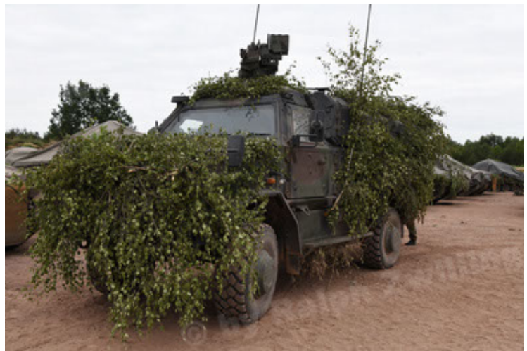
Dingo 2 GE C1 GSI (185).JPG