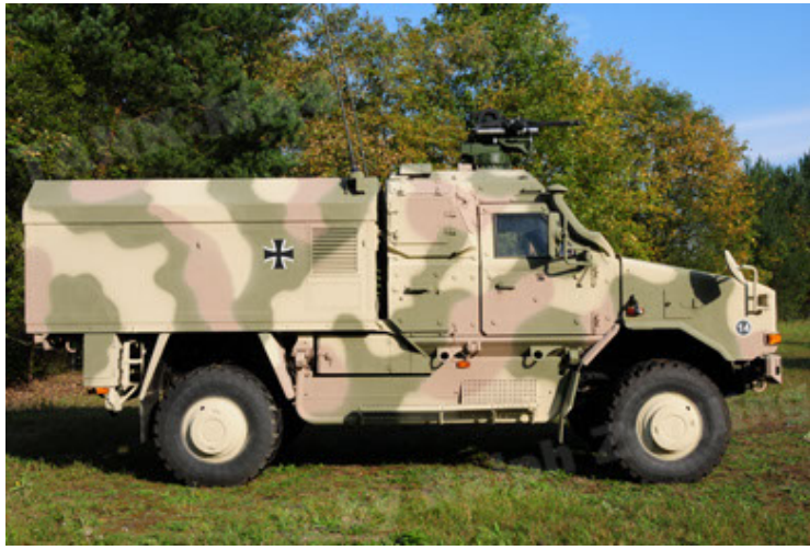
Dingo 2 GE C1 GSI (19).JPG