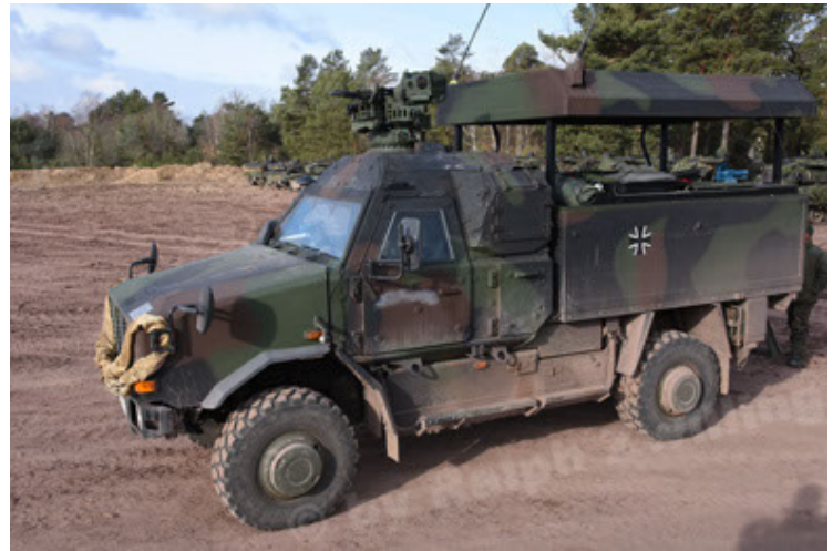
Dingo 2 GE C1 GSI (155).JPG