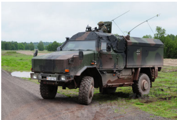
Dingo 2 GE C1 GSI (65).JPG