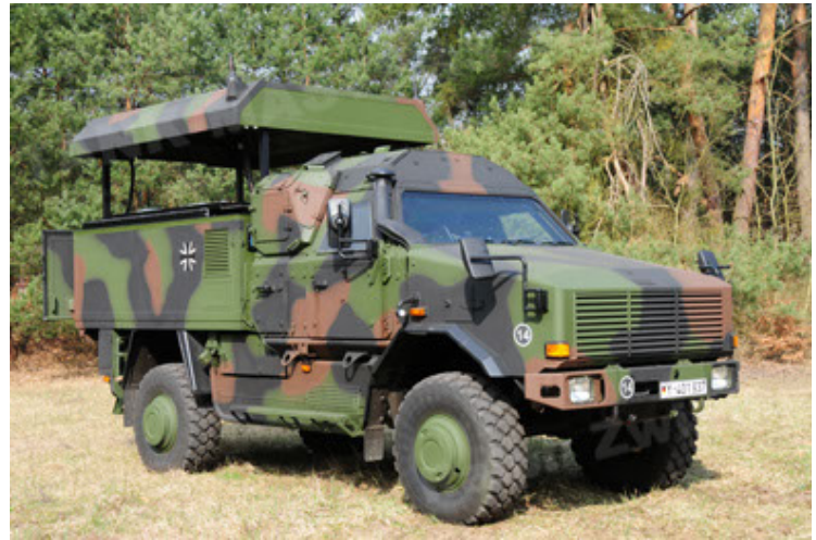
Dingo 2 GE C1 GSI (34).JPG