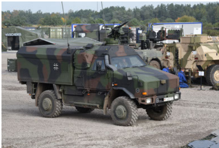
Dingo 2 GE C1 GSI (129).JPG