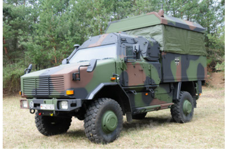
Dingo 2 GE C1 GSI (32).JPG