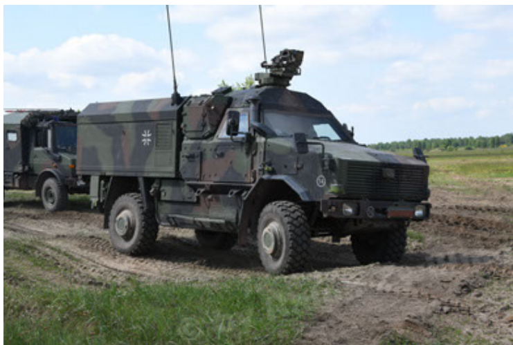
Dingo 2 GE C1 GSI (180).JPG