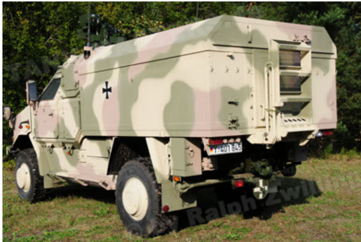
Dingo 2 GE C1 GSI (21).JPG