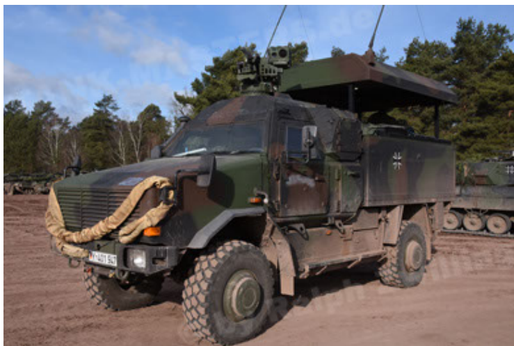
Dingo 2 GE C1 GSI (162).JPG