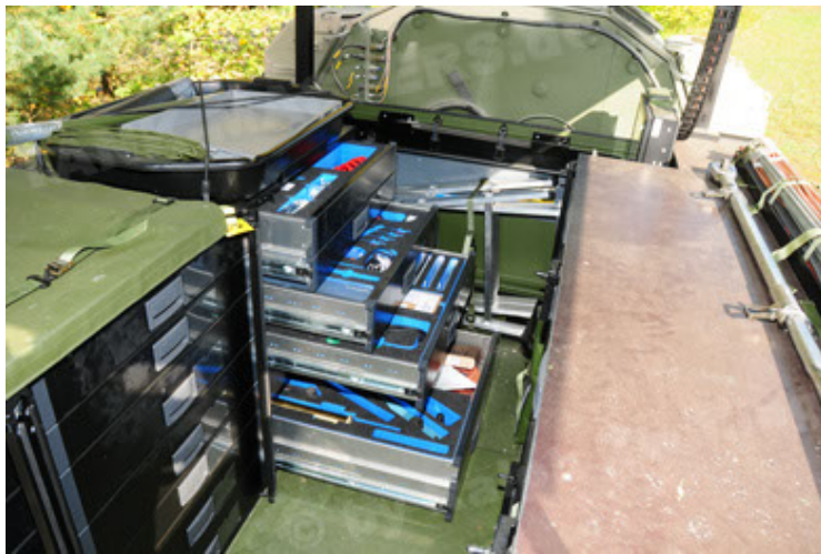
Dingo 2 GE C1 GSI (99).JPG