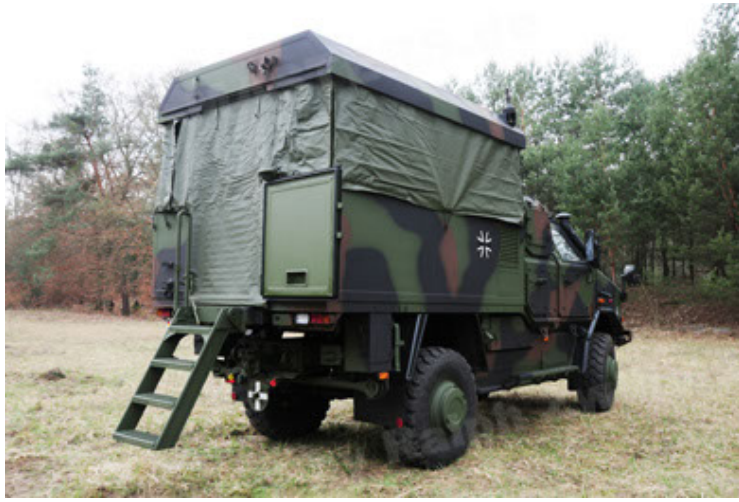
Dingo 2 GE C1 GSI (43).JPG