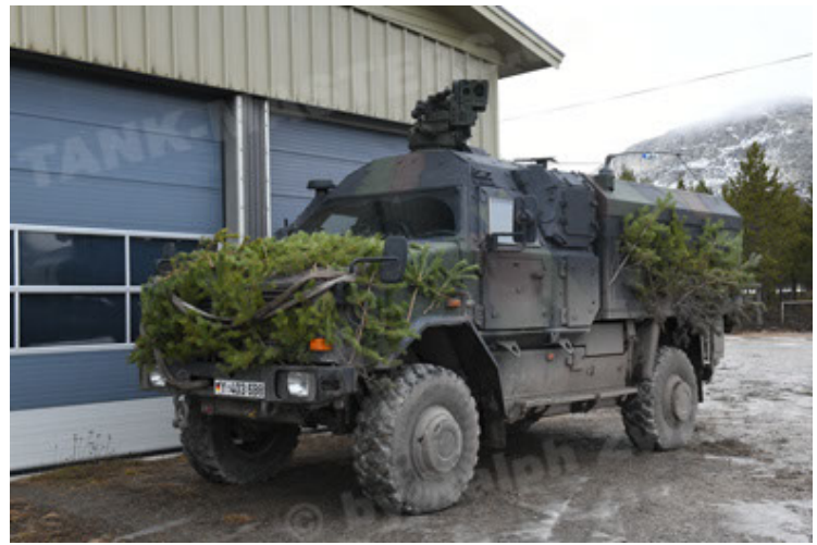
Dingo 2 GE C1 GSI (209).JPG