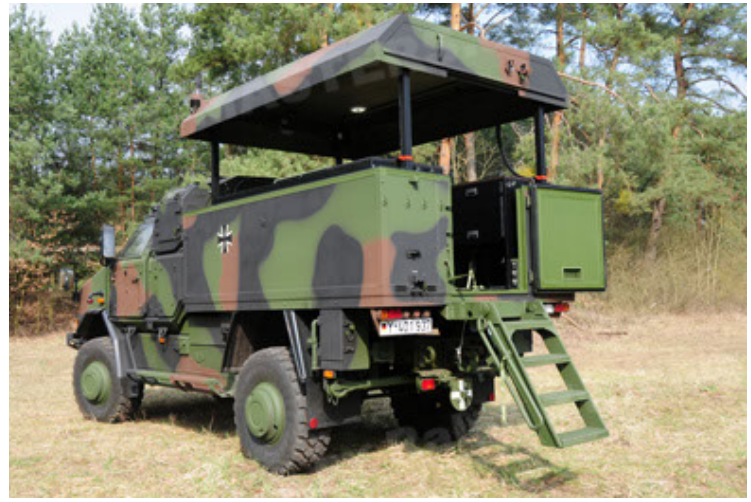
Dingo 2 GE C1 GSI (38).JPG