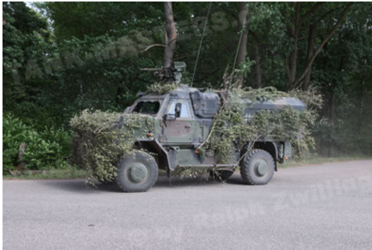
Dingo 2 GE C1 GSI (202).JPG