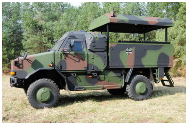
Dingo 2 GE C1 GSI (30).JPG