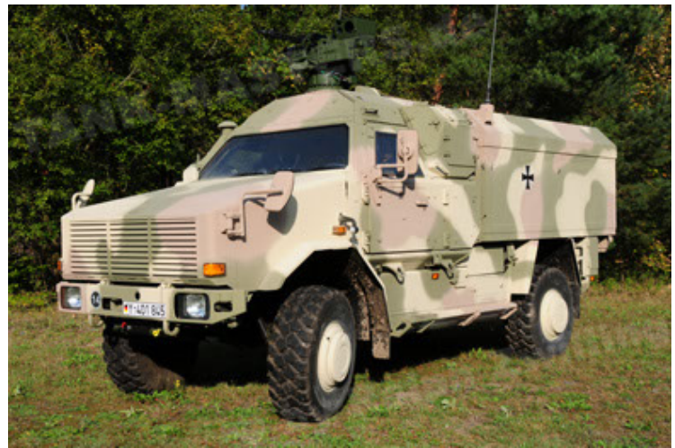
Dingo 2 GE C1 GSI (16).JPG