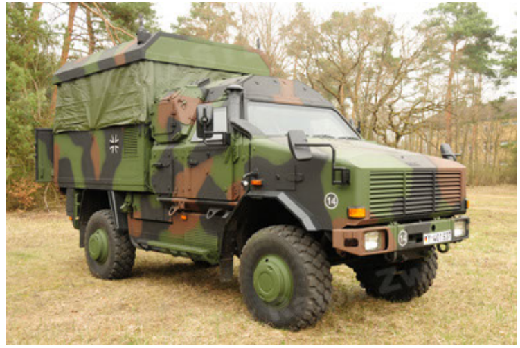
Dingo 2 GE C1 GSI (26).JPG