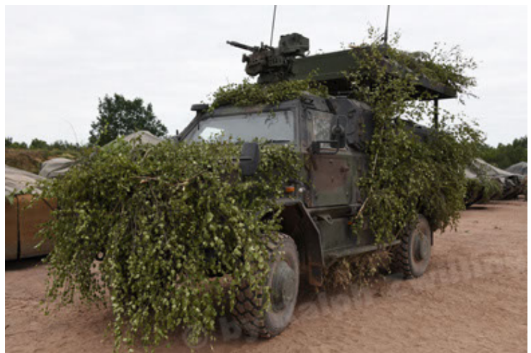
Dingo 2 GE C1 GSI (193).JPG