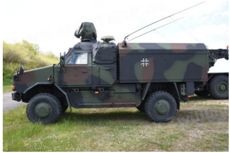
Dingo 2 GE C1 GSI (104).JPG