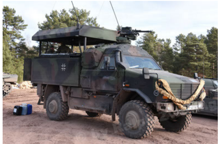
Dingo 2 GE C1 GSI (161).JPG