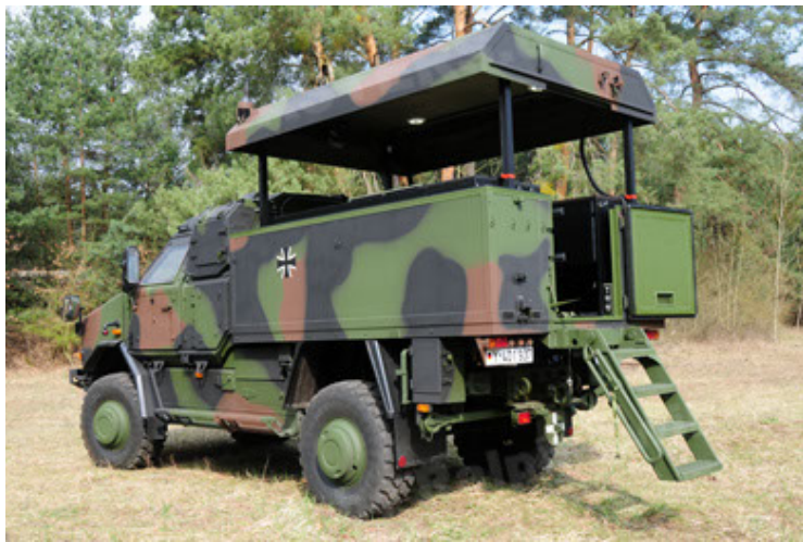
Dingo 2 GE C1 GSI (39).JPG