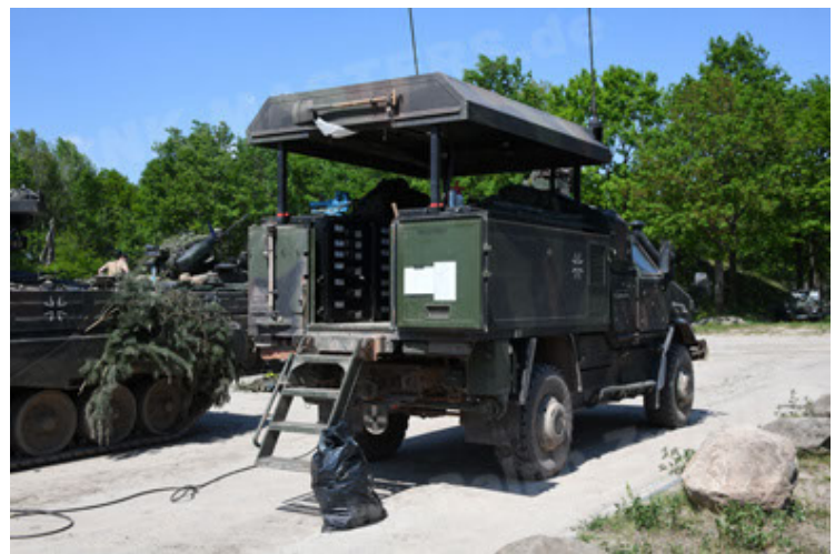
Dingo 2 GE C1 GSI (199).JPG