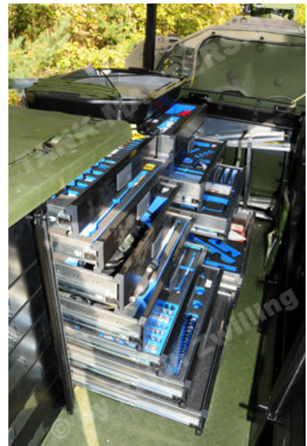
Dingo 2 GE C1 GSI (100).JPG