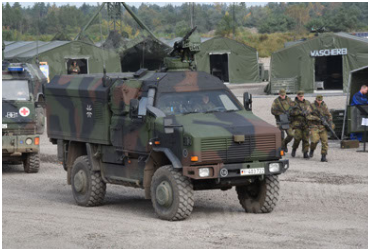
Dingo 2 GE C1 GSI (127).JPG