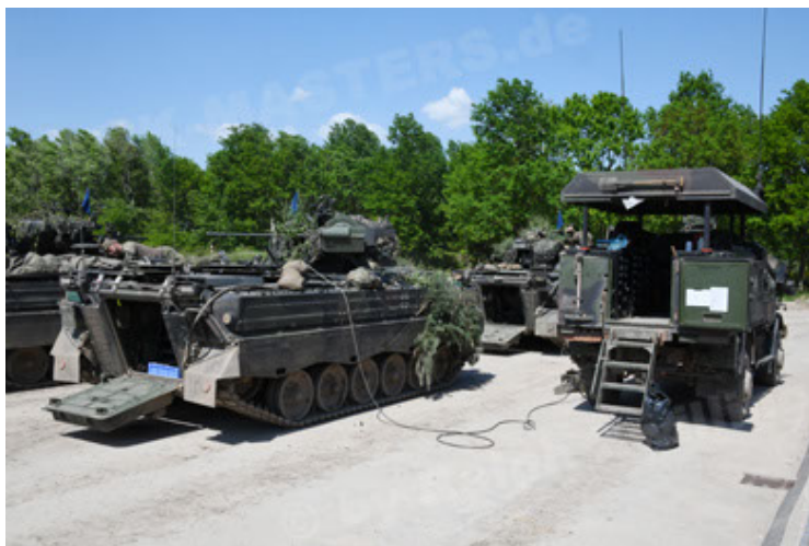
Dingo 2 GE C1 GSI (198).JPG