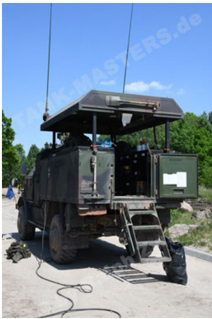
Dingo 2 GE C1 GSI (200).JPG