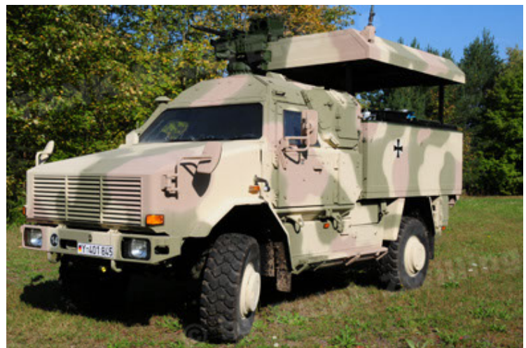
Dingo 2 GE C1 GSI (6).JPG