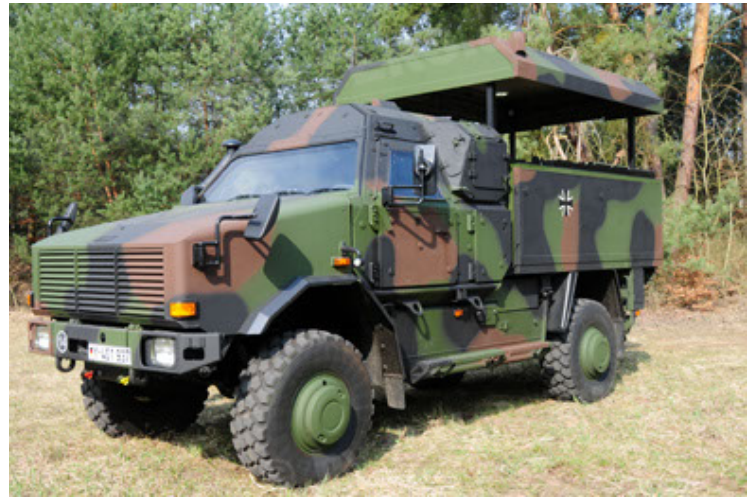
Dingo 2 GE C1 GSI (28).JPG