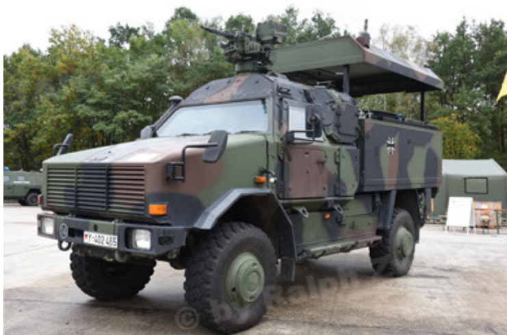
Dingo 2 GE C1 GSI (121).JPG