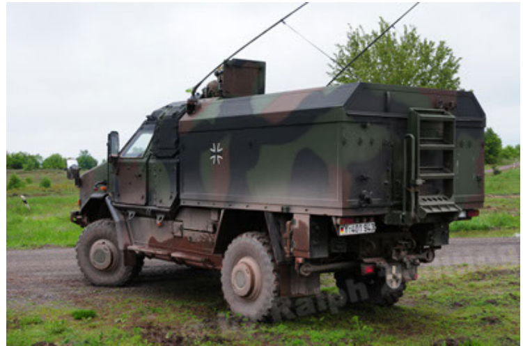
Dingo 2 GE C1 GSI (4).JPG