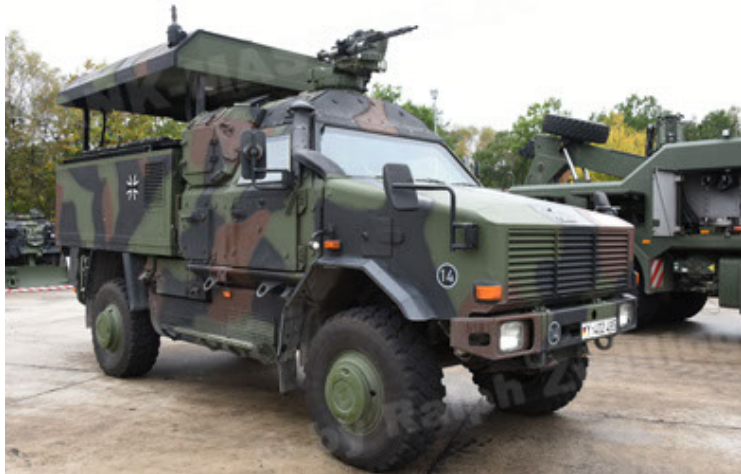
Dingo 2 GE C1 GSI (115).JPG