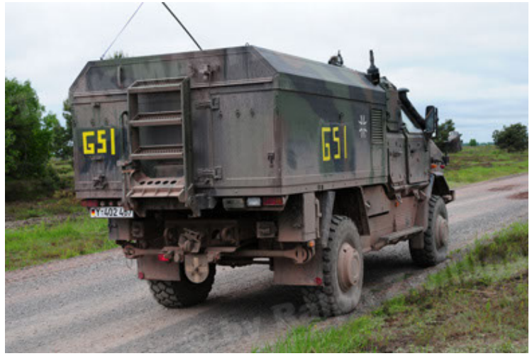
Dingo 2 GE C1 GSI (56).JPG