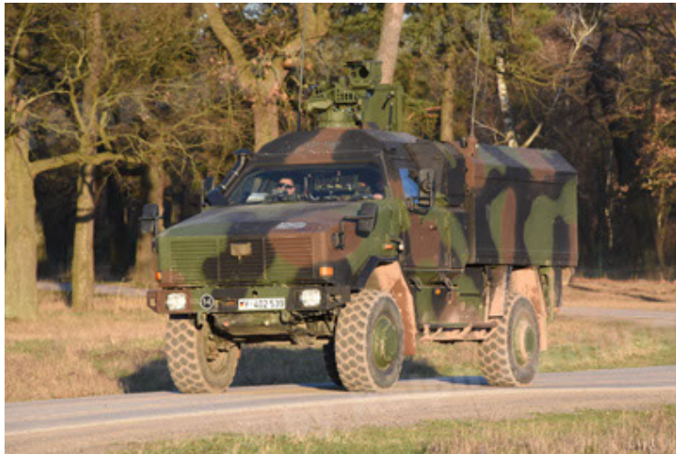
Dingo 2 GE C1 GSI (111).JPG