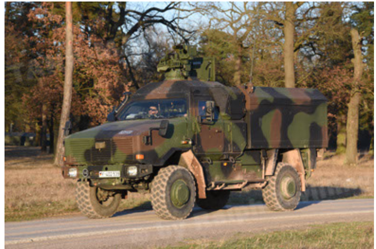
Dingo 2 GE C1 GSI (112).JPG