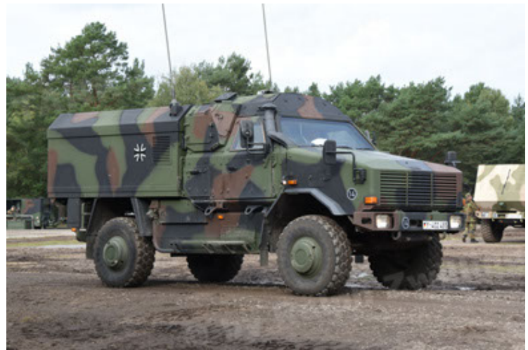
Dingo 2 GE C1 GSI (70).JPG