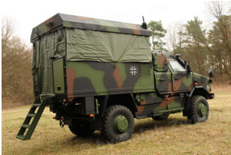
Dingo 2 GE C1 GSI (27).JPG