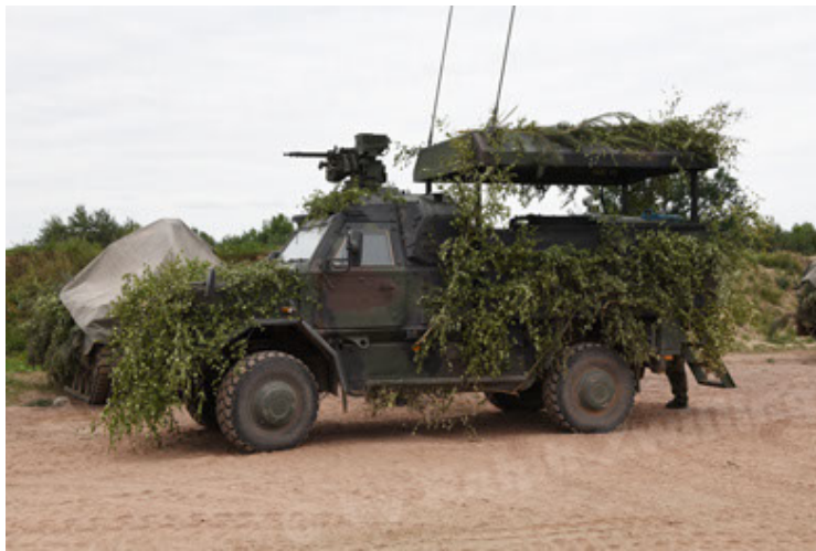
Dingo 2 GE C1 GSI (190).JPG