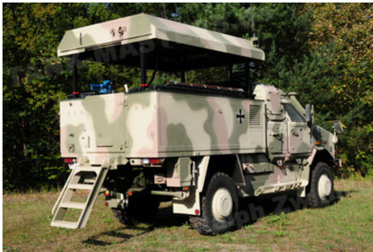
Dingo 2 GE C1 GSI (9).JPG