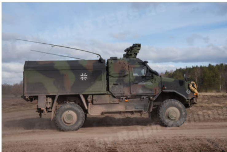
Dingo 2 GE C1 GSI (168).JPG