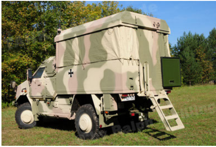
Dingo 2 GE C1 GSI (13).JPG