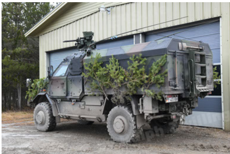
Dingo 2 GE C1 GSI (204).JPG