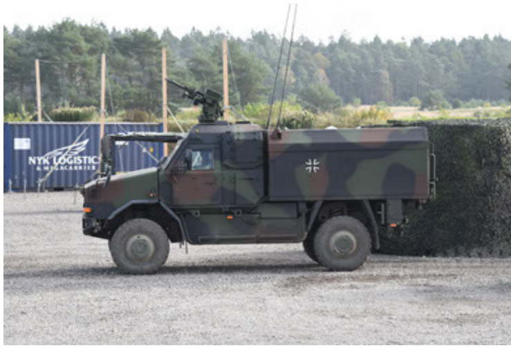
Dingo 2 GE C1 GSI (133).JPG