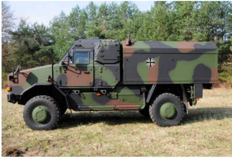
Dingo 2 GE C1 GSI (25).JPG