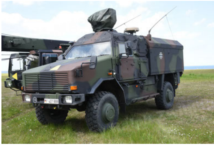
Dingo 2 GE C1 GSI (103).JPG