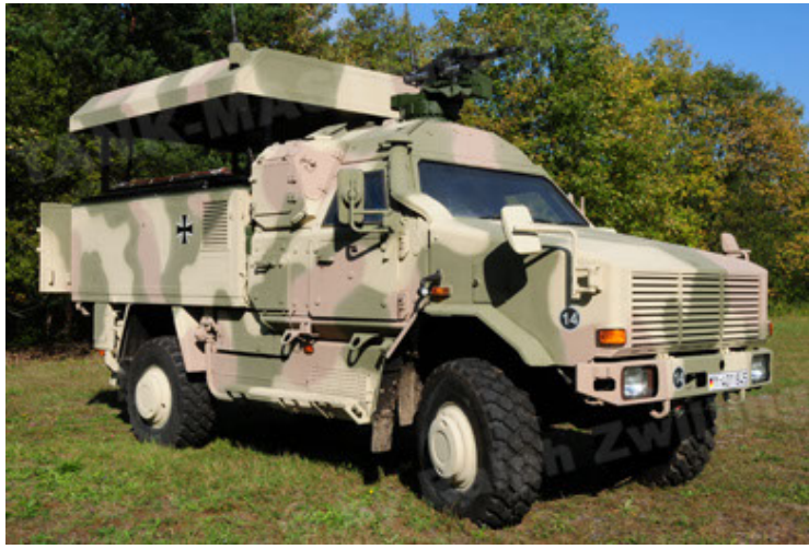
Dingo 2 GE C1 GSI (7).JPG