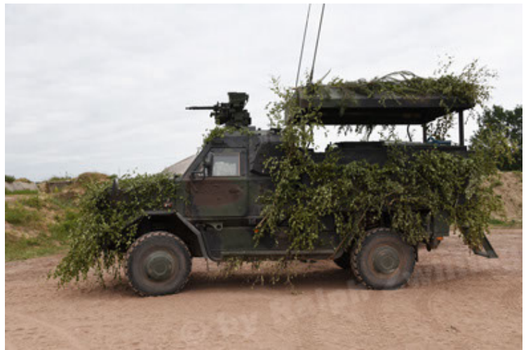
Dingo 2 GE C1 GSI (191).JPG