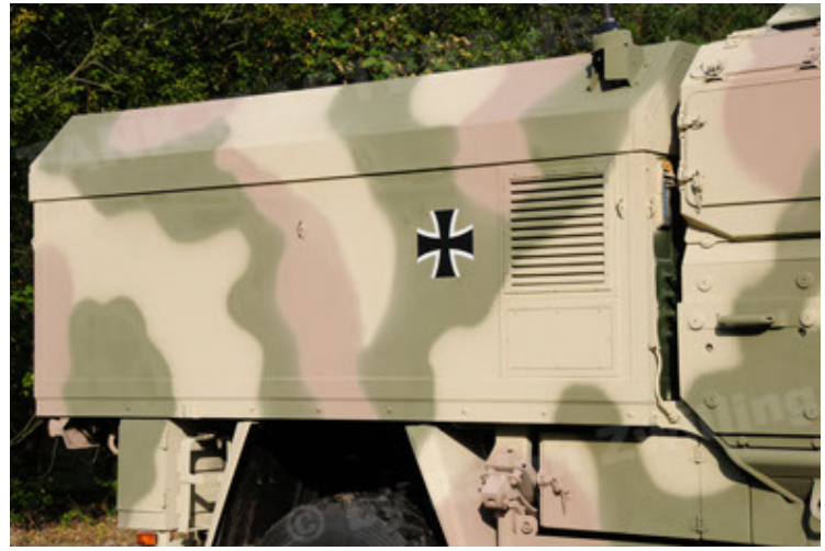
Dingo 2 GE C1 GSI (80).JPG