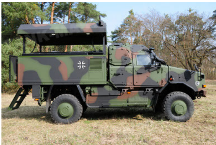
Dingo 2 GE C1 GSI (35).JPG