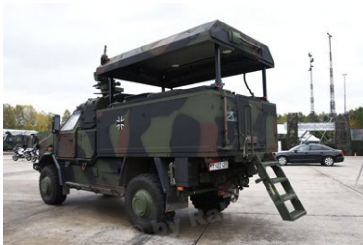
Dingo 2 GE C1 GSI (122).JPG