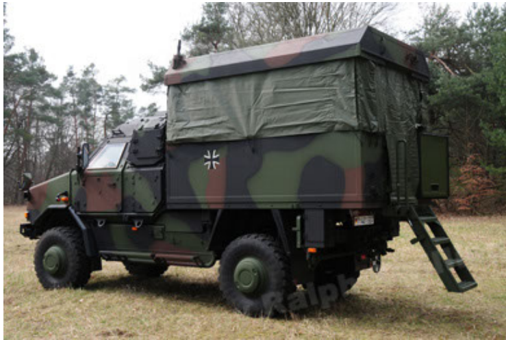
Dingo 2 GE C1 GSI (33).JPG