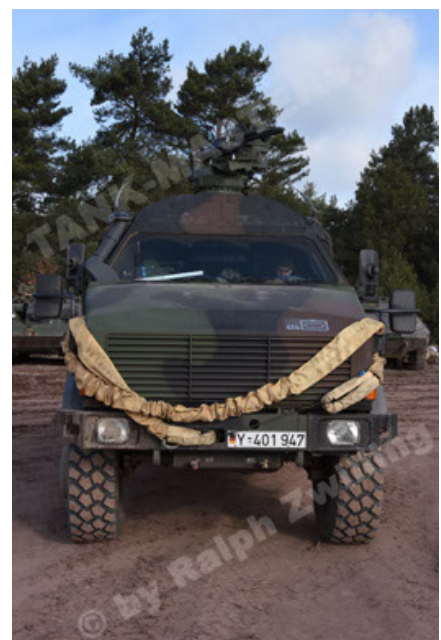
Dingo 2 GE C1 GSI (145).JPG