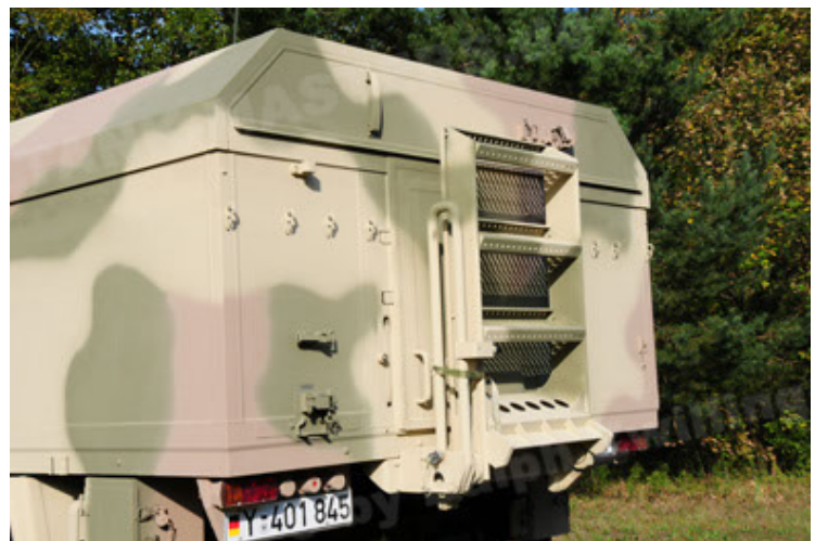
Dingo 2 GE C1 GSI (84).JPG