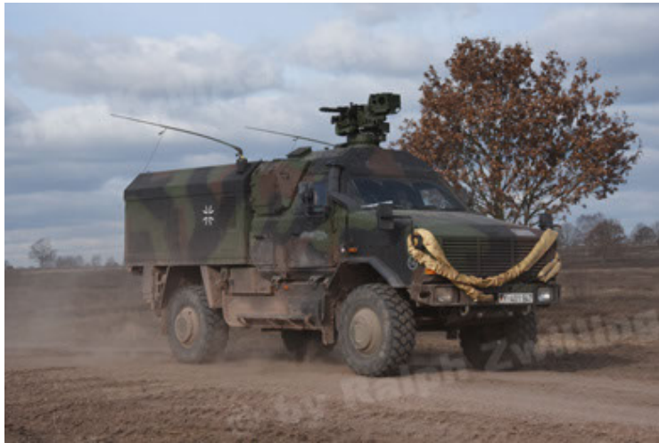
Dingo 2 GE C1 GSI (166).JPG