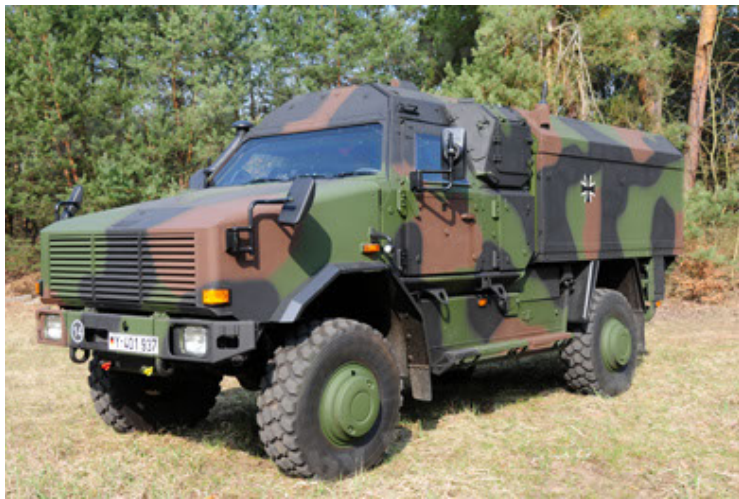
Dingo 2 GE C1 GSI (45).JPG