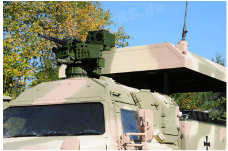
Dingo 2 GE C1 GSI (76).JPG