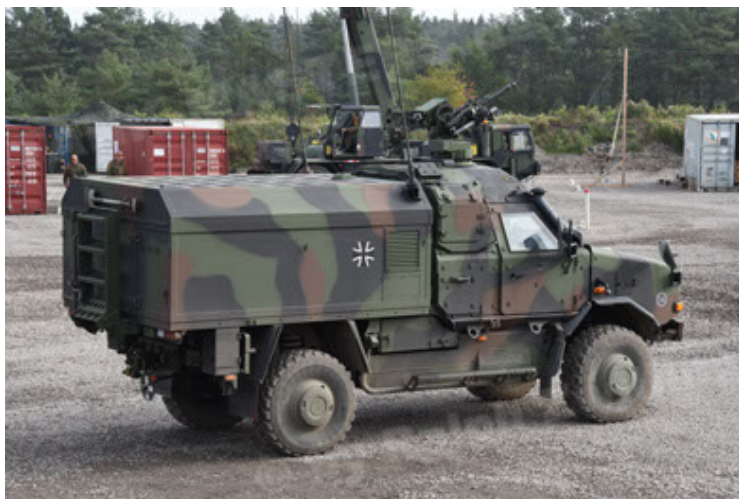
Dingo 2 GE C1 GSI (131).JPG