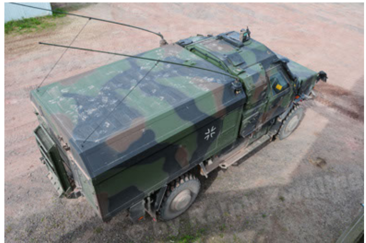
Dingo 2 GE C1 GSI (64).JPG