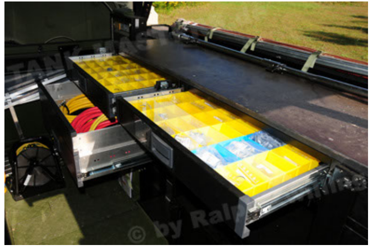
Dingo 2 GE C1 GSI (98).JPG