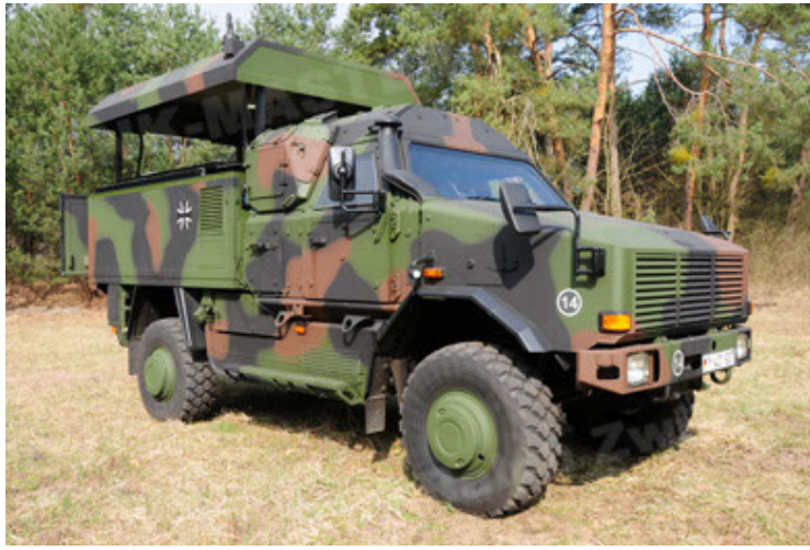
Dingo 2 GE C1 GSI (37).JPG