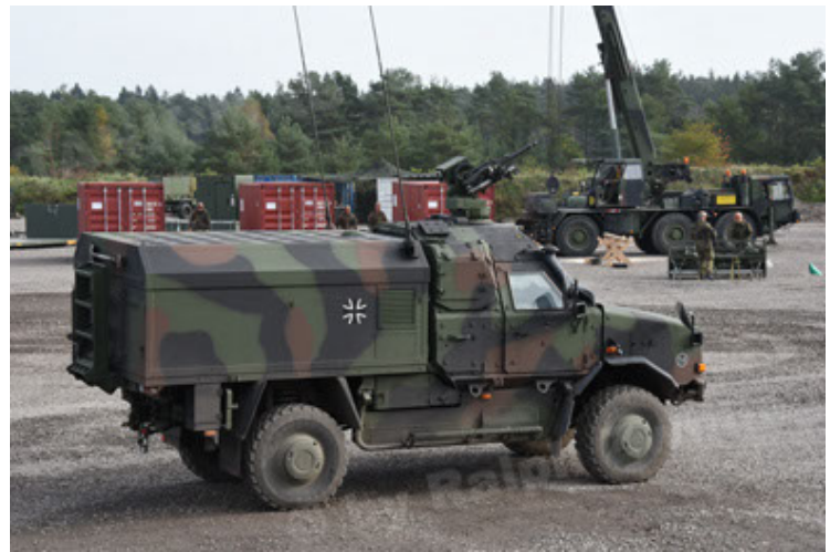
Dingo 2 GE C1 GSI (130).JPG