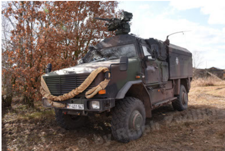
Dingo 2 GE C1 GSI (172).JPG