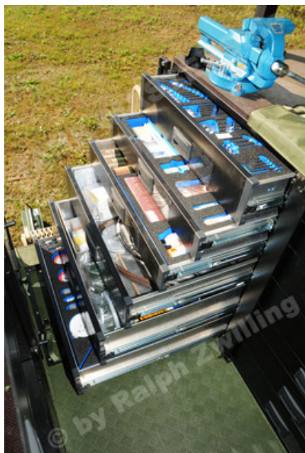
Dingo 2 GE C1 GSI (101).JPG