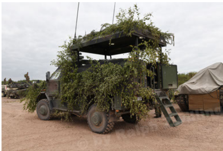
Dingo 2 GE C1 GSI (192).JPG