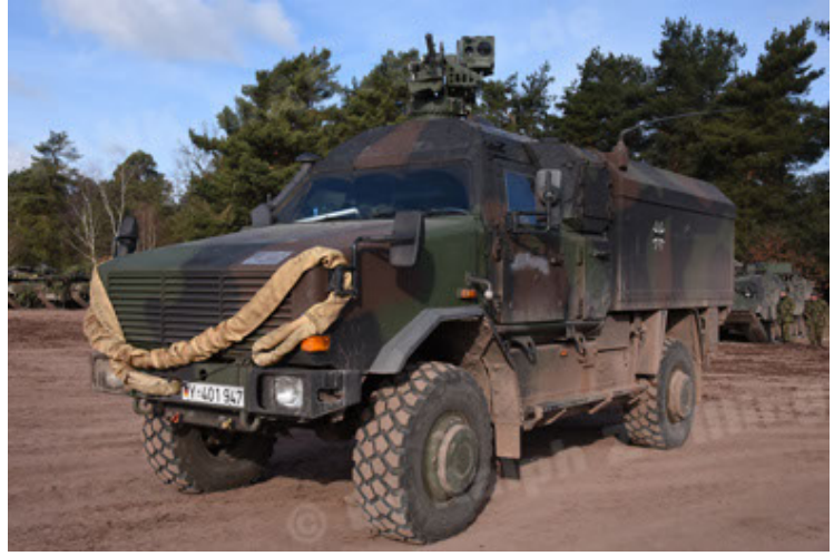
Dingo 2 GE C1 GSI (147).JPG