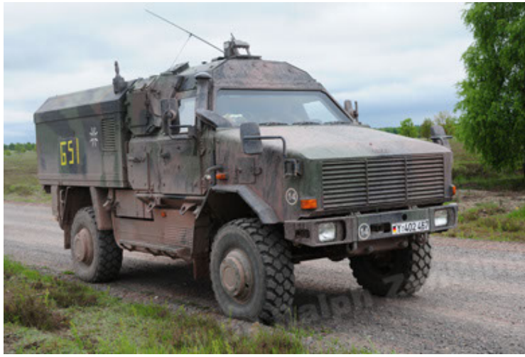
Dingo 2 GE C1 GSI (55).JPG