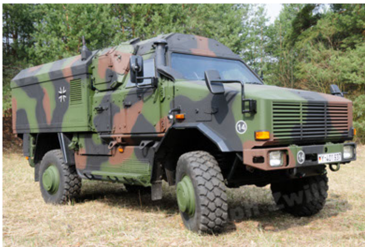
Dingo 2 GE C1 GSI (47).JPG