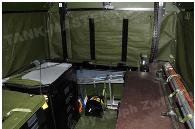
Dingo 2 GE C1 GSI (90).JPG