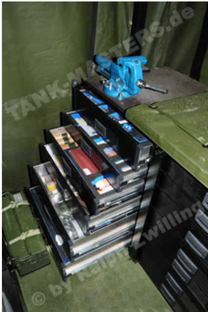
Dingo 2 GE C1 GSI (93).JPG