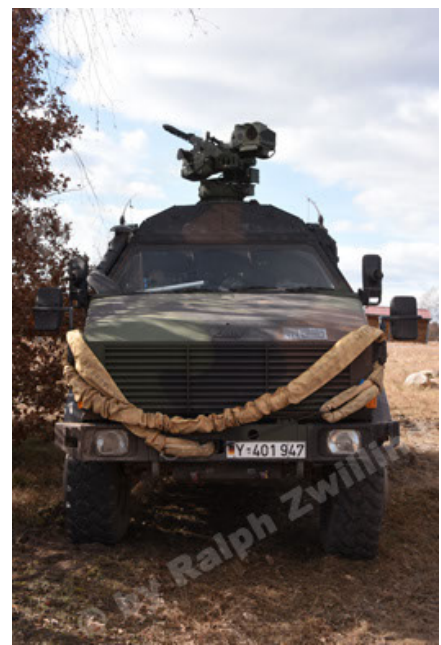
Dingo 2 GE C1 GSI (171).JPG