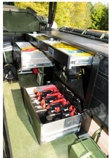
Dingo 2 GE C1 GSI (102).JPG