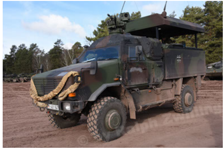
Dingo 2 GE C1 GSI (159).JPG