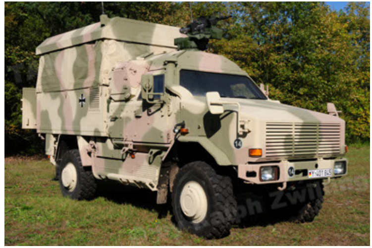
Dingo 2 GE C1 GSI (8).JPG