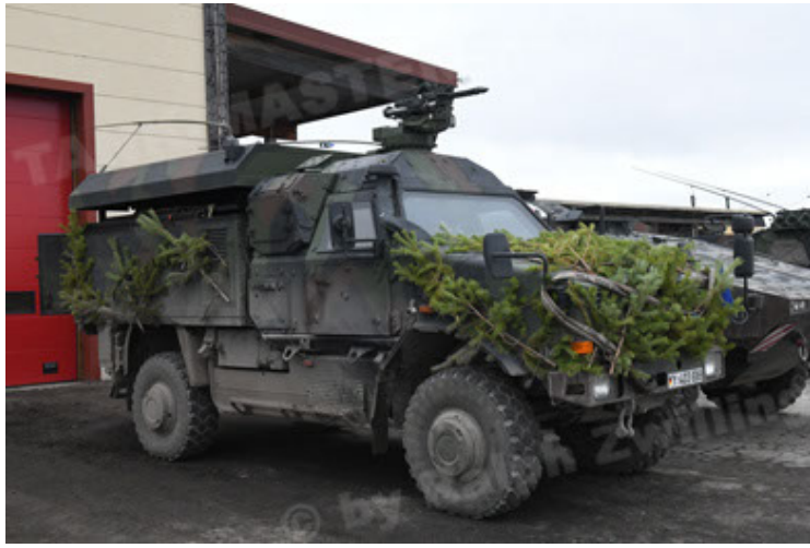
Dingo 2 GE C1 GSI (212).JPG