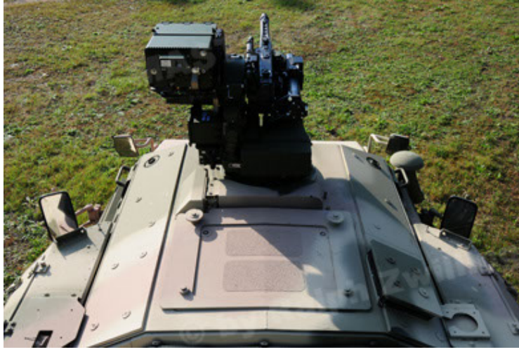
Dingo 2 GE C1 GSI (73).JPG