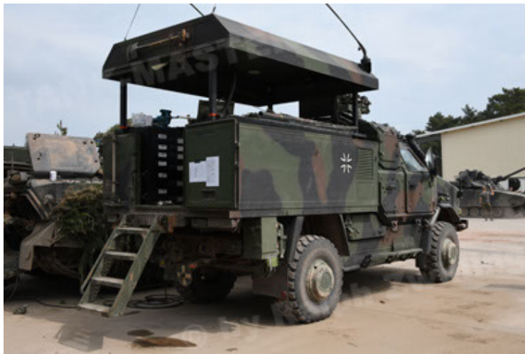
Dingo 2 GE C1 GSI (196).JPG