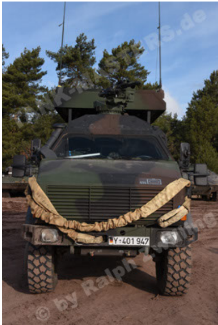
Dingo 2 GE C1 GSI (160).JPG