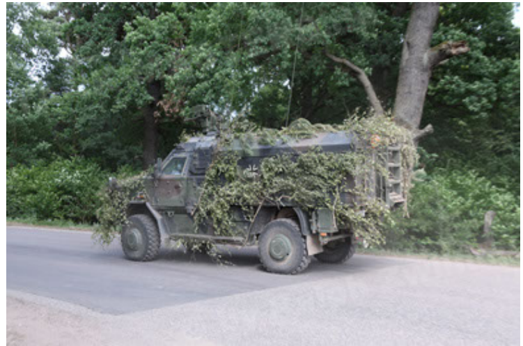
Dingo 2 GE C1 GSI (203).JPG