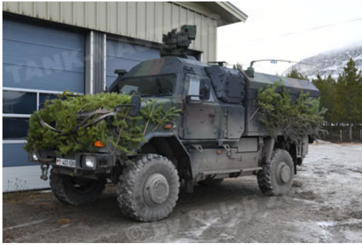
Dingo 2 GE C1 GSI (206).JPG