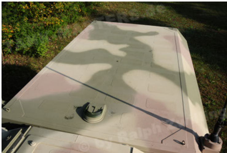
Dingo 2 GE C1 GSI (77).JPG