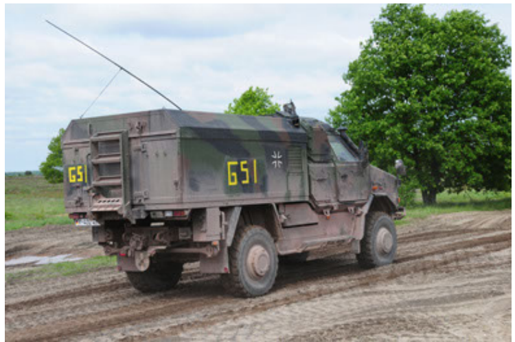
Dingo 2 GE C1 GSI (58).JPG