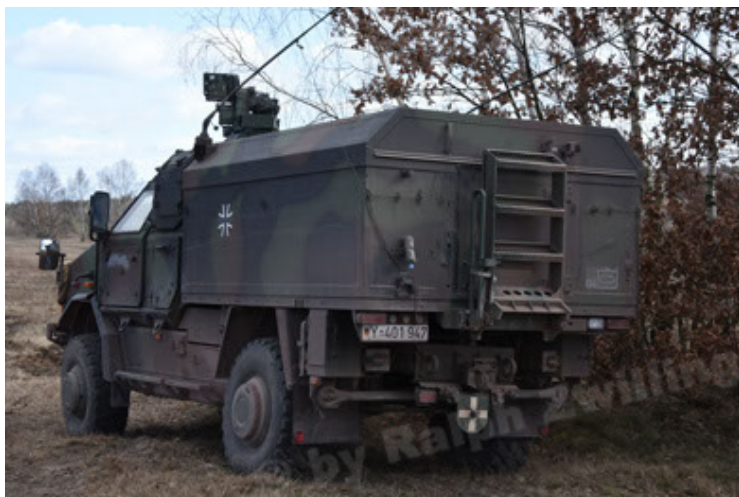
Dingo 2 GE C1 GSI (174).JPG