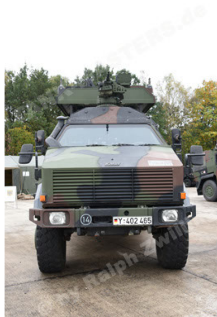
Dingo 2 GE C1 GSI (118).JPG