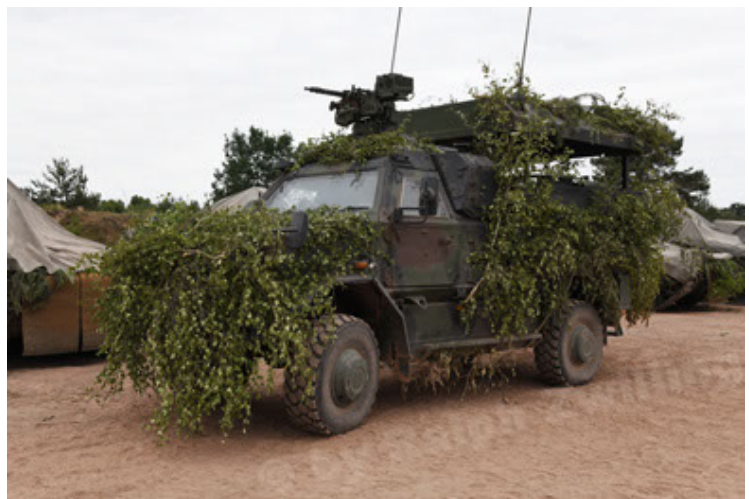
Dingo 2 GE C1 GSI (187).JPG