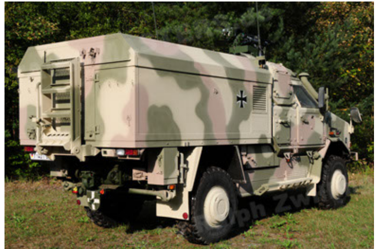
Dingo 2 GE C1 GSI (22).JPG