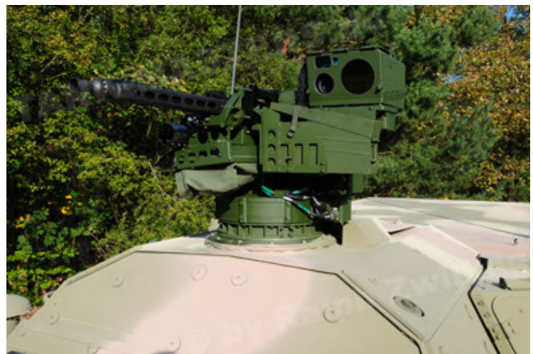
Dingo 2 GE C1 GSI (72).JPG