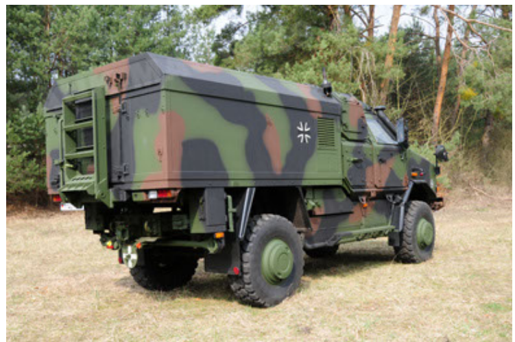
Dingo 2 GE C1 GSI (48).JPG