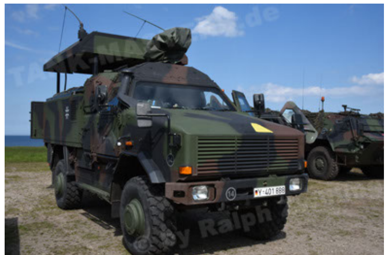
Dingo 2 GE C1 GSI (108).JPG