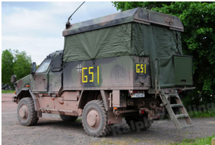
Dingo 2 GE C1 GSI (63).JPG