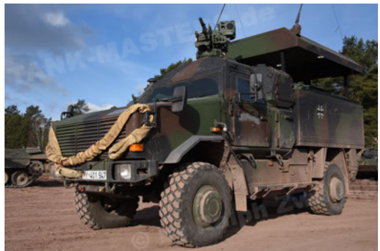
Dingo 2 GE C1 GSI (163).JPG