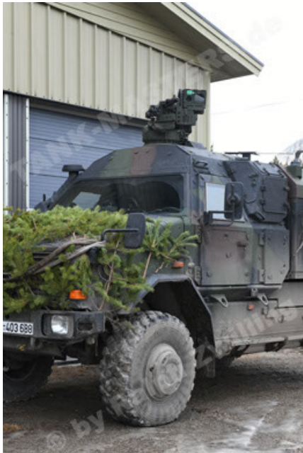
Dingo 2 GE C1 GSI (208).JPG