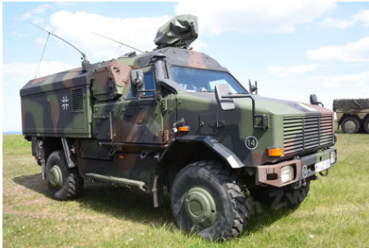
Dingo 2 GE C1 GSI (105).JPG