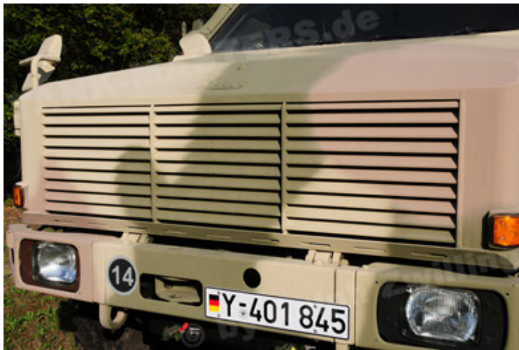
Dingo 2 GE C1 GSI (81).JPG