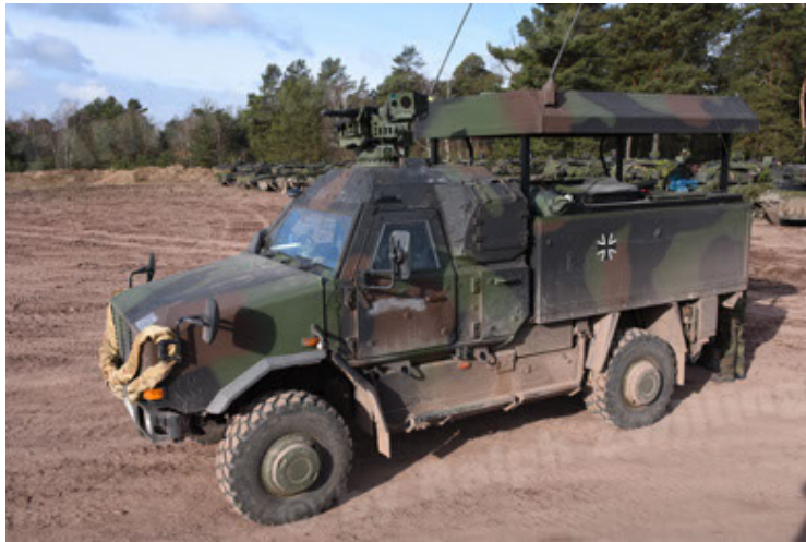
Dingo 2 GE C1 GSI (154).JPG