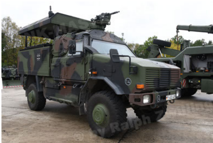
Dingo 2 GE C1 GSI (117).JPG