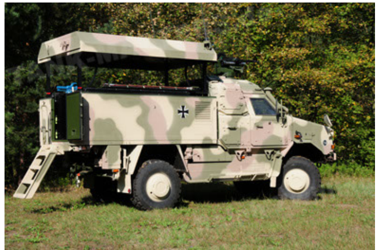
Dingo 2 GE C1 GSI (10).JPG