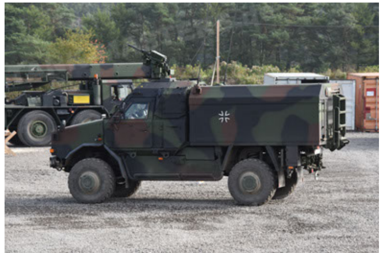
Dingo 2 GE C1 GSI (136).JPG