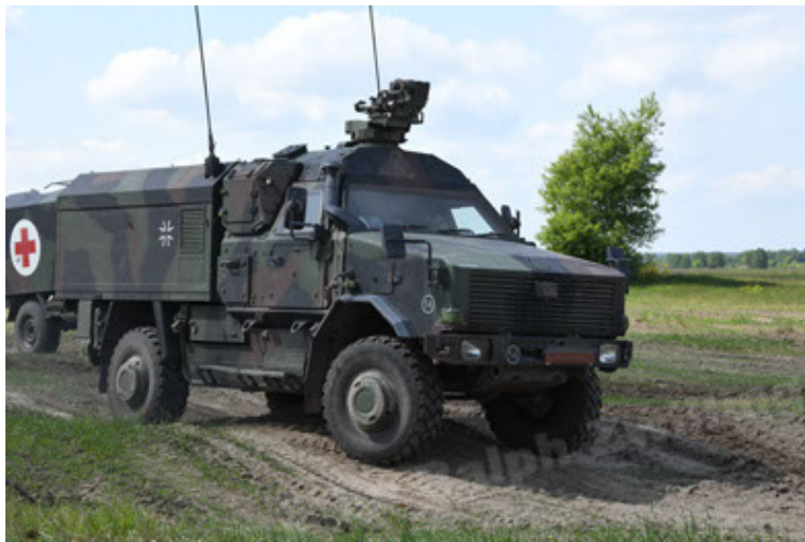
Dingo 2 GE C1 GSI (178).JPG