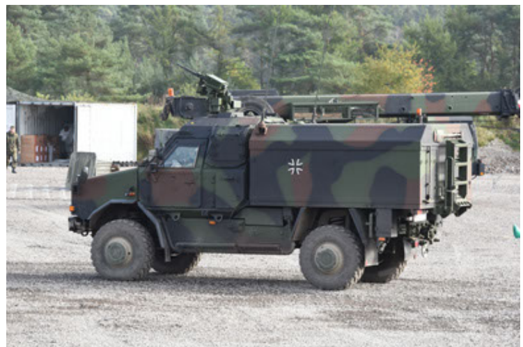
Dingo 2 GE C1 GSI (138).JPG