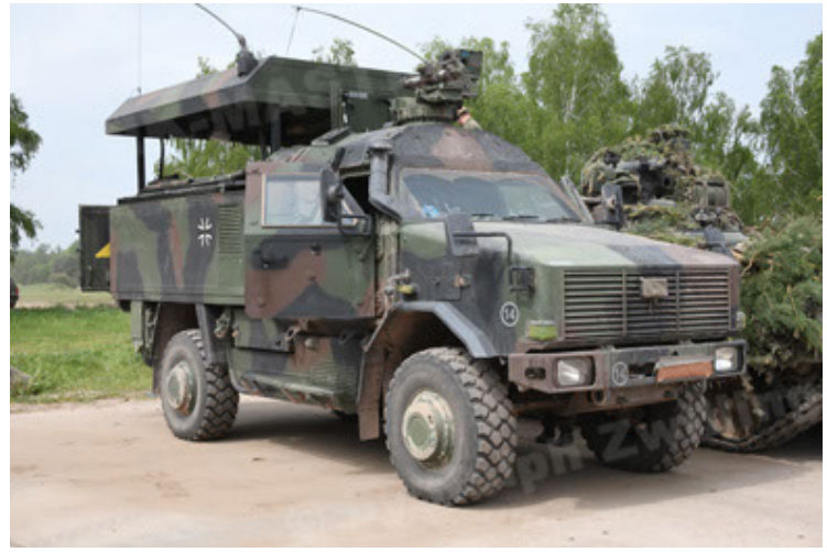
Dingo 2 GE C1 GSI (195).JPG