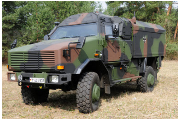
Dingo 2 GE C1 GSI (46).JPG