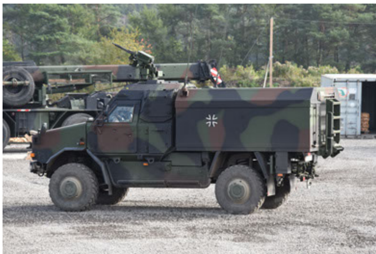
Dingo 2 GE C1 GSI (137).JPG