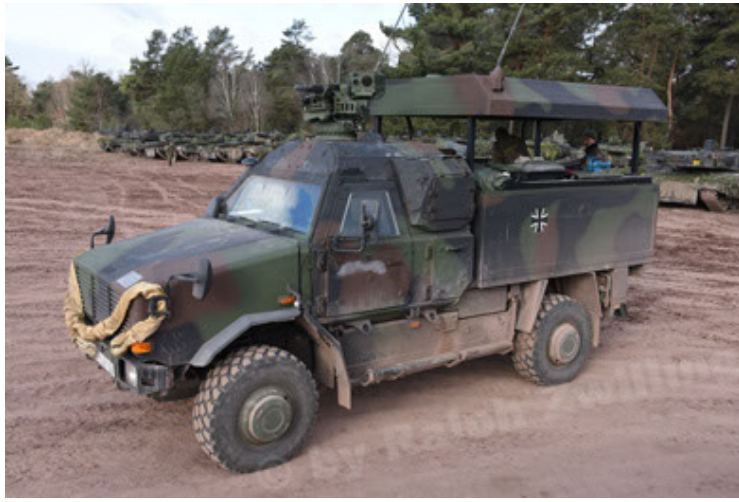
Dingo 2 GE C1 GSI (158).JPG