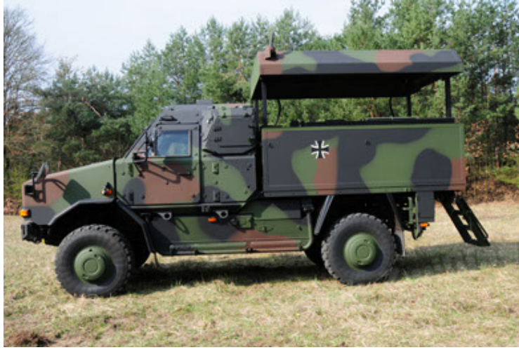
Dingo 2 GE C1 GSI (31).JPG