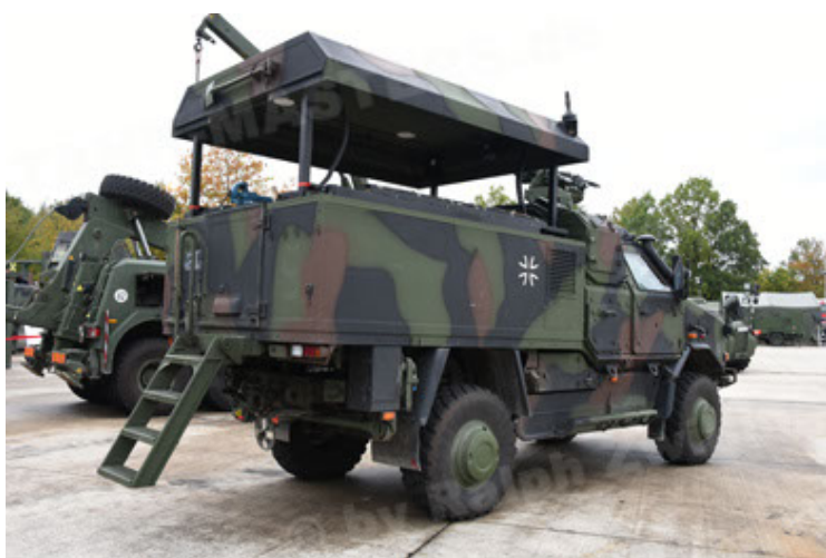
Dingo 2 GE C1 GSI (123).JPG