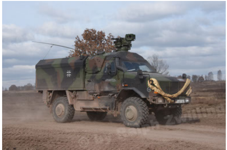
Dingo 2 GE C1 GSI (167).JPG