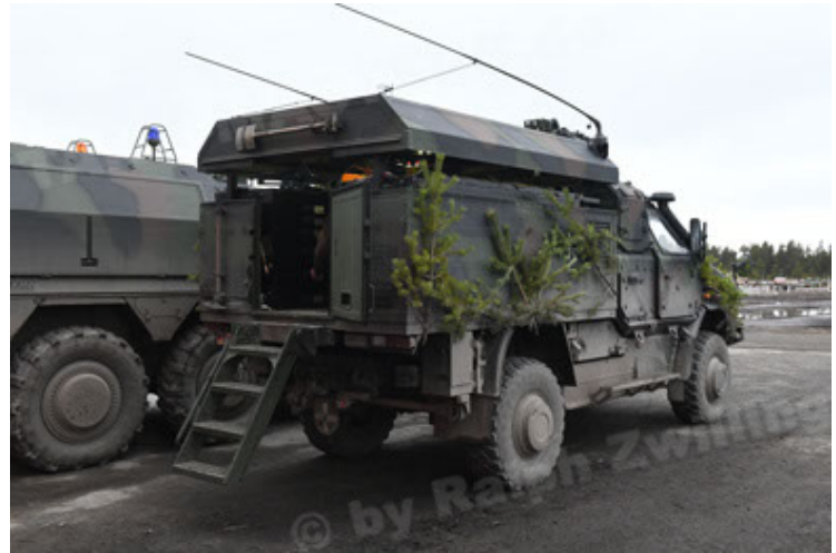
Dingo 2 GE C1 GSI (215).JPG