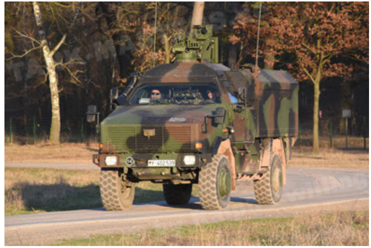
Dingo 2 GE C1 GSI (110).JPG