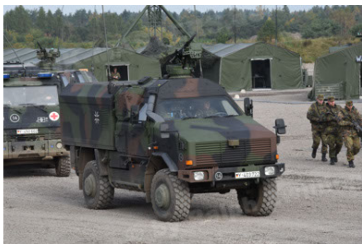
Dingo 2 GE C1 GSI (126).JPG