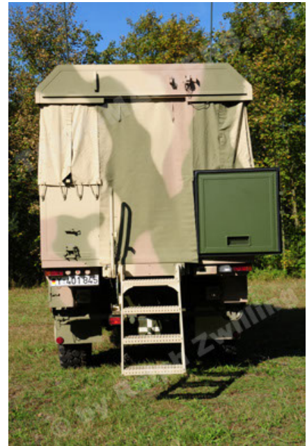
Dingo 2 GE C1 GSI (88).JPG