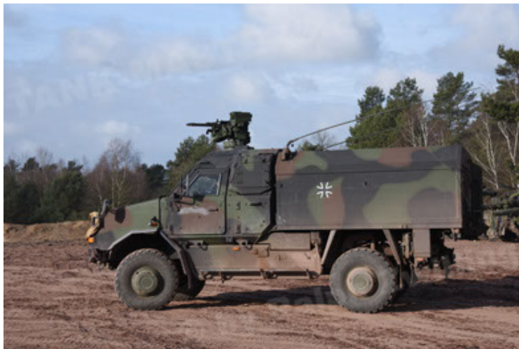
Dingo 2 GE C1 GSI (141).JPG