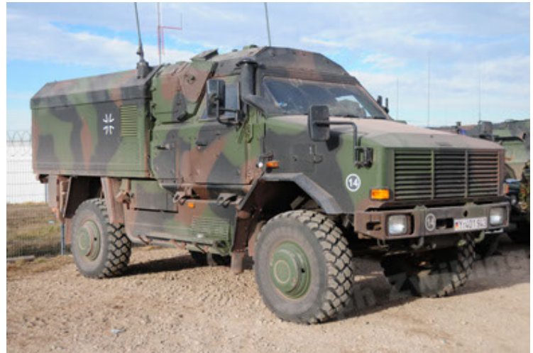
Dingo 2 GE C1 GSI (52).JPG