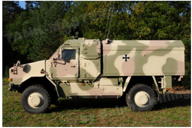
Dingo 2 GE C1 GSI (20).JPG