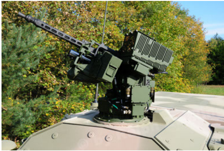
Dingo 2 GE C1 GSI (75).JPG