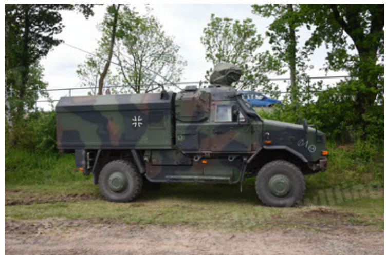
Dingo 2 GE C1 GSI (114).JPG