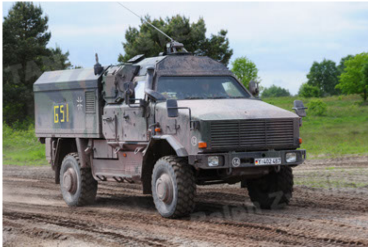
Dingo 2 GE C1 GSI (3).JPG