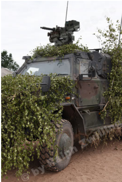
Dingo 2 GE C1 GSI (184).JPG