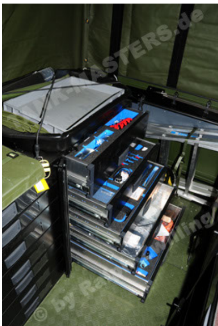
Dingo 2 GE C1 GSI (95).JPG