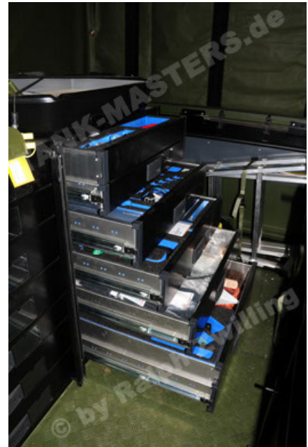
Dingo 2 GE C1 GSI (94).JPG