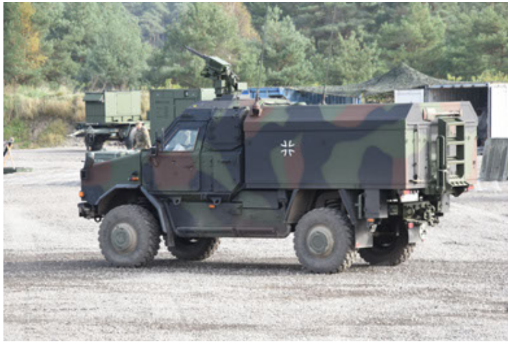
Dingo 2 GE C1 GSI (139).JPG