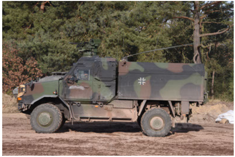
Dingo 2 GE C1 GSI (140).JPG