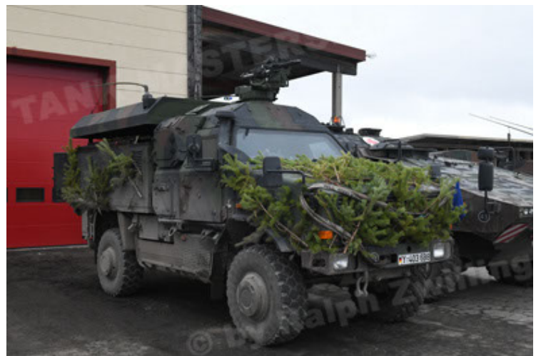
Dingo 2 GE C1 GSI (211).JPG