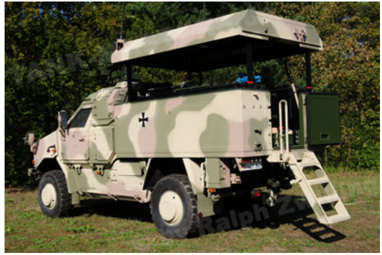
Dingo 2 GE C1 GSI (2).JPG