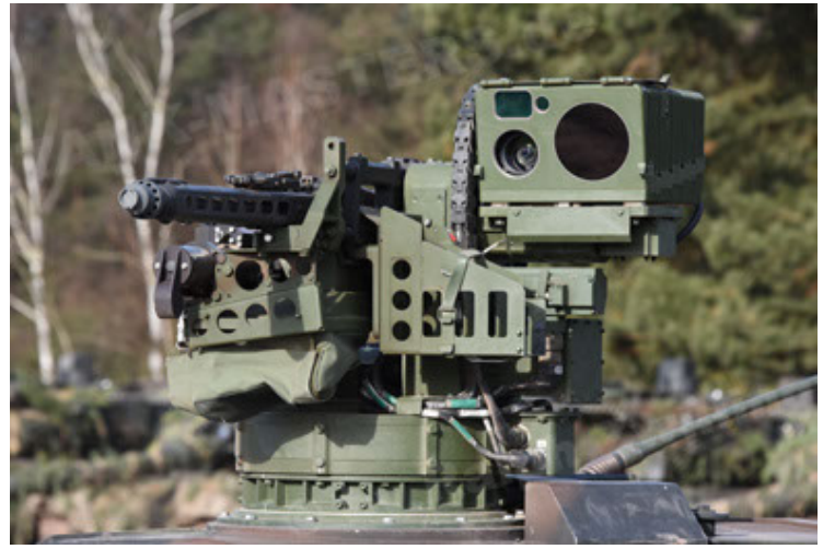
Dingo 2 GE C1 GSI (153).JPG