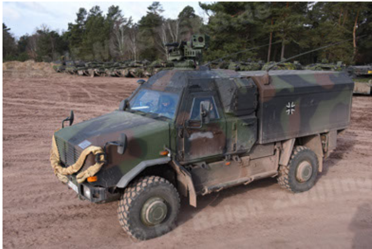
Dingo 2 GE C1 GSI (148).JPG