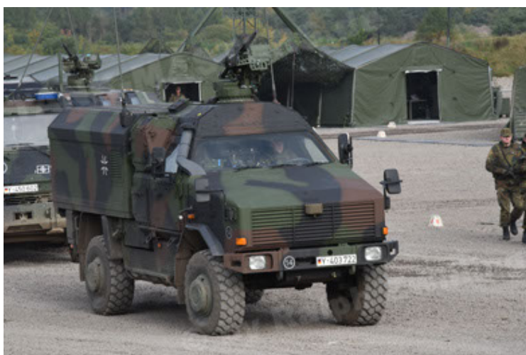
Dingo 2 GE C1 GSI (125).JPG