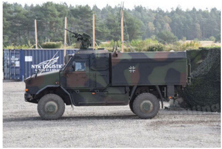
Dingo 2 GE C1 GSI (134).JPG