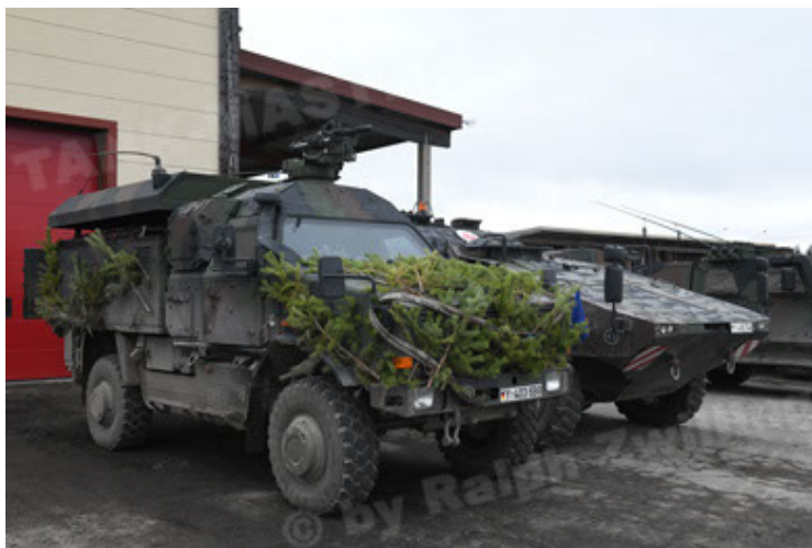
Dingo 2 GE C1 GSI (210).JPG