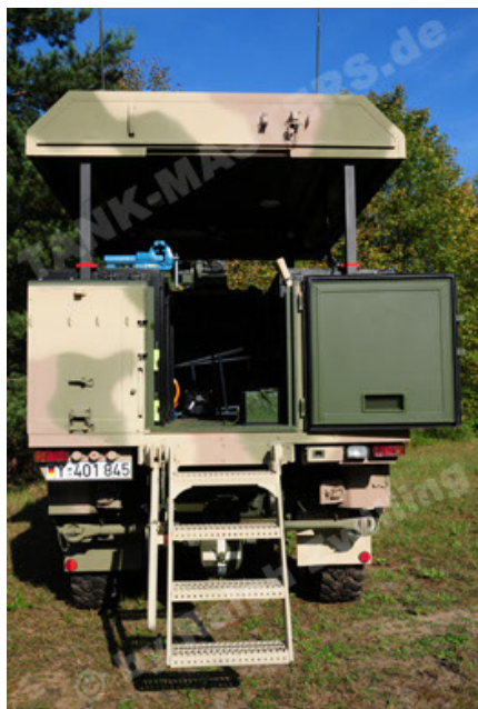
Dingo 2 GE C1 GSI (23).JPG