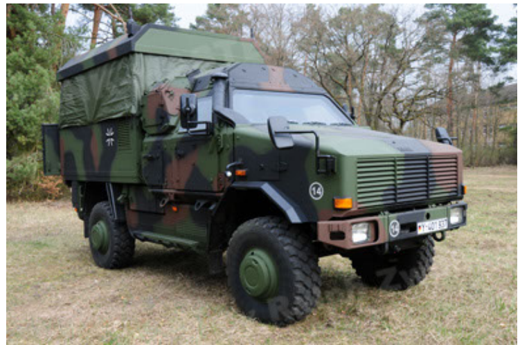
Dingo 2 GE C1 GSI (40).JPG