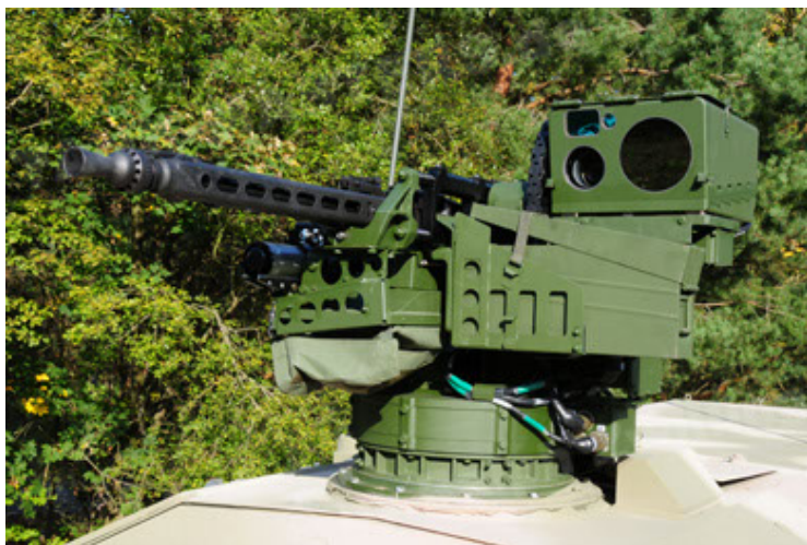
Dingo 2 GE C1 GSI (71).JPG