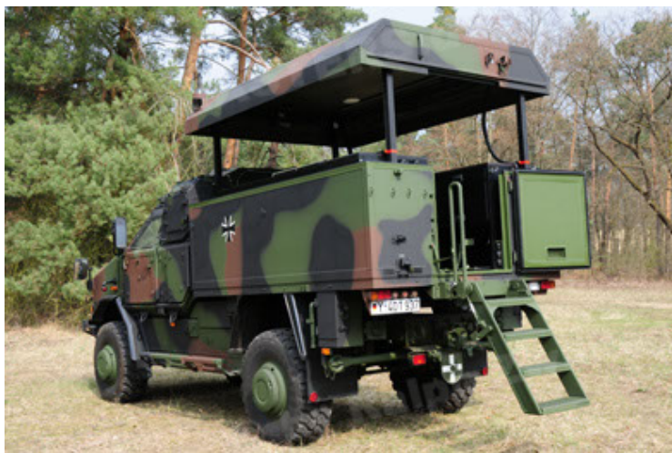
Dingo 2 GE C1 GSI (41).JPG