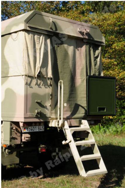
Dingo 2 GE C1 GSI (87).JPG