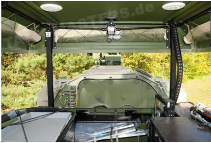
Dingo 2 GE C1 GSI (97).JPG