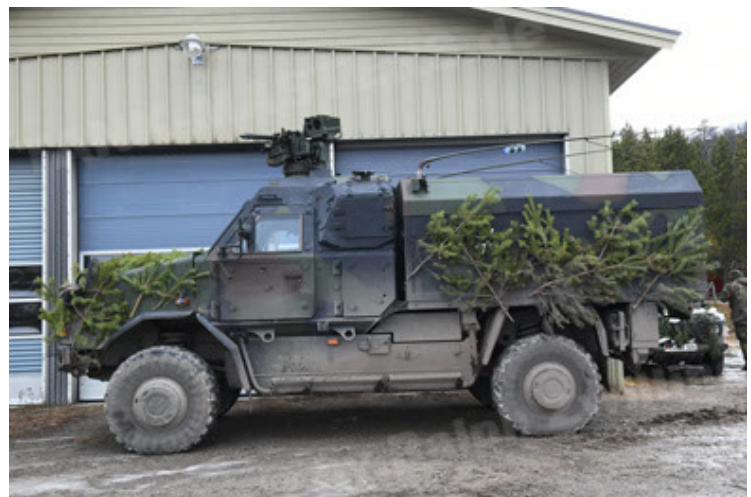
Dingo 2 GE C1 GSI (205).JPG