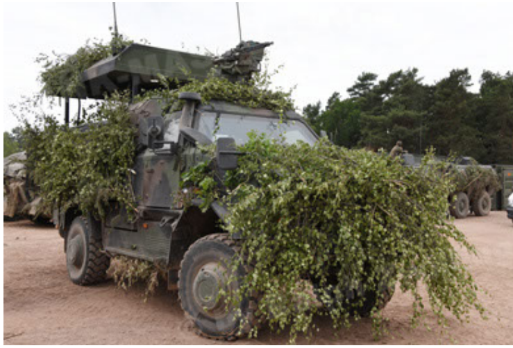
Dingo 2 GE C1 GSI (194).JPG