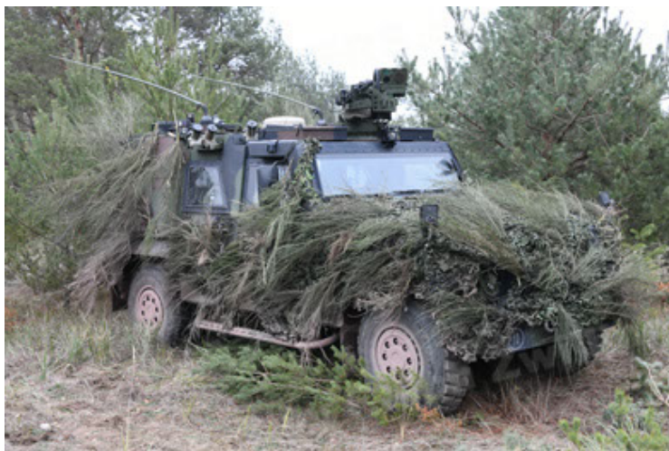
Eagle IV EinsFzgFüPers (161).JPG