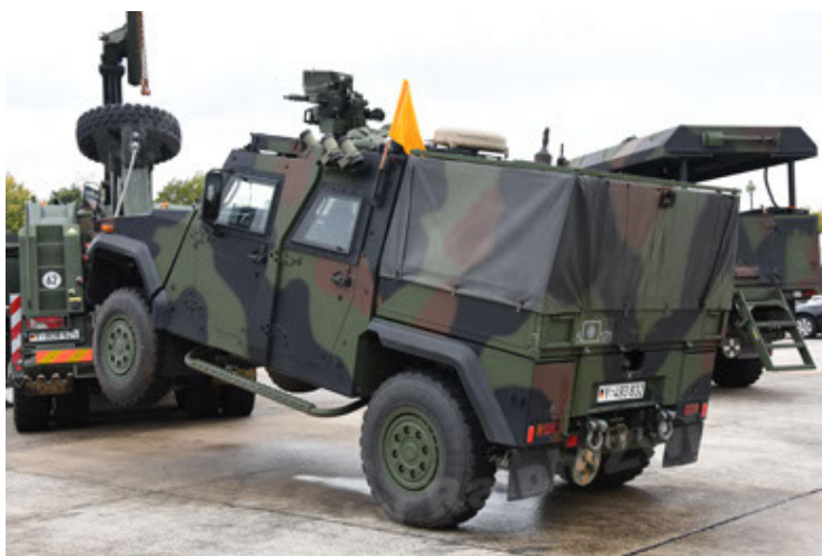
Eagle IV EinsFzgFüPers (113).JPG