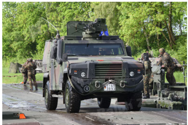
Eagle IV EinsFzgFüPers (102).JPG