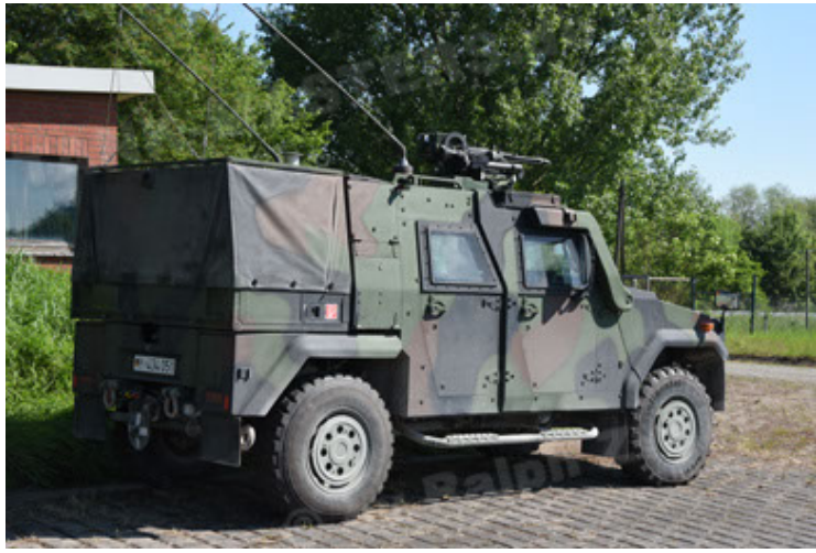
Eagle IV EinsFzgFüPers (91).JPG