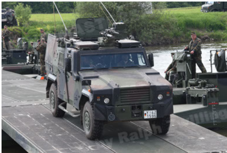
Eagle IV EinsFzgFüPers (99).JPG