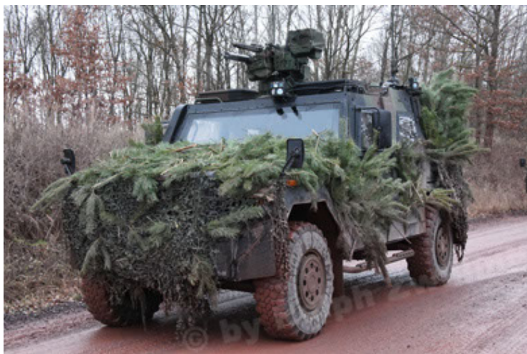
Eagle IV EinsFzgFüPers (179).JPG