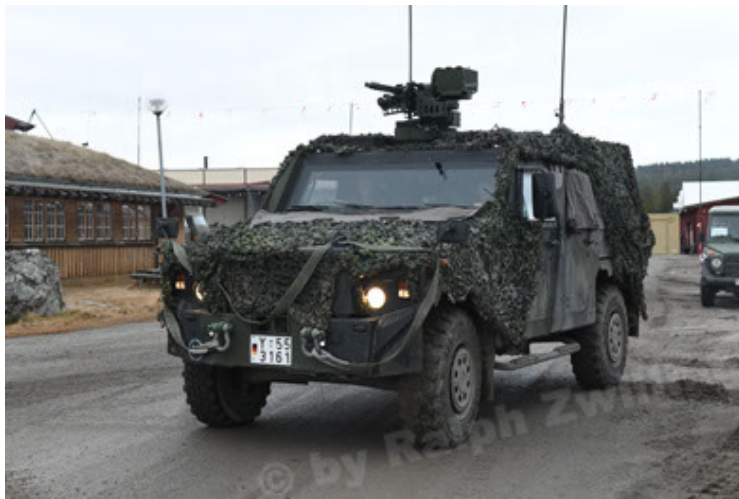
Eagle IV EinsFzgFüPers (141).JPG