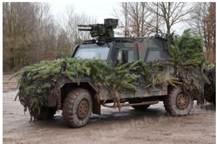
Eagle IV EinsFzgFüPers (186).JPG