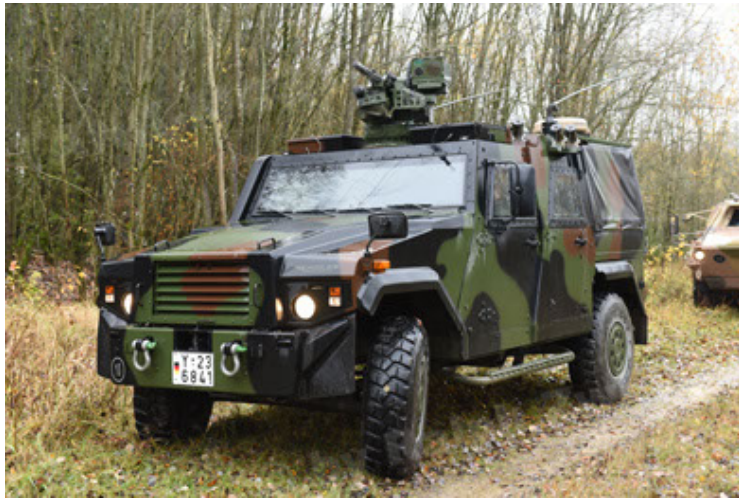
Eagle IV EinsFzgFüPers (61).JPG