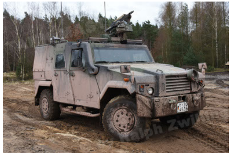
Eagle IV EinsFzgFüPers (28).JPG