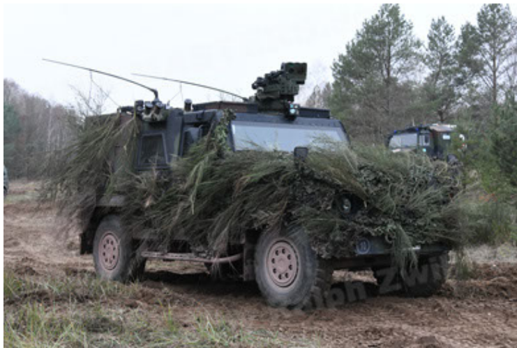
Eagle IV EinsFzgFüPers (165).JPG