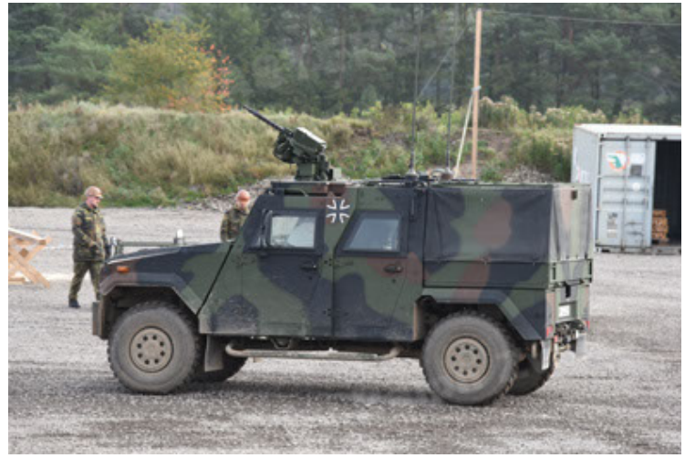
Eagle IV EinsFzgFüPers (110).JPG