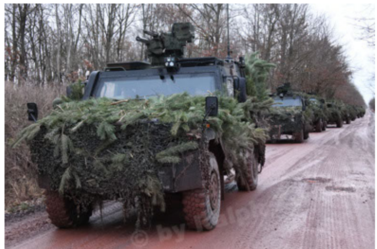
Eagle IV EinsFzgFüPers (180).JPG