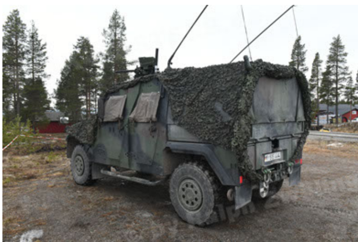
Eagle IV EinsFzgFüPers (143).JPG