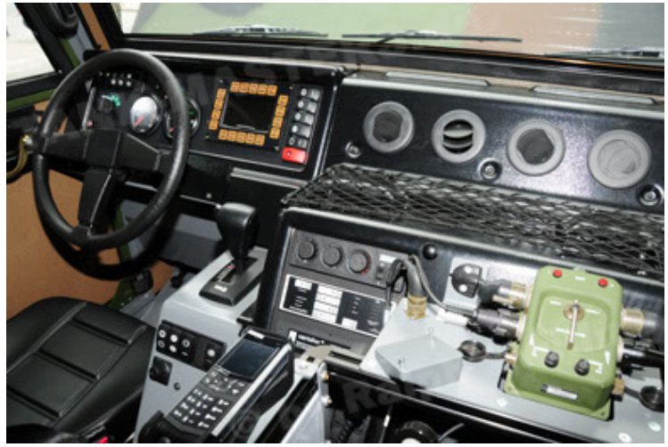
Eagle IV EinsFzgFüPers (80).JPG