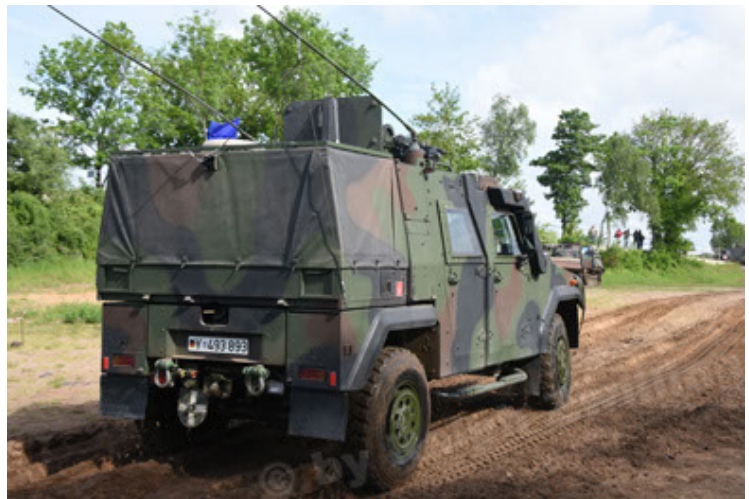
Eagle IV EinsFzgFüPers (106).JPG