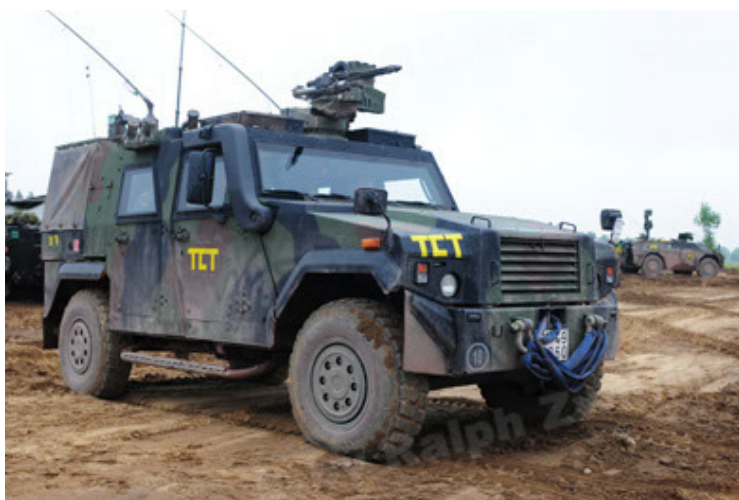
Eagle IV EinsFzgFüPers (53).JPG