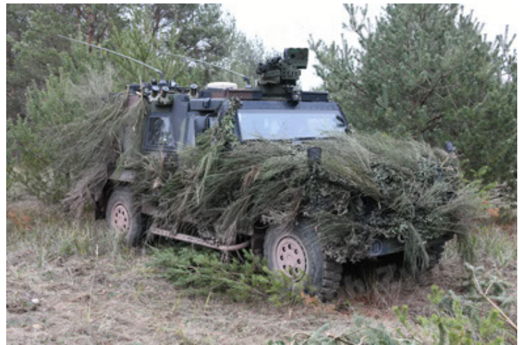
Eagle IV EinsFzgFüPers (160).JPG