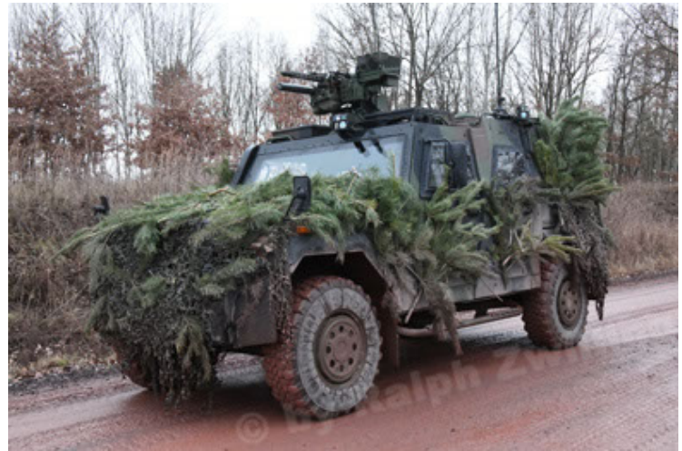
Eagle IV EinsFzgFüPers (178).JPG