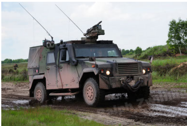
Eagle IV EinsFzgFüPers (23).JPG