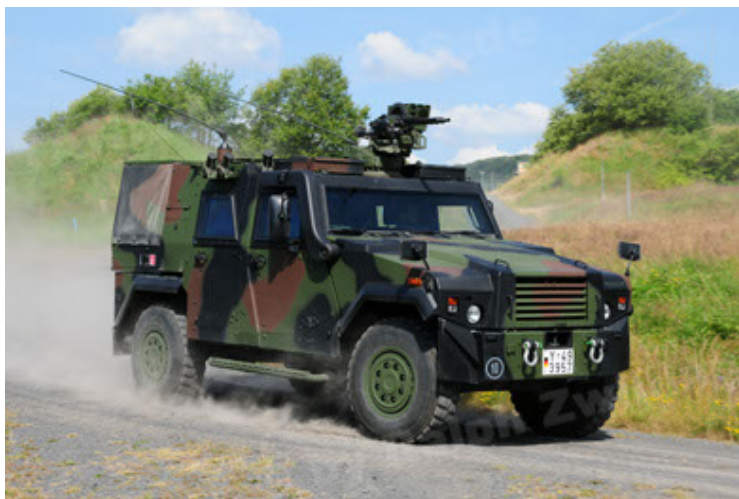
Eagle IV EinsFzgFüPers (47).JPG