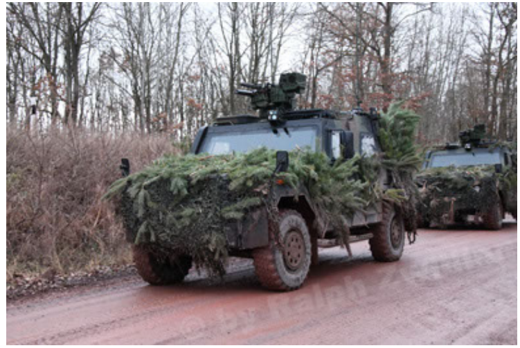
Eagle IV EinsFzgFüPers (176).JPG