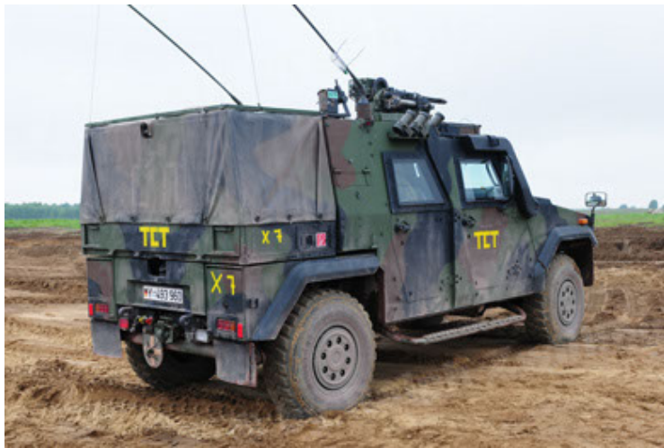
Eagle IV EinsFzgFüPers (57).JPG