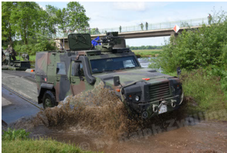
Eagle IV EinsFzgFüPers (105).JPG