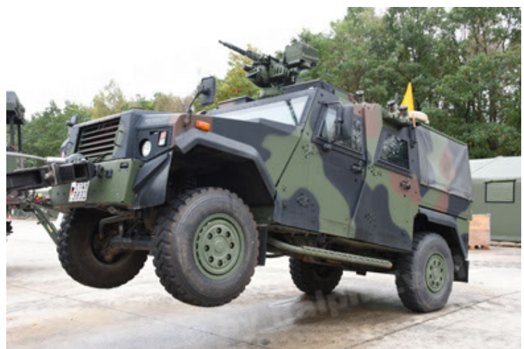
Eagle IV EinsFzgFüPers (114).JPG