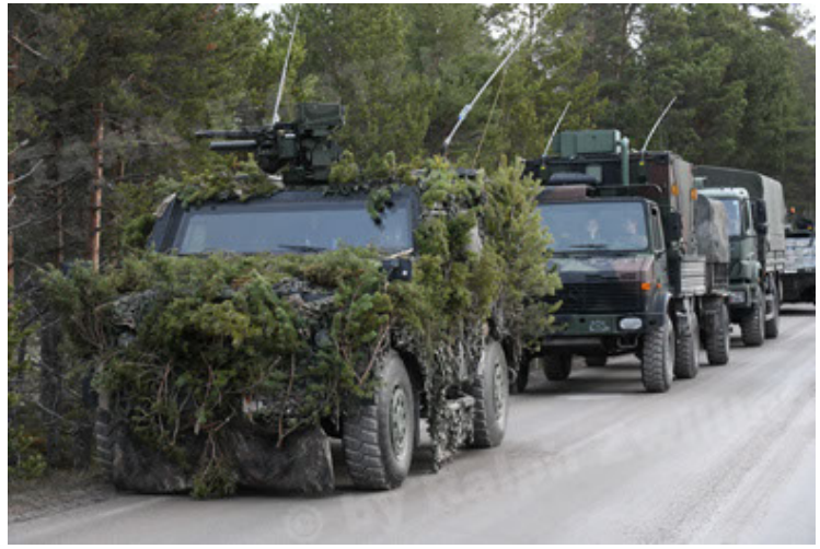
Eagle IV EinsFzgFüPers (152).JPG