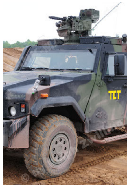
Eagle IV EinsFzgFüPers (76).JPG