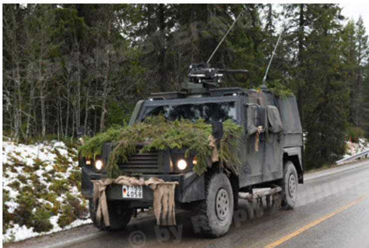
Eagle IV EinsFzgFüPers (125).JPG