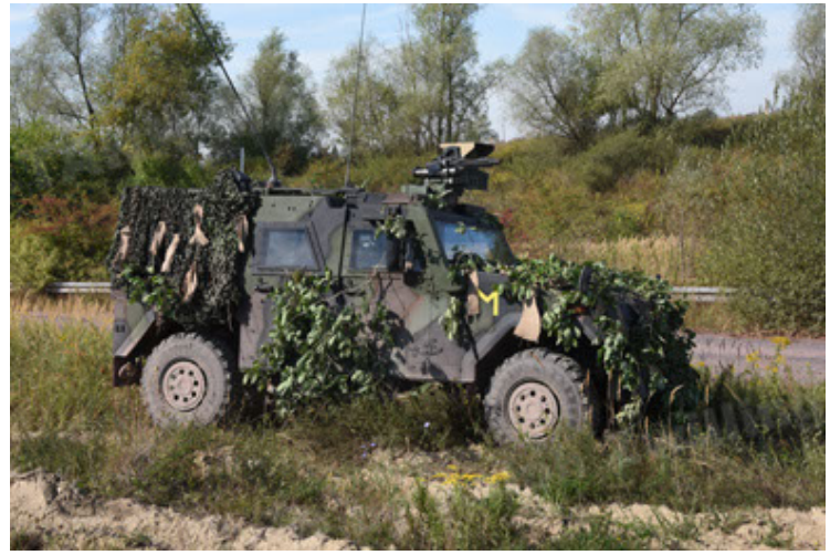
Eagle IV EinsFzgFüPers (26).JPG