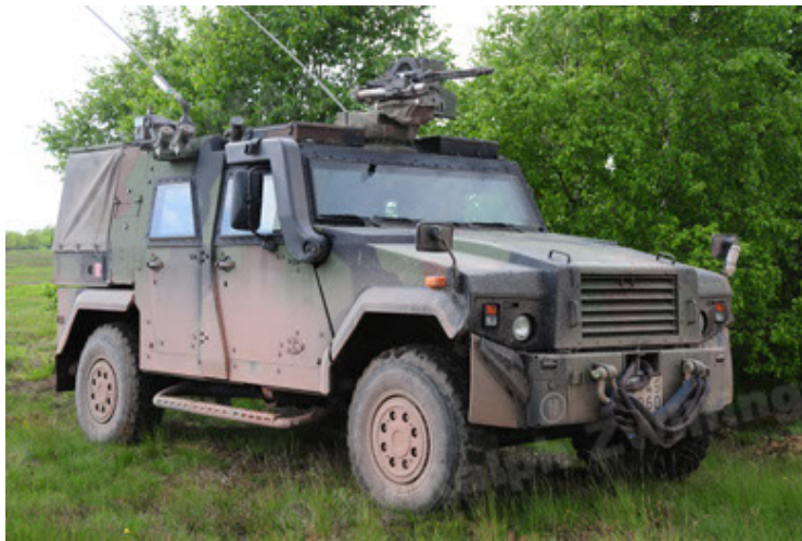
Eagle IV EinsFzgFüPers (45).JPG