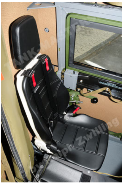
Eagle IV EinsFzgFüPers (85).JPG