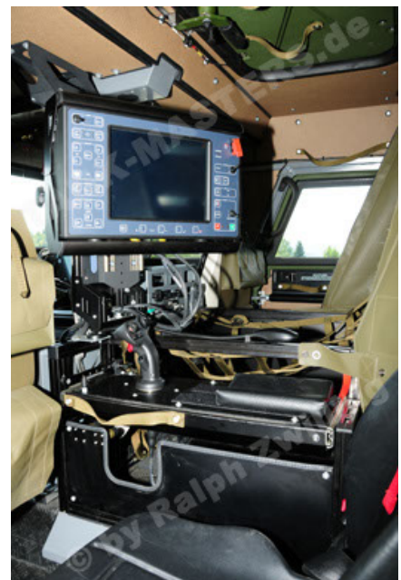
Eagle IV EinsFzgFüPers (84).JPG