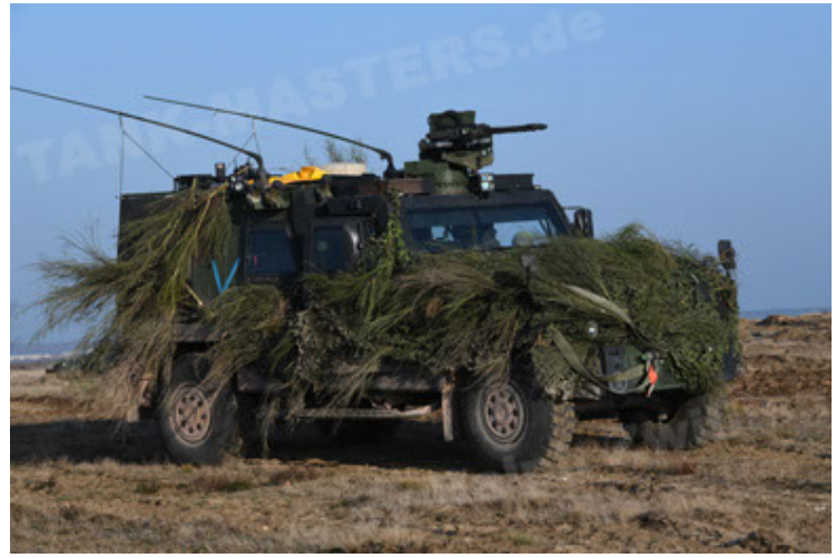
Eagle IV EinsFzgFüPers (158).JPG