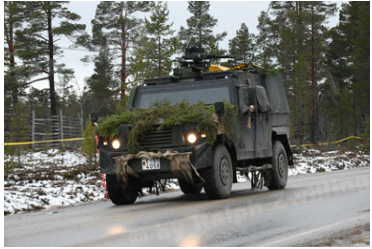
Eagle IV EinsFzgFüPers (134).JPG