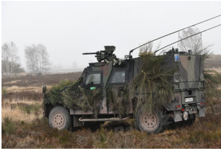
Eagle IV EinsFzgFüPers (175).JPG