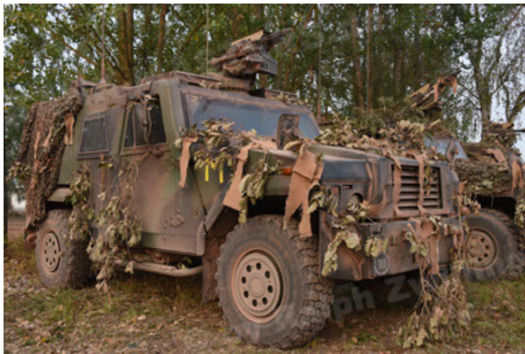
Eagle IV EinsFzgFüPers (39).JPG