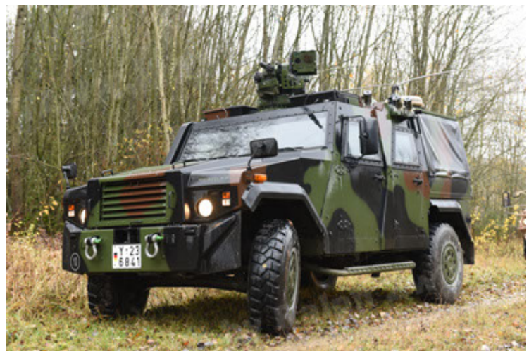
Eagle IV EinsFzgFüPers (60).JPG