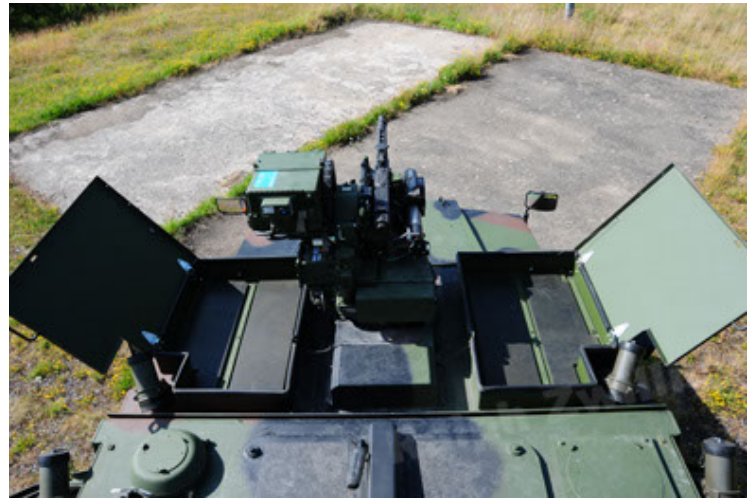
Eagle IV EinsFzgFüPers (74).JPG