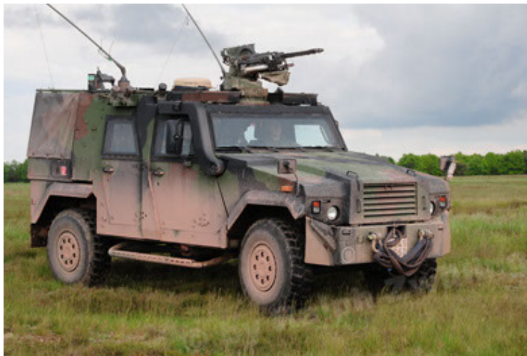
Eagle IV EinsFzgFüPers (15).JPG