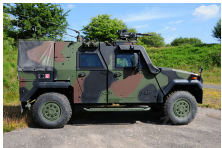
Eagle IV EinsFzgFüPers (54).JPG