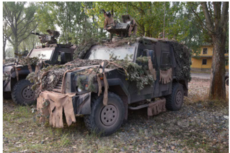
Eagle IV EinsFzgFüPers (40).JPG