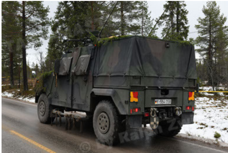
Eagle IV EinsFzgFüPers (129).JPG