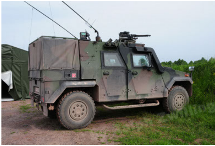
Eagle IV EinsFzgFüPers (13).JPG