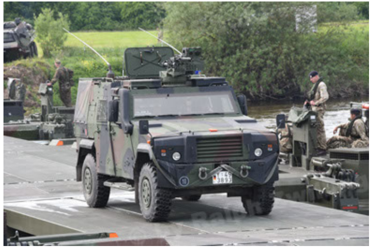
Eagle IV EinsFzgFüPers (92).JPG