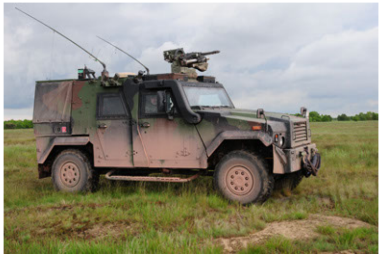
Eagle IV EinsFzgFüPers (16).JPG