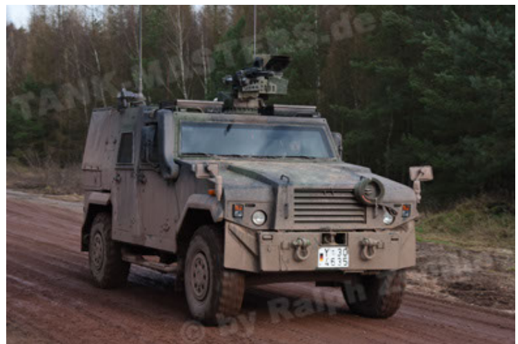
Eagle IV EinsFzgFüPers (42).JPG