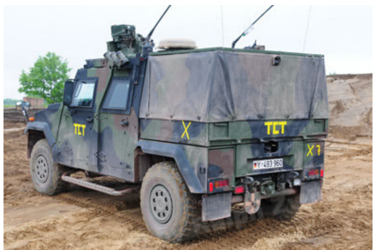
Eagle IV EinsFzgFüPers (6).JPG