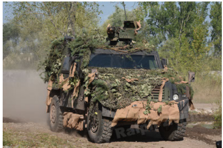
Eagle IV EinsFzgFüPers (34).JPG