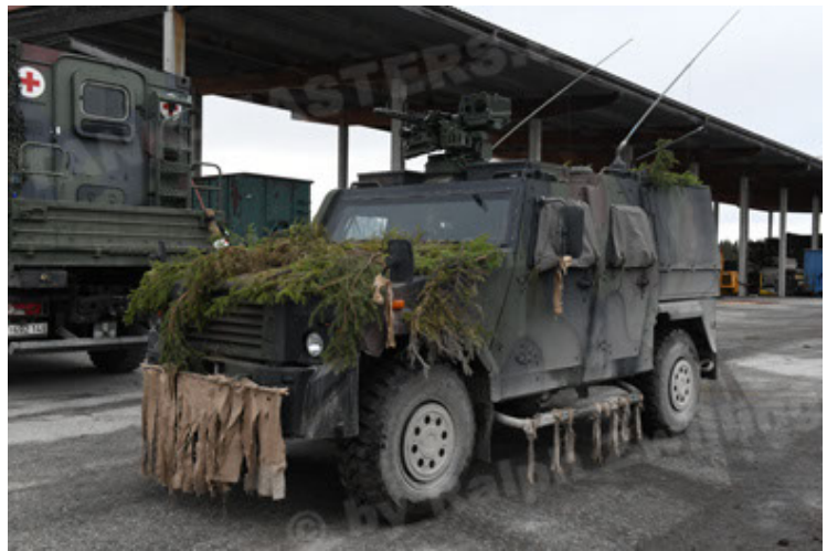
Eagle IV EinsFzgFüPers (154).JPG