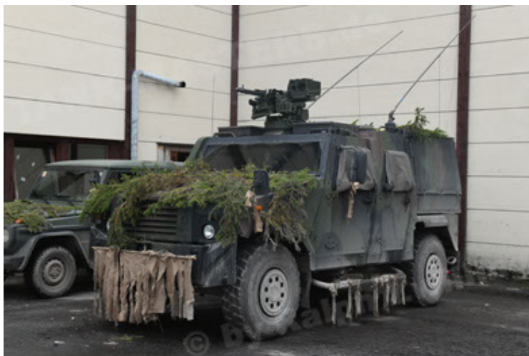
Eagle IV EinsFzgFüPers (149).JPG