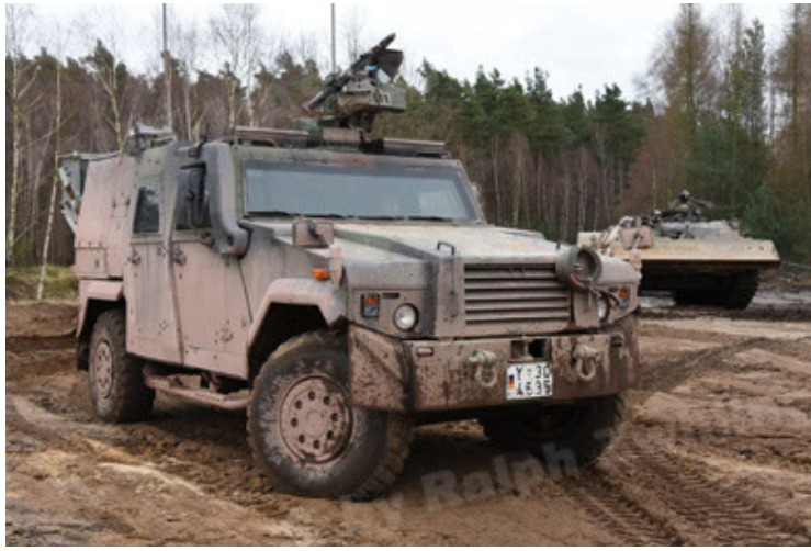
Eagle IV EinsFzgFüPers (31).JPG