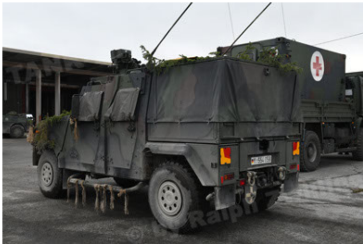
Eagle IV EinsFzgFüPers (153).JPG