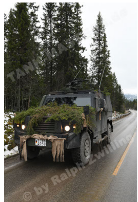
Eagle IV EinsFzgFüPers (128).JPG