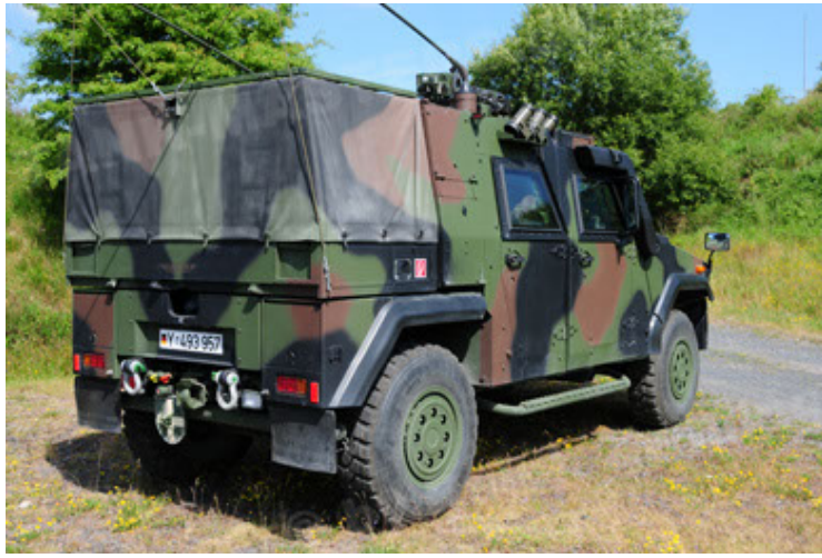
Eagle IV EinsFzgFüPers (19).JPG