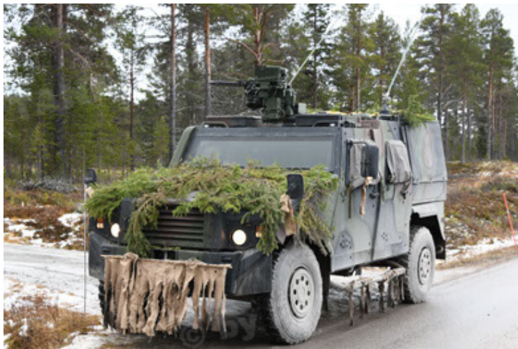
Eagle IV EinsFzgFüPers (147).JPG