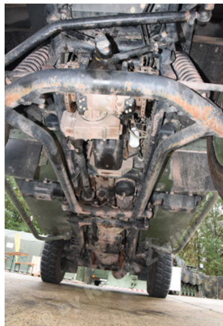
Eagle IV EinsFzgFüPers (108).JPG