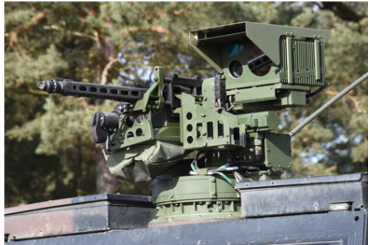
Eagle IV EinsFzgFüPers (118).JPG