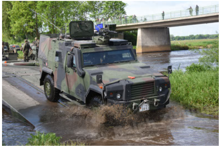
Eagle IV EinsFzgFüPers (104).JPG