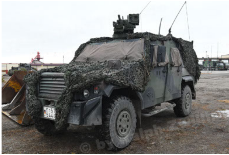
Eagle IV EinsFzgFüPers (145).JPG