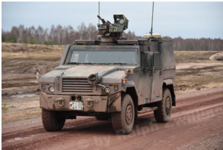
Eagle IV EinsFzgFüPers (33).JPG