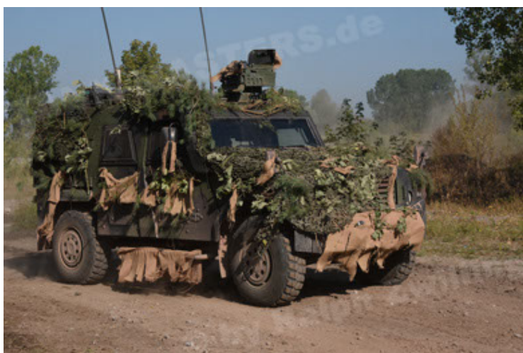
Eagle IV EinsFzgFüPers (35).JPG