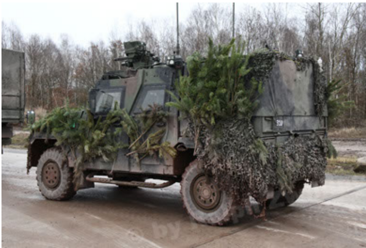
Eagle IV EinsFzgFüPers (189).JPG