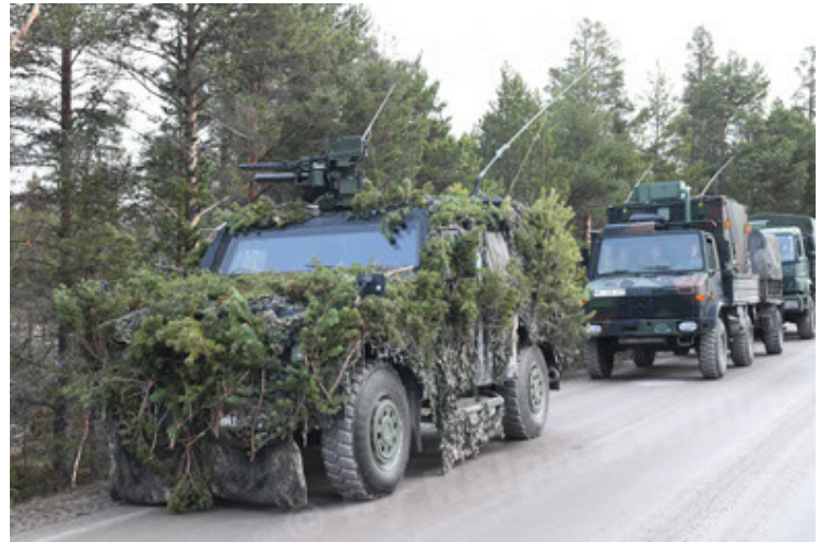
Eagle IV EinsFzgFüPers (136).JPG