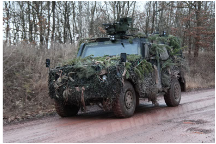
Eagle IV EinsFzgFüPers (182).JPG