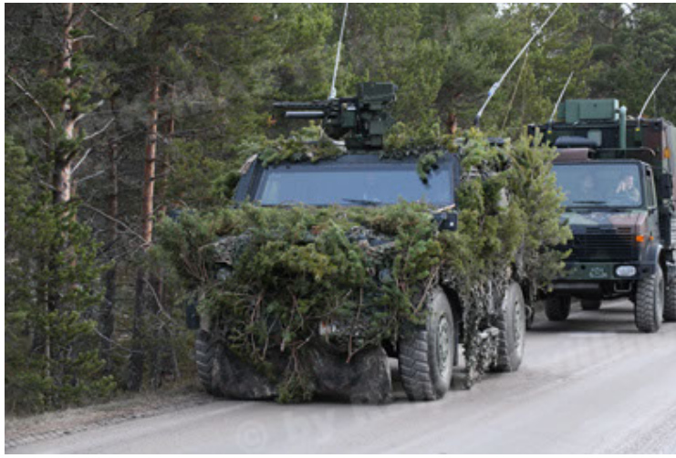
Eagle IV EinsFzgFüPers (151).JPG