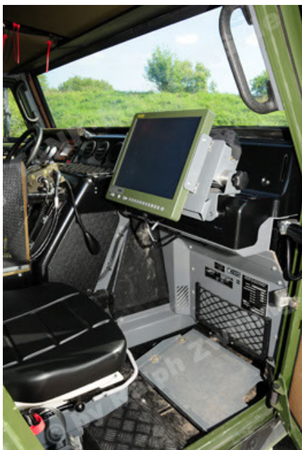
Eagle IV EinsFzgFüPers (83).JPG