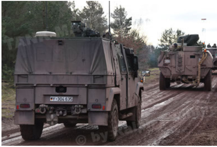
Eagle IV EinsFzgFüPers (43).JPG