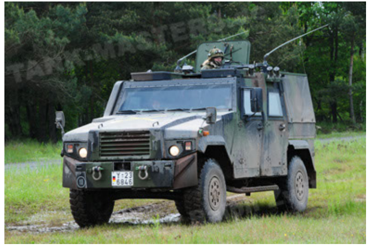
Eagle IV EinsFzgFüPers (50).JPG