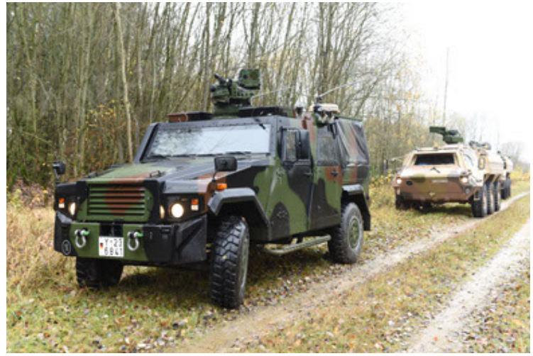
Eagle IV EinsFzgFüPers (62).JPG