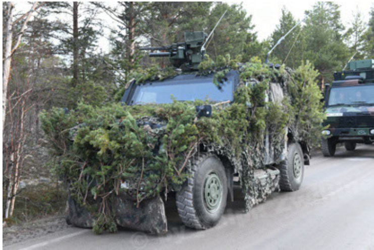
Eagle IV EinsFzgFüPers (135).JPG