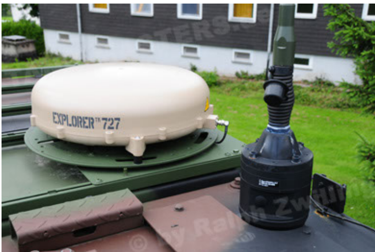
Eagle IV EinsFzgFüPers (71).JPG