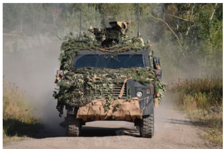
Eagle IV EinsFzgFüPers (36).JPG