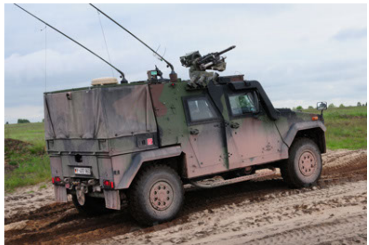
Eagle IV EinsFzgFüPers (48).JPG