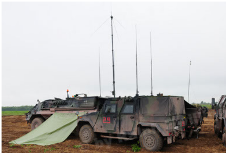
Eagle IV EinsFzgFüPers (51).JPG