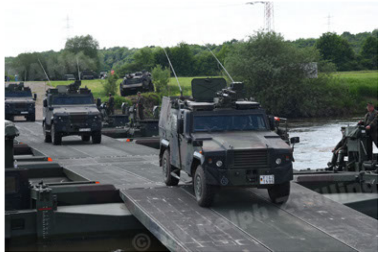
Eagle IV EinsFzgFüPers (98).JPG