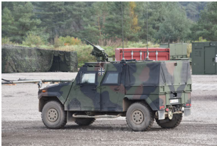
Eagle IV EinsFzgFüPers (111).JPG