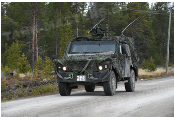
Eagle IV EinsFzgFüPers (155).JPG