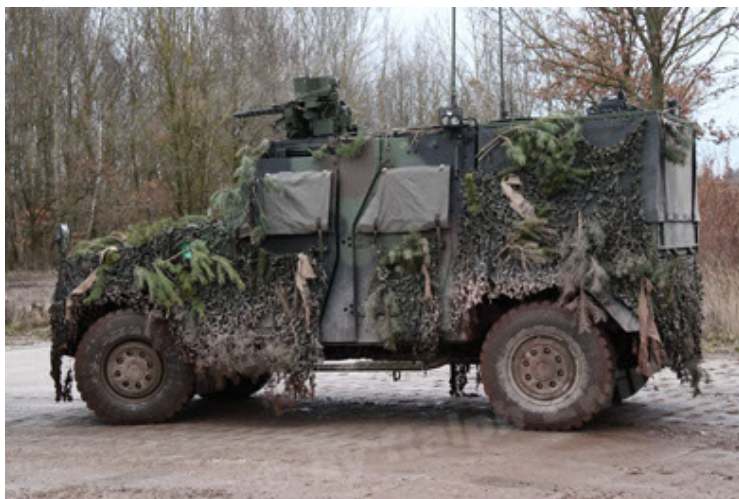
Eagle IV EinsFzgFüPers (185).JPG