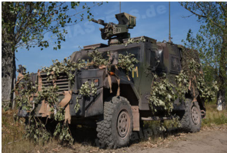
Eagle IV EinsFzgFüPers (3).JPG