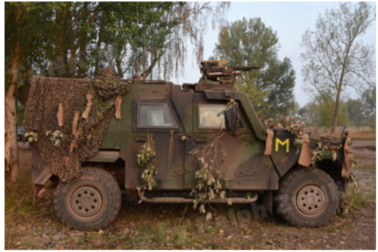
Eagle IV EinsFzgFüPers (38).JPG