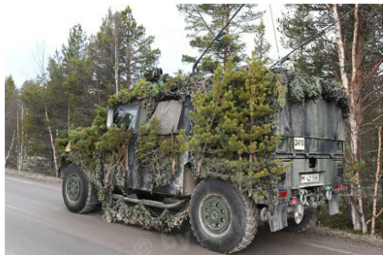
Eagle IV EinsFzgFüPers (138).JPG