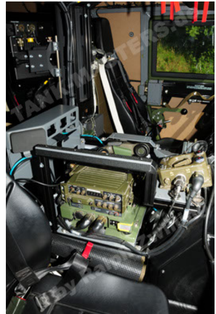
Eagle IV EinsFzgFüPers (82).JPG