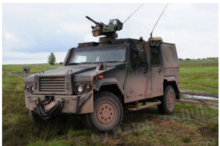
Eagle IV EinsFzgFüPers (18).JPG