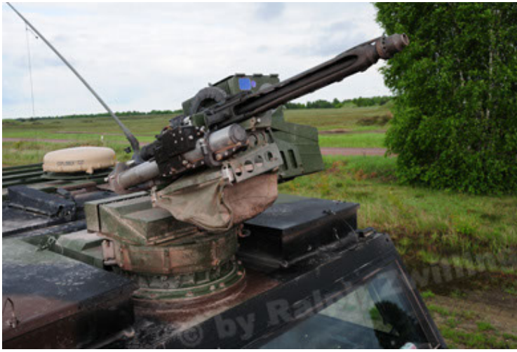
Eagle IV EinsFzgFüPers (67).JPG