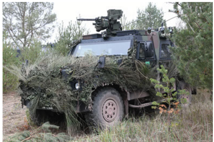
Eagle IV EinsFzgFüPers (162).JPG