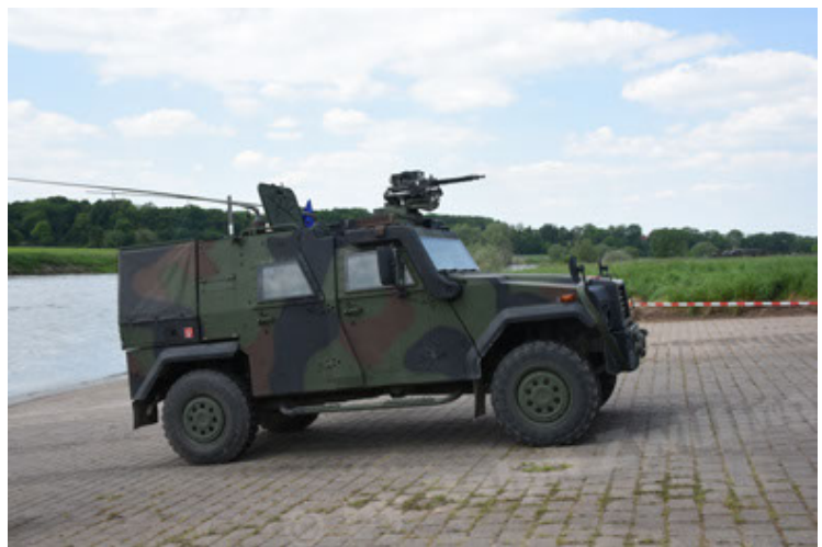
Eagle IV EinsFzgFüPers (96).JPG