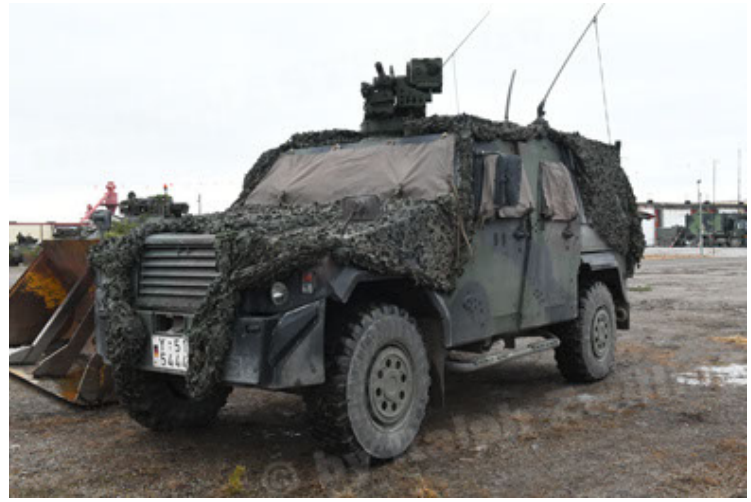
Eagle IV EinsFzgFüPers (146).JPG