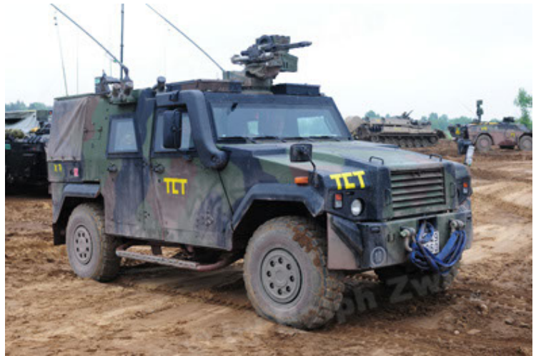
Eagle IV EinsFzgFüPers (4).JPG