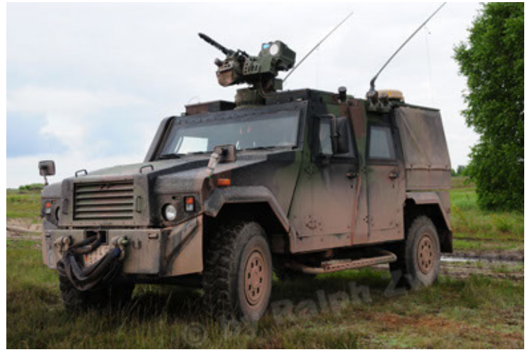
Eagle IV EinsFzgFüPers (20).JPG