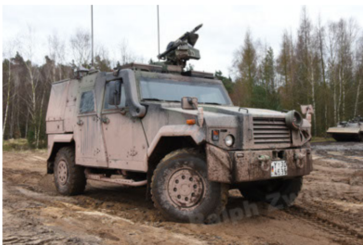
Eagle IV EinsFzgFüPers (65).JPG