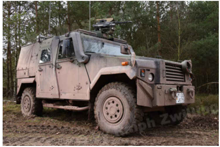
Eagle IV EinsFzgFüPers (44).JPG