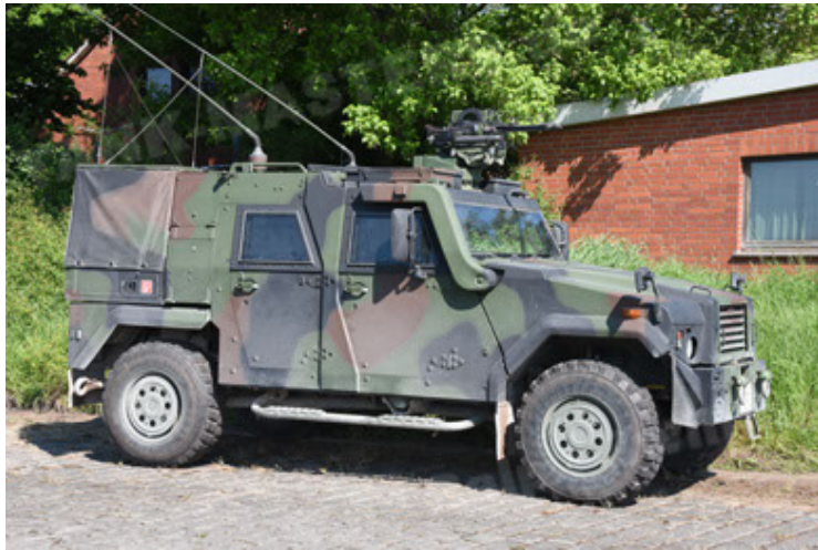
Eagle IV EinsFzgFüPers (87).JPG