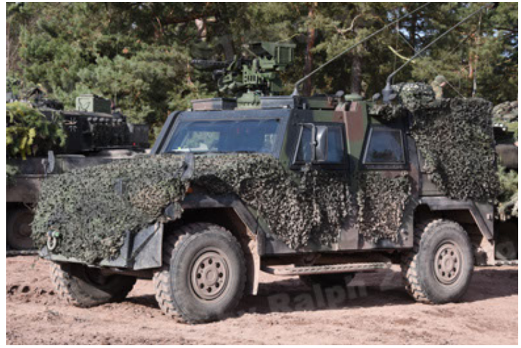
Eagle IV EinsFzgFüPers (116).JPG