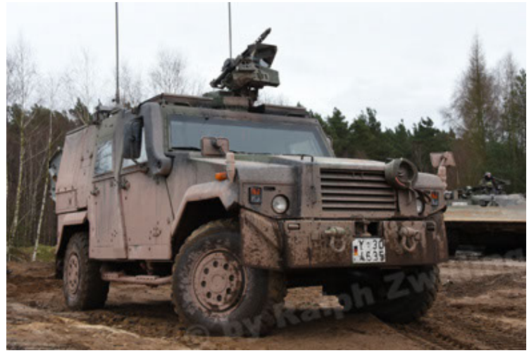
Eagle IV EinsFzgFüPers (32).JPG