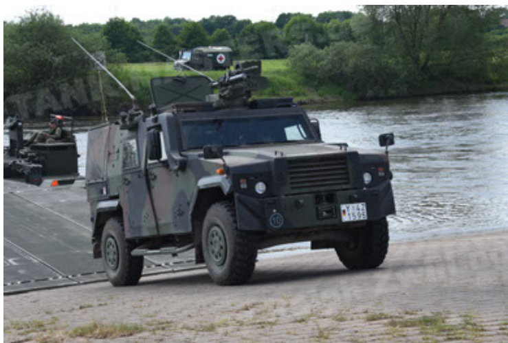
Eagle IV EinsFzgFüPers (101).JPG