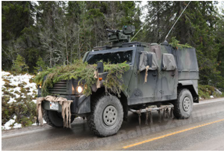
Eagle IV EinsFzgFüPers (127).JPG