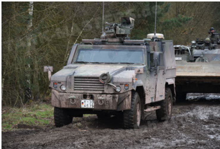
Eagle IV EinsFzgFüPers (27).JPG