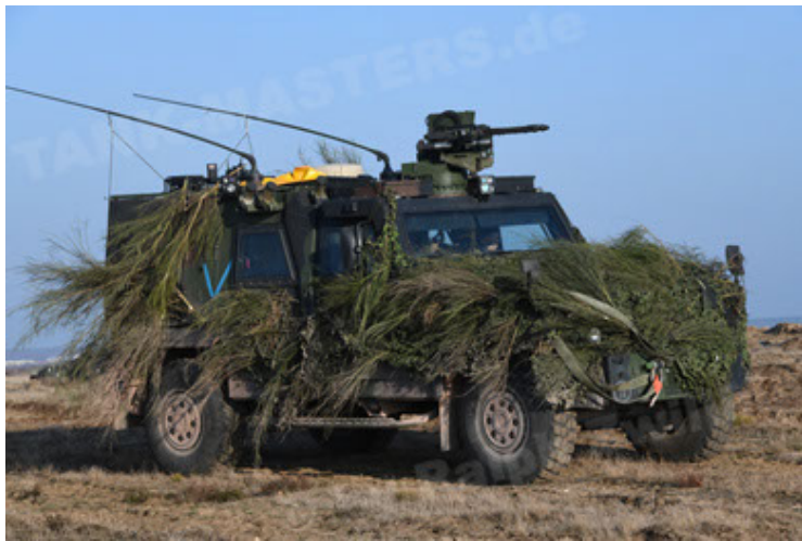
Eagle IV EinsFzgFüPers (159).JPG