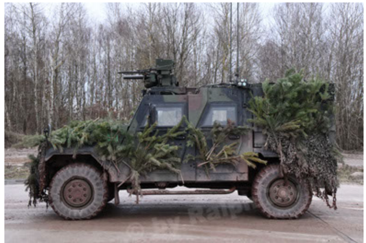
Eagle IV EinsFzgFüPers (190).JPG