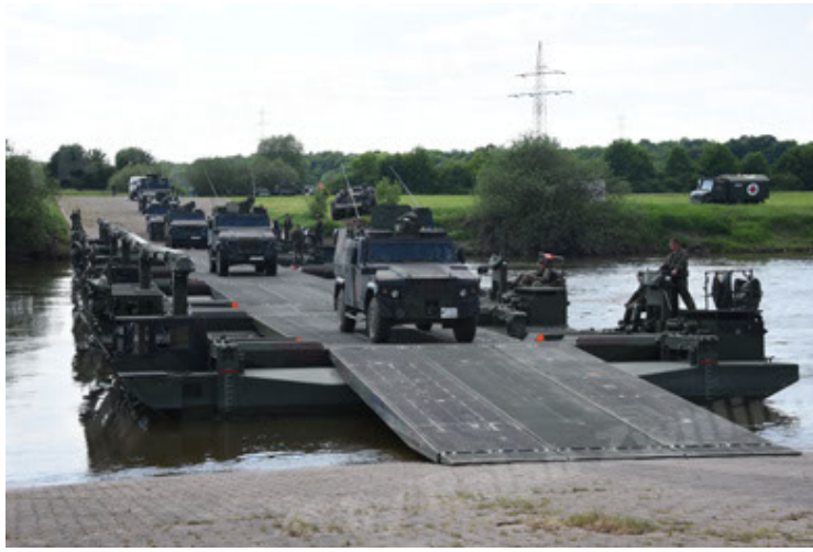
Eagle IV EinsFzgFüPers (97).JPG