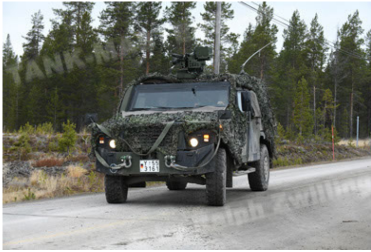
Eagle IV EinsFzgFüPers (157).JPG