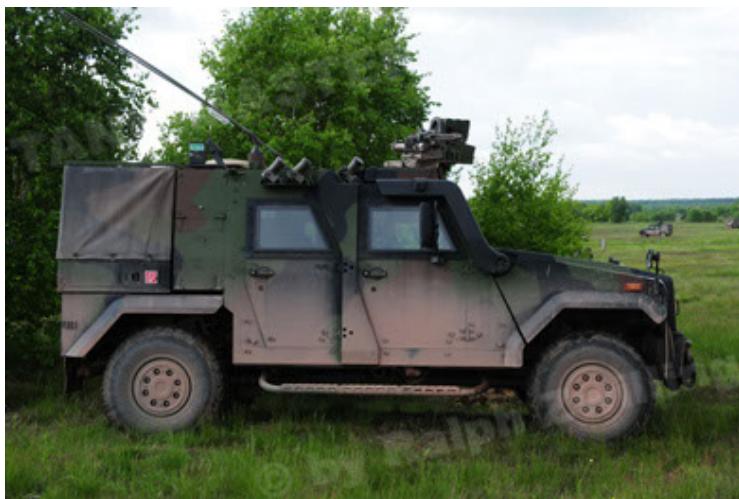
Eagle IV EinsFzgFüPers (11).JPG