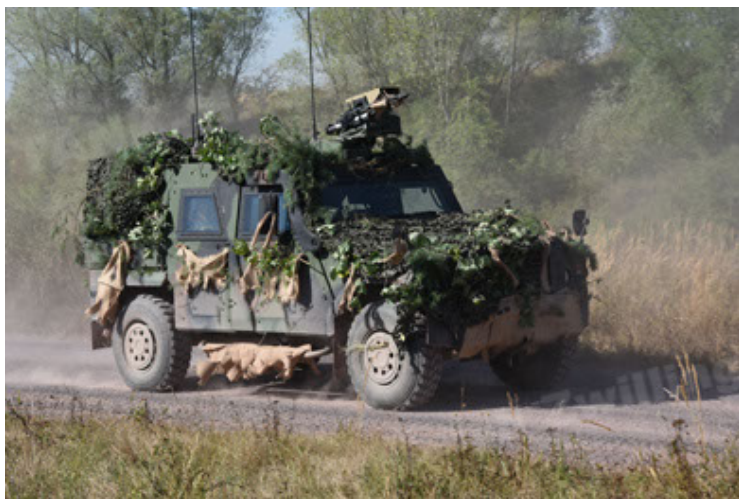
Eagle IV EinsFzgFüPers (29).JPG