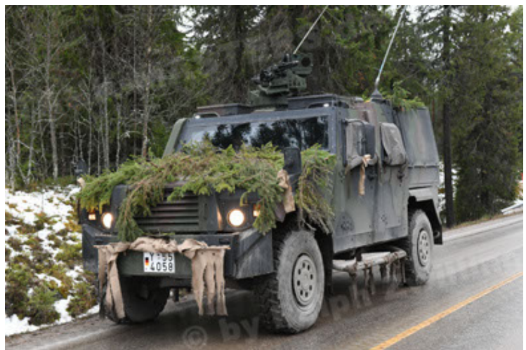
Eagle IV EinsFzgFüPers (126).JPG