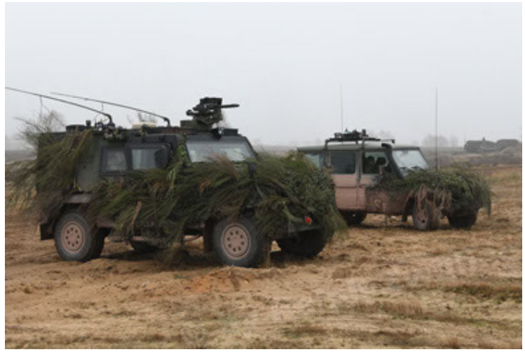
Eagle IV EinsFzgFüPers (170).JPG