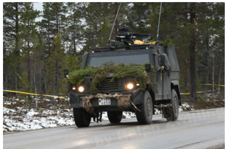
Eagle IV EinsFzgFüPers (132).JPG