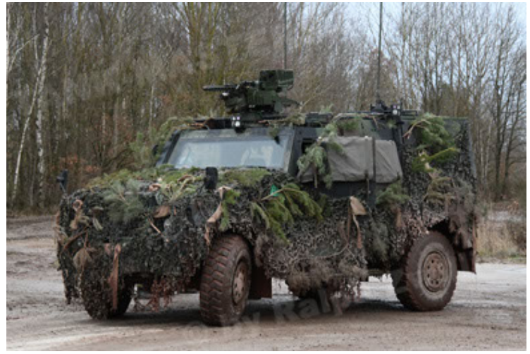
Eagle IV EinsFzgFüPers (188).JPG