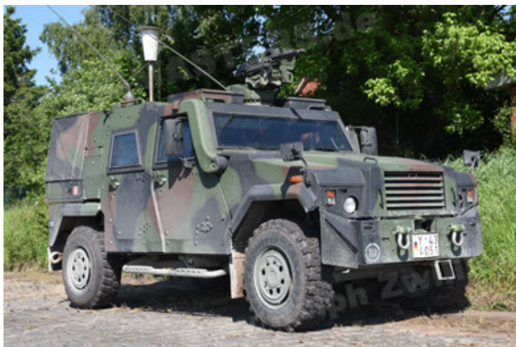
Eagle IV EinsFzgFüPers (89).JPG