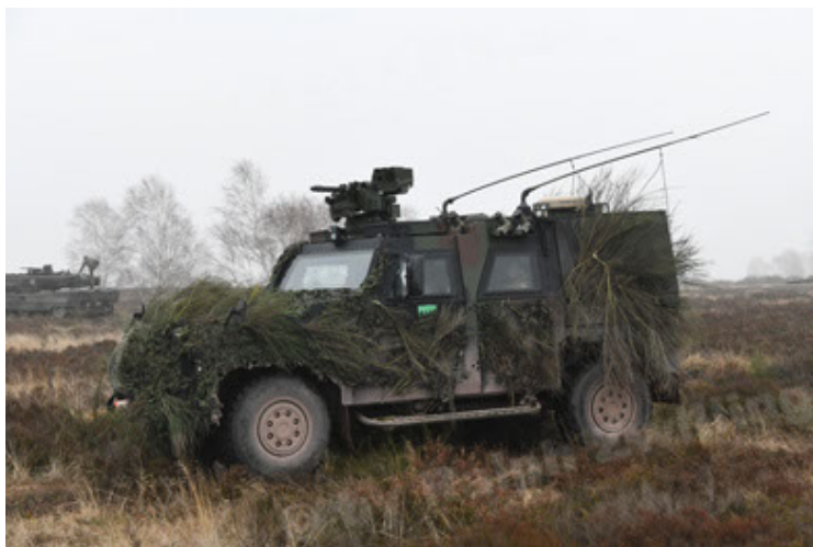
Eagle IV EinsFzgFüPers (173).JPG