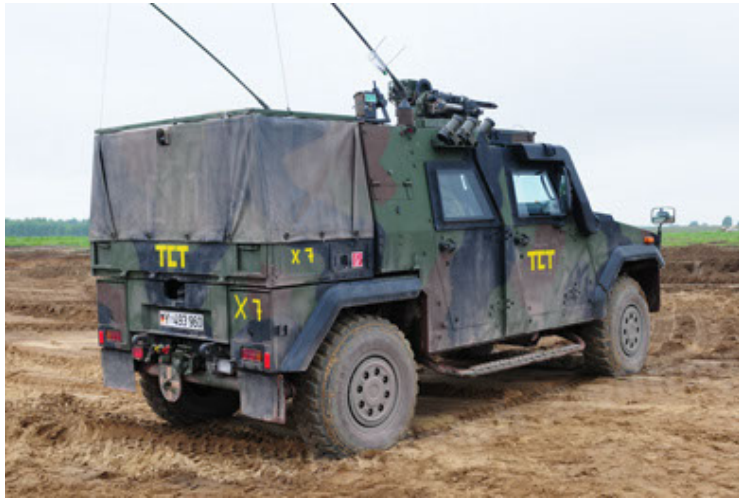
Eagle IV EinsFzgFüPers (7).JPG