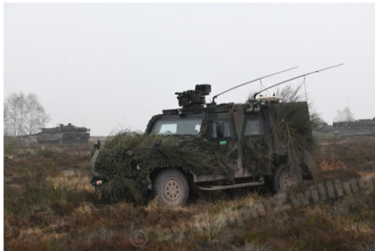
Eagle IV EinsFzgFüPers (172).JPG