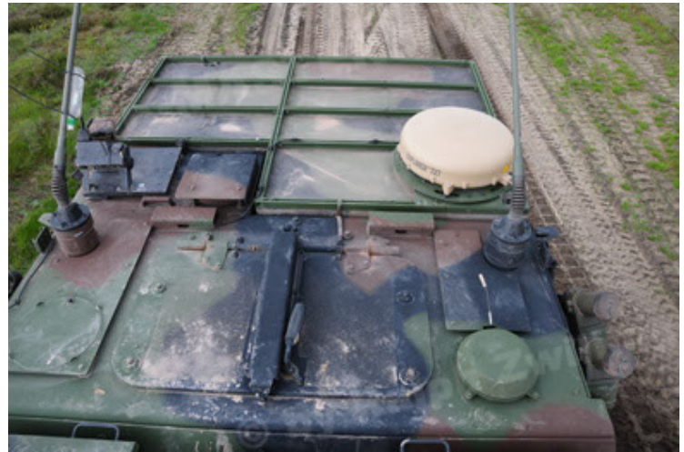
Eagle IV EinsFzgFüPers (70).JPG