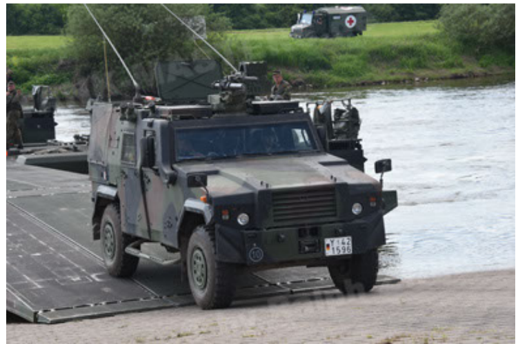
Eagle IV EinsFzgFüPers (100).JPG