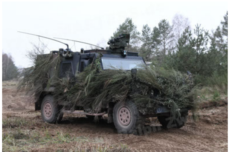
Eagle IV EinsFzgFüPers (166).JPG