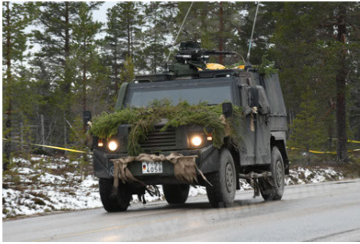
Eagle IV EinsFzgFüPers (133).JPG