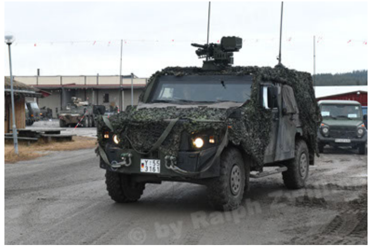
Eagle IV EinsFzgFüPers (140).JPG