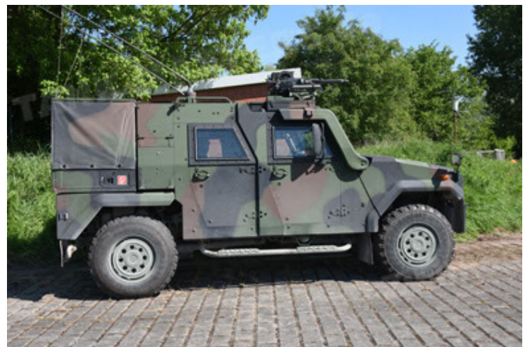
Eagle IV EinsFzgFüPers (90).JPG