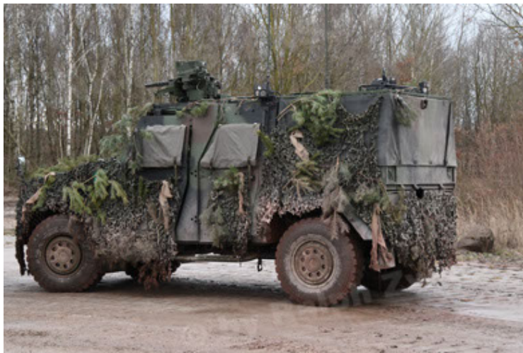
Eagle IV EinsFzgFüPers (183).JPG