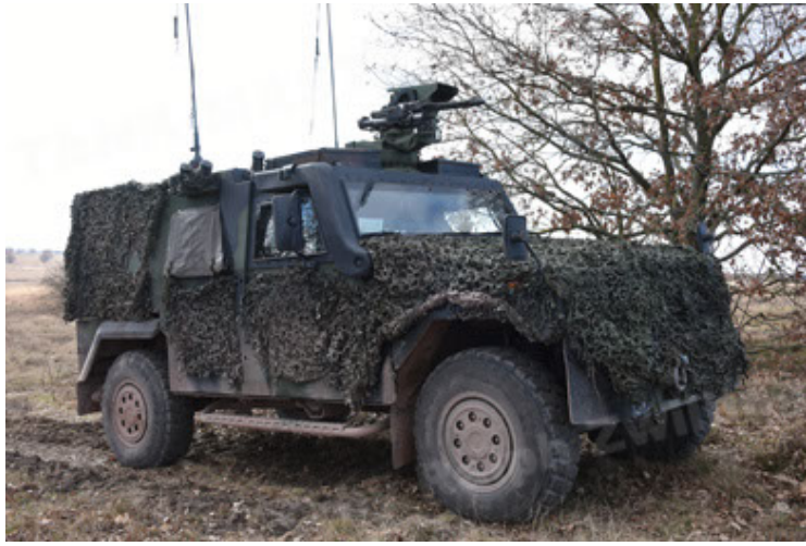
Eagle IV EinsFzgFüPers (121).JPG