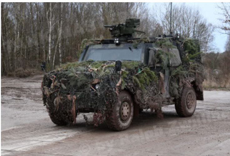
Eagle IV EinsFzgFüPers (191).JPG