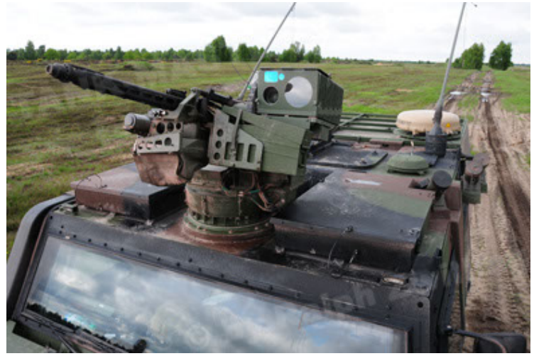
Eagle IV EinsFzgFüPers (68).JPG