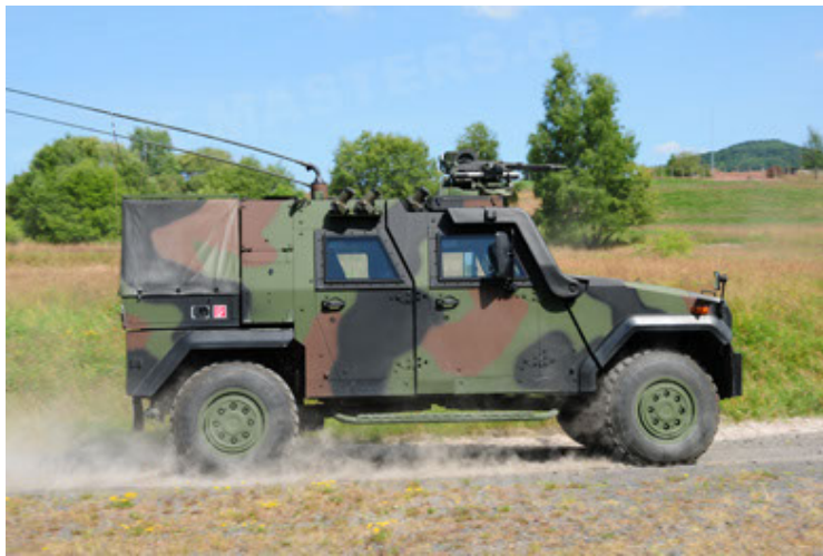
Eagle IV EinsFzgFüPers (21).JPG