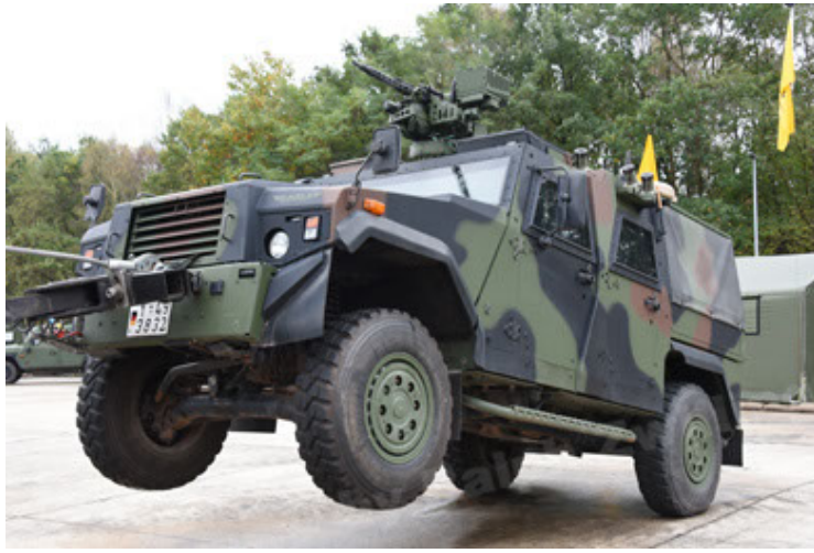
Eagle IV EinsFzgFüPers (115).JPG