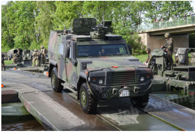
Eagle IV EinsFzgFüPers (103).JPG