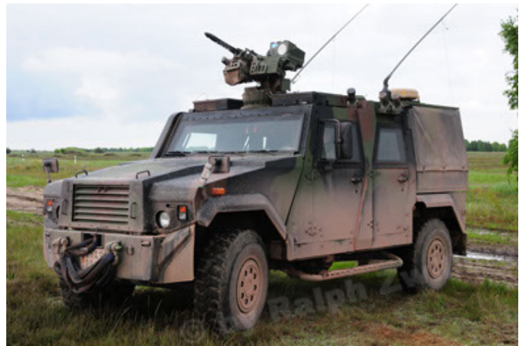
Eagle IV EinsFzgFüPers (46).JPG