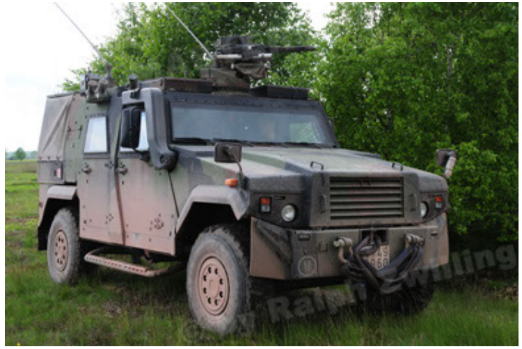
Eagle IV EinsFzgFüPers (14).JPG