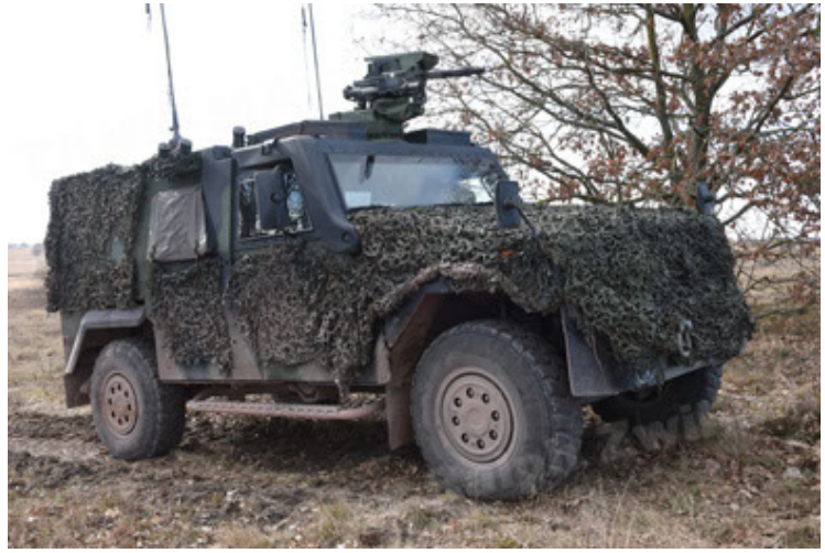
Eagle IV EinsFzgFüPers (122).JPG