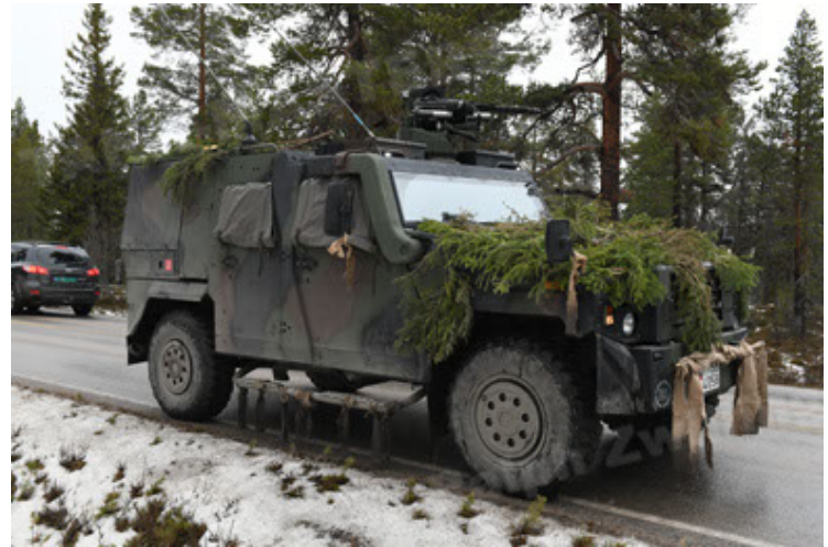
Eagle IV EinsFzgFüPers (130).JPG