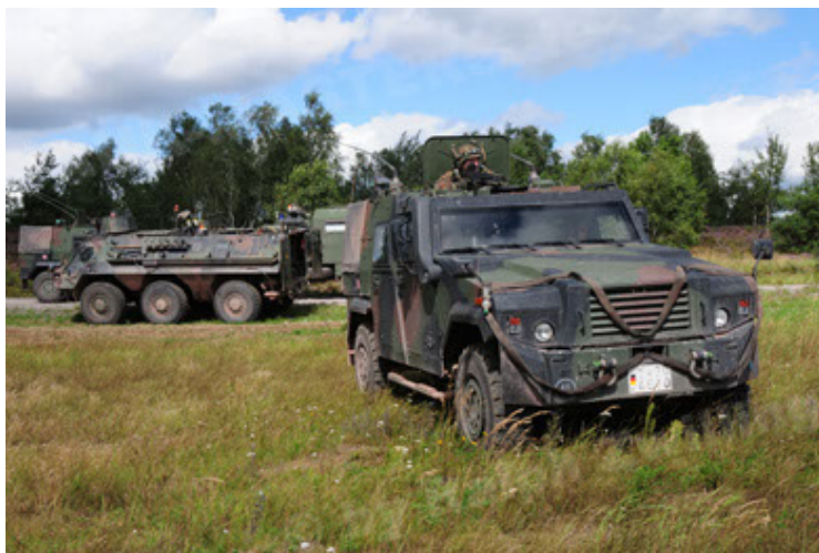
Eagle IV EinsFzgFüPers (59).JPG