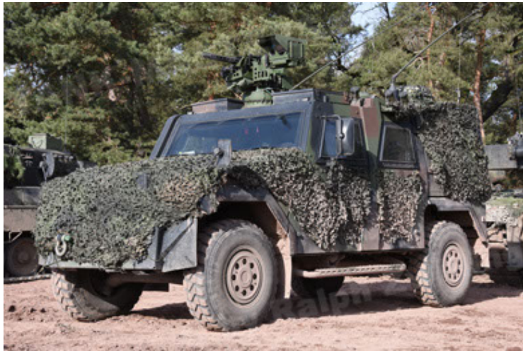
Eagle IV EinsFzgFüPers (117).JPG