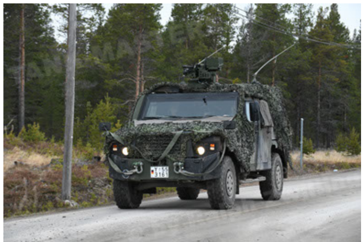
Eagle IV EinsFzgFüPers (156).JPG