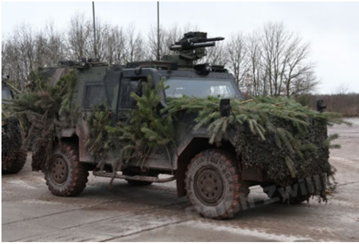
Eagle IV EinsFzgFüPers (187).JPG