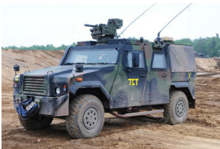
Eagle IV EinsFzgFüPers (5).JPG