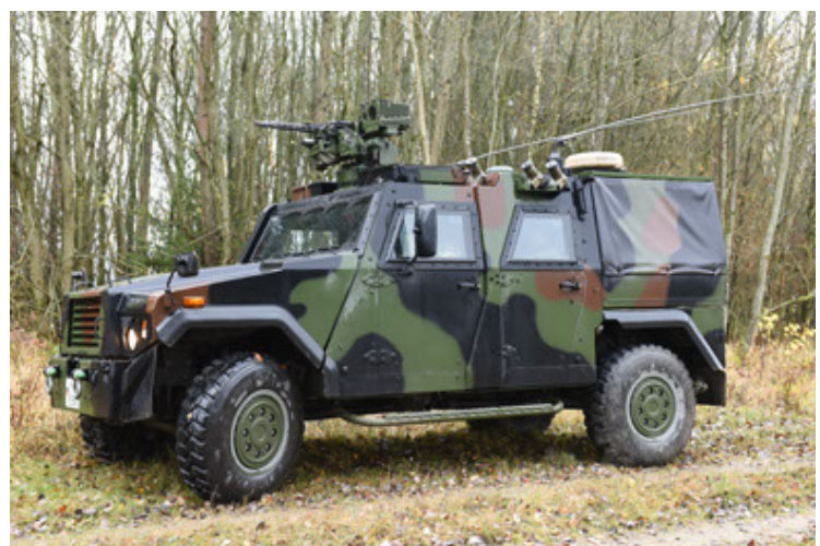
Eagle IV EinsFzgFüPers (66).JPG