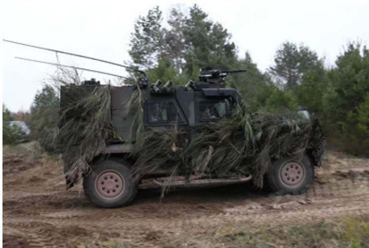
Eagle IV EinsFzgFüPers (167).JPG