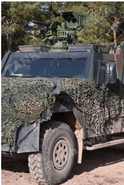
Eagle IV EinsFzgFüPers (119).JPG