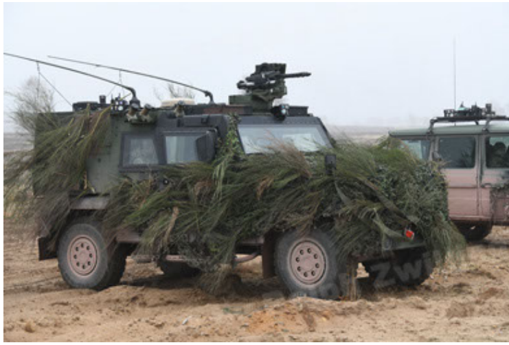
Eagle IV EinsFzgFüPers (169).JPG