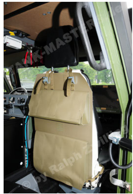
Eagle IV EinsFzgFüPers (86).JPG