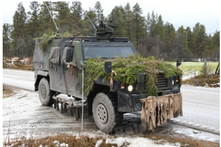
Eagle IV EinsFzgFüPers (148).JPG