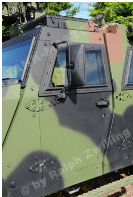
Eagle IV EinsFzgFüPers (77).JPG