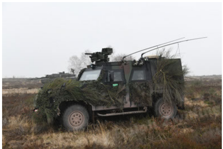
Eagle IV EinsFzgFüPers (174).JPG