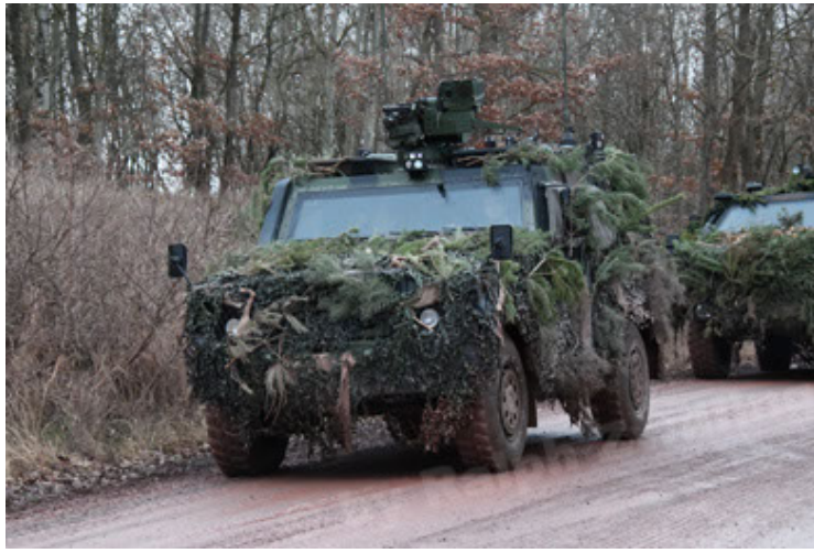
Eagle IV EinsFzgFüPers (181).JPG