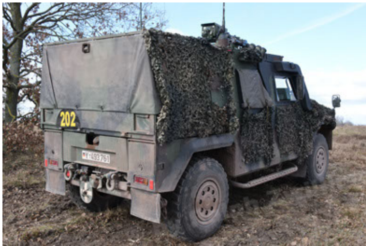
Eagle IV EinsFzgFüPers (123).JPG