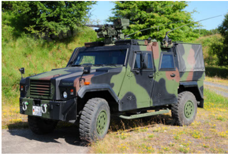
Eagle IV EinsFzgFüPers (1).JPG