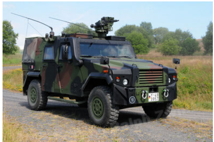
Eagle IV EinsFzgFüPers (22).JPG