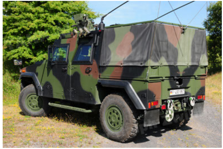
Eagle IV EinsFzgFüPers (8).JPG