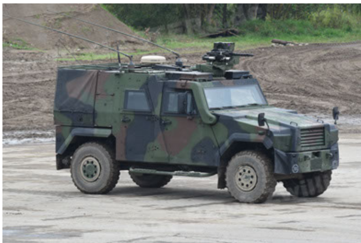
Eagle IV EinsFzgFüPers (107).JPG