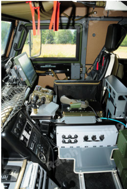
Eagle IV EinsFzgFüPers (81).JPG