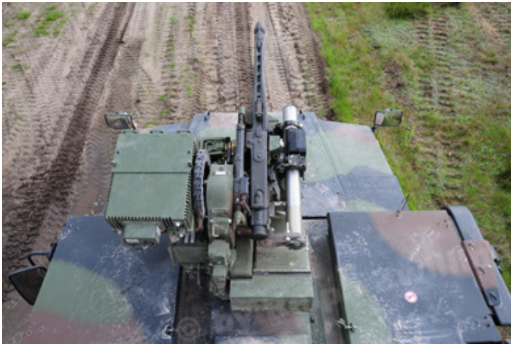
Eagle IV EinsFzgFüPers (69).JPG