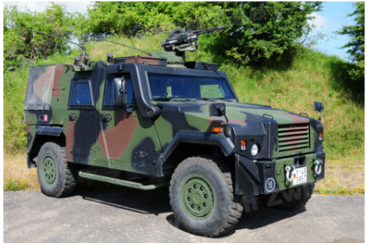
Eagle IV EinsFzgFüPers (2).JPG