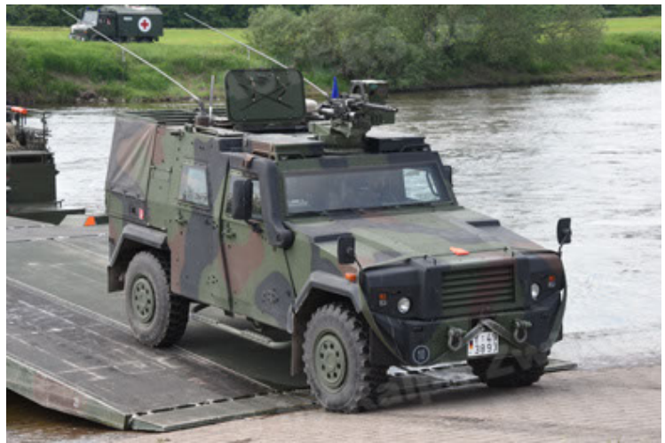
Eagle IV EinsFzgFüPers (94).JPG