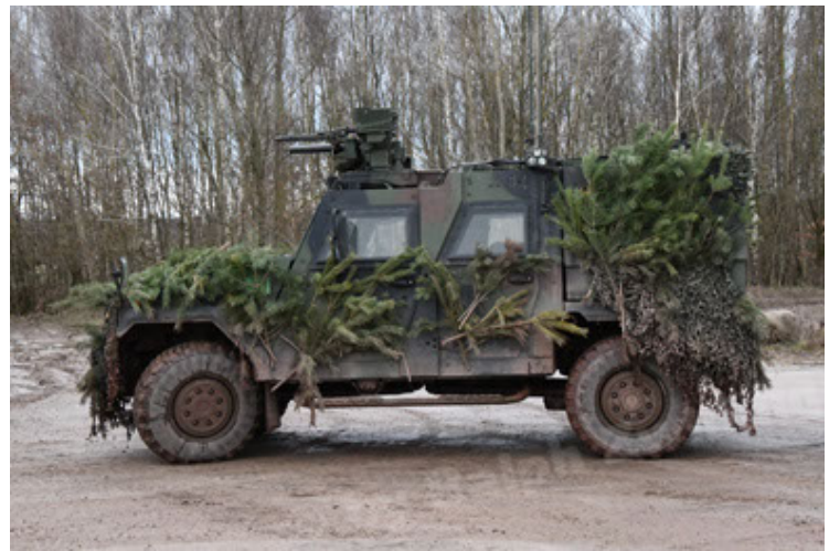
Eagle IV EinsFzgFüPers (184).JPG