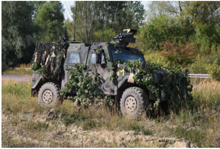
Eagle IV EinsFzgFüPers (25).JPG