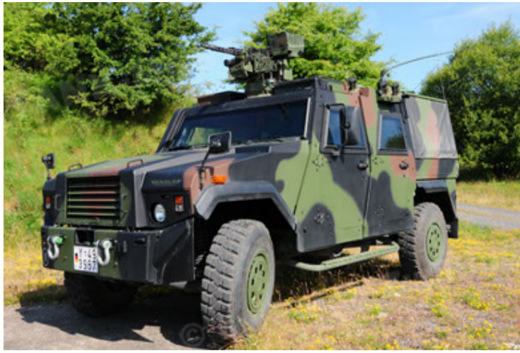
Eagle IV EinsFzgFüPers (49).JPG