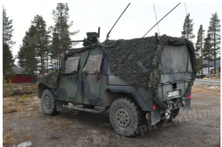
Eagle IV EinsFzgFüPers (144).JPG