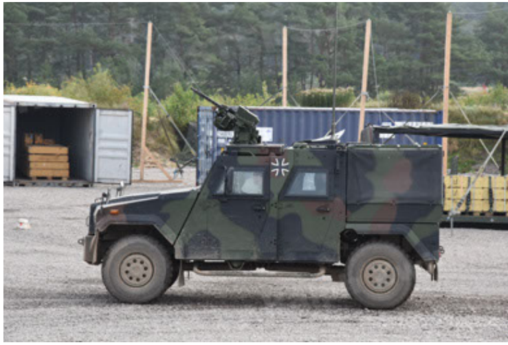
Eagle IV EinsFzgFüPers (109).JPG