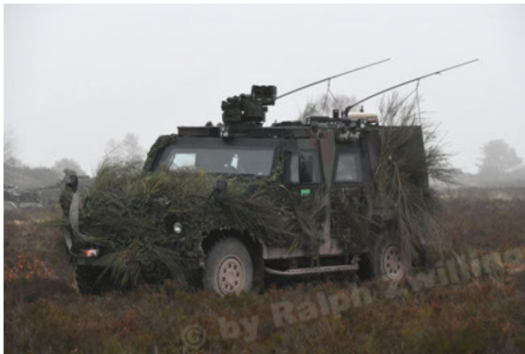
Eagle IV EinsFzgFüPers (171).JPG