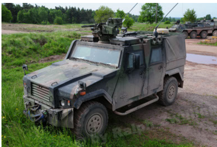
Eagle IV EinsFzgFüPers (17).JPG