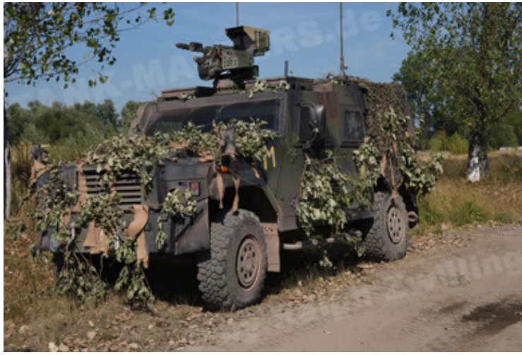
Eagle IV EinsFzgFüPers (37).JPG