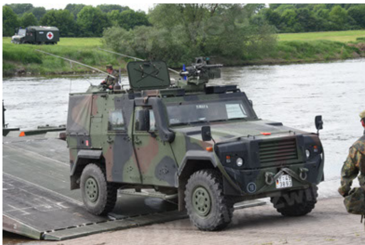
Eagle IV EinsFzgFüPers (95).JPG