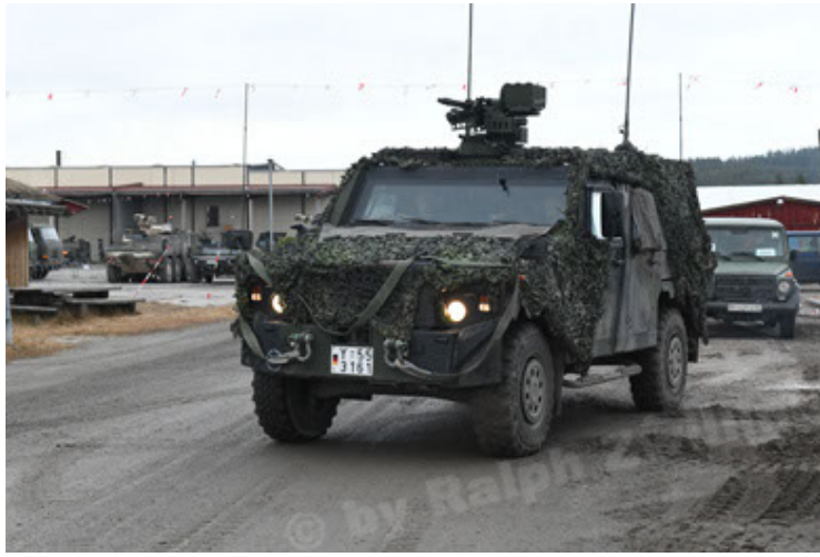
Eagle IV EinsFzgFüPers (139).JPG