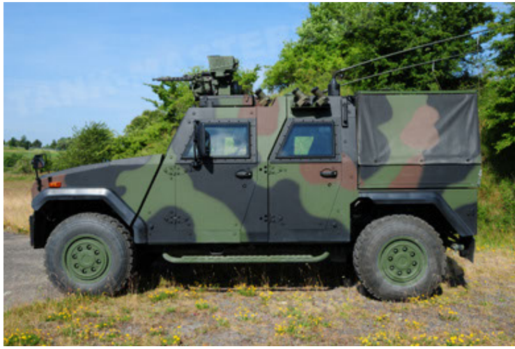
Eagle IV EinsFzgFüPers (55).JPG