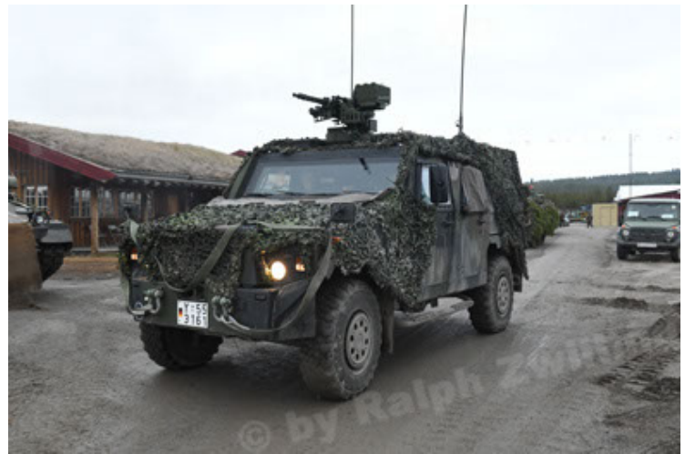
Eagle IV EinsFzgFüPers (142).JPG