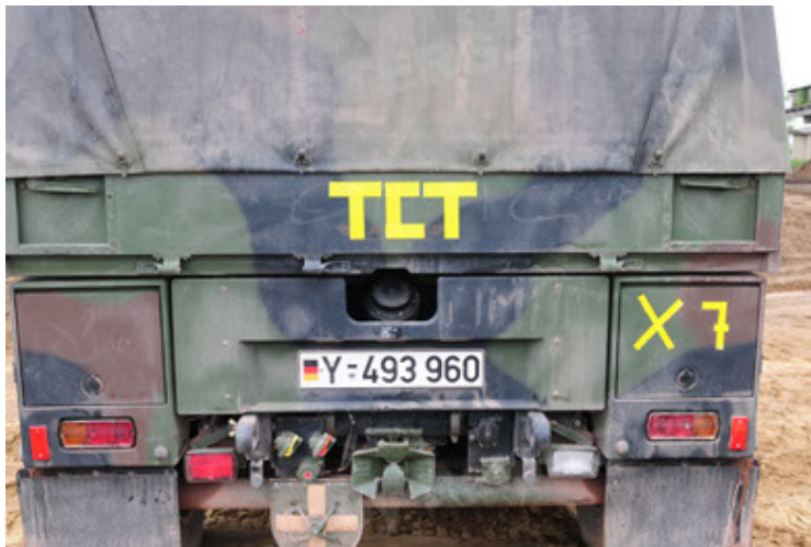
Eagle IV EinsFzgFüPers (75).JPG