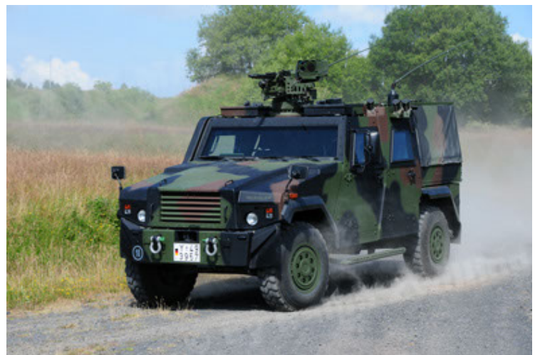
Eagle IV EinsFzgFüPers (24).JPG