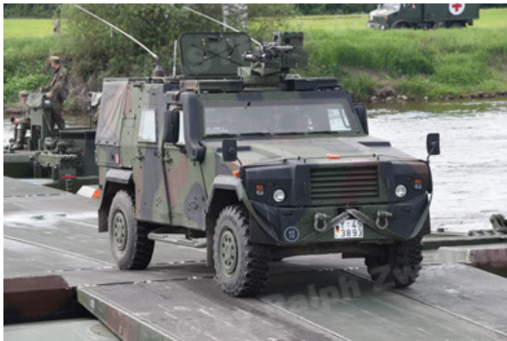
Eagle IV EinsFzgFüPers (93).JPG