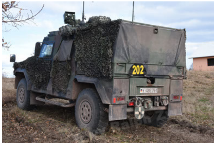
Eagle IV EinsFzgFüPers (124).JPG