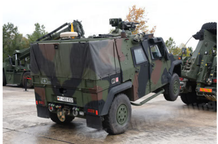
Eagle IV EinsFzgFüPers (112).JPG