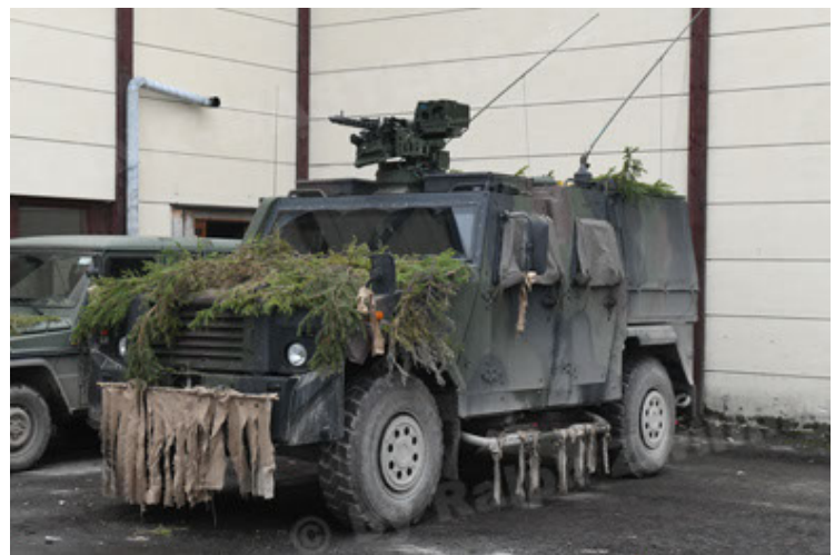
Eagle IV EinsFzgFüPers (150).JPG