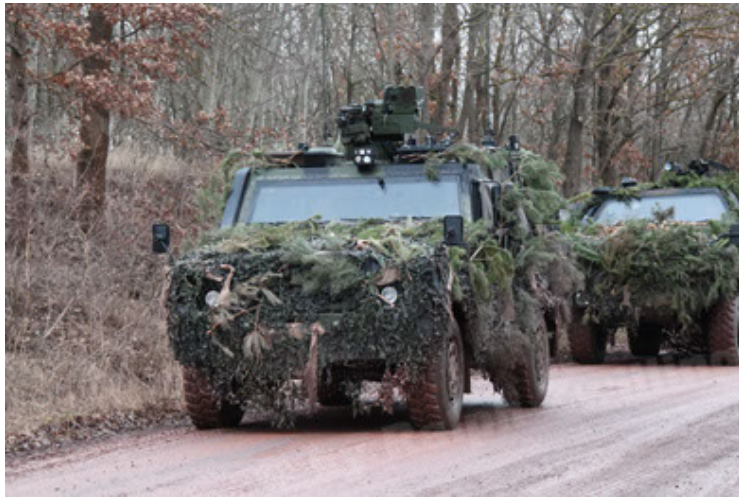
Eagle IV EinsFzgFüPers (177).JPG