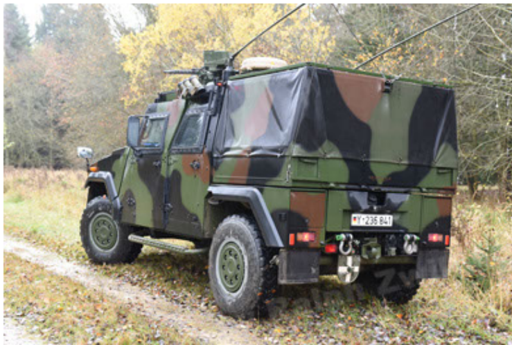
Eagle IV EinsFzgFüPers (63).JPG