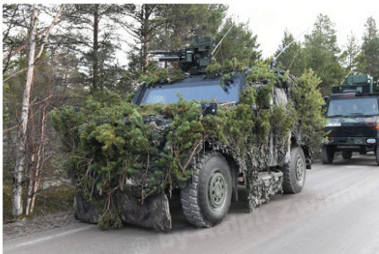
Eagle IV EinsFzgFüPers (137).JPG