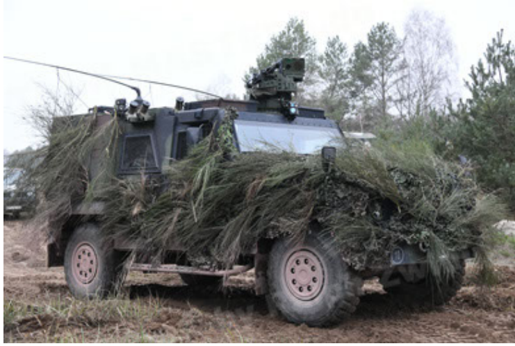
Eagle IV EinsFzgFüPers (163).JPG