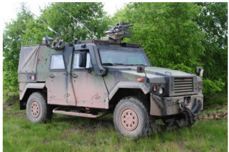
Eagle IV EinsFzgFüPers (12).JPG