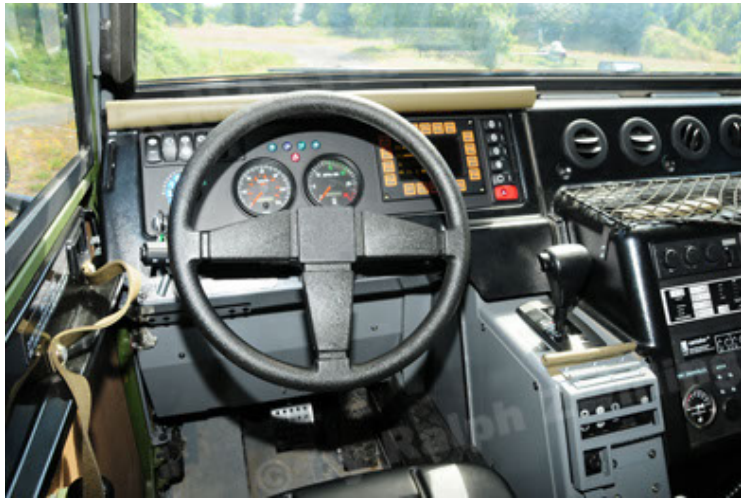
Eagle IV EinsFzgFüPers (79).JPG