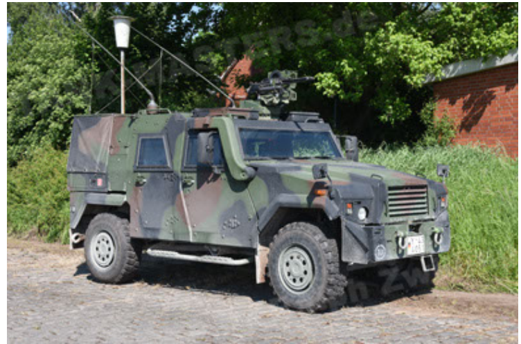
Eagle IV EinsFzgFüPers (88).JPG