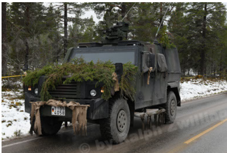
Eagle IV EinsFzgFüPers (131).JPG