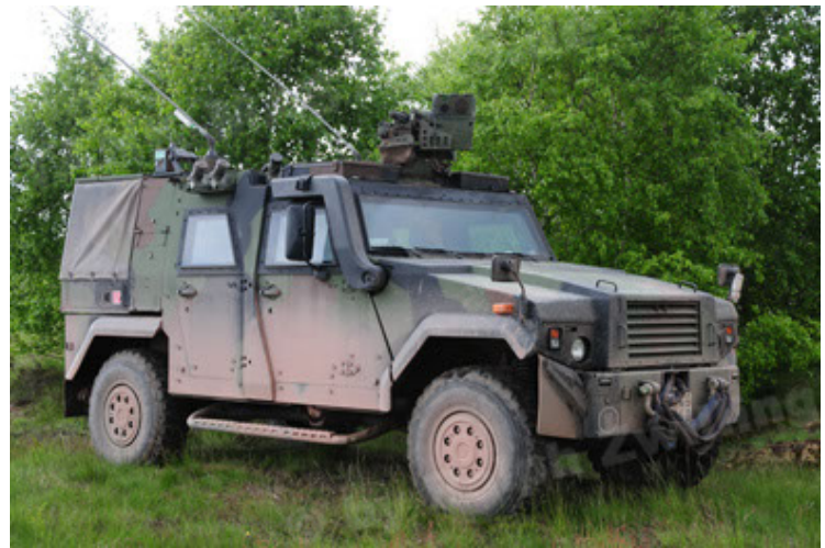
Eagle IV EinsFzgFüPers (10).JPG