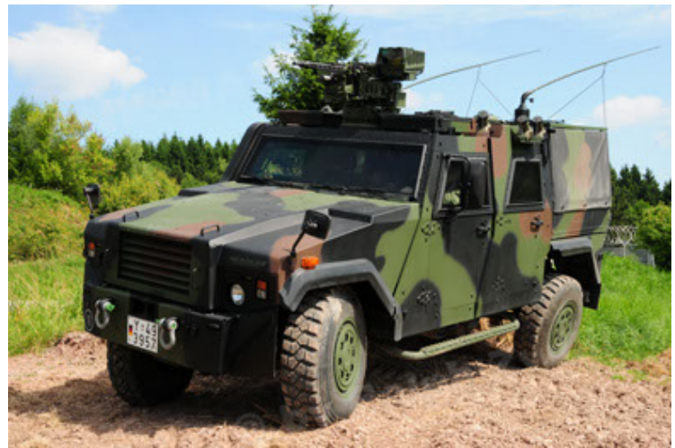
Eagle IV EinsFzgFüPers (58).JPG