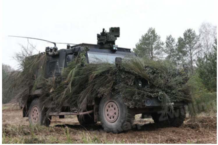
Eagle IV EinsFzgFüPers (164).JPG