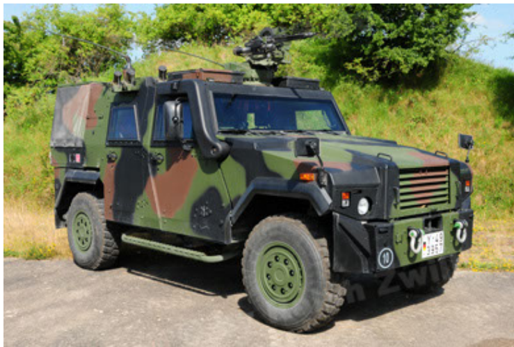
Eagle IV EinsFzgFüPers (9).JPG