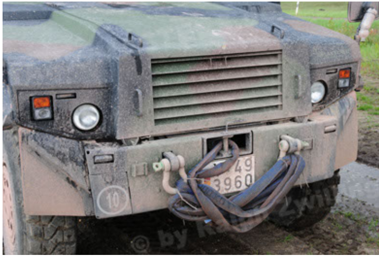
Eagle IV EinsFzgFüPers (73).JPG