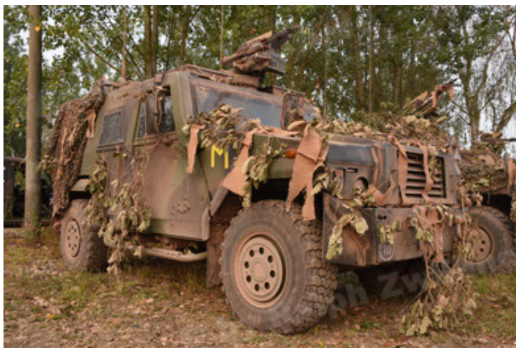
Eagle IV EinsFzgFüPers (41).JPG