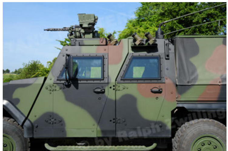
Eagle IV EinsFzgFüPers (72).JPG