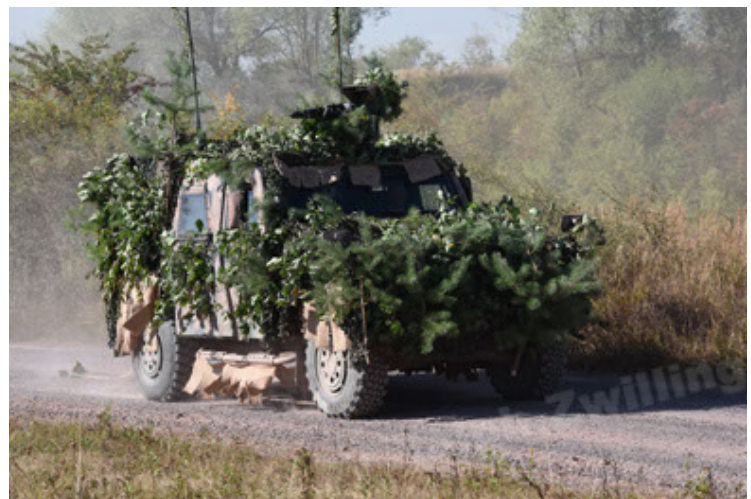
Eagle IV EinsFzgFüPers (30).JPG