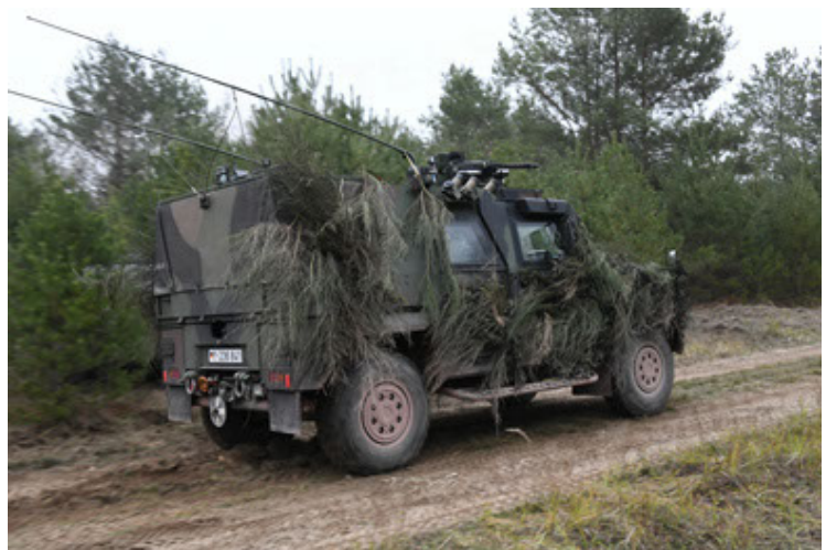
Eagle IV EinsFzgFüPers (168).JPG