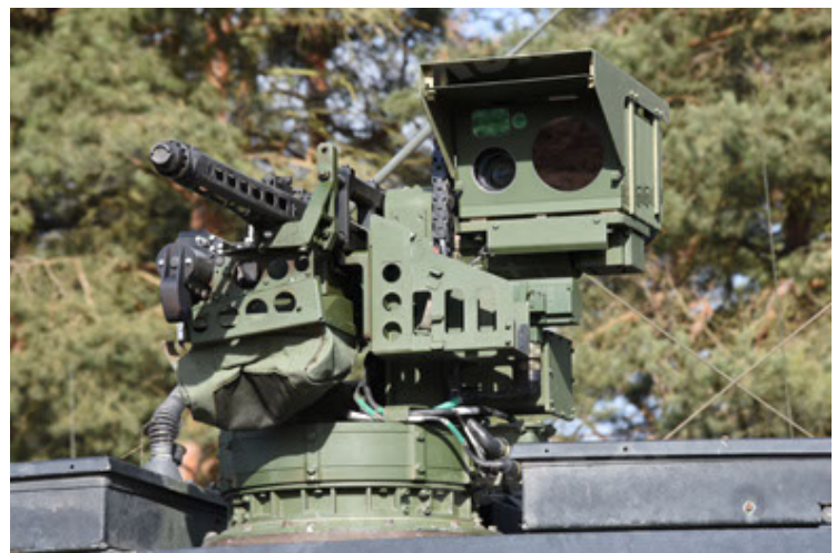
Eagle IV EinsFzgFüPers (120).JPG