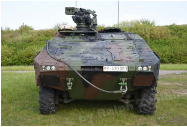
GTK Boxer GrpTrspFzg A2 (25).JPG