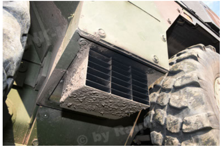
GTK Boxer GrpTrspFzg A2 (44).JPG