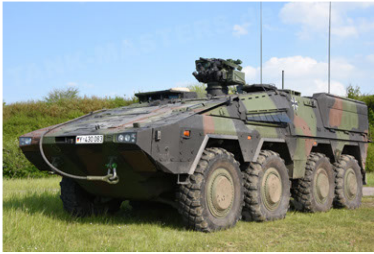
GTK Boxer GrpTrspFzg A2 (7).JPG