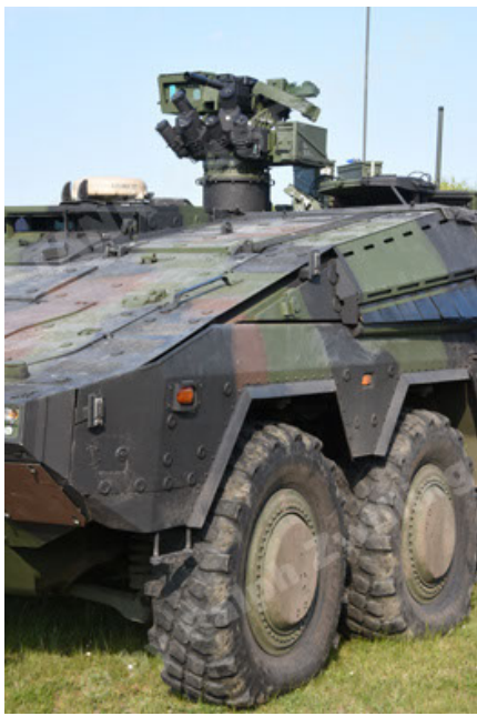
GTK Boxer GrpTrspFzg A2 (37).JPG