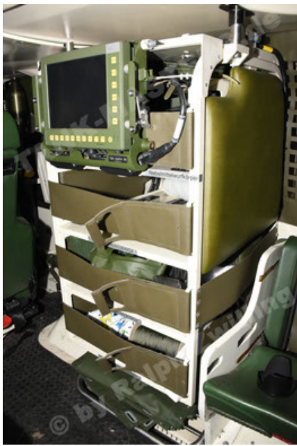
GTK Boxer GrpTrspFzg A2 (115).JPG