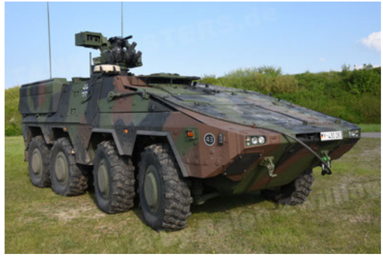
GTK Boxer GrpTrspFzg A2 (2).JPG