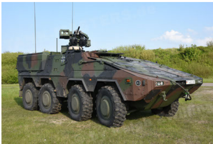
GTK Boxer GrpTrspFzg A2 (23).JPG