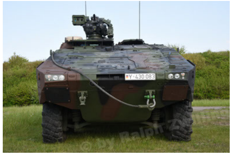
GTK Boxer GrpTrspFzg A2 (26).JPG