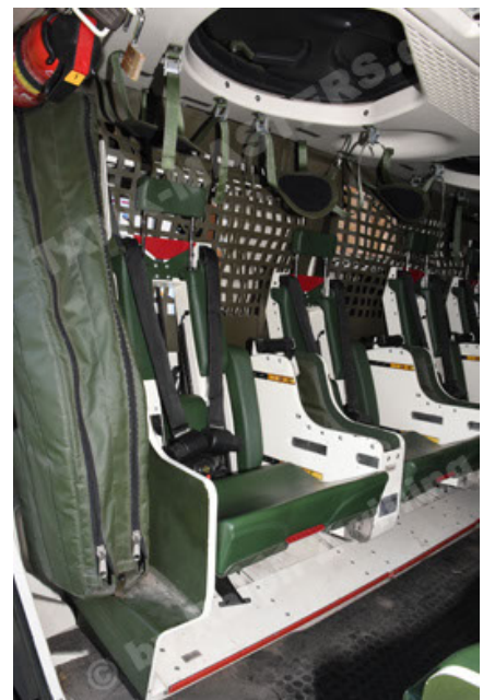
GTK Boxer GrpTrspFzg A2 (96).JPG