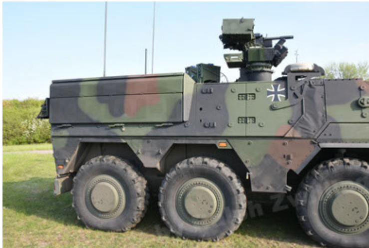
GTK Boxer GrpTrspFzg A2 (51).JPG