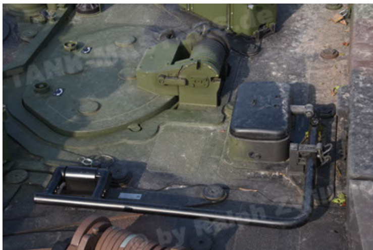
GTK Boxer GrpTrspFzg A2 (89).JPG