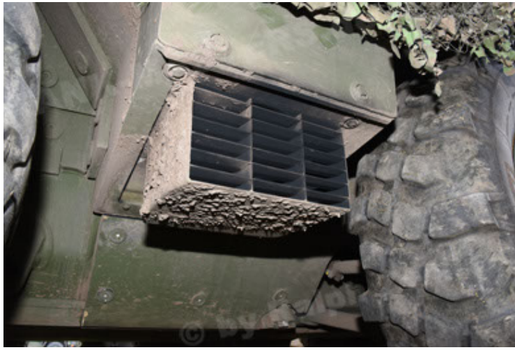
GTK Boxer GrpTrspFzg A2 (43).JPG