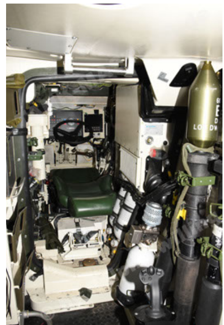
GTK Boxer GrpTrspFzg A2 (108).JPG