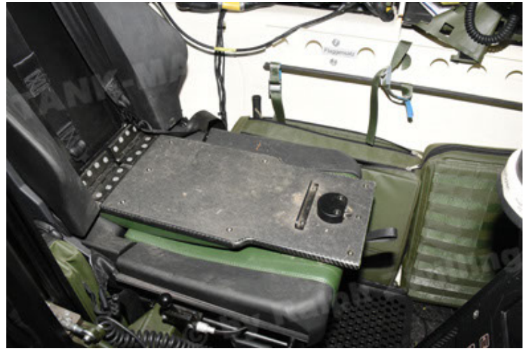
GTK Boxer GrpTrspFzg A2 (110).JPG