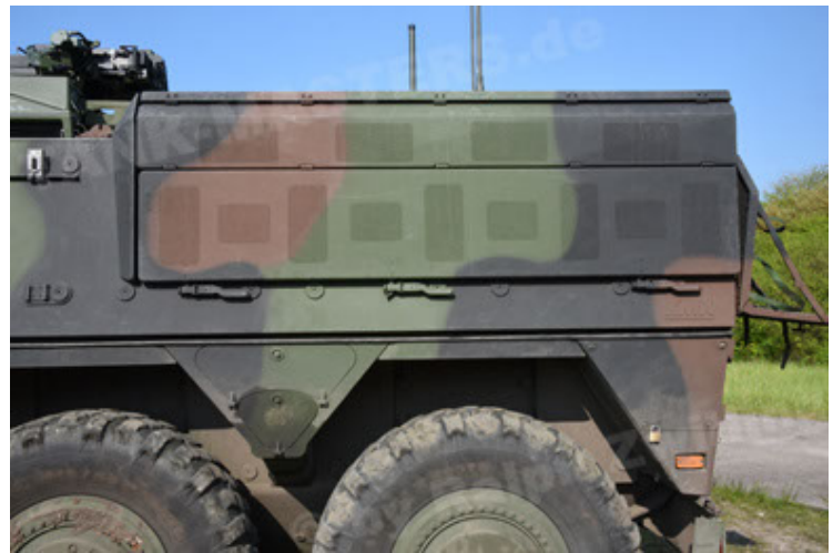
GTK Boxer GrpTrspFzg A2 (46).JPG