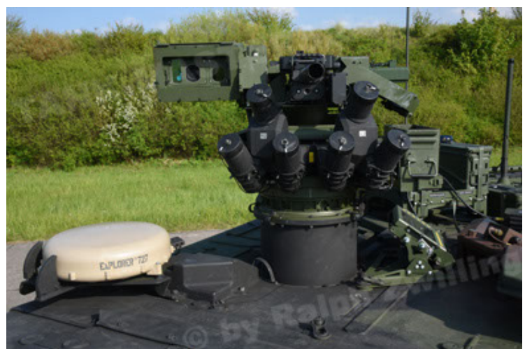
GTK Boxer GrpTrspFzg A2 (66).JPG