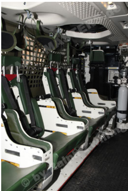
GTK Boxer GrpTrspFzg A2 (97).JPG