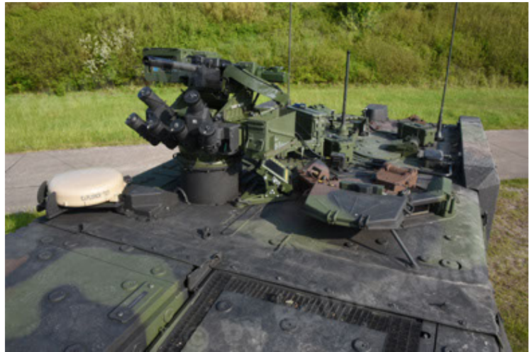
GTK Boxer GrpTrspFzg A2 (58).JPG