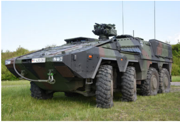
GTK Boxer GrpTrspFzg A2 (13).JPG