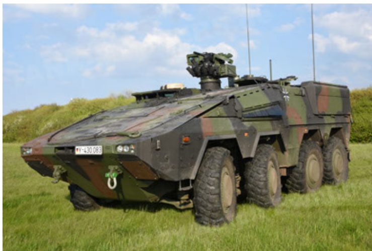
GTK Boxer GrpTrspFzg A2 (5).JPG