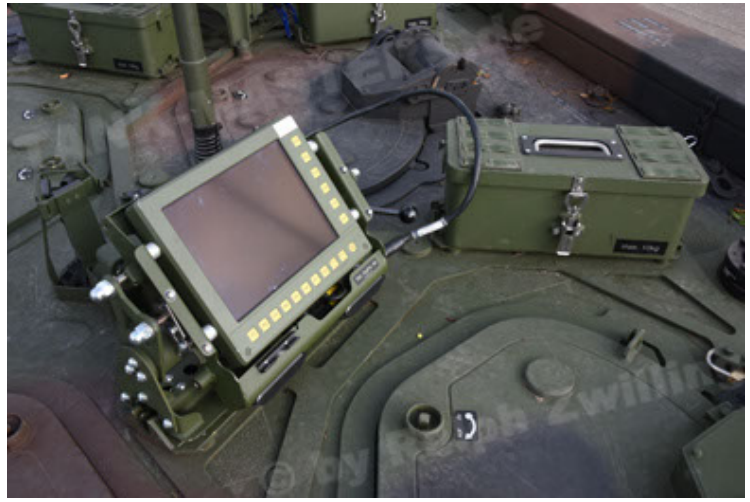
GTK Boxer GrpTrspFzg A2 (92).JPG