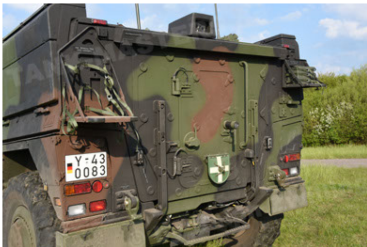
GTK Boxer GrpTrspFzg A2 (53).JPG