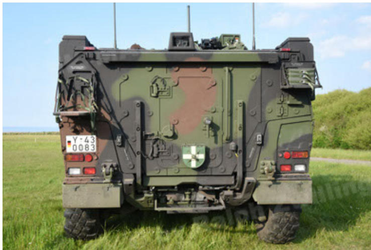
GTK Boxer GrpTrspFzg A2 (33).JPG