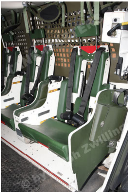
GTK Boxer GrpTrspFzg A2 (99).JPG