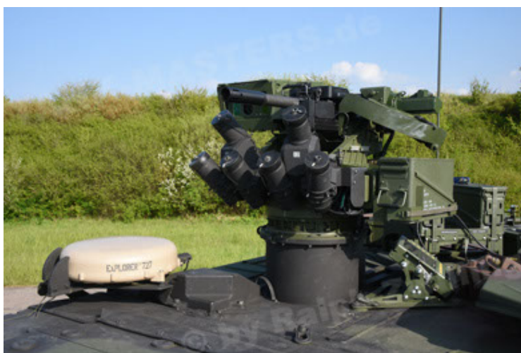
GTK Boxer GrpTrspFzg A2 (65).JPG