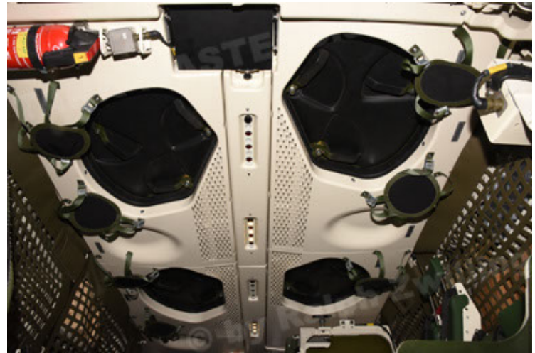
GTK Boxer GrpTrspFzg A2 (124).JPG