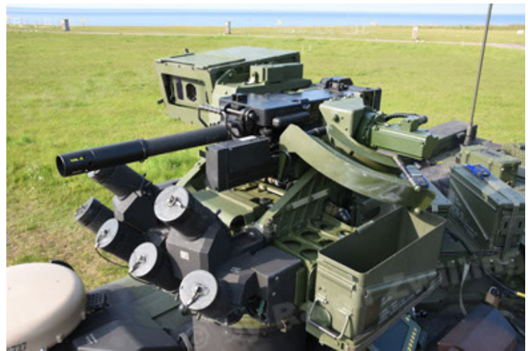
GTK Boxer GrpTrspFzg A2 (64).JPG