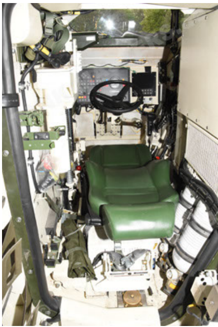
GTK Boxer GrpTrspFzg A2 (109).JPG