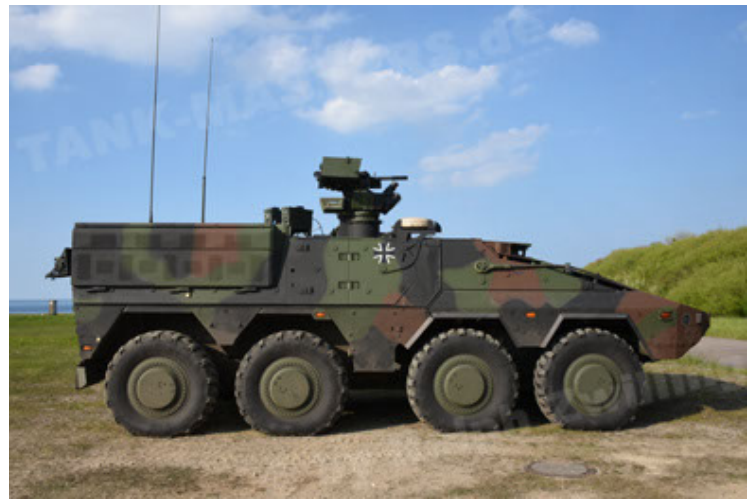
GTK Boxer GrpTrspFzg A2 (28).JPG