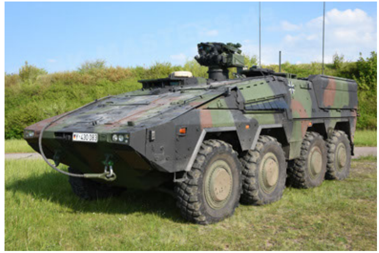
GTK Boxer GrpTrspFzg A2 (8).JPG