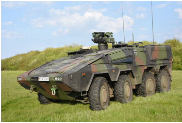
GTK Boxer GrpTrspFzg A2 (1).JPG