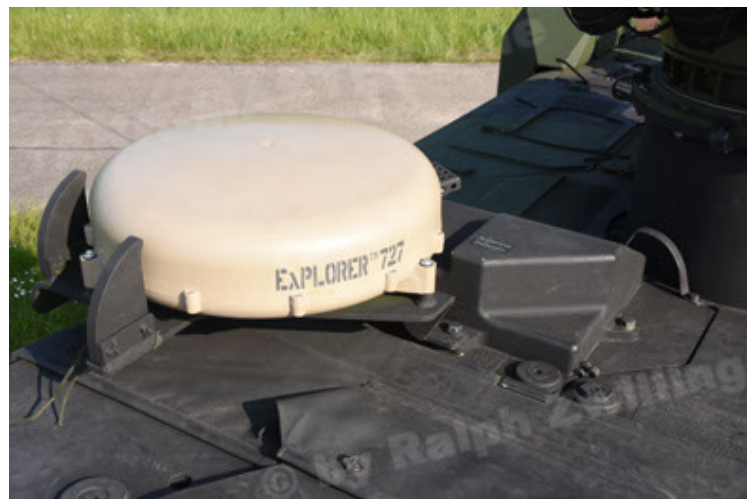
GTK Boxer GrpTrspFzg A2 (72).JPG