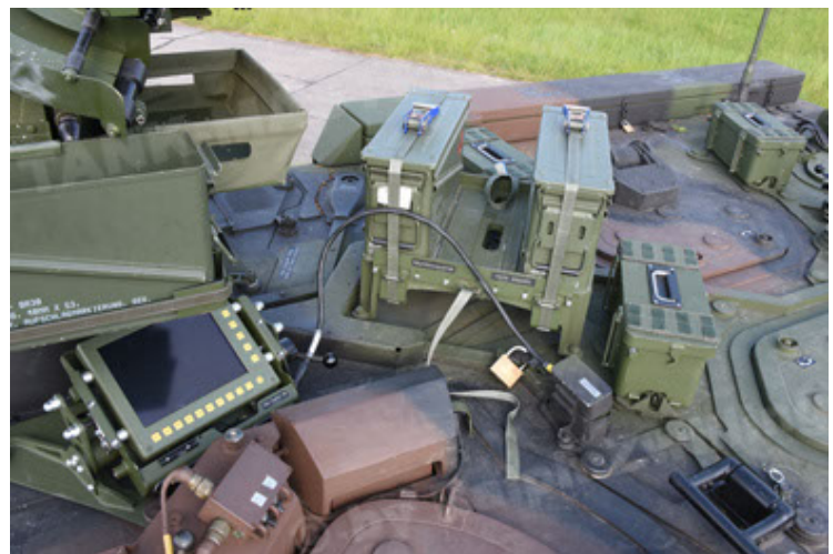
GTK Boxer GrpTrspFzg A2 (78).JPG