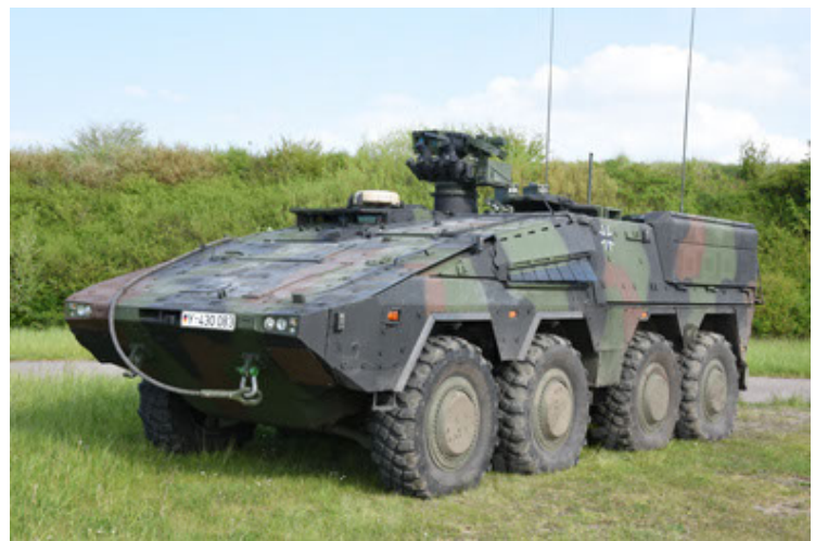
GTK Boxer GrpTrspFzg A2 (6).JPG