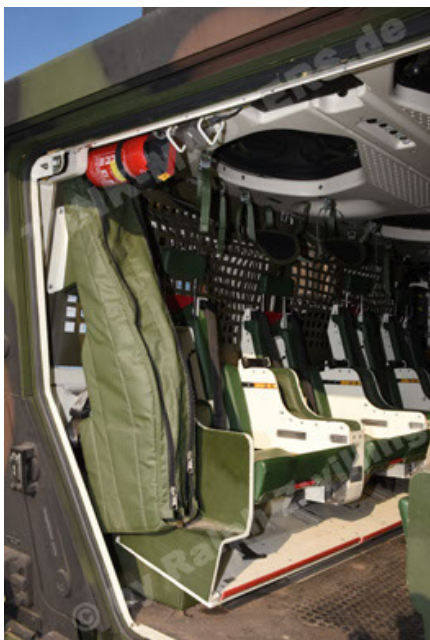
GTK Boxer GrpTrspFzg A2 (95).JPG