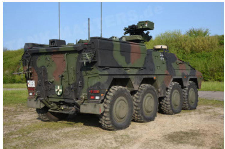
GTK Boxer GrpTrspFzg A2 (30).JPG