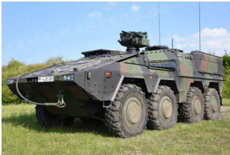
GTK Boxer GrpTrspFzg A2 (3).JPG