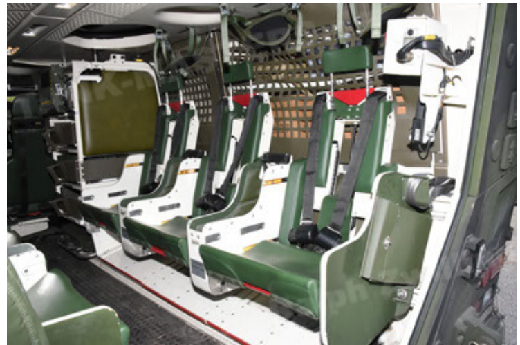
GTK Boxer GrpTrspFzg A2 (100).JPG