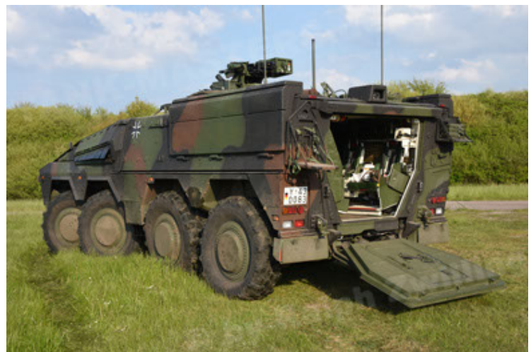
GTK Boxer GrpTrspFzg A2 (36).JPG