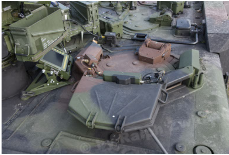
GTK Boxer GrpTrspFzg A2 (73).JPG