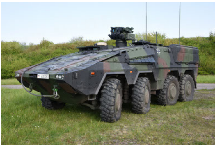
GTK Boxer GrpTrspFzg A2 (11).JPG