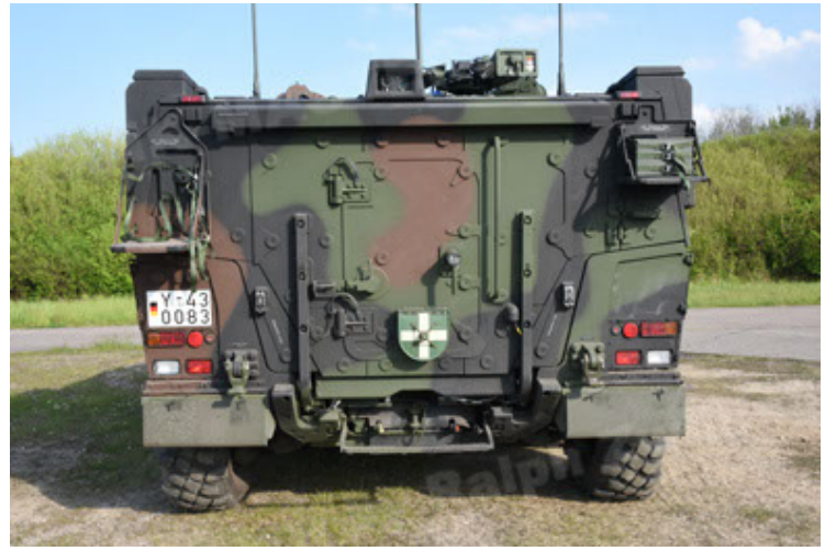
GTK Boxer GrpTrspFzg A2 (32).JPG