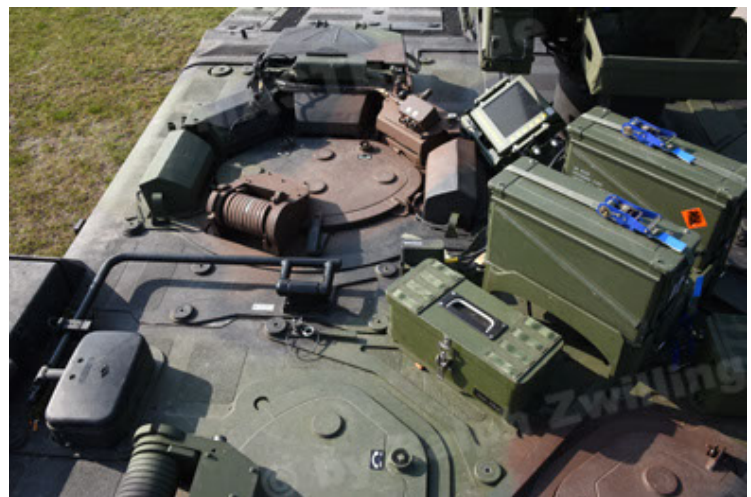
GTK Boxer GrpTrspFzg A2 (84).JPG