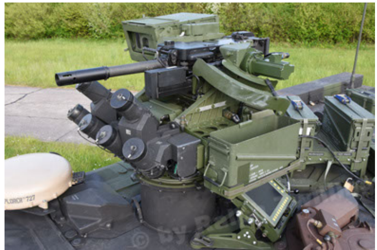
GTK Boxer GrpTrspFzg A2 (70).JPG