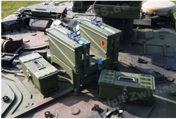
GTK Boxer GrpTrspFzg A2 (85).JPG