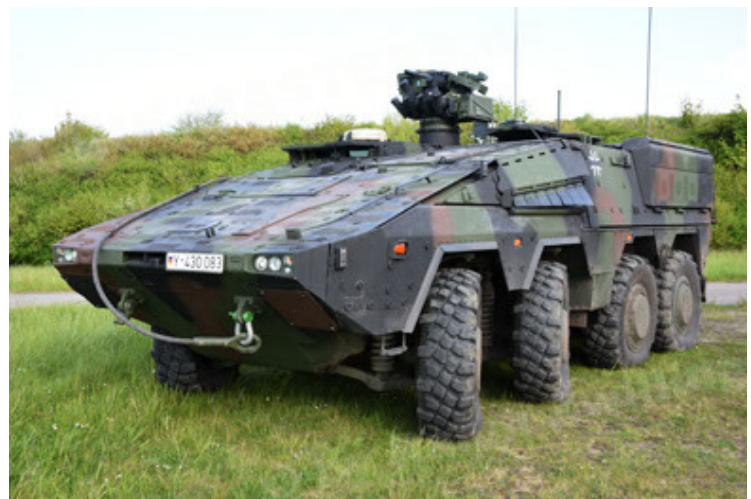
GTK Boxer GrpTrspFzg A2 (12).JPG