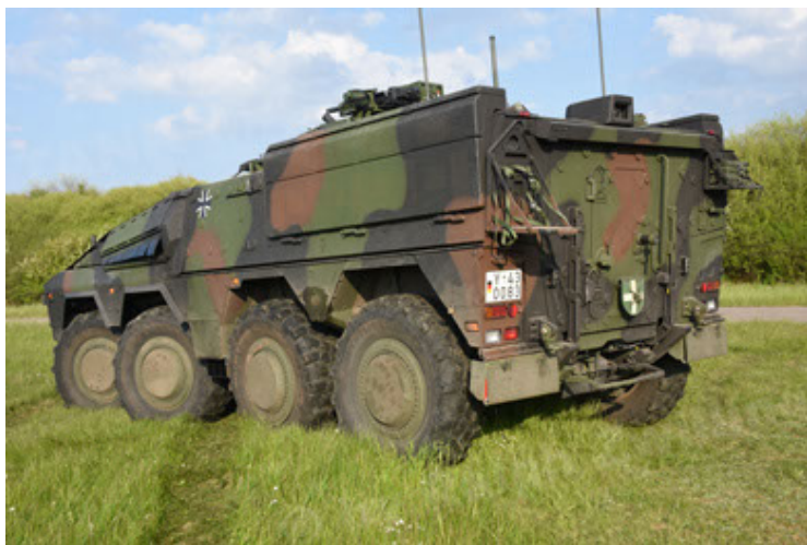
GTK Boxer GrpTrspFzg A2 (35).JPG