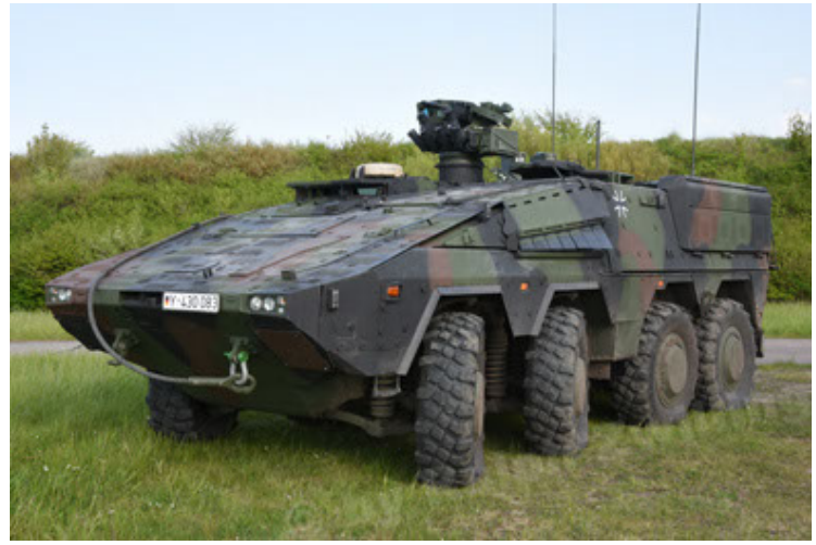
GTK Boxer GrpTrspFzg A2 (14).JPG