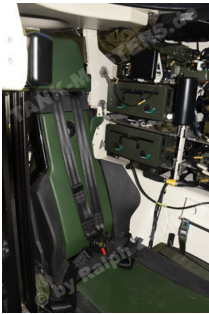
GTK Boxer GrpTrspFzg A2 (121).JPG