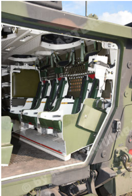
GTK Boxer GrpTrspFzg A2 (93).JPG