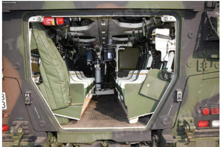
GTK Boxer GrpTrspFzg A2 (94).JPG