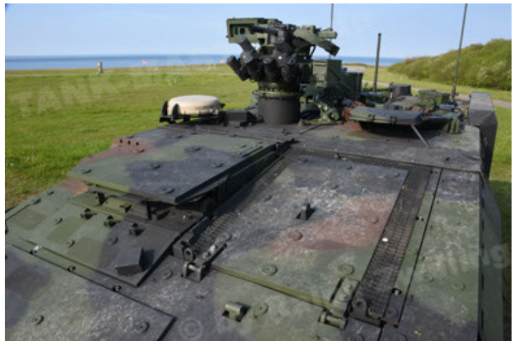
GTK Boxer GrpTrspFzg A2 (60).JPG