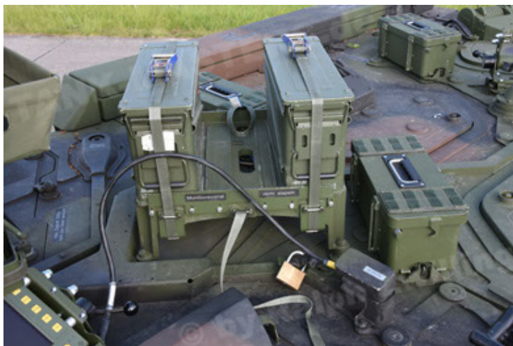
GTK Boxer GrpTrspFzg A2 (77).JPG