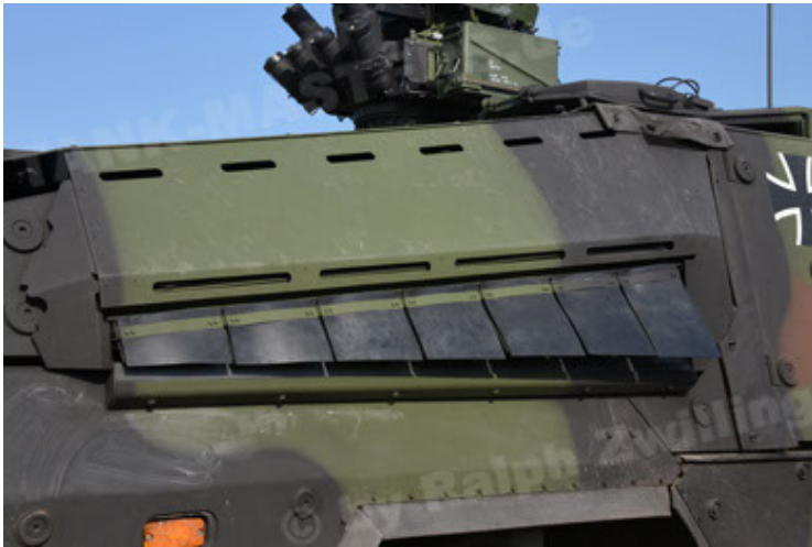
GTK Boxer GrpTrspFzg A2 (39).JPG