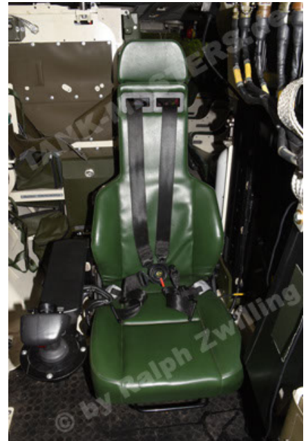
GTK Boxer GrpTrspFzg A2 (118).JPG