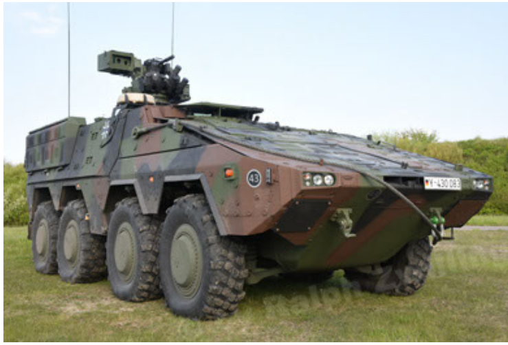
GTK Boxer GrpTrspFzg A2 (19).JPG