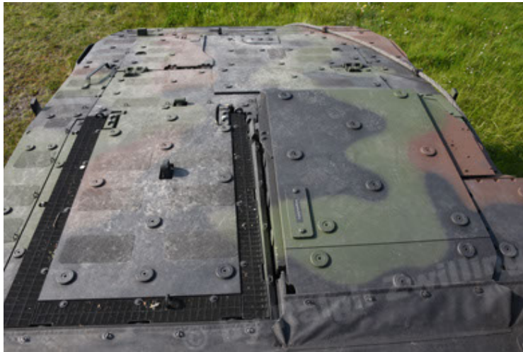
GTK Boxer GrpTrspFzg A2 (87).JPG