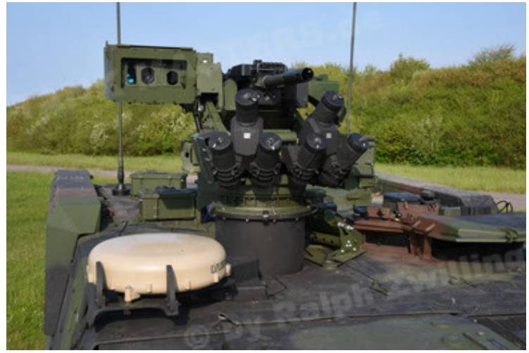
GTK Boxer GrpTrspFzg A2 (62).JPG