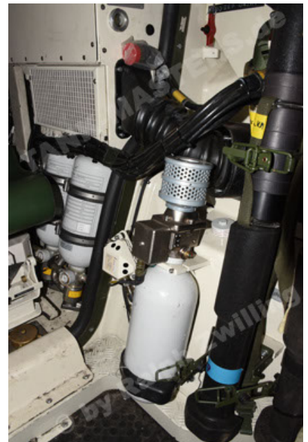
GTK Boxer GrpTrspFzg A2 (120).JPG