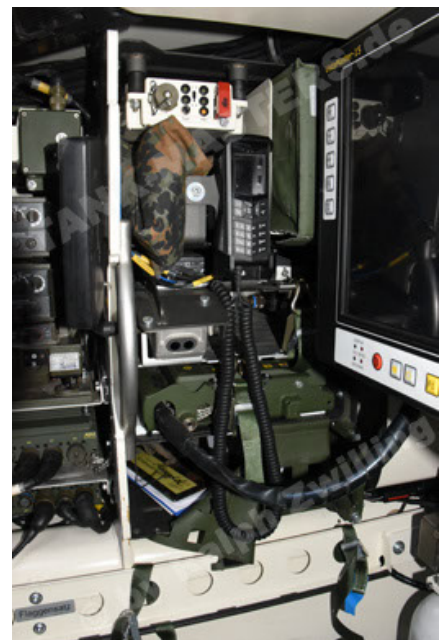
GTK Boxer GrpTrspFzg A2 (114).JPG