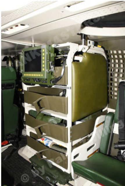
GTK Boxer GrpTrspFzg A2 (105).JPG