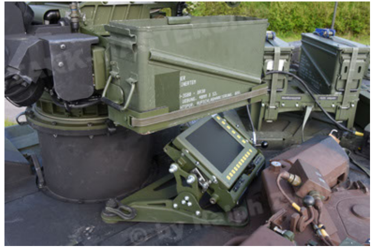
GTK Boxer GrpTrspFzg A2 (74).JPG