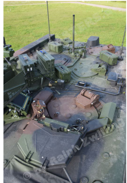
GTK Boxer GrpTrspFzg A2 (88).JPG