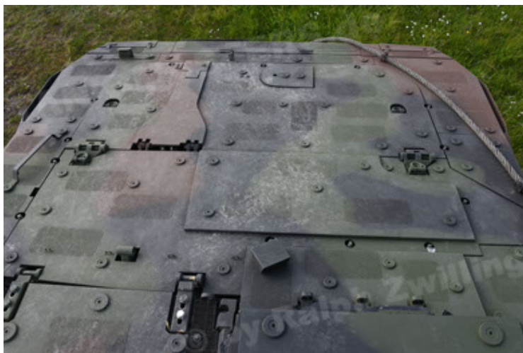
GTK Boxer GrpTrspFzg A2 (71).JPG