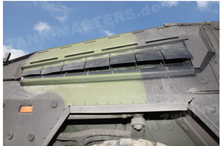
GTK Boxer GrpTrspFzg A2 (40).JPG