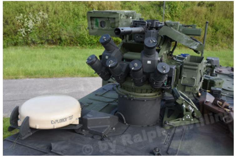
GTK Boxer GrpTrspFzg A2 (68).JPG