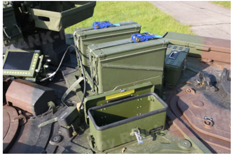
GTK Boxer GrpTrspFzg A2 (86).JPG