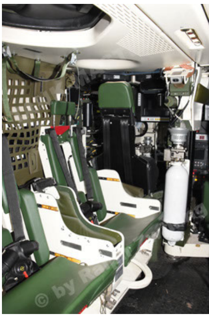
GTK Boxer GrpTrspFzg A2 (103).JPG