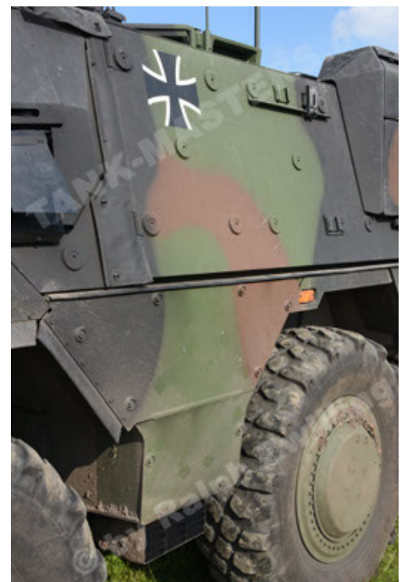
GTK Boxer GrpTrspFzg A2 (42).JPG