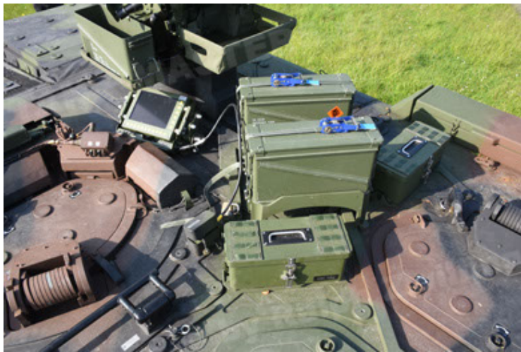
GTK Boxer GrpTrspFzg A2 (81).JPG