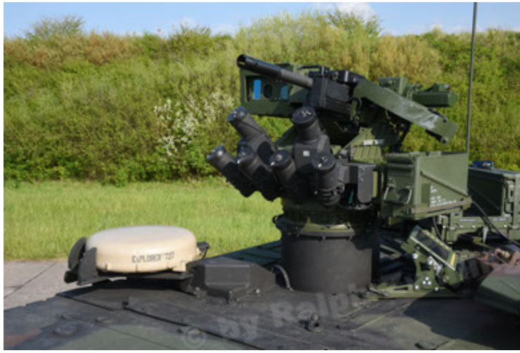
GTK Boxer GrpTrspFzg A2 (67).JPG