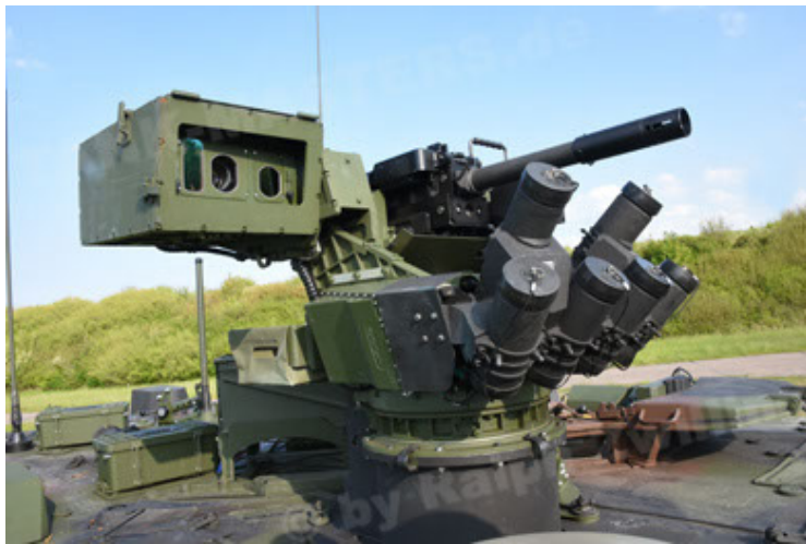
GTK Boxer GrpTrspFzg A2 (69).JPG