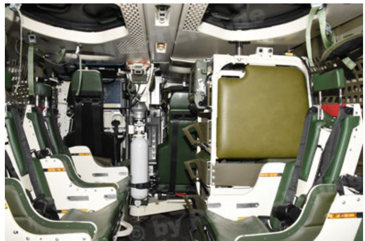
GTK Boxer GrpTrspFzg A2 (102).JPG