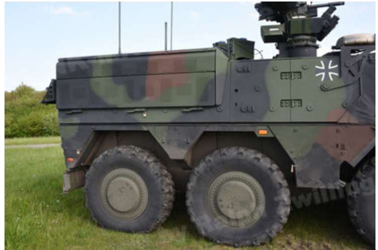
GTK Boxer GrpTrspFzg A2 (52).JPG