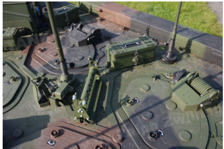
GTK Boxer GrpTrspFzg A2 (82).JPG