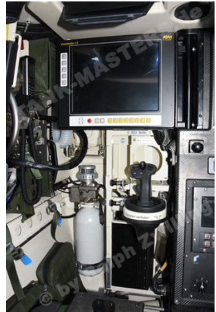
GTK Boxer GrpTrspFzg A2 (106).JPG