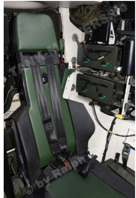
GTK Boxer GrpTrspFzg A2 (112).JPG