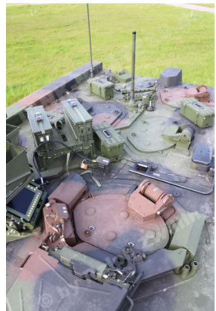
GTK Boxer GrpTrspFzg A2 (90).JPG