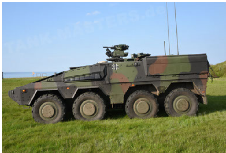
GTK Boxer GrpTrspFzg A2 (29).JPG