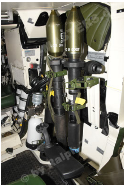
GTK Boxer GrpTrspFzg A2 (107).JPG