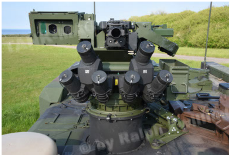
GTK Boxer GrpTrspFzg A2 (63).JPG