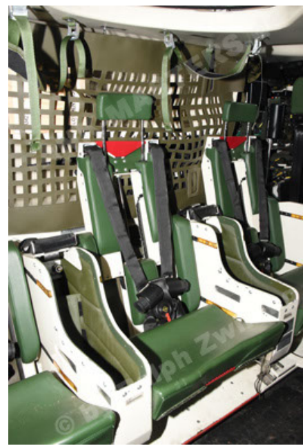
GTK Boxer GrpTrspFzg A2 (104).JPG