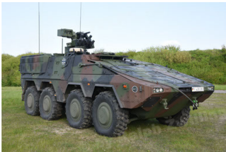
GTK Boxer GrpTrspFzg A2 (17).JPG