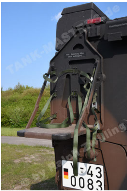
GTK Boxer GrpTrspFzg A2 (55).JPG