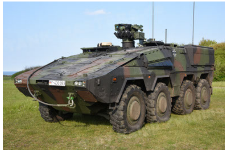
GTK Boxer GrpTrspFzg A2 (16).JPG