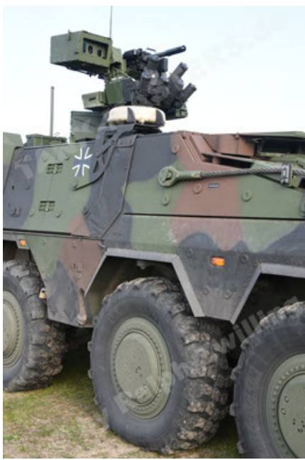
GTK Boxer GrpTrspFzg A2 (49).JPG