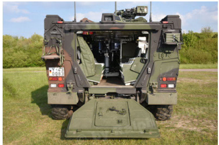
GTK Boxer GrpTrspFzg A2 (34).JPG