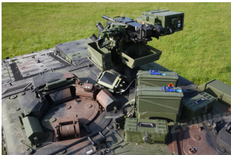
GTK Boxer GrpTrspFzg A2 (83).JPG