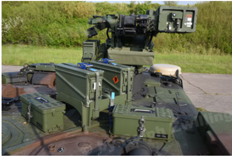
GTK Boxer GrpTrspFzg A2 (91).JPG