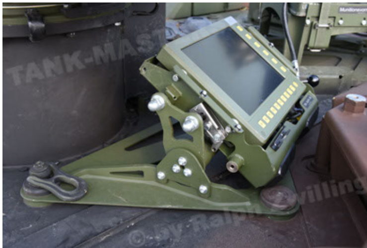
GTK Boxer GrpTrspFzg A2 (75).JPG