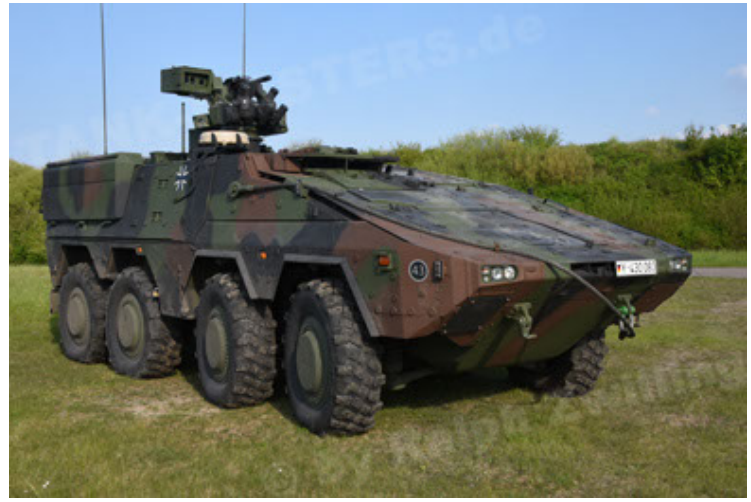
GTK Boxer GrpTrspFzg A2 (20).JPG