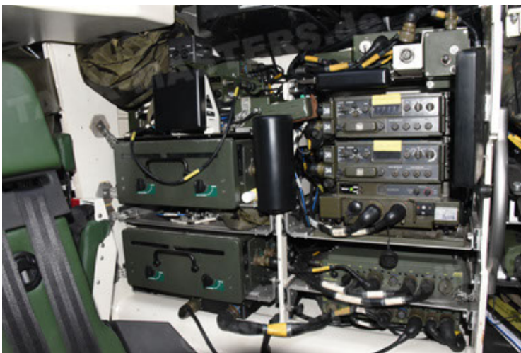
GTK Boxer GrpTrspFzg A2 (113).JPG