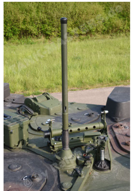
GTK Boxer GrpTrspFzg A2 (80).JPG