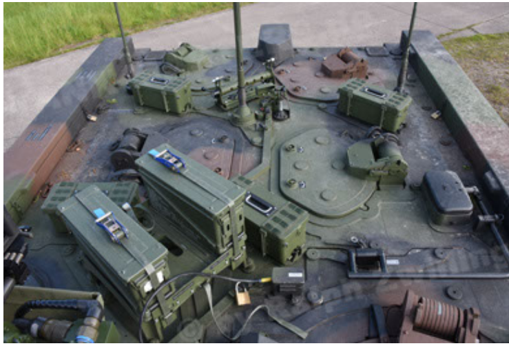
GTK Boxer GrpTrspFzg A2 (79).JPG