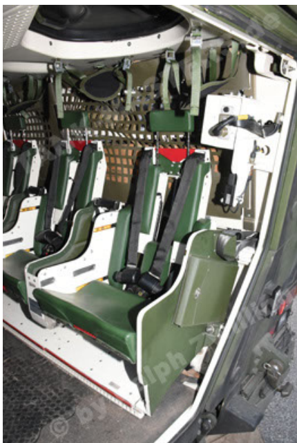
GTK Boxer GrpTrspFzg A2 (101).JPG