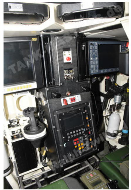
GTK Boxer GrpTrspFzg A2 (116).JPG