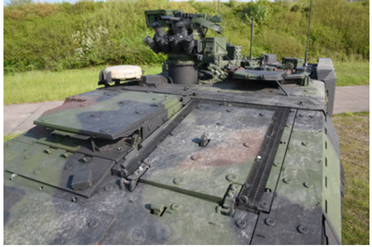
GTK Boxer GrpTrspFzg A2 (56).JPG