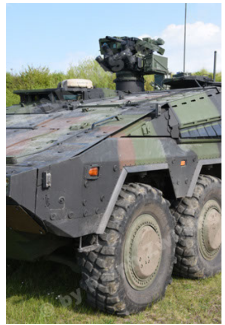
GTK Boxer GrpTrspFzg A2 (38).JPG