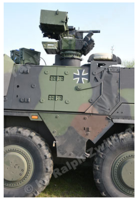
GTK Boxer GrpTrspFzg A2 (50).JPG