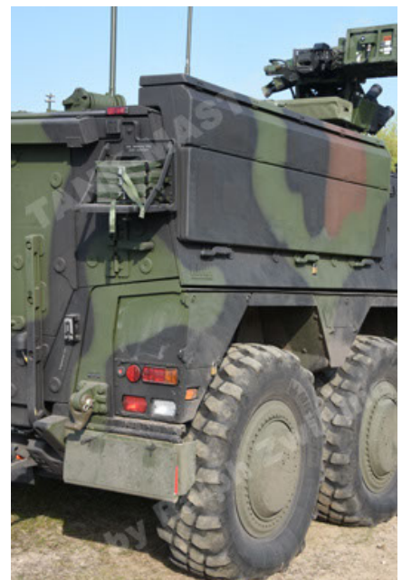
GTK Boxer GrpTrspFzg A2 (54).JPG