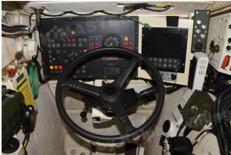
GTK Boxer GrpTrspFzg A2 (117).JPG