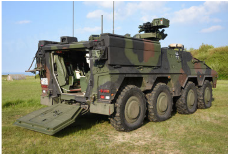
GTK Boxer GrpTrspFzg A2 (31).JPG