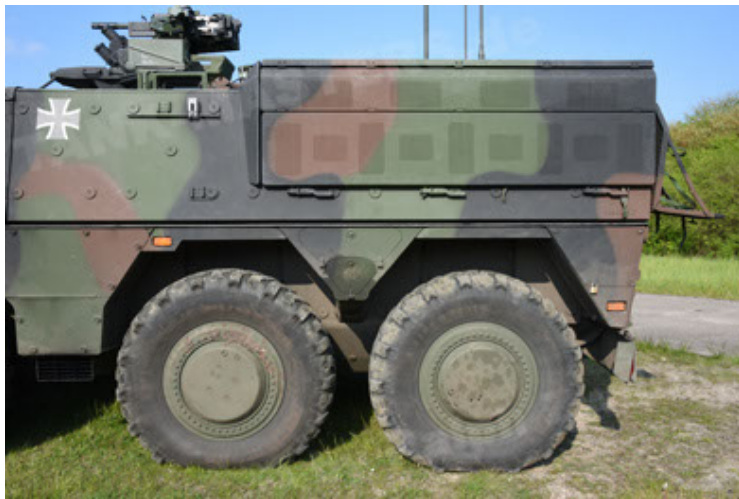
GTK Boxer GrpTrspFzg A2 (45).JPG