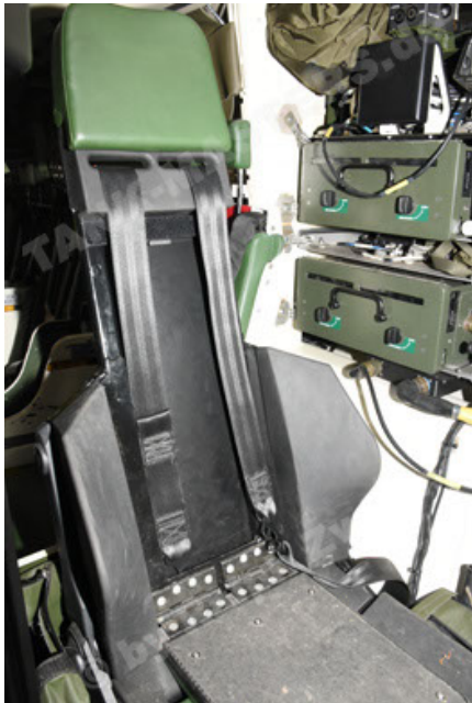
GTK Boxer GrpTrspFzg A2 (111).JPG