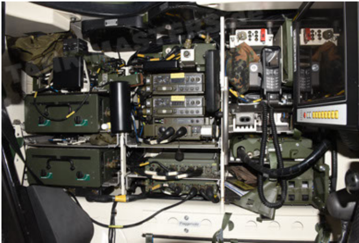
GTK Boxer GrpTrspFzg A2 (123).JPG