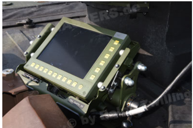
GTK Boxer GrpTrspFzg A2 (76).JPG