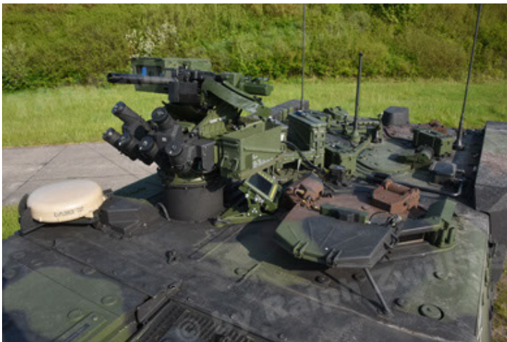
GTK Boxer GrpTrspFzg A2 (59).JPG