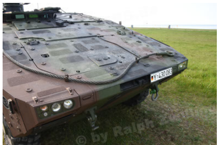
GTK Boxer GrpTrspFzg A2 (48).JPG