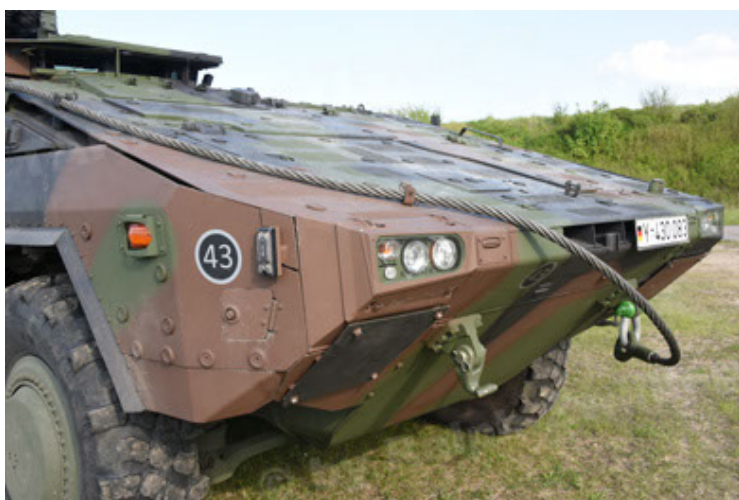
GTK Boxer GrpTrspFzg A2 (47).JPG