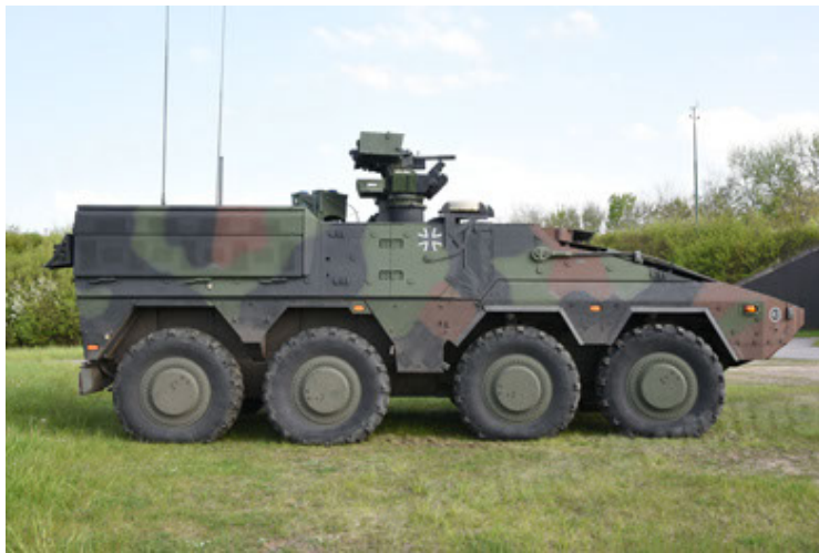
GTK Boxer GrpTrspFzg A2 (27).JPG