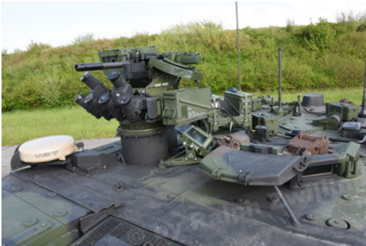
GTK Boxer GrpTrspFzg A2 (57).JPG