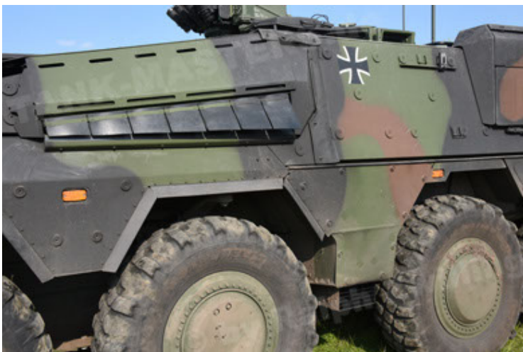
GTK Boxer GrpTrspFzg A2 (41).JPG