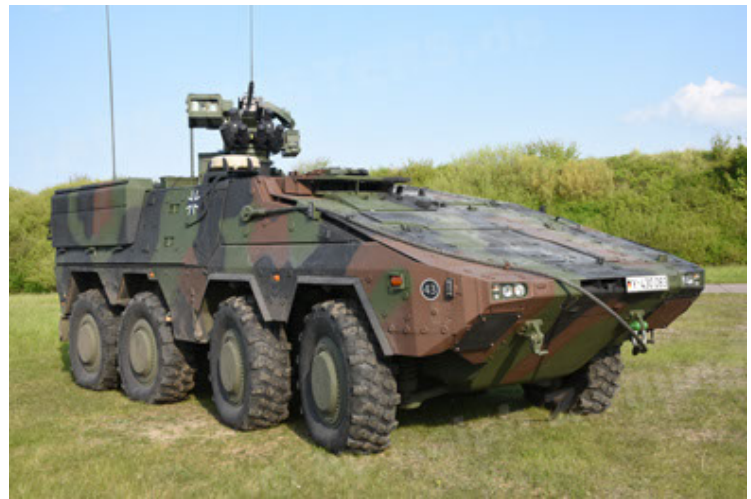
GTK Boxer GrpTrspFzg A2 (22).JPG