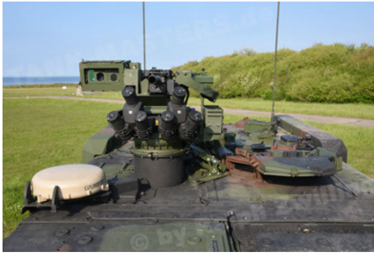
GTK Boxer GrpTrspFzg A2 (61).JPG