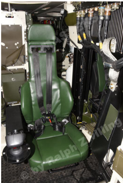
GTK Boxer GrpTrspFzg A2 (119).JPG