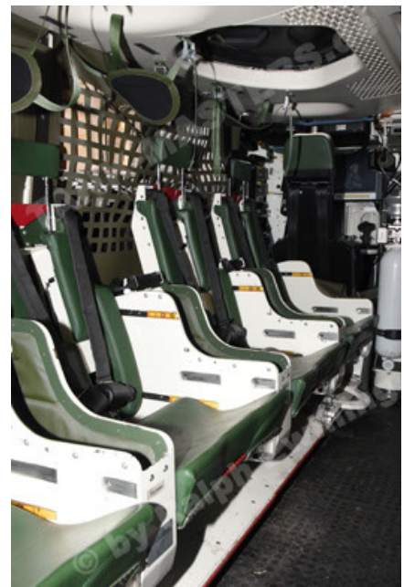
GTK Boxer GrpTrspFzg A2 (98).JPG