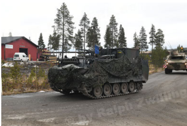
M113 G3 EFT GE A0 TrgFzg RATAAC-S (66).JPG