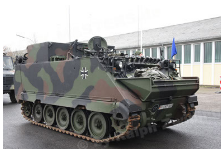
M113 G3 EFT GE A0 TrgFzg RATAAC-S (24).JPG