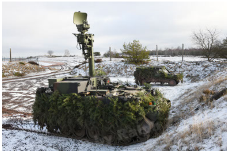
M113 G3 EFT GE A0 TrgFZG RATAAC-S (84).JPG