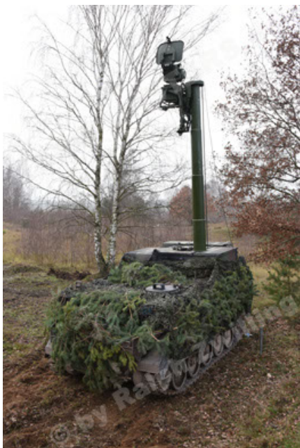
M113 G3 EFT GE A0 TrgFzg RATAAC-S (41).JPG