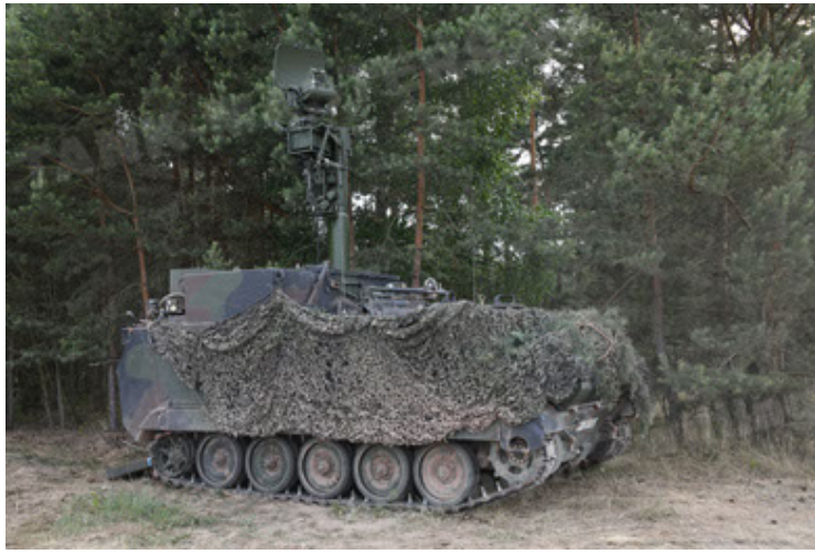
M113 G3 EFT GE A0 TrgFzg RATAAC-S (49).JPG