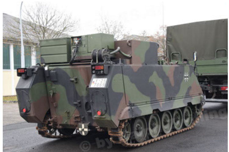
M113 G3 EFT GE A0 TrgFzg RATAAC-S (22).JPG