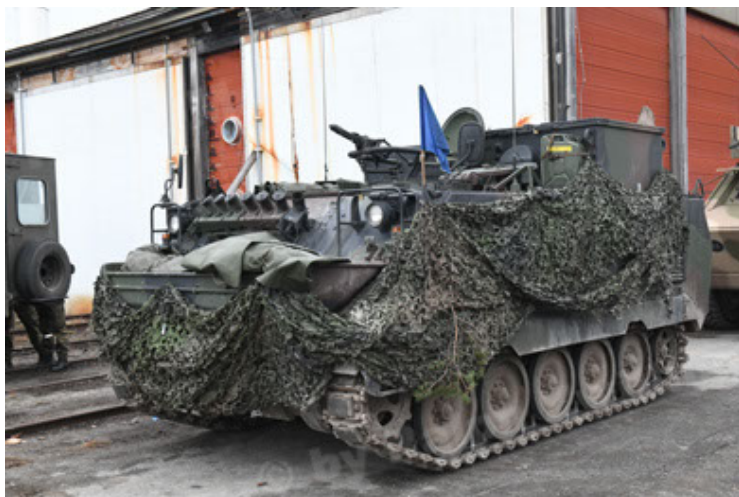
M113 G3 EFT GE A0 TrgFzg RATAAC-S (59).JPG