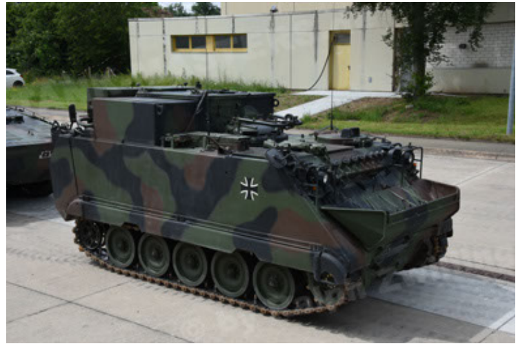
M113 G3 EFT GE A0 TrgFzg RATAAC-S (20).JPG