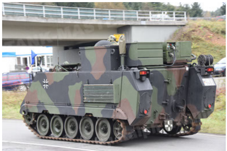
M113 G3 EFT GE A0 TrgFzg RATAAC-S (30).JPG