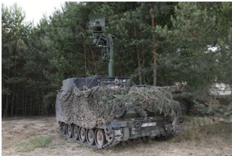
M113 G3 EFT GE A0 TrgFzg RATAAC-S (51).JPG