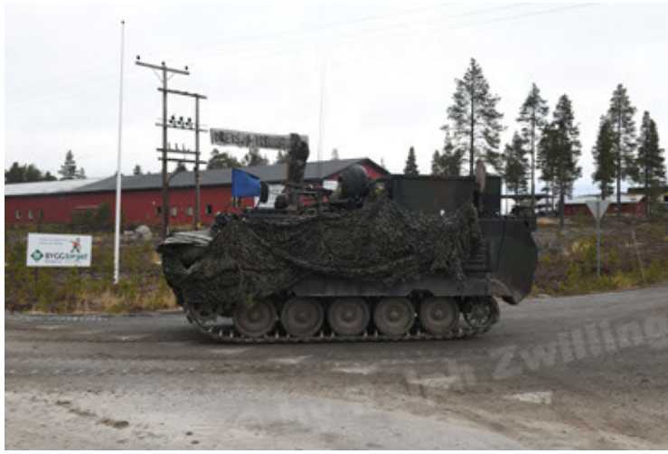
M113 G3 EFT GE A0 TrgFzg RATAAC-S (67).JPG