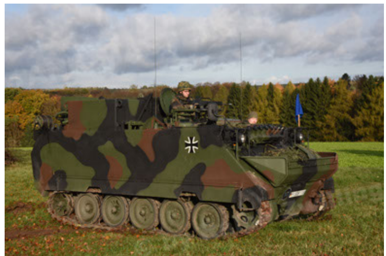
M113 G3 EFT GE A0 TrgFzg RATAAC-S (6).JPG