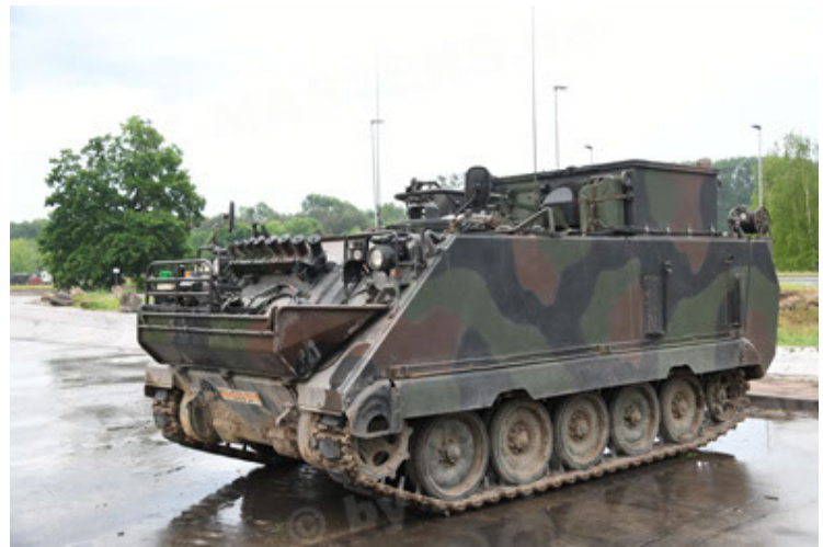
M113 G3 EFT GE A0 TrgFzg RATAAC-S (52).JPG