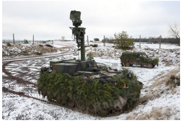
M113 G3 EFT GE A0 TrgFZG RATAAC-S (92).JPG