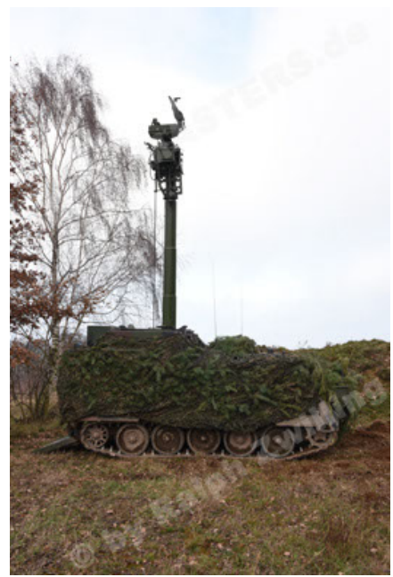
M113 G3 EFT GE A0 TrgFzg RATAAC-S (38).JPG