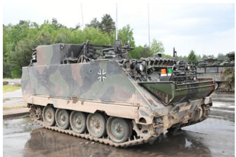
M113 G3 EFT GE A0 TrgFzg RATAAC-S (54).JPG