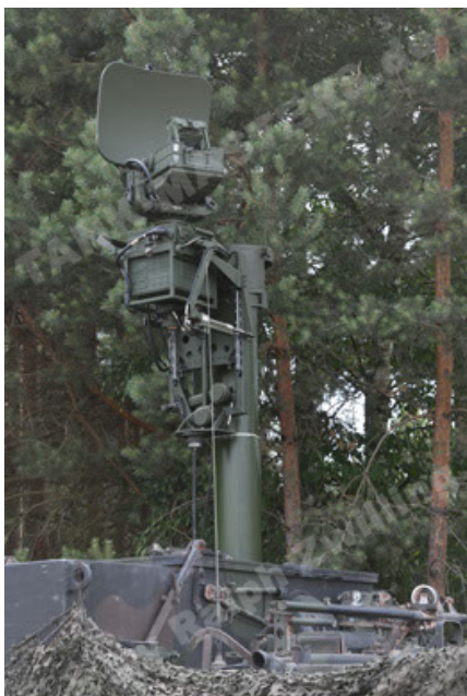
M113 G3 EFT GE A0 TrgFzg RATAAC-S (47).JPG