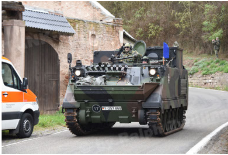
M113 G3 EFT GE A0 TrgFzg RATAAC-S (31).JPG