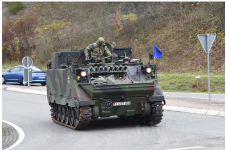
M113 G3 EFT GE A0 TrgFzg RATAAC-S (28).JPG