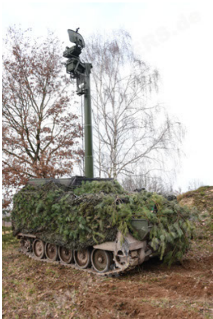
M113 G3 EFT GE A0 TrgFzg RATAAC-S (39).JPG