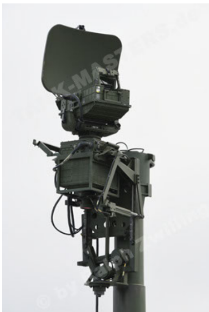
M113 G3 EFT GE A0 TrgFZG RATAAC-S (77).JPG