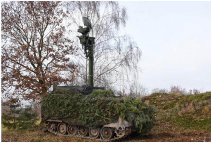
M113 G3 EFT GE A0 TrgFzg RATAAC-S (43).JPG