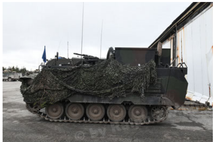
M113 G3 EFT GE A0 TrgFzg RATAAC-S (60).JPG