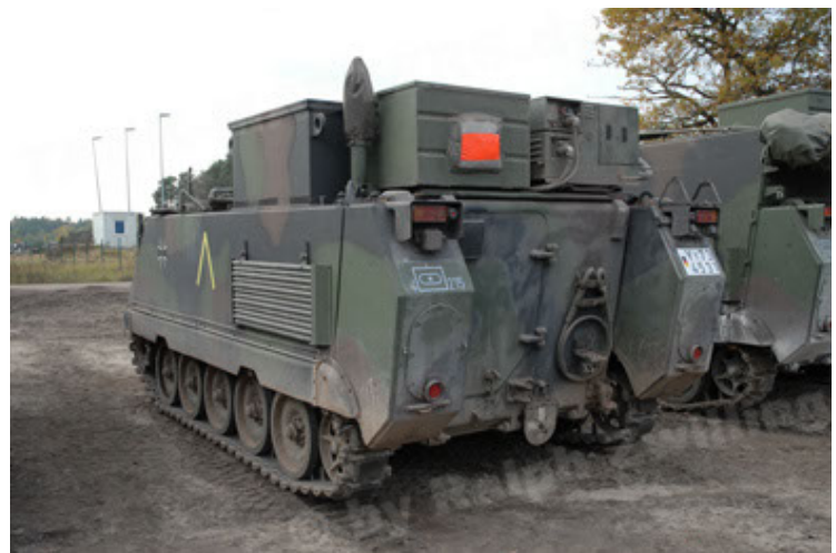
M113 G3 EFT GE A0 TrgFzg RATAAC-S (36).JPG