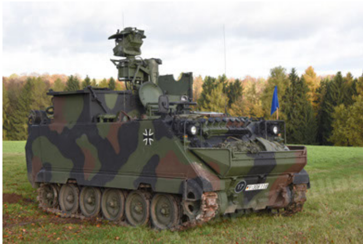
M113 G3 EFT GE A0 TrgFzg RATAAC-S (9).JPG