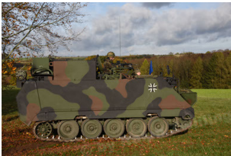
M113 G3 EFT GE A0 TrgFzg RATAAC-S (5).JPG