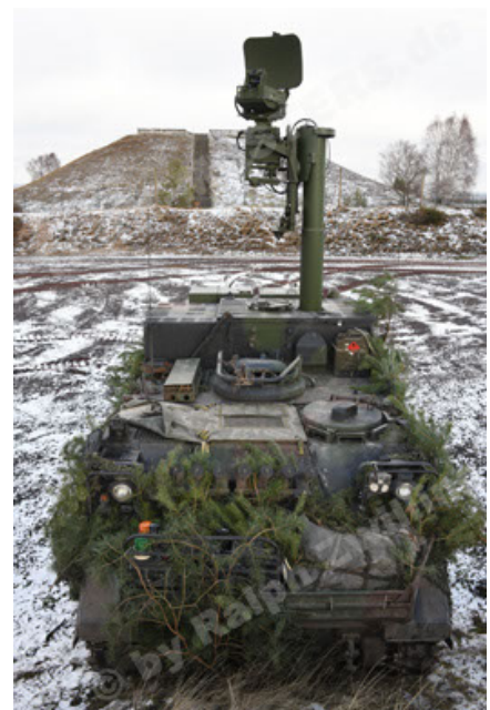
M113 G3 EFT GE A0 TrgFZG RATAAC-S (90).JPG