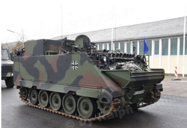
M113 G3 EFT GE A0 TrgFzg RATAAC-S (23).JPG