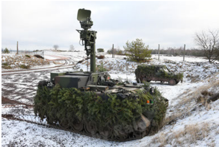
M113 G3 EFT GE A0 TrgFZG RATAAC-S (81).JPG