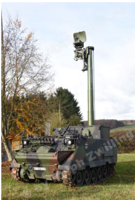
M113 G3 EFT GE A0 TrgFzg RATAAC-S (11).JPG