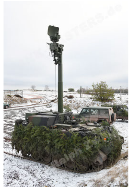
M113 G3 EFT GE A0 TrgFZG RATAAC-S (76).JPG