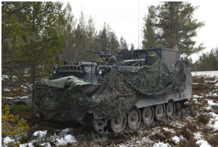
M113 G3 EFT GE A0 TrgFzg RATAAC-S (75).JPG