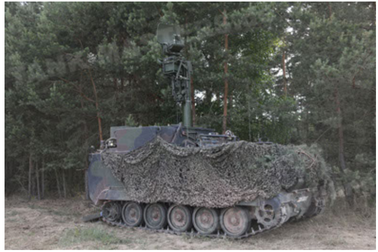
M113 G3 EFT GE A0 TrgFzg RATAAC-S (44).JPG