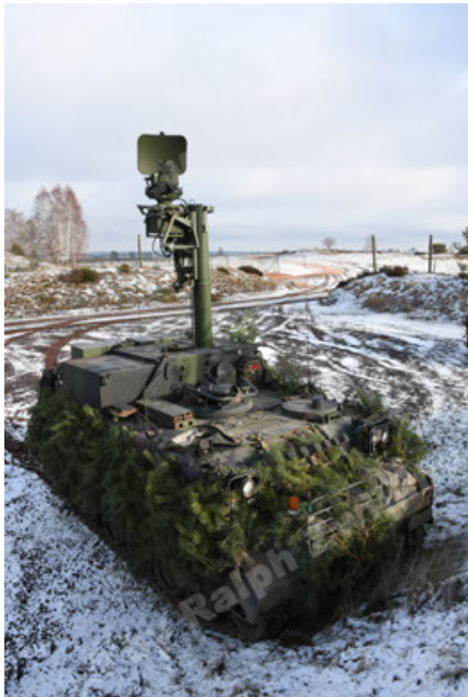
M113 G3 EFT GE A0 TrgFZG RATAAC-S (87).JPG