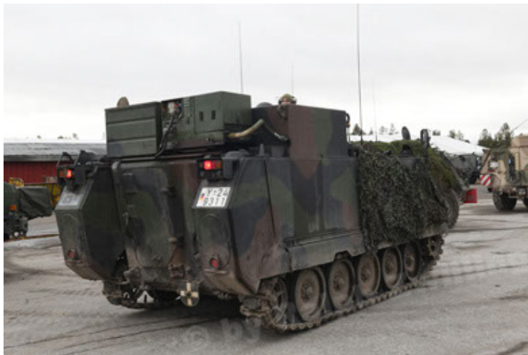
M113 G3 EFT GE A0 TrgFzg RATAAC-S (61).JPG