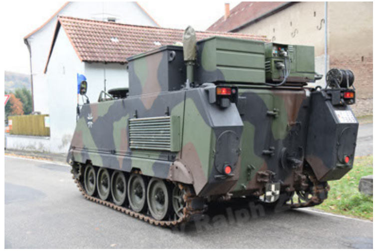
M113 G3 EFT GE A0 TrgFzg RATAAC-S (32).JPG