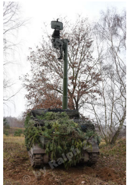
M113 G3 EFT GE A0 TrgFzg RATAAC-S (40).JPG