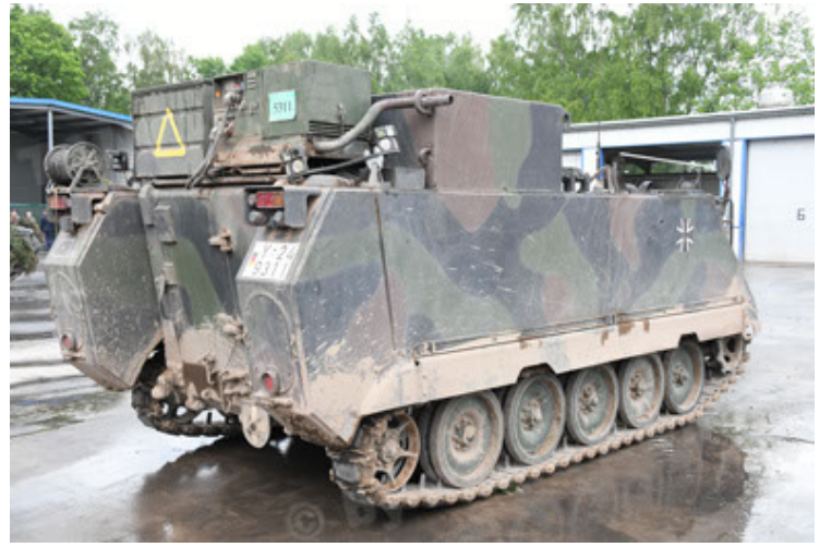
M113 G3 EFT GE A0 TrgFzg RATAAC-S (56).JPG