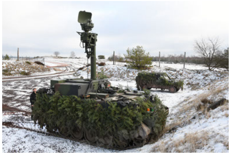
M113 G3 EFT GE A0 TrgFZG RATAAC-S (80).JPG