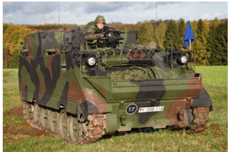
M113 G3 EFT GE A0 TrgFzg RATAAC-S (4).JPG