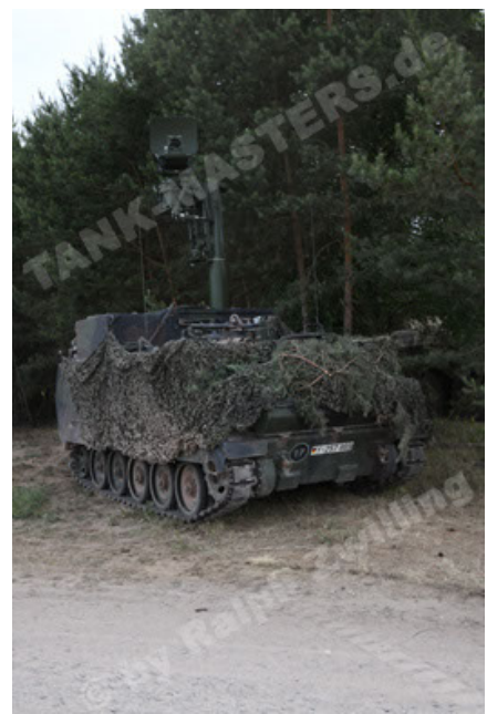
M113 G3 EFT GE A0 TrgFzg RATAAC-S (50).JPG