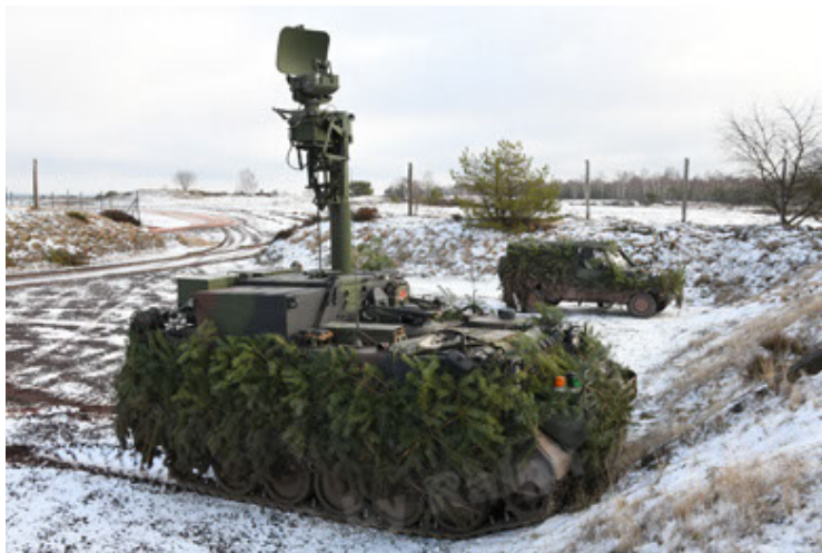
M113 G3 EFT GE A0 TrgFZG RATAAC-S (83).JPG