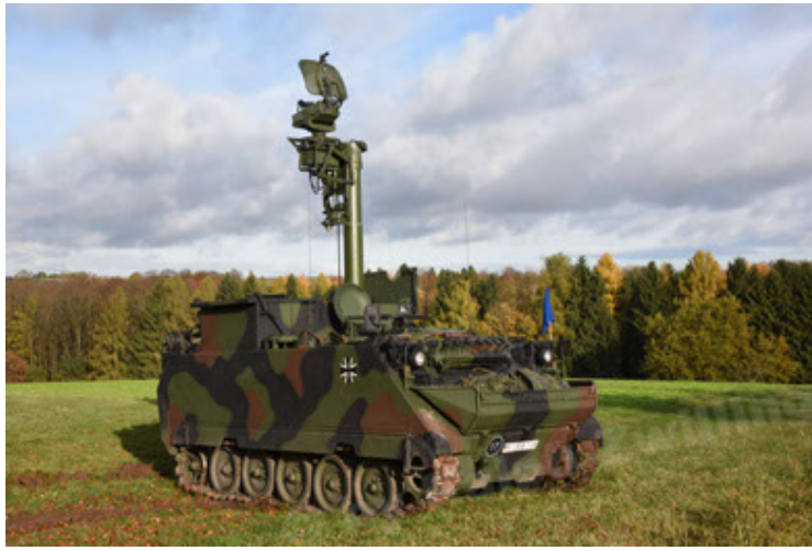
M113 G3 EFT GE A0 TrgFzg RATAAC-S (1).JPG