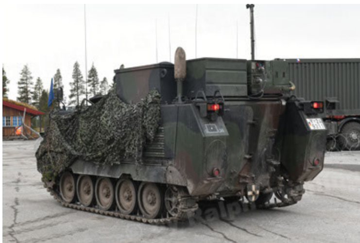
M113 G3 EFT GE A0 TrgFzg RATAAC-S (63).JPG