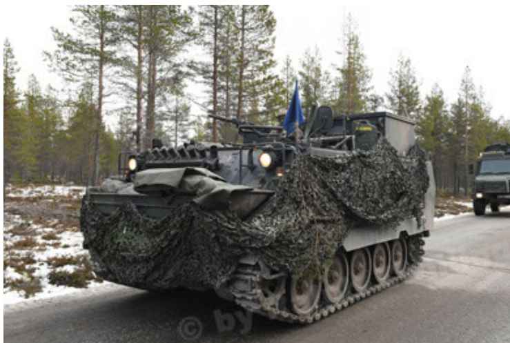
M113 G3 EFT GE A0 TrgFzg RATAAC-S (71).JPG