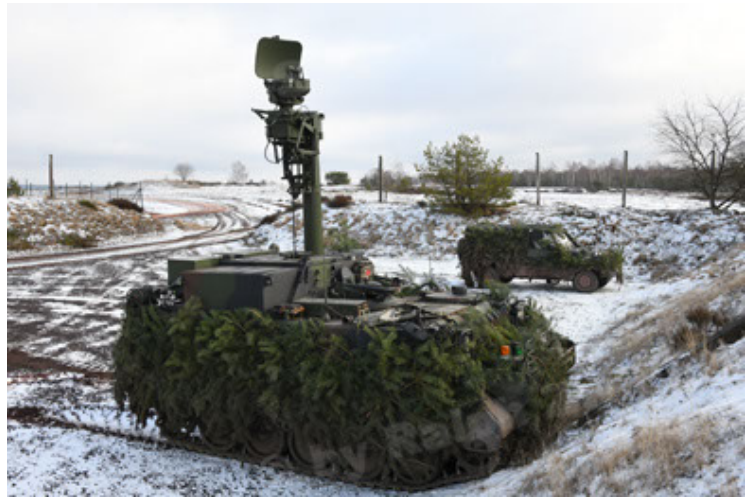
M113 G3 EFT GE A0 TrgFZG RATAAC-S (82).JPG