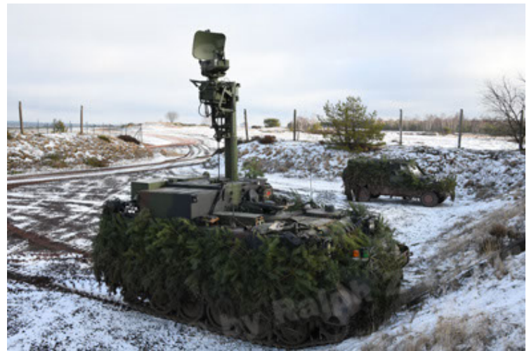
M113 G3 EFT GE A0 TrgFZG RATAAC-S (88).JPG