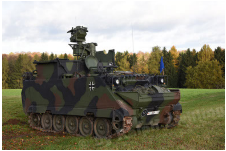
M113 G3 EFT GE A0 TrgFzg RATAAC-S (8).JPG