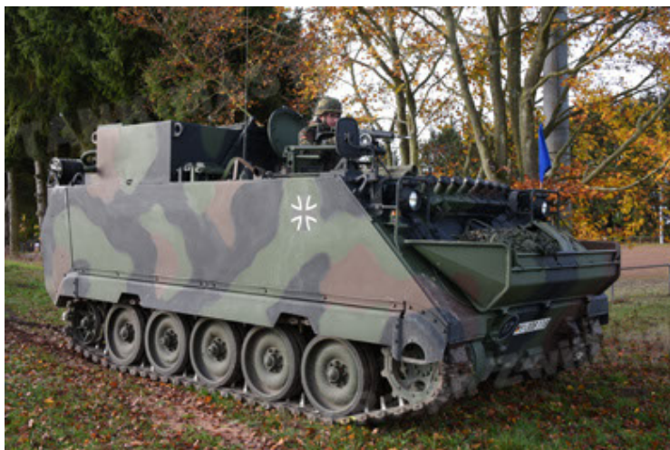
M113 G3 EFT GE A0 TrgFzg RATAAC-S (35).JPG