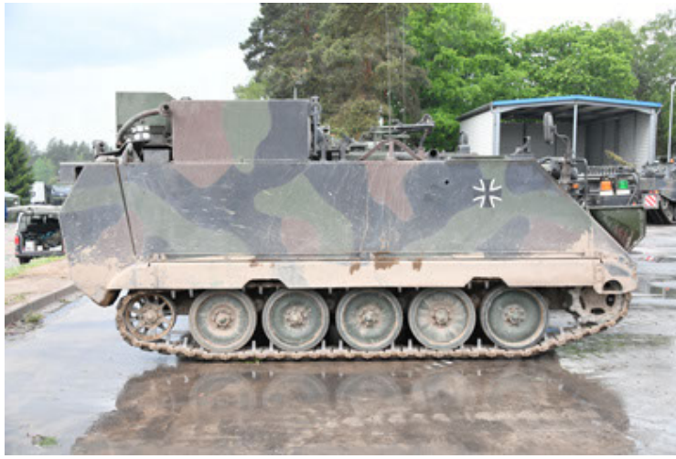
M113 G3 EFT GE A0 TrgFzg RATAAC-S (55).JPG