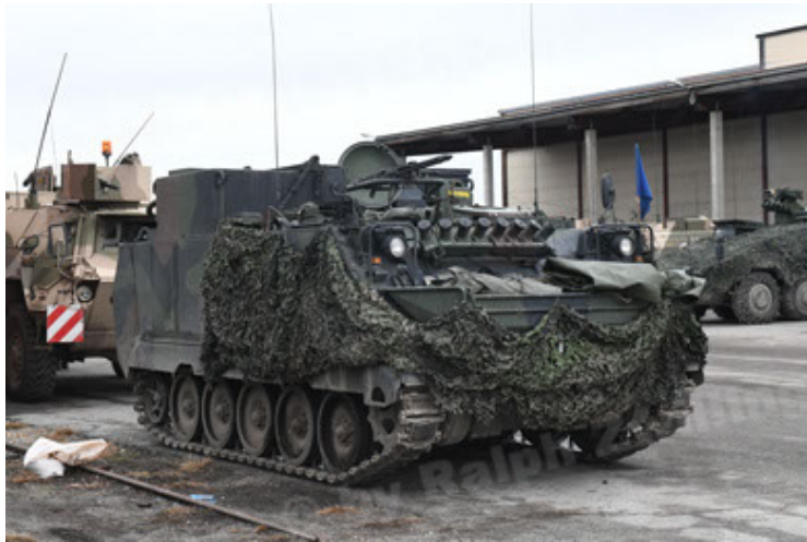
M113 G3 EFT GE A0 TrgFzg RATAAC-S (57).JPG