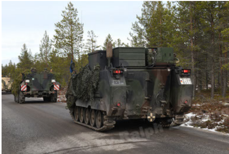
M113 G3 EFT GE A0 TrgFzg RATAAC-S (69).JPG