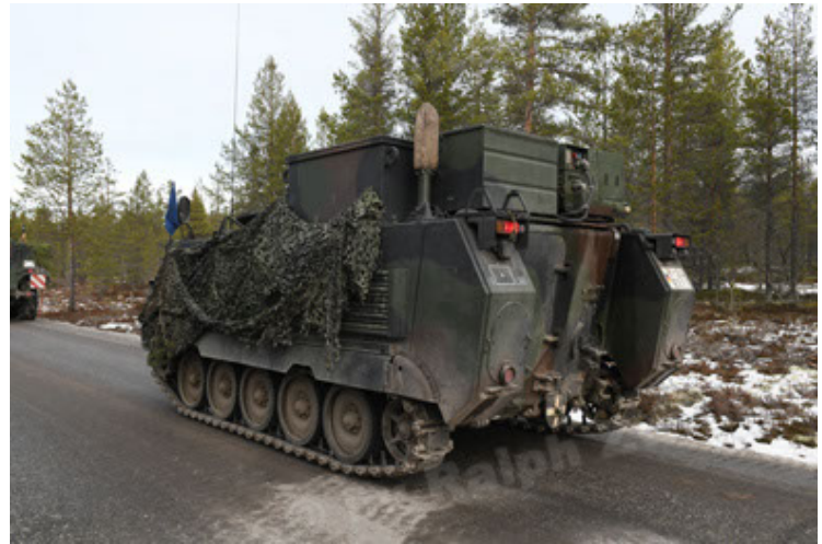
M113 G3 EFT GE A0 TrgFzg RATAAC-S (70).JPG