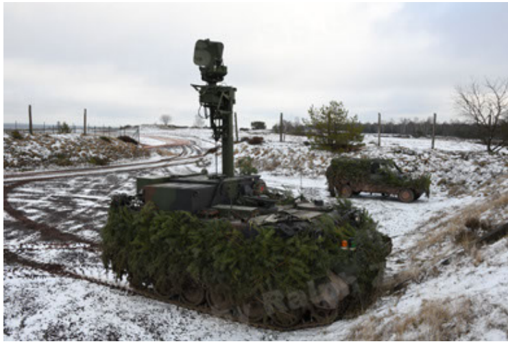
M113 G3 EFT GE A0 TrgFZG RATAAC-S (91).JPG