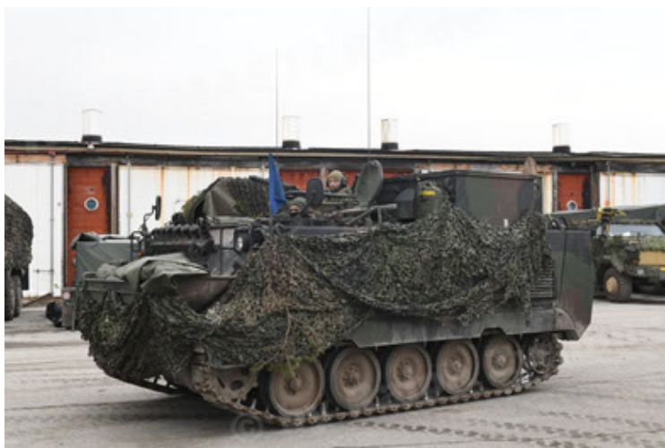
M113 G3 EFT GE A0 TrgFzg RATAAC-S (64).JPG