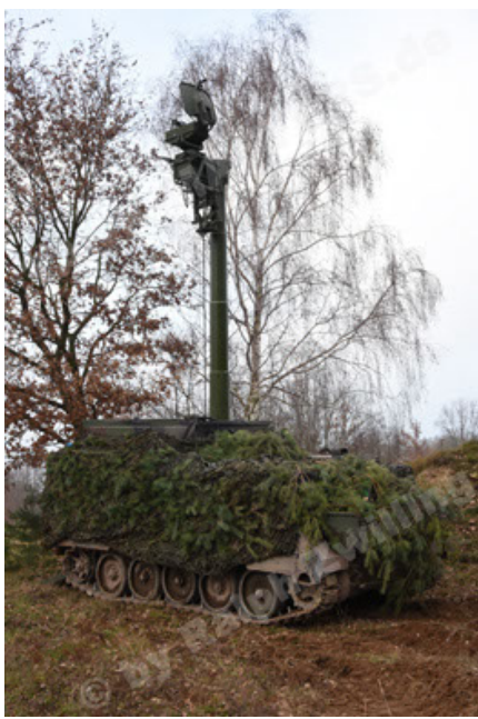
M113 G3 EFT GE A0 TrgFzg RATAAC-S (37).JPG