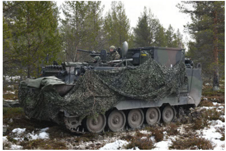
M113 G3 EFT GE A0 TrgFzg RATAAC-S (74).JPG