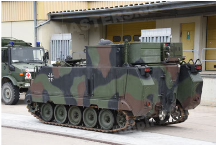
M113 G3 EFT GE A0 TrgFzg RATAAC-S (15).JPG