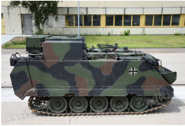
M113 G3 EFT GE A0 TrgFzg RATAAC-S (19).JPG