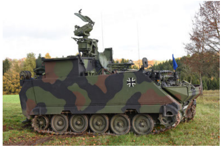
M113 G3 EFT GE A0 TrgFzg RATAAC-S (2).JPG