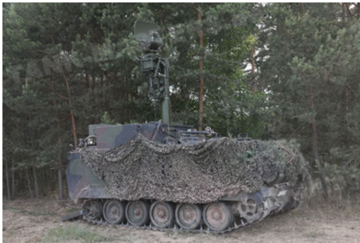
M113 G3 EFT GE A0 TrgFzg RATAAC-S (45).JPG