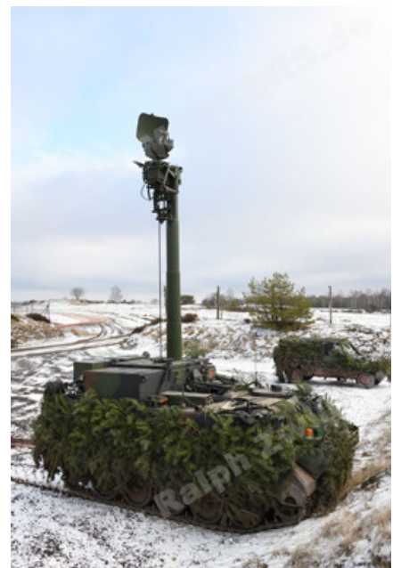
M113 G3 EFT GE A0 TrgFZG RATAAC-S (78).JPG