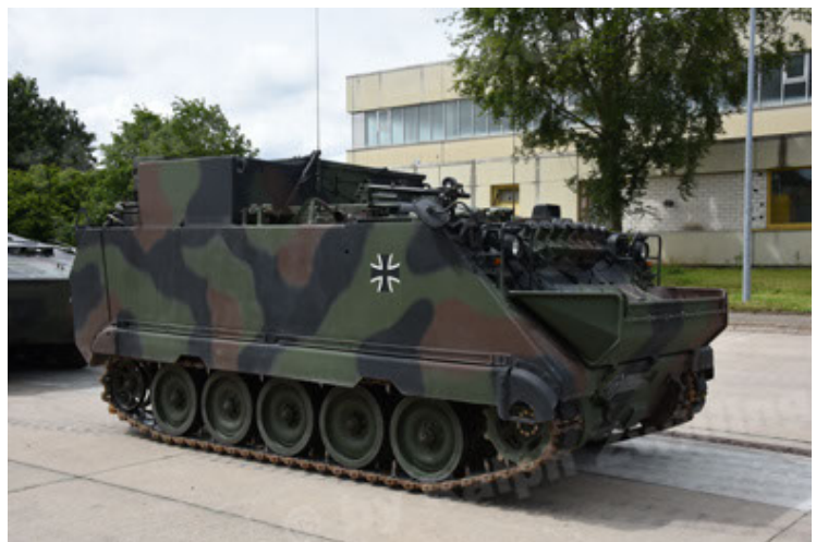
M113 G3 EFT GE A0 TrgFzg RATAAC-S (18).JPG