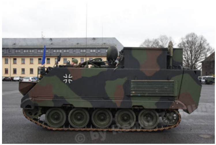
M113 G3 EFT GE A0 TrgFzg RATAAC-S (26).JPG