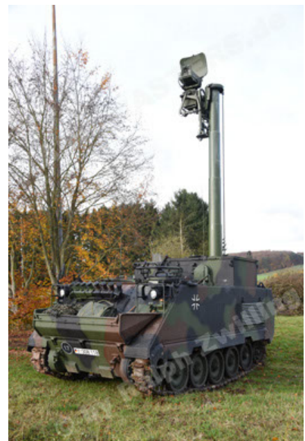
M113 G3 EFT GE A0 TrgFzg RATAAC-S (12).JPG