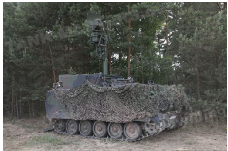
M113 G3 EFT GE A0 TrgFzg RATAAC-S (46).JPG