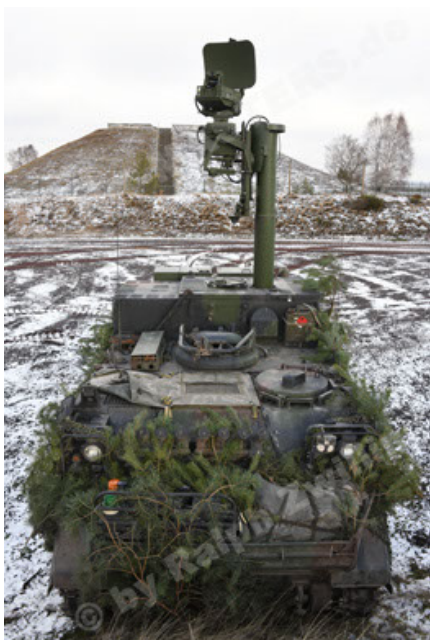
M113 G3 EFT GE A0 TrgFZG RATAAC-S (89).JPG