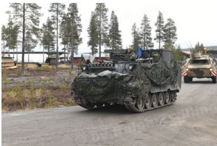
M113 G3 EFT GE A0 TrgFzg RATAAC-S (65).JPG