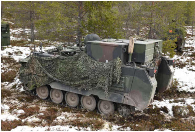
M113 G3 EFT GE A0 TrgFzg RATAAC-S (73).JPG