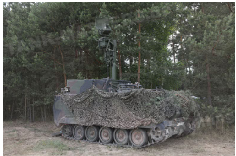
M113 G3 EFT GE A0 TrgFzg RATAAC-S (48).JPG