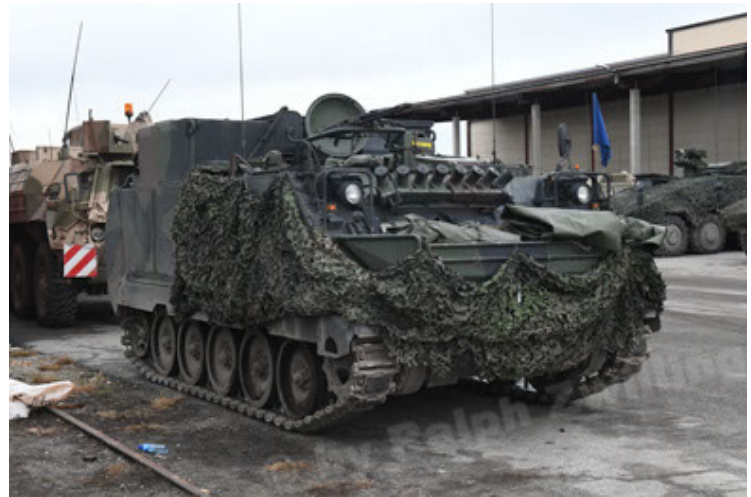
M113 G3 EFT GE A0 TrgFzg RATAAC-S (58).JPG