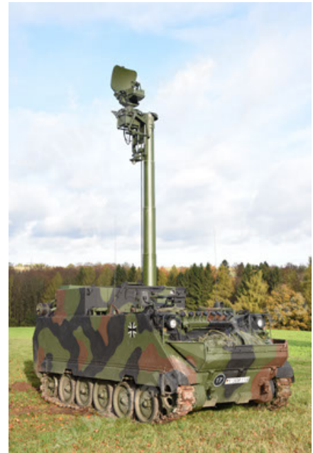
M113 G3 EFT GE A0 TrgFzg RATAAC-S (10).JPG