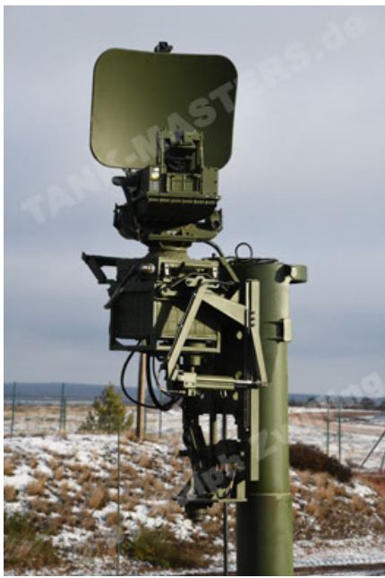
M113 G3 EFT GE A0 TrgFZG RATAAC-S (85).JPG