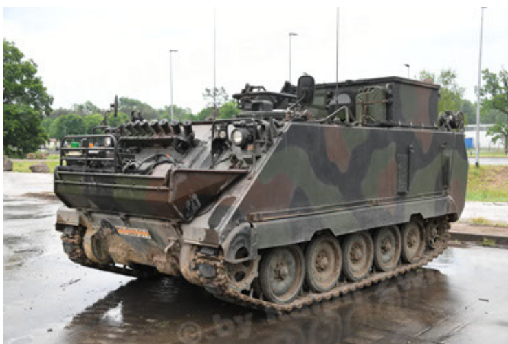
M113 G3 EFT GE A0 TrgFzg RATAAC-S (53).JPG