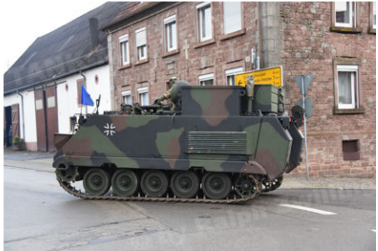
M113 G3 EFT GE A0 TrgFzg RATAAC-S (16).JPG