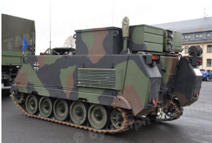
M113 G3 EFT GE A0 TrgFzg RATAAC-S (27).JPG