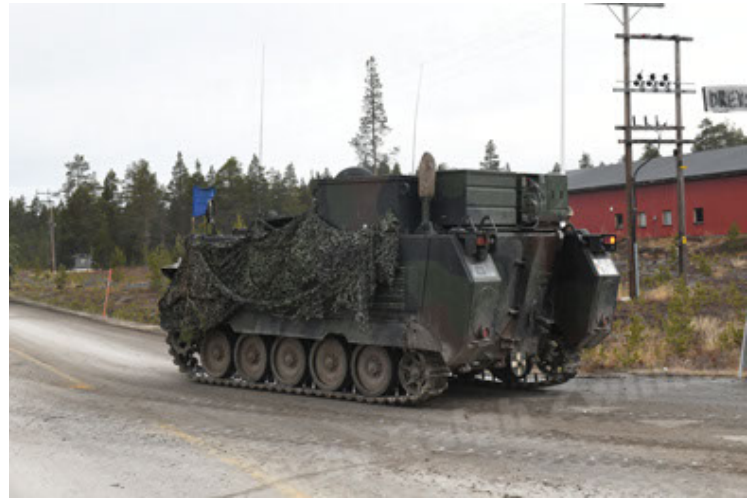
M113 G3 EFT GE A0 TrgFzg RATAAC-S (68).JPG