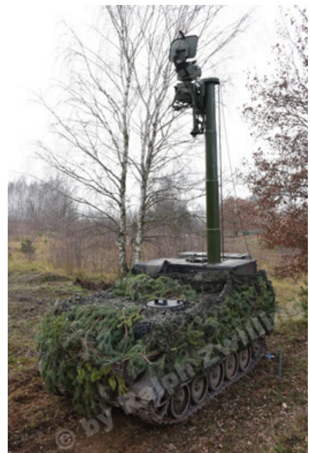
M113 G3 EFT GE A0 TrgFzg RATAAC-S (42).JPG