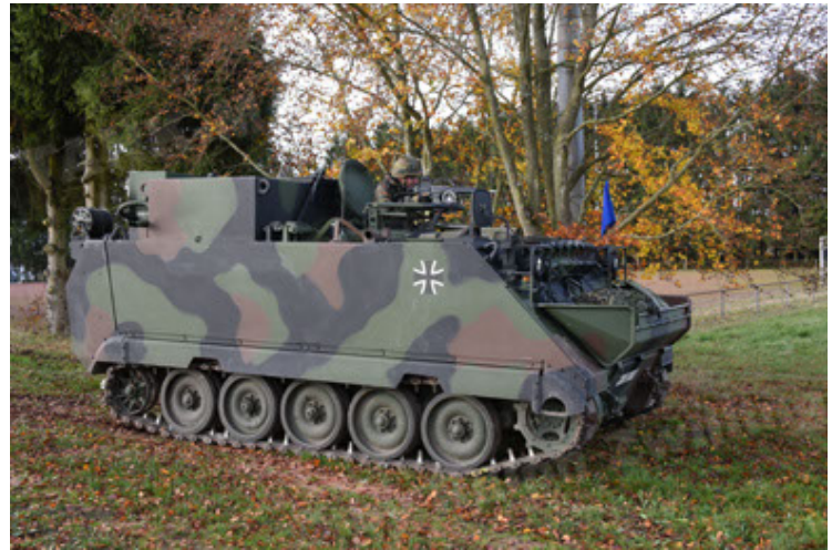
M113 G3 EFT GE A0 TrgFzg RATAAC-S (34).JPG