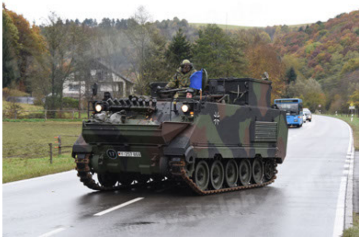
M113 G3 EFT GE A0 TrgFzg RATAAC-S (33).JPG