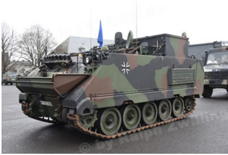
M113 G3 EFT GE A0 TrgFzg RATAAC-S (25).JPG