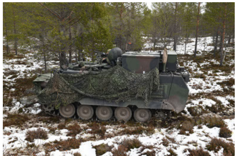
M113 G3 EFT GE A0 TrgFzg RATAAC-S (72).JPG