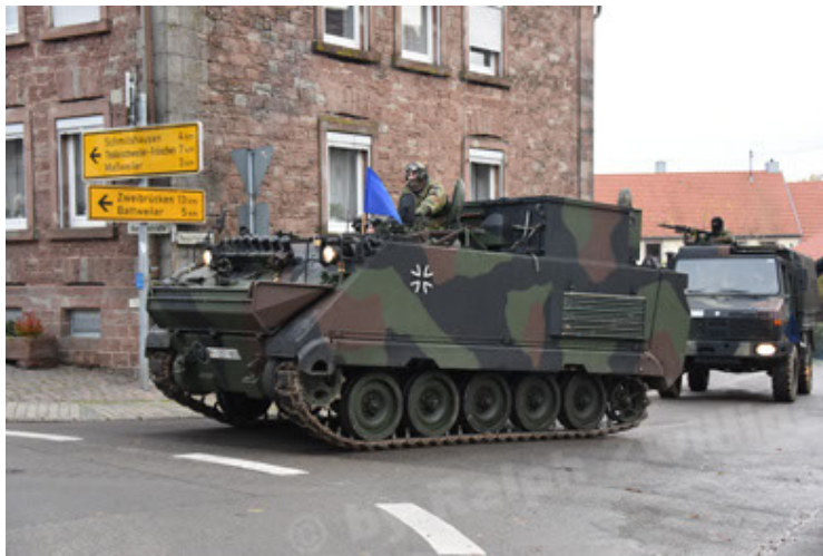
M113 G3 EFT GE A0 TrgFzg RATAAC-S (3).JPG