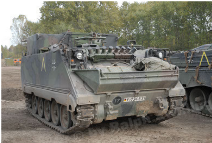
M113 G3 EFT GE A0 TrgFzg RATAAC-S (21).JPG