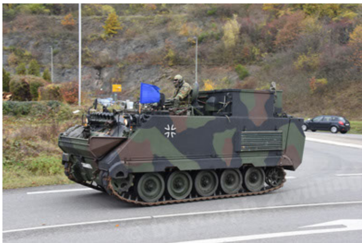
M113 G3 EFT GE A0 TrgFzg RATAAC-S (29).JPG