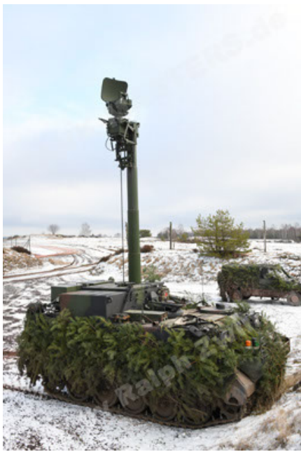
M113 G3 EFT GE A0 TrgFZG RATAAC-S (79).JPG