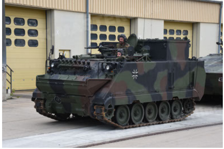
M113 G3 EFT GE A0 TrgFzg RATAAC-S (14).JPG