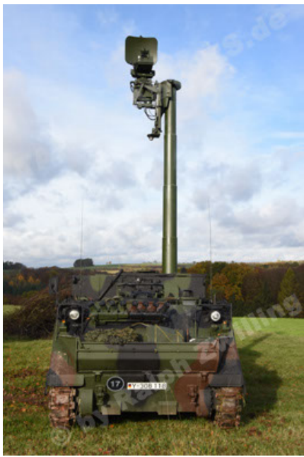
M113 G3 EFT GE A0 TrgFzg RATAAC-S (13).JPG