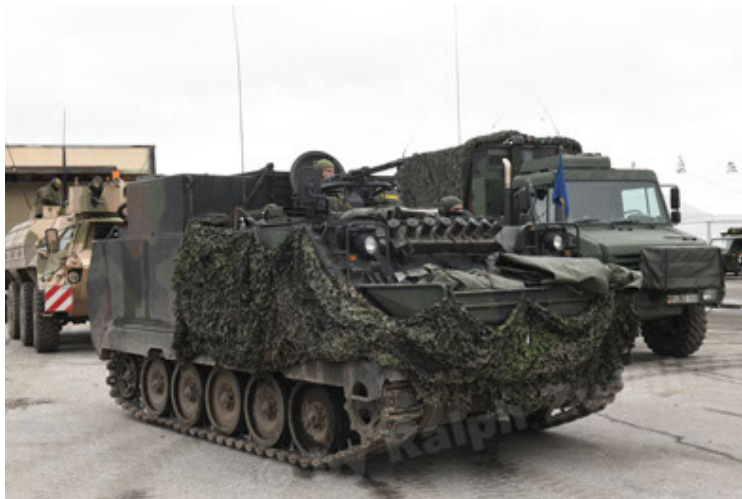
M113 G3 EFT GE A0 TrgFzg RATAAC-S (62).JPG