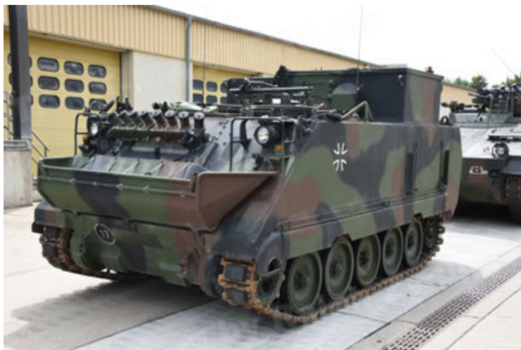
M113 G3 EFT GE A0 TrgFzg RATAAC-S (17).JPG