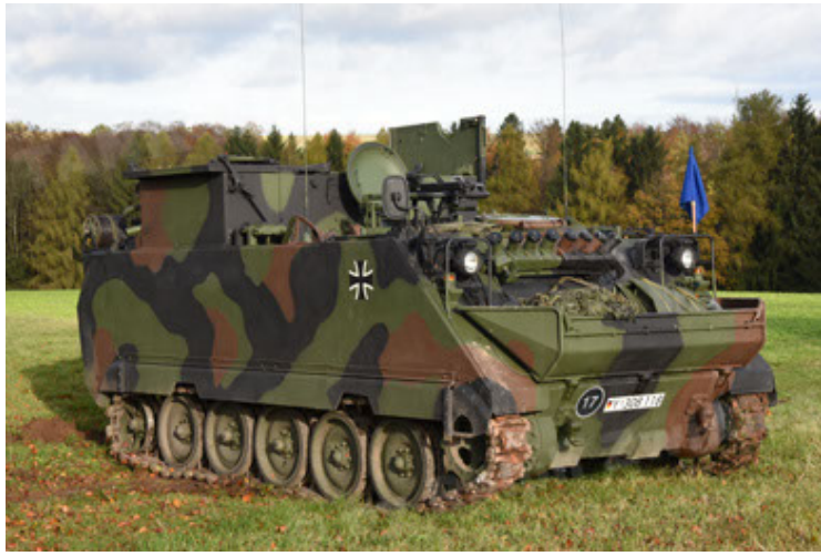
M113 G3 EFT GE A0 TrgFzg RATAAC-S (7).JPG